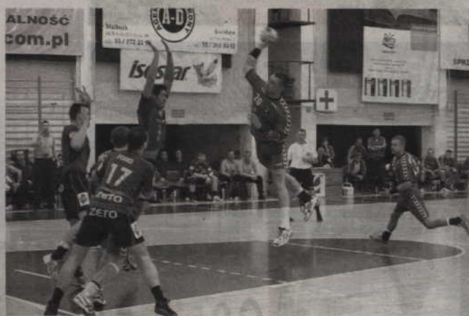
Niewiele zabrakło, a w meczu z Vive kwidzynianie wywalczyliby cenny punkt.

Do końca meczu trwał już wyrównany pojedynek, w którym