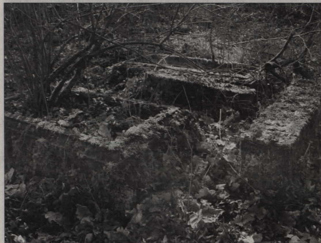
Wszystkie groby na terenie tego zapomnianego cmentarza zostały zdewastowane. Teren jest całkowicie zarośnięty.