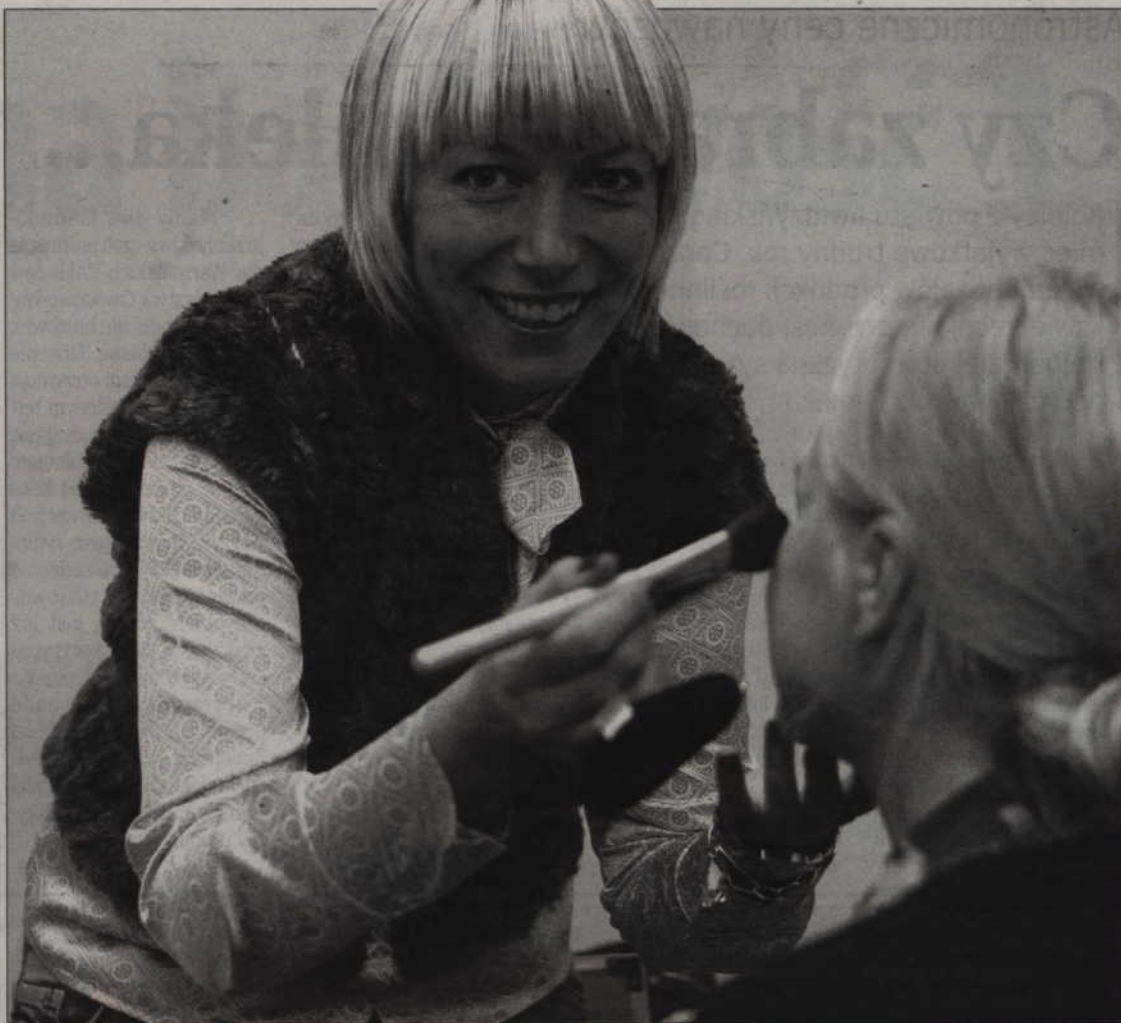
- Wiosna to ty urody rzadko występujący w naszym kraju - płowe włosy, jasna delikatna cera, często pokryta piegami - zauważa wizażystka Małgorzata Nowak.

Dla urody. Wizażystka radzi - jak się malować i ubierać