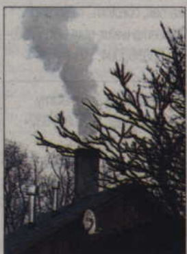
Z kominów wielu domów wciąż unosi się uciążliwy dym, szkodliwy i dla środowiska, i dla nas, ludzi.

Nawet podczas spalania niewielkiej ilości śmieci można wyczuć, że do atmosfery przedostają się szkodliwe związki - ostrzegają ekolodzy z Fundacji Nasza Ziemia. - A i to nie wszystko. Ten trujący dym zawiera jeszcze: dwutlenek siarki, chlorowodor, cyjanowodor, a także rakotwórcze związki zwane dioksynami i furanami. Spalając 1 kilogram odpadów z polichloru winylu PVC (butelki plastikowe, folie itp.) wytwarzamy aż 280 litrów gazowego chlorowodoru, który z parą wodną tworzy kwas solny. Trujemy siebie, trujemy ziemię w naszych ogrodach,