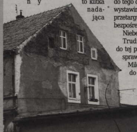
Kamienica przy ul. Zamkowa Góra ma dokładnie sto lat. Budynek wymaga remontu, jednak członkowie wspólnoty mieszkaniowej nie chcą inwestować - boją się, że wszystko zostanie zniszczone przez lokatorów lokalu socjalnego.

-Proszę postawić się w mojej sytuacji, jako współwłaściciela budynku. Przecież ten lokal socjalny