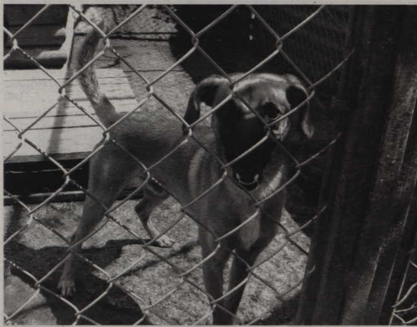
Pracownicy schroniska wylapali na kwidzyńskich ulicach psy biegające bez smyczy.