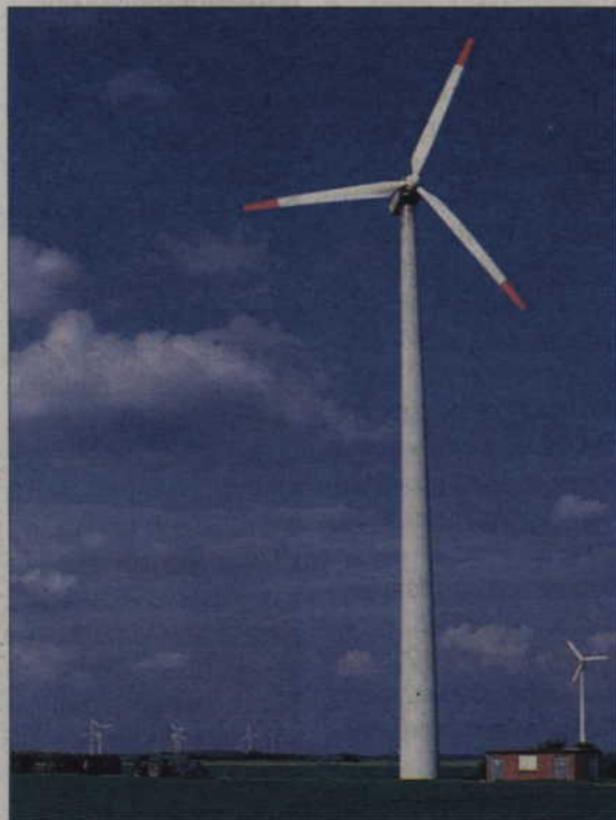
Turbiny wiatrowe wpisały się już w krajobraz wielu zakątków Pomorza.

zyskiwania energii z tego źródła. Ci twierdzą, że turbiny wiatrowe szpecą krajobraz. Inni, że obracające się ramiona zbyt hałasują. Jeszcze inni podnoszą argumenty, że wiatraki są zabójstwem dla ptaków.