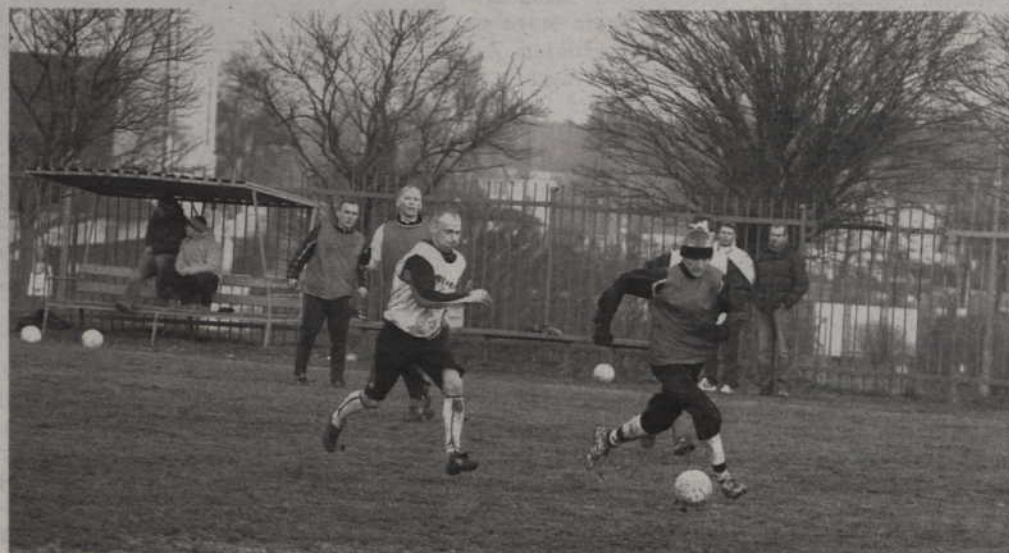
Przed kwidzyńskimi piłkarzami bardzo trudne zadanie utrzymania zespołu w III lidze.