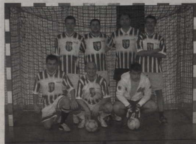
Mistrzowie rozgrywek - Tapet Boys.