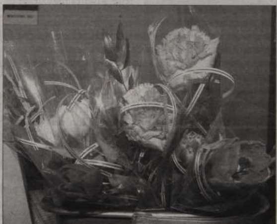
Z okazji Dnia Kobiet przygotowaliśmy dla pań goździki i tulipany.