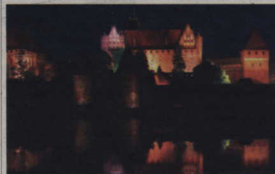
Zamek w Malborku, jedna z najcharakterystyczniejszych budowli Pomorza, 28 marca o godz. 20.30 na godzinę pograży się w ciemnościach.

Każdy, kto zechce zrobić coś dla naszej planety, może zarejestrować się na stronie internetowej: www.wwf.pl/godzina dla ziemi .