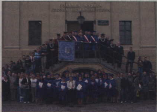
Gdańska Wyższa Szkoła Humanistyczna.

Indeks do Gdańskiej Wyższej Szkoły Humanistycznej w zasięgu ręki