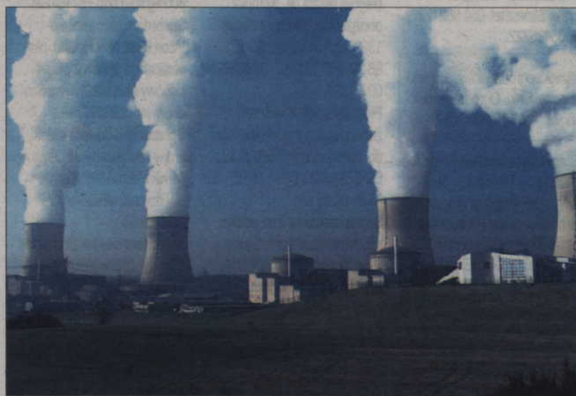
Elektrownie jądrowe są jak kociołek parowy: emitują do atmosfery parę wodną. Ale są także źródłem niebezpiecznych odpadów.

Polska do tej pory nie używa elektryczności z elektrowni jądrowych, choć na świecie pochodzi nich 17 proc. energii elektrycznej. Sektor jądrowy ma zaletę, bo mało zanieczyszcza atmosferę. Ale ma też wadę: jest źródłem niebezpiecznych odpadów.