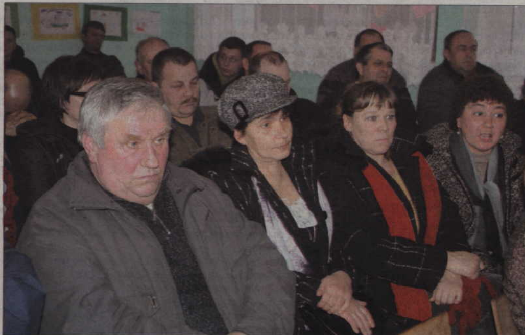
Mieszkańcy Kamionki i Baldramu Małego mają żal do samorządu powiatowego, że nie postarał się o pieniądze na remont drogi w ich wsi.