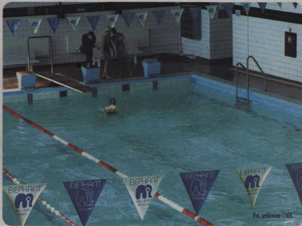
Kryta pływalnia czeka kapitalny remont. Trzeba wymienić instalację wentylacyjną.

Krytą pływalnię czeka kapitalny remont. Trzeba wymienić instalację wentylacyjną. Dotychczasowa w ogóle nie spełnia swojej roli. Wilgoć powoduje niszczenie ścian. Na czas remontu basen zostanie zamknięty. Władze miasta chcą jednak przeprowadzić wszystkie niezbędne prace w okresie wakacji, o ile będzie to możliwe ze względu na ich zakres.