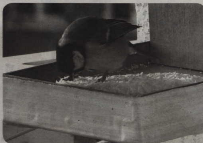
Samorząd zachęca do budowania budek lęgowych, które mogą stać się nowym domem dla skrzydlatych gości.

Władze miasta chcą, aby podczas tegorocznej wiosny i lata zamieszkało w Kwidzynie jak najwięcej ptaków. Samorząd zachęca do budowania budek lęgowych, które mogą stać nowym domem dla skrzydlatych gości, pojawiających się w ogródkach czy na balkonach.