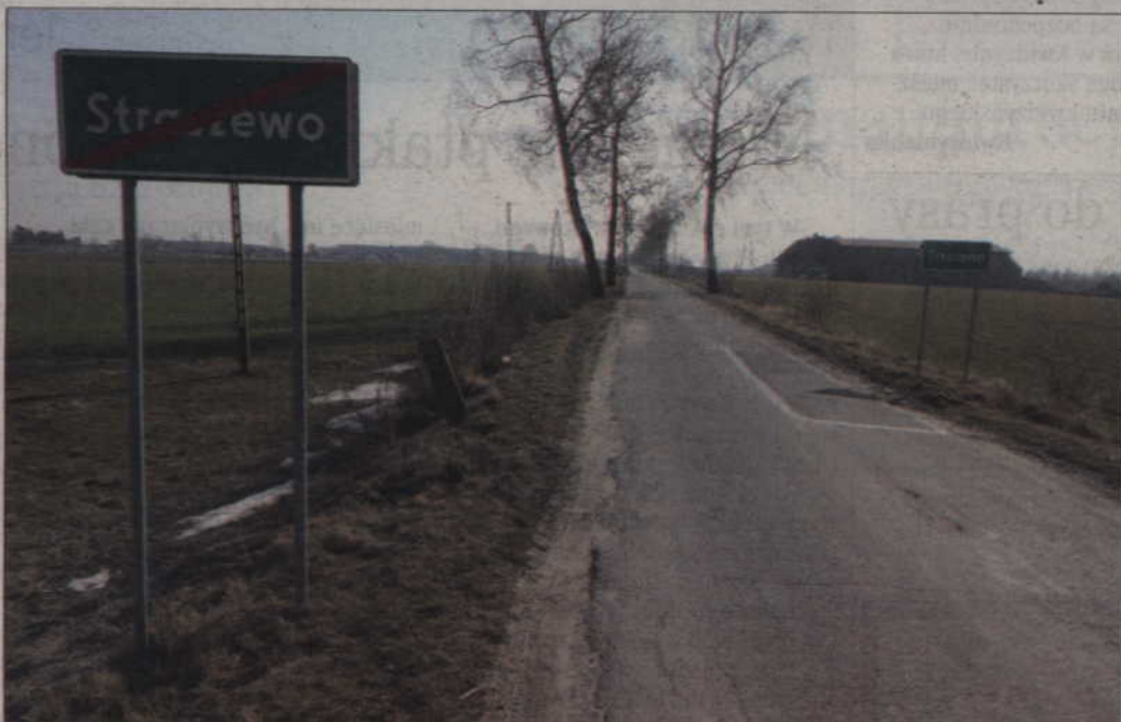
Unijne dotacje przeznaczone na modernizację odcinka drogi Pierzchowice - Dubiel (na zdjęciu), zdaniem protestujących mieszkańców, dużo mniej uczęszczanej i niebezpiecznej.