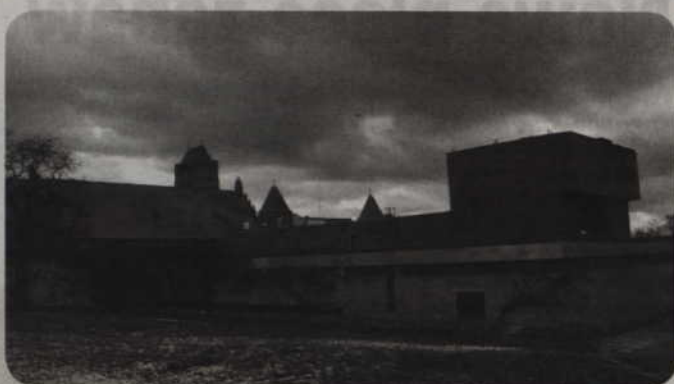
Dobiega końca przygotowanie koncepcji zmiany wyglądu gmachu teatru. Obiekt, którego budowa zakończyła się w latach 80. ubiegłego wieku, nie pasuje do otaczających go zabytków.

- Jeśli znajdziemy dodatkowe środki, zajmiemy się także elewacją budynku. Obecnie przygotowywana jest koncepcja. Zobaczmy, jakie będą propozycje zmiany wyglądu gmachu teatru. Wówczas zlecimy