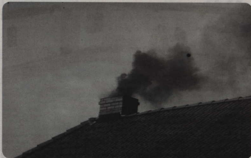
Miasto zachęca do zmiany sposobu ogrzewania na bardziej przyjazne dla środowiska. Wszyscy, którzy planują pozbycie się tradycyjnego pieca opalanego węglem i zastosowanie innego rodzaju ogrzewania, mogą liczyć na dotację.