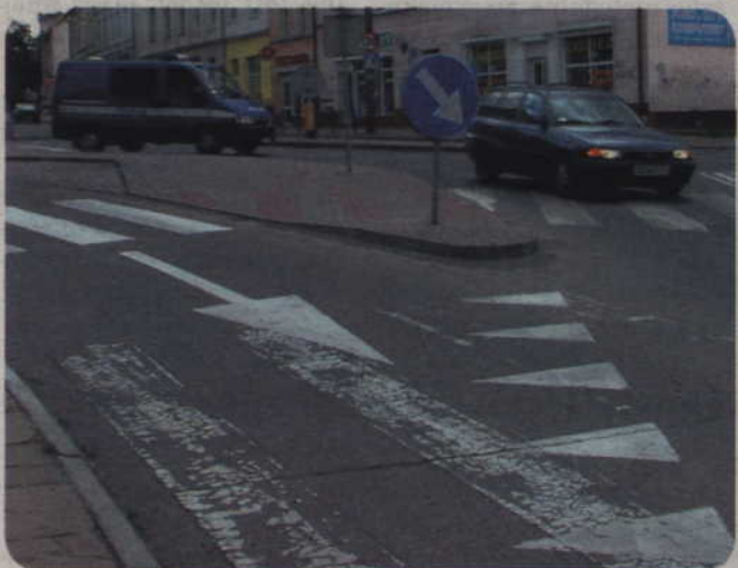
Trwają przygotowania do wykonania tzw. oznakowania poziomego wszystkich ulic w mieście. Prace zostaną wykonane po wiosennych remontach nawierzchni.

Władze miasta przygotowują wykonanie tzw. oznakowania poziomego wszystkich ulic w mieście. Prace zostaną wykonane po wiosennych remontach nawierzchni.