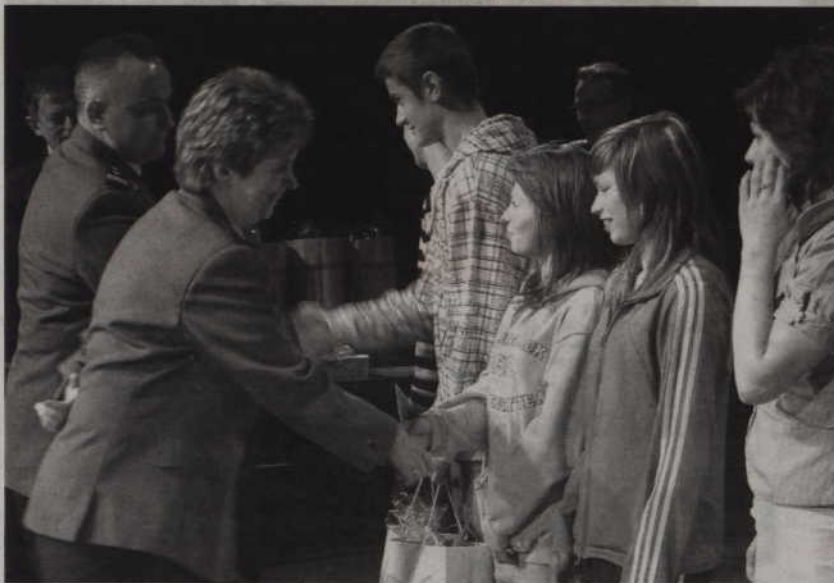
W przeglądzie zwyciężył zespół „ABC Teatru” z Ryjewa.