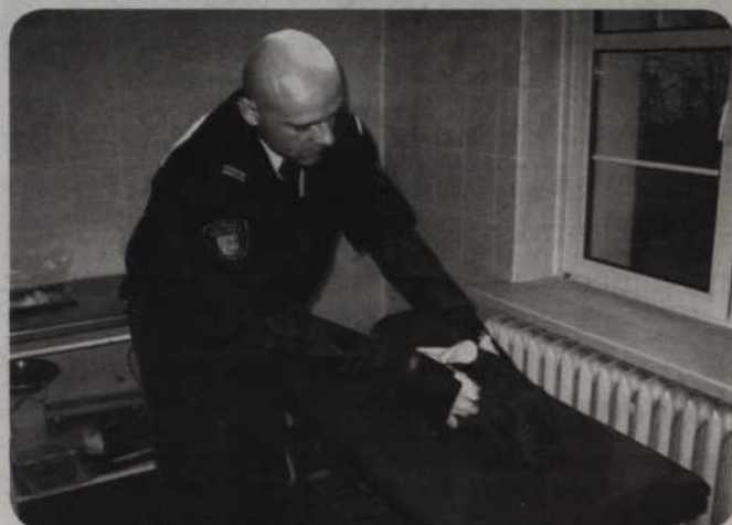
Straż przypomina o obowiązku zakładania kagańca oraz trzymania psa na uwięzi podczas spacerów.

Mieszkańcy, którzy mogli stracić swojego psa w wyniku akcji wyłapywania bezpańskich czworonogów mogą uzyskać informacje w Komendzie Straży Miejskiej w Kwidzynie pod nr telefonu 055 261 08 98 lub w schronisku dla zwierząt „Daniel” w Grudziądzu, tel. 0 56 46 46 100. Straż miejska przypomina, że wszystkie psy