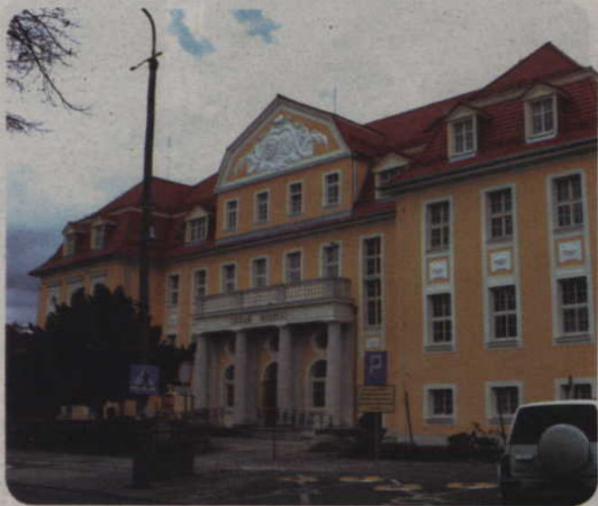
Trwają odbiory techniczne prac budowlanych w gmachu Urzędu Miejskiego przy ul. Warszawskiej. Wewnątrz prowadzone są jeszcze ostatnie prace instalacyjne związane z siecią komputerową.