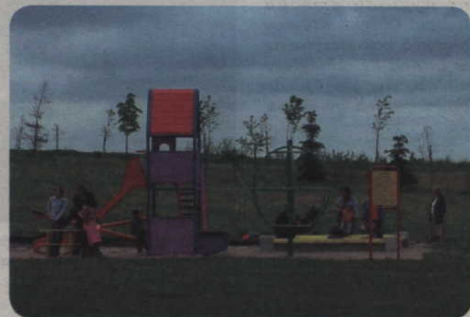
Nie ma jeszcze decyzji w sprawie lokalizacji nowych placów zabaw. Do Urzędu Miejskiego trafiło kilkanaście wniosków o wybudowanie miejsca, w którym mogą bezpiecznie bawić się dzieci.

Każdego roku w Kwidzynie urządzane są nowe miejsca, w których bezpiecznie mogą bawić się dzieci. W ubiegłym roku nowe place zabaw powstały za dawnym kinem „Tęcza”, w pobliżu ulic Tę-