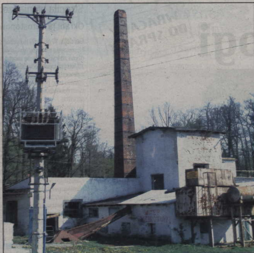
Samorządowcy powiatu kwidzyńskiego mają kłopot, budynek gorzelnia jest bardziej zniszczony, niż sądzili. O siedzibę tam zabiegają m.in. organizacje turystyczne.

Samorząd powiatu przejął nieruchomość nieodpłatnie od Agencji Nieruchomości Rolnych w ubiegłym roku. (jk)