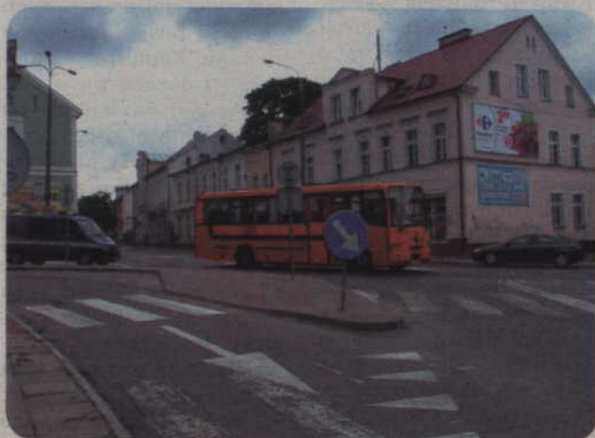
Gotowa jest koncepcja budowy nowego ronda u zbiegu ulic Batalionów Chłopskich i Chopina. Przygotowane zostały cztery warianty.

W tym roku wybudowane zostało już jedno rondo. Powstało ono na drodze krajowej z Kwidzyna do Grudziądza. Ułatwia ono dojazd i wyjazd z zakładów znajdujących się przy drodze, w tym firmy Jabil.