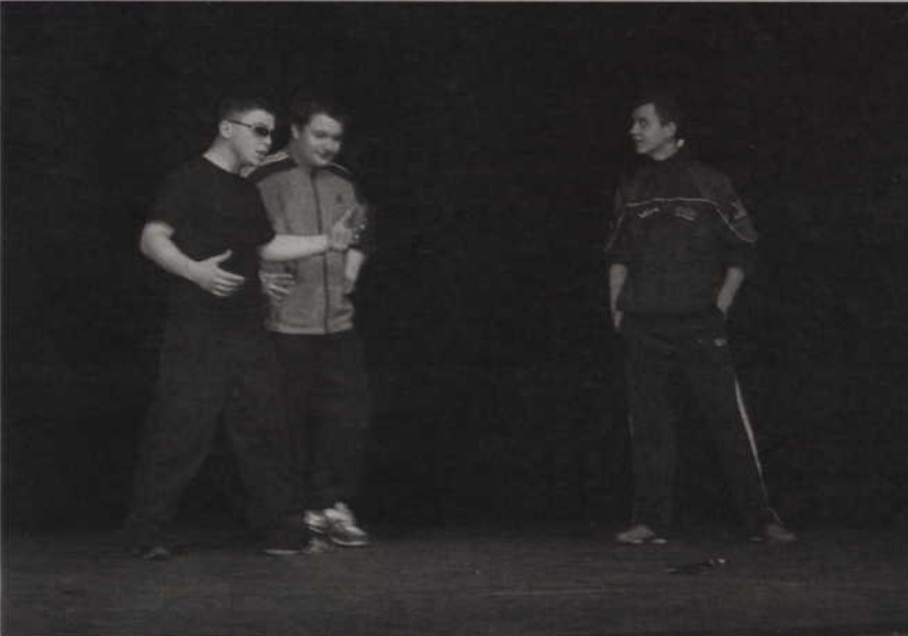
W przeglądzie wzięło udział siedem grup teatralnych ze szkół powiatu kwidzyńskiego.