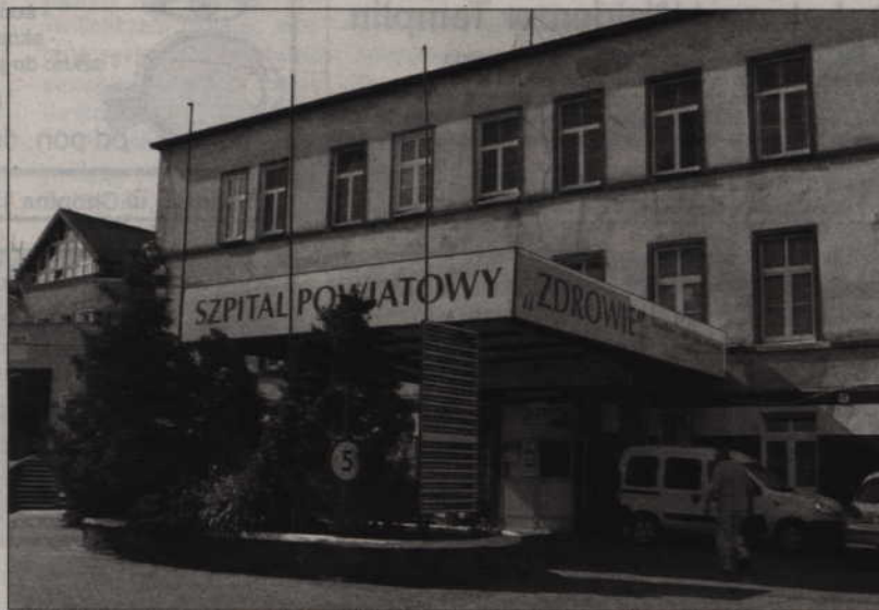
Trwają wstępne rozmowy z firmą, która chce kupić udziały w spółce Zdrowie.

Druga firma zgłosiła chęć nabycia udziałów w spółce Zdrowie zarządzającej kwidzyńskim szpitalem od samorządu powiatowego. Samorząd posiada większość udziałów w spółce i kolejny rok szuka inwestora strategicznego.