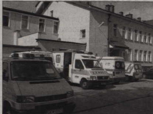
2008 rok spółka Zdrowie zarządzająca kwidzyńskim szpitalem zakończyła zyskiem ponad 750 tys. zł.

Andrzej Rozmus przypomina, że w 2004 r. rada powiatu przyjęła strategię