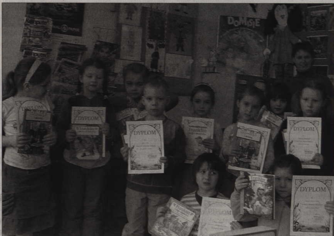
W konkursie wzięły udział dzieci z kwidzyńskiego przedszkola Radość.