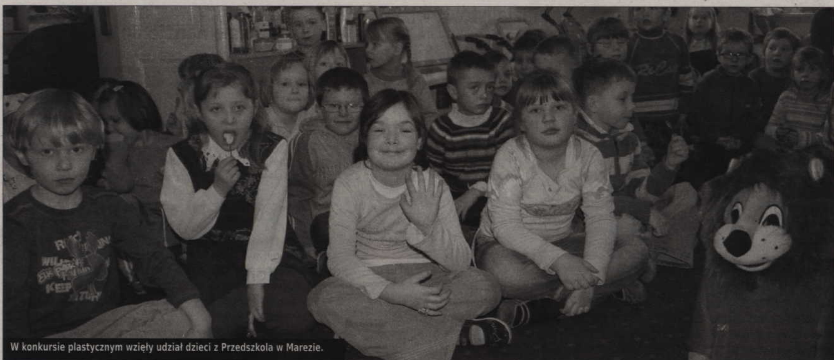
W konkursie plastycznym wzięły udział dzieci z Przedszkola w Marezie.