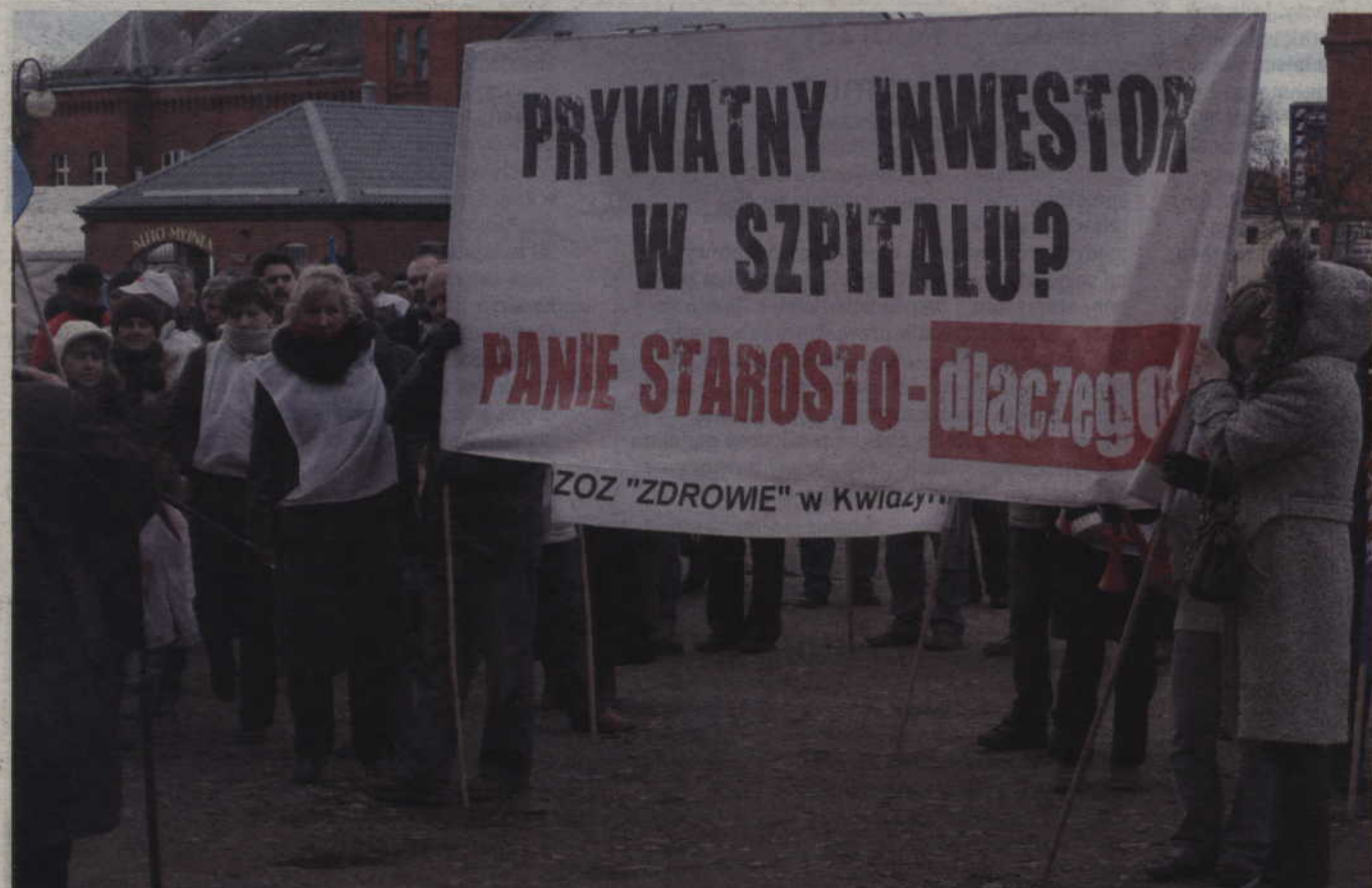
Sprzedazy udziałów spółki zdrowie boją się przede wszystkim pracownicy szpitala, którzy protestowali przeciwko temu na ulicach.

KWIDZYN. Na specjalnie zwołanej w tym celu sesji rady powiatu dyskutowano o przyszłości kwidzyńskiego szpitala, a o konkretnie o sprzedaż części udziałów spółki Zdrowie prywatnej firmie. Ta sprawa budzi niepokój mieszkańców i pracowników placówki, którzy niedawno m.in. w obronie szpitala (swoich miejsca pracy i bezpieczeństwa pacjentów) protestowali na ulicach miasta. Po ich stronie stanęli radni PiS, którzy poprosili o wsparcie pomorskich parlamentarzystów. Na sesji pojawili się: Jolanta Szczypińska, Tadeusz Cymański i były minister zdrowia Bolesław