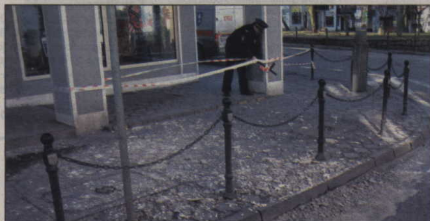
Wichura uszkodziła elewację budynku u zbiegu ulic Braterstwa Narodów i Słowiańskiej.