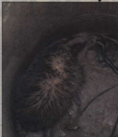
Do studzienki kanalizacyjnej na ul. Toruńskiej wpadł borsuk. Gdyby nie pomoc strażników miejskich, zwierzę by nie przeżyło. Funkcjonariusze wyciągnęli je z głębokiej na dwa metry pułapki i wypuścili na wolność.