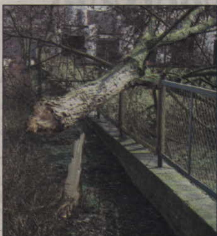
Porywisty wiatr połamał drzewo przy ul. Kamiennej.