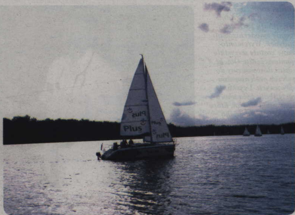
Wakacje to czas wypoczynku, dlatego spędzimy je bezpiecznie.

Policja radzi, aby podczas letniego wypoczynku nie zapominać o podstawowych zasadach bezpieczeństwa. Zwłaszcza młodzież sięga wówczas po środki odurzające, uważając, że w ten sposób będzie bawiła się lepiej. Pod wpływem alkoholu lub narkotyków rośnie ryzyko przypadkowych kontaktów seksualnych. Nie myśli się wtedy o zabezpieczeniu się, o skutkach zdrowotnych, urazach psychicznych ani o tym, że można przedwcześnie zostać rodzicem. Niebezpieczna jest jazda samochodem pod wpływem jakichkolwiek narkotyków.