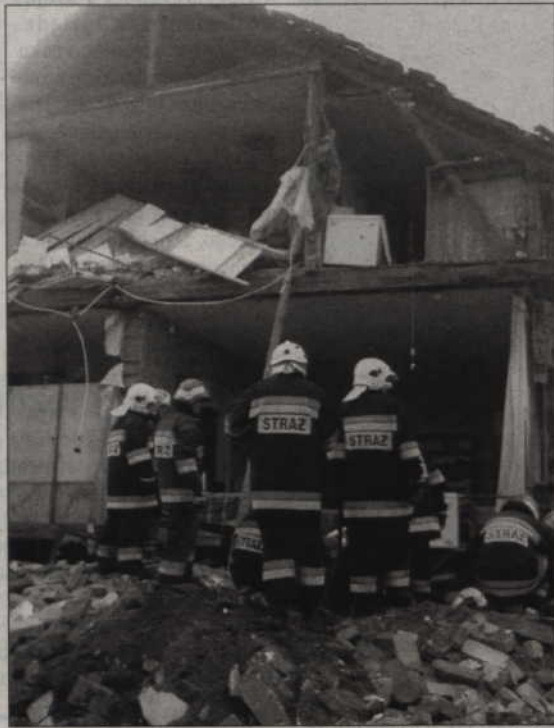
Zawalona ściana przygniotła mężczyznę, który przez godzinę tkwił pod gruzami w wykopie. Na zdjęciu: moment wydobywania przysypanego robotnika.

Nieprawidłowości podczas budowy to prawdopodobna przyczyną zawalenia się ściany budynku przy ul. Żwirowej. Nadal trwa badanie okoliczności wypadku, który wydarzył się przed świętami.