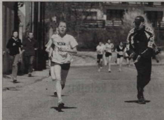
Trenerzy zagrzewali zawodniczki to większego wysiłku.