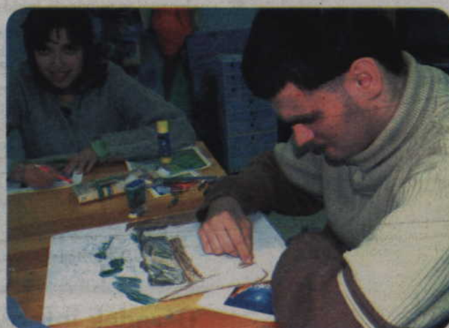
Zajęcia prowadzone są w pracowniach terapii życia codziennego, stolarskiej, ceramicznej, plastycznej, komputerowej, wiklinarskiej, redakcyjnej i ogrodniczo-gospodarczej.

formy rehabilitacji medycznej: kinezyterapia (obejmuje między innymi ćwiczenia gimnastyczne i różne formy czynnego wypoczynku i relaksu) i fizykoterapia (elektroterapia, termoterapia, światłolecznictwo i ultradźwięki, magneto-