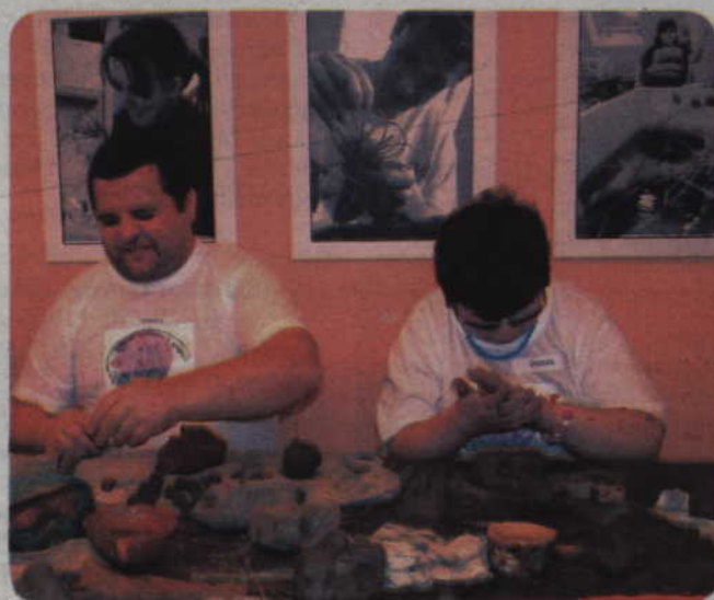
Uczestnikami warsztatu mogą zostać osoby niepełnosprawne posiadające znaczny lub umiarkowany stopień niepełnosprawności.