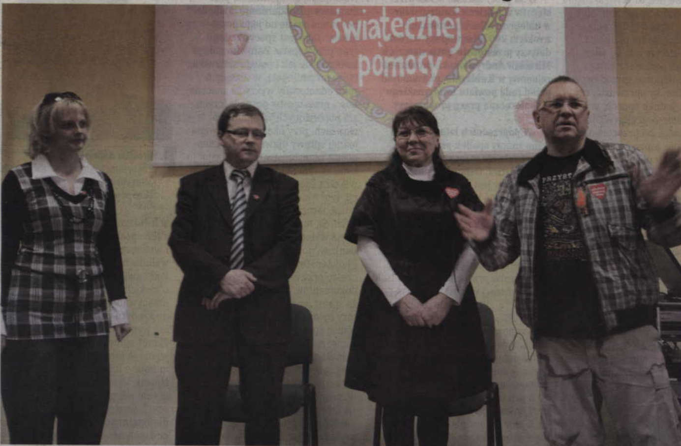
Jurek Owsiak i organizatorzy kwidzyńskiego finału Wielkiej Orkiestry.