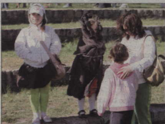
Jak widać na zdjęciu niektórym małym wykonawcom było tego dnia bardzo zimno.