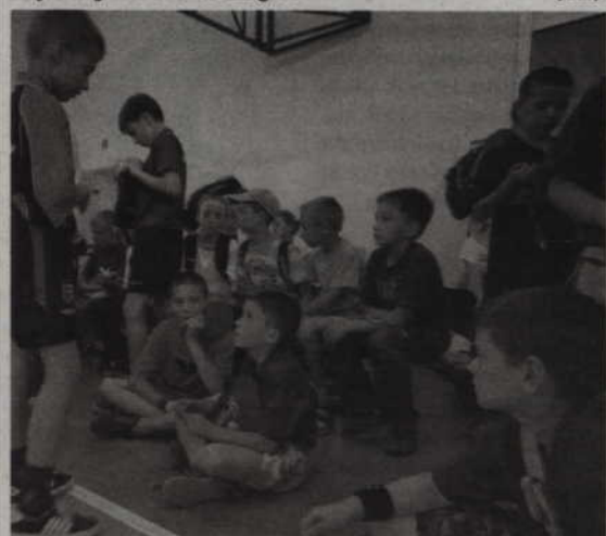
Młodzi zawodnicy od lat licznie uczestniczą w tenisowych turniejach Grand Prix.

-Jako organizatorów cieszy nas bardzo wzrost popularności turniejów wśród dzieci i młodzieży - dodaje M. Schaefer. -Mamy nadzieję, że czas spędzony wśród niebieskich i zielonych stołów z celuloidową piłeczką przyczyni się do zachowania zdrowia i sprawności fizycznej na bardzo długo. (fox)