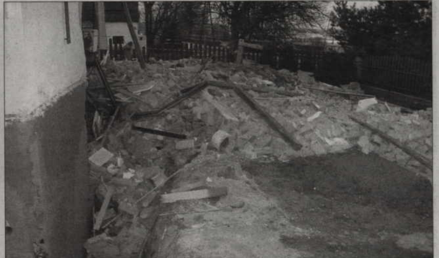
Zdaniem strażaków, przysypany mężczyzna nie przeżyłby, gdyby w momencie zawalenia się ściany znajdował się poza wykopem, tuż pod budynkiem. Na zdjęciu: Gruzy, pod którymi znajduje się robotnik.

cały odgruzowany. Oczywiście cały czas obawialiśmy się dalszego zawalenia konstrukcji, ale nic takiego się nie stało. Poszkodowanego udało się uwolnić i, jak się okazało, skończyło się tylko