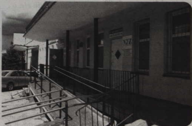
Zanim rozpoczęli ubieganie się o przyznanie certyfikatu ISO dotyczącego jakości zarządzania, gruntownie zmodernizowali budynek. Obiekt dostosowany został do potrzeb osób niepełnosprawnych.