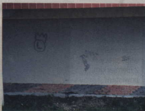
Za zniszczenie tej ściany młodzi ludzie odpowiedzą przed sądem rodzinnym.