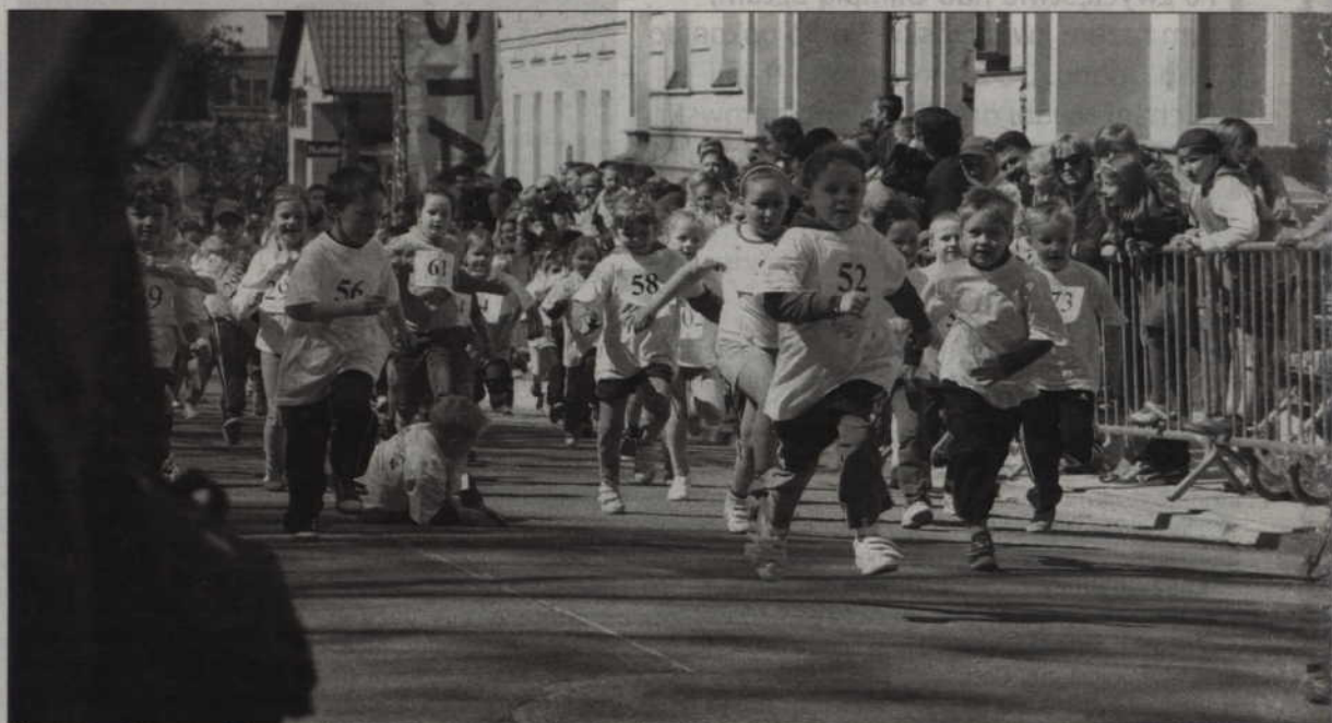
W emocjonującym wyścigu przedszkolaków wystartowało 96 małych lekkoatletów.

- Zwycięzca nie jest zaskoczeniem, bo to znany