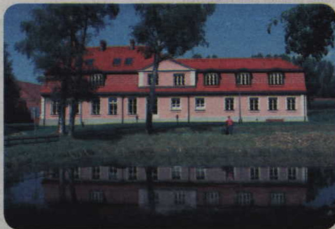
Warsztat Terapii Zajęciowej powstał w październiku 1993 roku przy Domu Pomocy Społecznej w Kwidzynie. Od stycznia 2004 roku prowadzi go Fundacja „Misericordia” w Kwidzynie, w zabytkowym dworku w Górkach. Na zdjęciu: praca wykonana przez niepełnosprawnych uczestników.

Warsztat Terapii Zajęciowej powstał w październiku 1993 roku przy Domu Pomocy Społecznej w Kwidzynie. Od pierwszego stycznia 2004 roku prowadzi go Fundacja „Misericordia” w Kwidzynie, w zabytkowym dworku w Górkach. Zajęcia prowadzone są w pracowniach terapii życia codziennego, stolarskiej, ceramicznej, plastycznej, komputerowej, wiklinarskiej, redakcyjnej i ogrodniczo-gospodarczej. Podczas zajęć rozwijane są między innymi psychofizyczne sprawności niezbędne w pracy, podstawowe, a także specjalistyczne umiejętności zawodowe. Umożliwiają one podjęcie pracy zarobkowej lub szkolenia zawodowego. Wobec wszystkich uczestników zajęć terapeutycznych stosowane są dwie