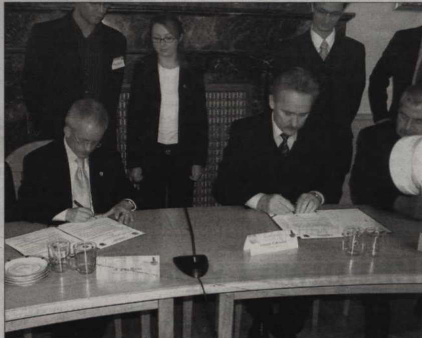
Umowę partnerską pomiędzy powiatami Osterholz i kwidzyńskim podpisano w 2006 roku.

POWIAT. - Chcemy, żeby przedstawiciele naszych służb odpowiedzialnych za bezpieczeństwo odwiedzili Osterholz i na miejscu zapoznali się z funkcjonującymi tam rozwiązaniami. Warto podpatrzeć jak działa tam system zarządzania kryzysowego. Jest odmienny od naszego. Nie ma tam zawodowej