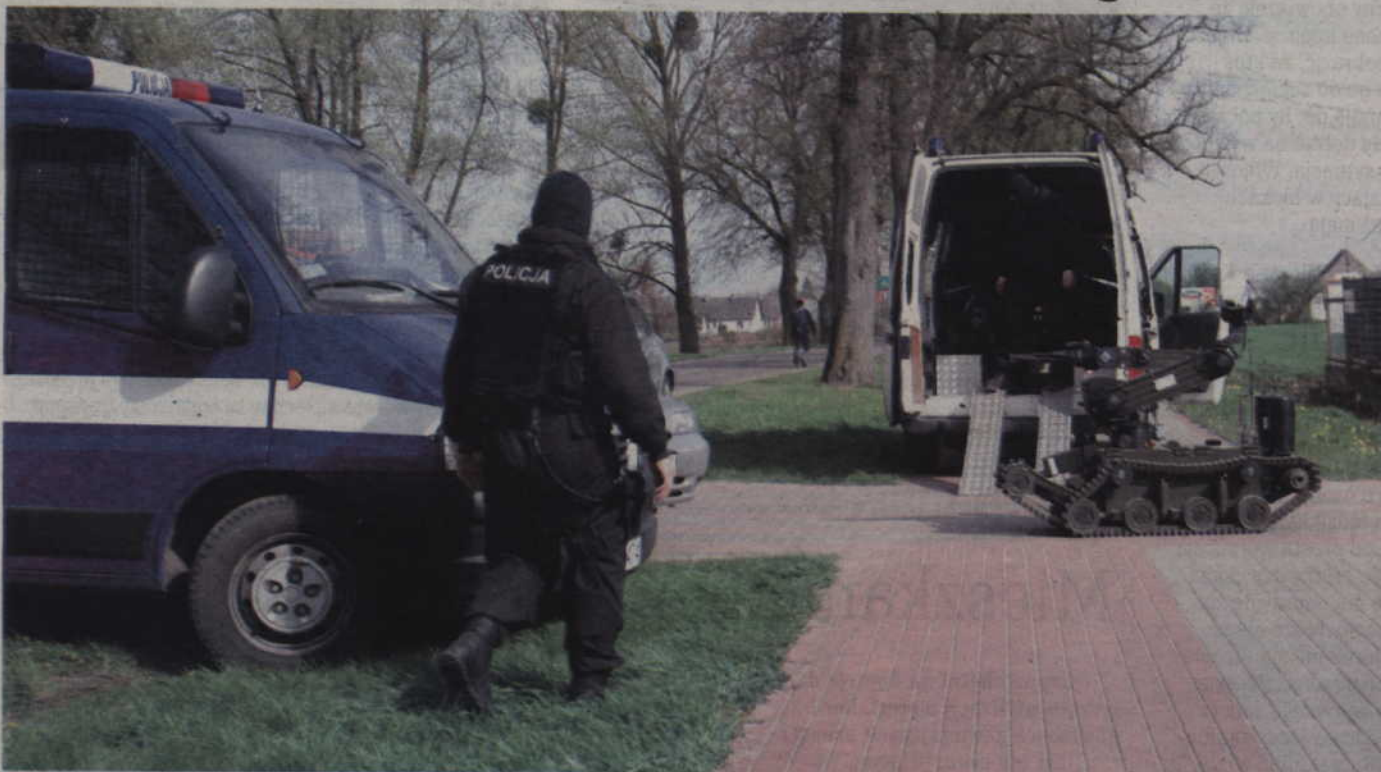
Policyjna akcja w Korzeniewie. W paczce przysłanej z Irlandii nie było bomby, jedynie rzeczy osobiste.