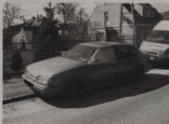
Wraki samochodów właściciele muszą usunąć na własny koszt.

Na ulicach Fredry oraz Polnej funkcjonariusze straży miejskiej natrafili na dwa wraki samochodów. Ustalono ich właścicieli. Trwa postępowanie, którego celem jest doprowadzenie do usunięcia wraków. Ich właściciele muszą to zrobić na własny koszt. (jk)