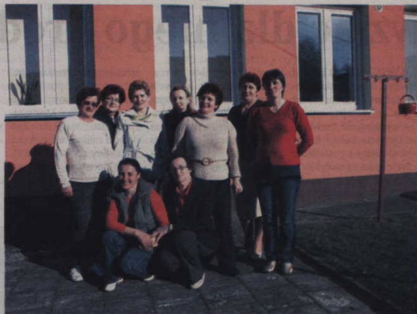
To tylko kilka pań z Koła Gospodyń Wiejskich w Tychnowach. Koło powstało w 1952 roku i nieprzerwanie działa do dzisiaj.

- Obchody odbędą się w naszej wsi i oczywiście