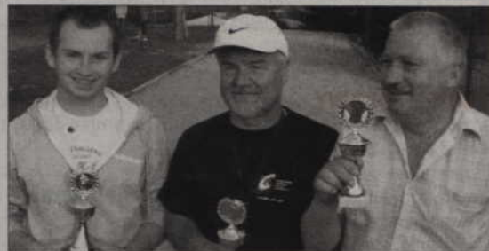
Czołowa trójka II turnieju.

przez długi czas pokonać bramkarza Vive. Tym razem zawodnicy MMTS nie potrafili zdobyć bramki przez 12 minut!