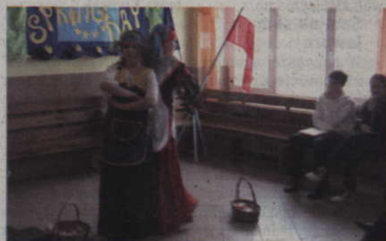
Przedstawiona kłótnia Paraski i Pałaszk rozbawiła kwidzyńską młodzież.