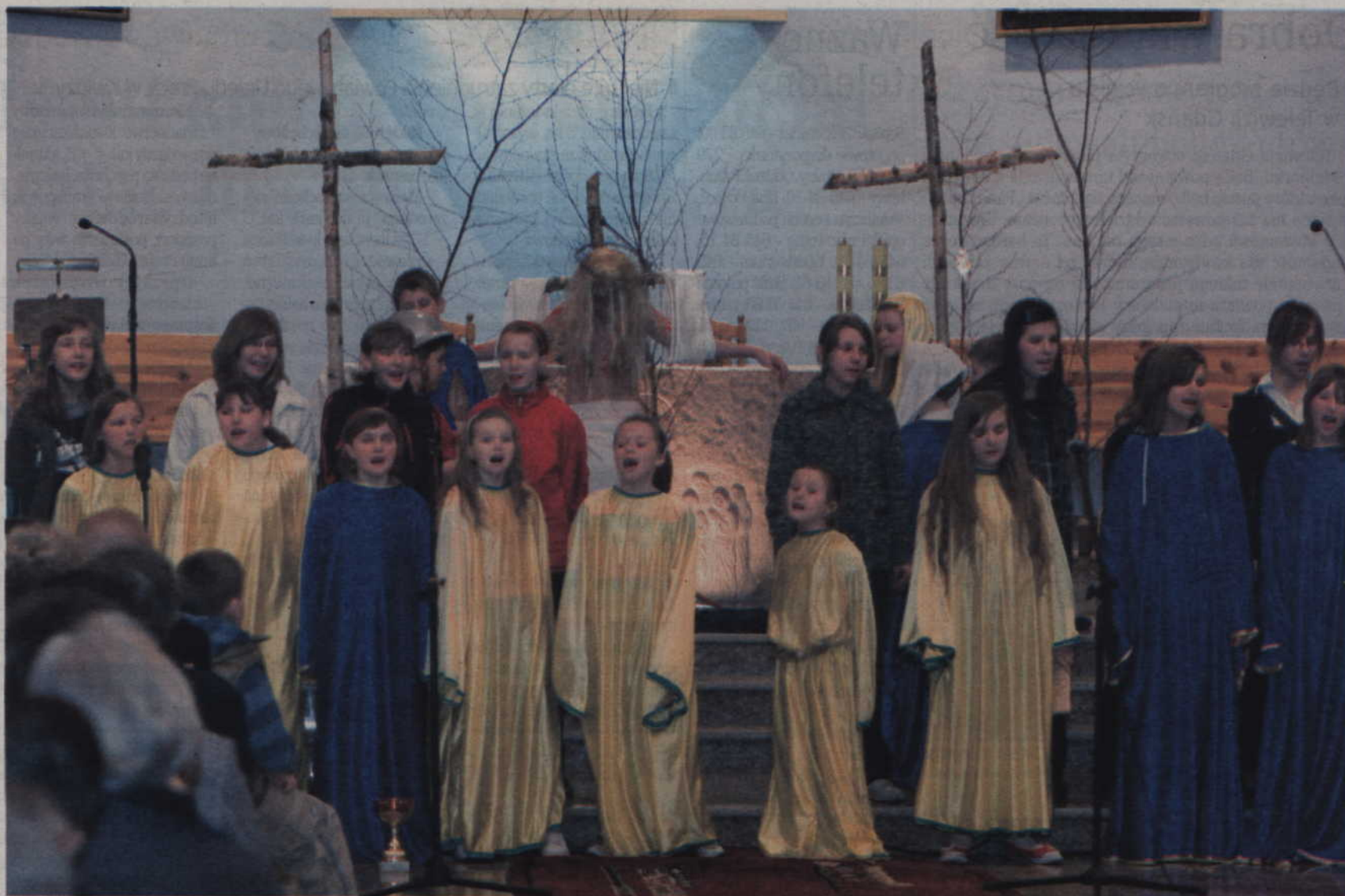
Parafia pw. Świętego Wojciecha. Misterium Paschalne uczniów SP6