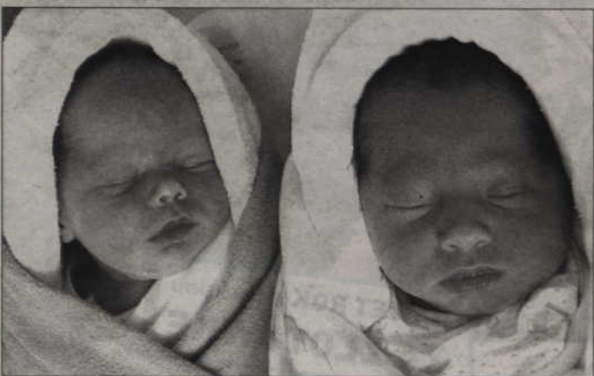
Wszystkie fotografie wykonano w kwidzyńskim szpitalu, w sobotę - 25 kwietnia.