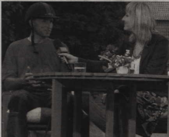
Kłpa Telewizji Gdańsk gościła w Kwidzynie latem ubiegłego roku nagrywając wakacyjny program.

Telewizja Gdańsk otworzyła punkt korespondencki w Malborku. Będą powstawały tam nagrania z Powiśla i Żuław, które potem będzie można oglądać w „Panoramie”. Wkrótce ma też powstać oddzielny program, prezentujący wiadomości tylko z tego regionu. To bardzo dobra wiadomość dla kwidzyńców, którzy od dawna zabiegali o utworzenie takiego programu. Do tej pory materiały z naszego powiatu mieszkańcy Pomorza mogli oglądać jedynie sporadycznie, np. przy okazji wakacyjnej akcji reporterskiej TVP Gdańsk, kiedy to przez cały dzień transmitowano program z Kwidzyna. (ad)