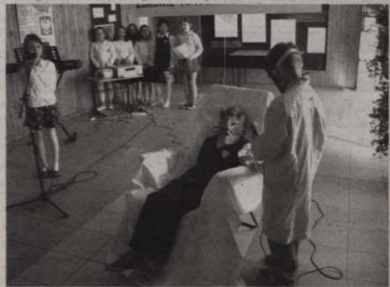
Wiersz „Chory kotek” w inscenizacji uczniów SP Otłowiec.