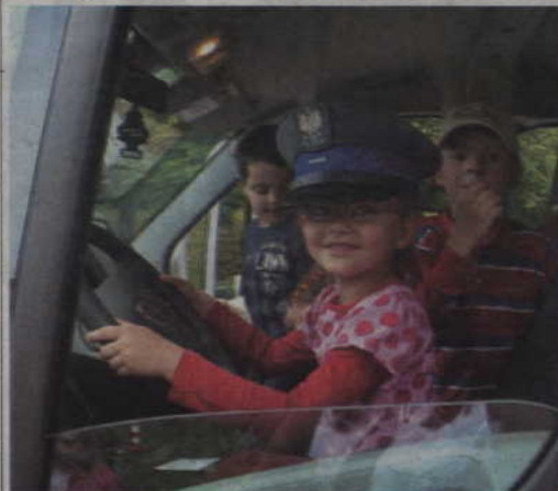
Największą atrakcją dla dzieci był policyjny samochód.