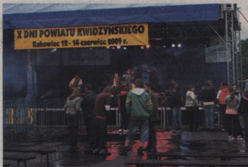
Choć w sobotę padał deszcz, wielu mieszkańców wybrało się na plenerowe koncerty.