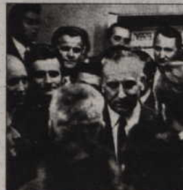
Lech Wałęsa na spotkaniu z Edwardem Gierkiem w 1971 r.

Dokumenty z 1970 r. pojawiły się na trójmiejskim rynku antykwarycznym jesienią ubiegłego roku i wkrótce zostały sprzedane. Gdy napisała o nich jedna z lokalnych gazet, sprawą zainteresowało się gdańskie Archiwum Państwowe (AP).