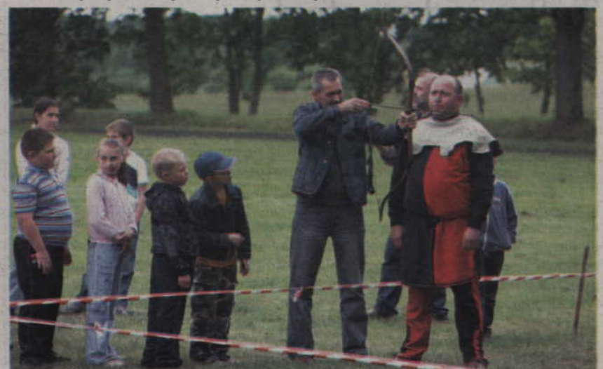
Każdy mógł spróbować umiejętności strzelania z łuku.