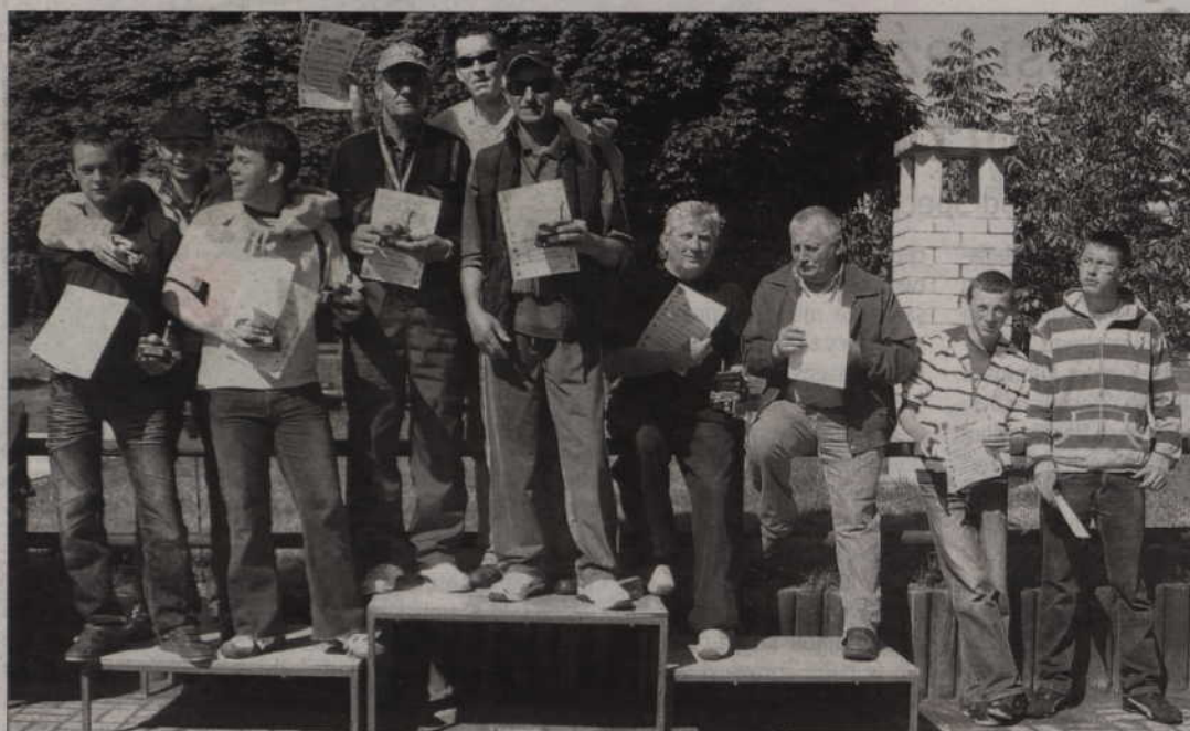
Podium turnieju drużynowego - na najwyższym stopniu Zbi-Wo-Mar.