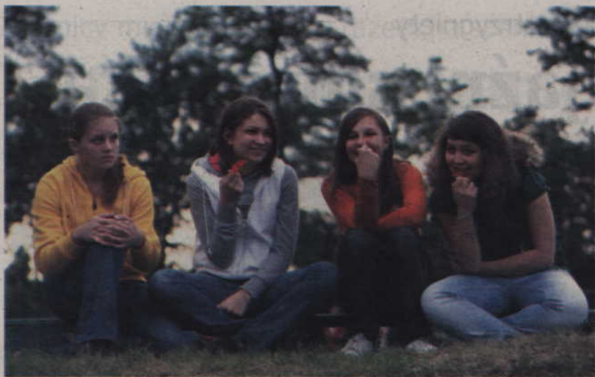
Dopiero w niedzielę pogoda pozwoliła na to, by w pełni cieszyć się festynem.