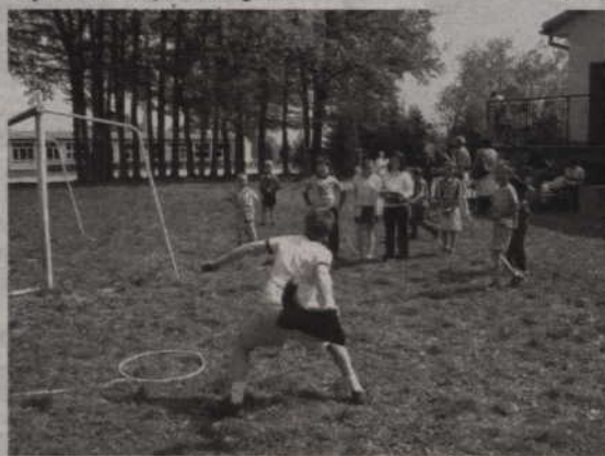
Rzut kaloszem to jedna z konkurencji sportowych Święta Szkoły.