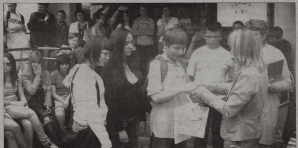
Szkolny festyn integracyjny zakończył obchodzony w Gimnazjum nr 2 Tydzień Integracji.