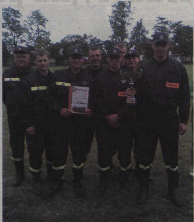
Szesnaście drużyn z czterech jednostek Ochotniczych Straży Pożarnych gminy Kwidzyn wzięło udział w gminnych zawodach sportowo-pożarniczych.