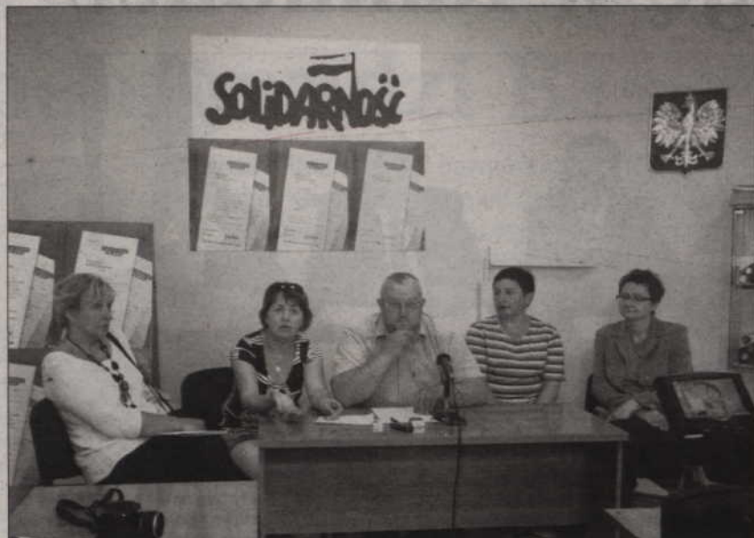
Związkowcy nie są zadowoleni, że decydenci nie liczą się z ich zdaniem w sprawie przyszłości szpitala.