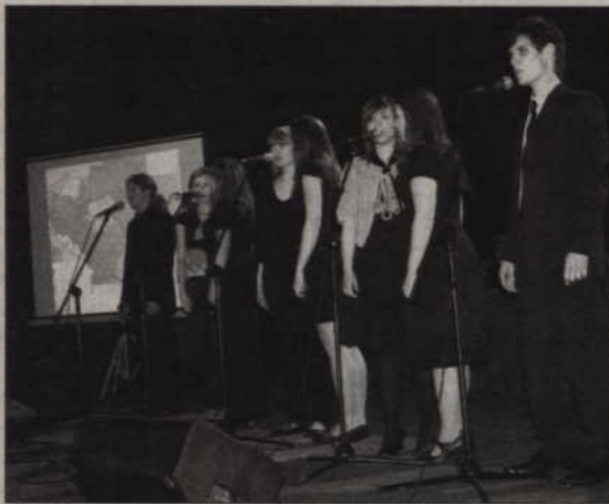
„Lekcja historii klasycznej”, czyli koncert Klubu Dobrej Piosenki.

- Wtedy było jedno zadanie: obronić granice państwa i scalić to pozaborowe mienie w jeden organizm państwowy. Patriotyczne pokolenia międzywojenne, które budowały Polskę, widziały później kraj rujnowany i niekiedy, jak w 1939 roku, szyły na śmierć. Nas spotyka swoista nagroda, w postaci bezpieczeństwa geopolitycznego. Jesteśmy w