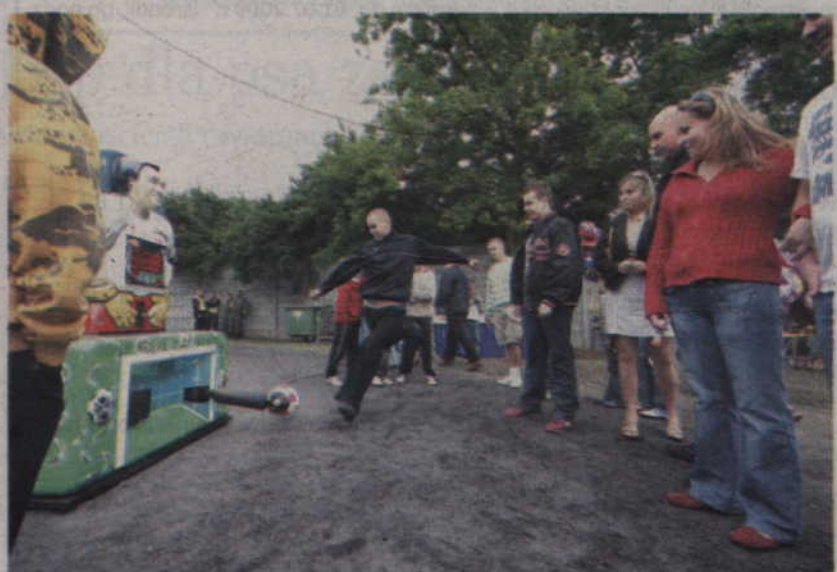
Zawody sportowe to dla wielu ulubiony punkt programu każdego festynu.