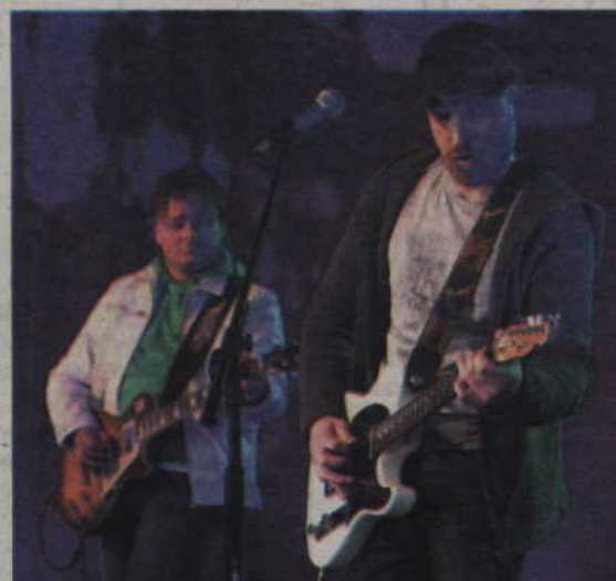
Występy zespołów młodzieżowych na plenerowej scenie.