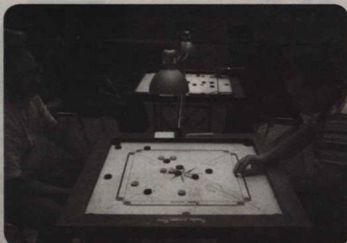
W carrom, zwany indyjskim bilardem, gra miliony osób na całym świecie. Podczas Dni Kwidzyna odbędzie się pierwszy w historii miasta turniej w tej dyscyplinie.

Międzynarodowa Federacja Carrom (International Carrom Federation) powstała w październiku 1988 r. W Europie istnieje Europejska Konfederacja Carrom'a (European Carrom Confederation). Jej podstawowym celem jest promowanie gry oraz ko-