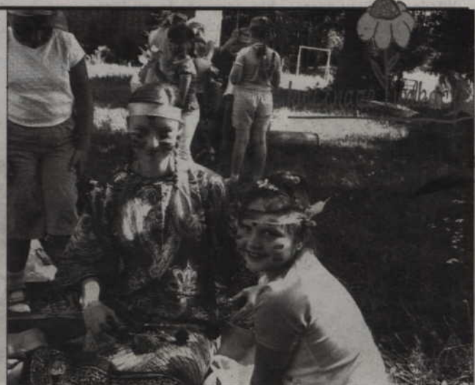
W spotkaniach z przyrodą mogą uczestniczyć dzieci w wieku od 6 do 12 lat.

Opłatność: 35 zł od osoby za turnus, 8 zł od osoby za Zieloną Wyprawę. Zapisy przyjmuje Stowarzyszenie Eko-Inicjatywa, 82 500 Kwidzyn, ul. Miłostna 1, tel. 055 261 22 16, 055 261 37 97, e-mail: sekretariat@ekokwidzyn.pl. W zgłoszeniu należy podać: imię i nazwisko dziecka/dzieci, wiek, datę turnusu i datę „Zielonej Wyprawy”, imię i nazwisko rodzica/opiekuna, nr telefonu i e-mail. Formy zgłoszenia: osobiście, telefonicznie lub e-mail.