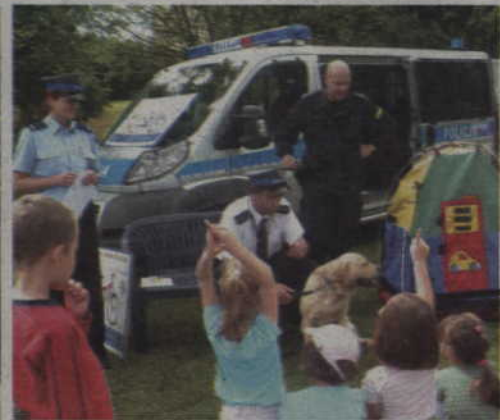
Przedszkolaki mogły pochwalić się wiedzą o bezpiecznym zachowaniu.