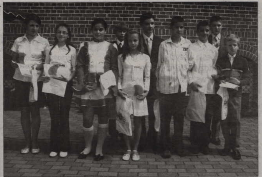
Najlepsi z najlepszych, czyli laureaci Nagrody Roku szkoły Podstawowej nr 2 w Kwidzynie.

Podczas całego roku szkolnego trwa konkurs