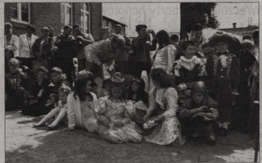
Festyn przygotowany przez szkołę był bardzo barwny. Uczniowie przebrali się za postacie z różnych książek.