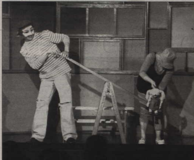
Prewencyjne przedstawienie przygotowali wspólnie Scena Lalkowa w Kwidzynie, Komenda Straży Miejskiej oraz Teatr Lalek „Zaczarowany Świat” w Toruniu.