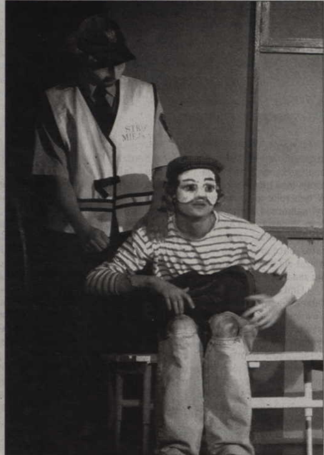
Spektakl dla dzieci „Uwaga !!! Obcy” to nietypowy pomysł na ostrzeganie dzieci przed kontaktami z osobami obcymi.

Bohaterką spektaklu jest mała dziewczynka, która bez opieki dorosłych wychodzi na podwórko i spotyka obcego mężczyznę. Proponuje on dziewczynce wspólną zabawę na huśtawkach, zdobywając powoli jej zaufanie. Okłamując, że jest nowym sąsiadem, namawia ją do wspólnego spaceru. Dziewczynka zgadza się pójść z obcą osobą i zostaje porwana. Cała historia kończy się dobrze. Porywacz zostaje zatrzymany i aresztowany. W spektaklu aktywny udział biorą dzieci, które są zapraszane na scenę. Oprócz spektaklu funkcjonariusze straży miejskiej przeprowadzili pogadankę profilaktyczną na temat zasad postępowania w przypadku kontaktu z osobami obcymi.