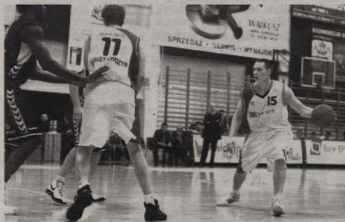
Zadaniem nowego trenera będzie zbudowanie zespołu na nowy sezon.