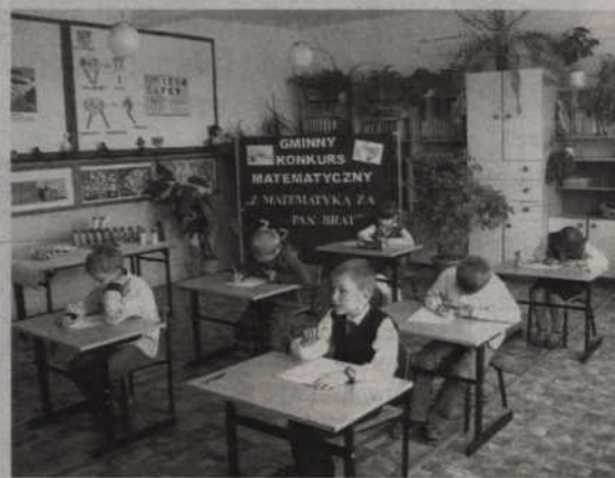
Uczestnicy gminnego konkursu matematycznego.