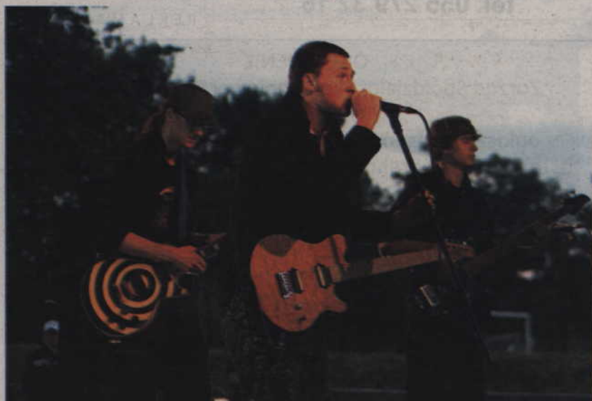
Zespół Over Shadow.