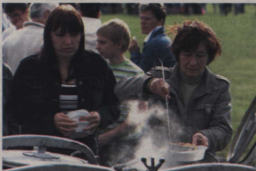
Plenerowy posiłek dla wszystkich - grochówka.