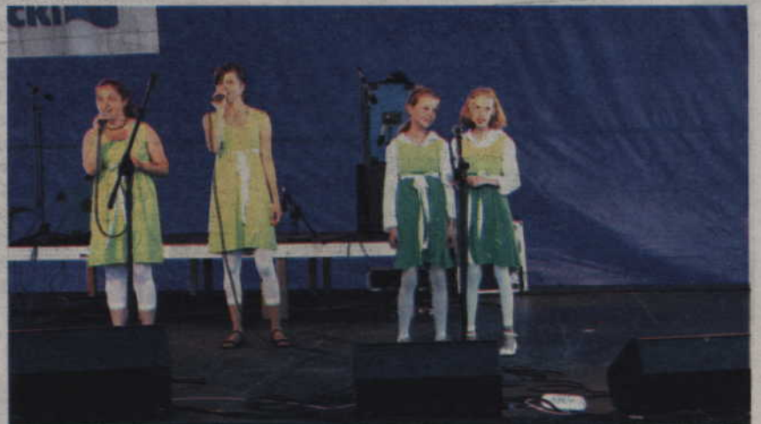
Występ Dziecięcego Zespołu Wokalnego Blef.