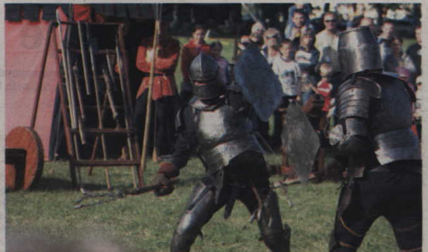
Podczas imprezy można było obejrzeć spektakl rycerski.