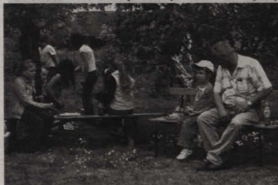
Po występach odbył się piknik z ogniskiem i grilllem.