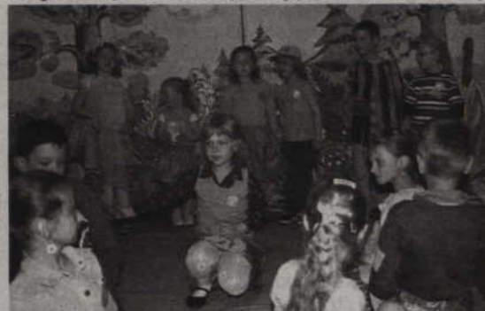
W przeglądzie szkolnych teatrów wzięli udział uczniowie i przedszkolaki z gminy Prabuty.