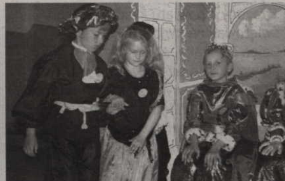
Mali aktorzy z Obrzyna.