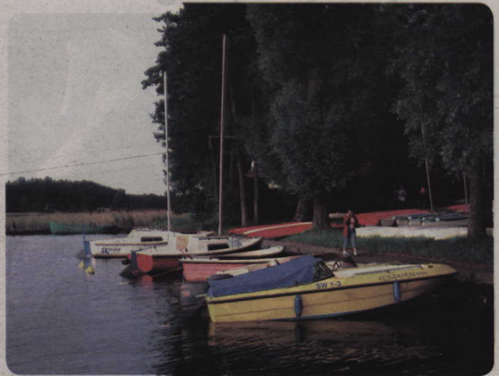
Policja przypomina, że najbezpieczniejsza kąpiel, to ta w miejscach odpowiednio zorganizowanych i oznakowanych, będących pod nadzorem ratowników, czy funkcjonariuszy policji wodnej.

Wakacje to przede wszystkim czas wypoczynku dzieci i młodzieży. To także okres wyjazdów rodzinnych. Aby dla wszystkich był spokojny i bezpieczny, kwidzińska policja radzi zastosować się do kilku porad. Pozwolą one uniknąć przykrych niespodzianek.