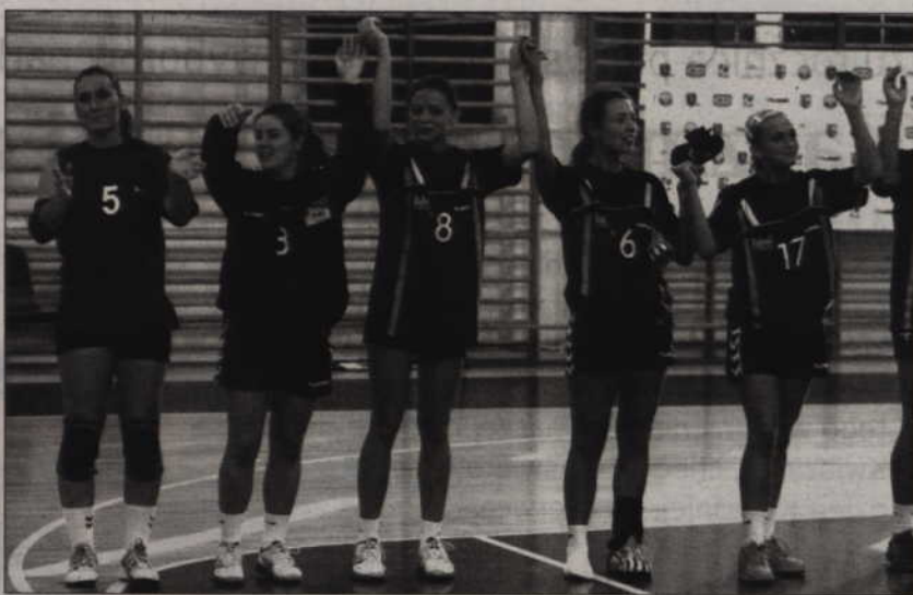
MTS Kwidzyn rozpocznie I-ligowe boje od meczu w Szczecinie.

W tegorocznych rozgrywkach I ligi kobiet wezmą natomiast udział zespoły: AZS AWFIS Gdańsk, Słupia Słupsk, AZS AWF War-