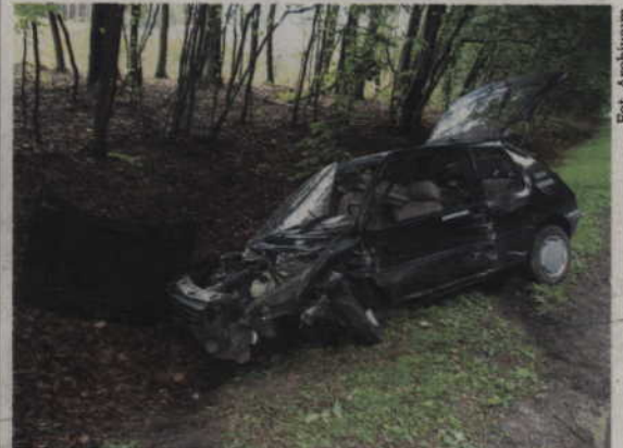
Ten Wypadek wyglądał bardzo groźnie. Na szczęście nikomu nic poważnego się nie stało