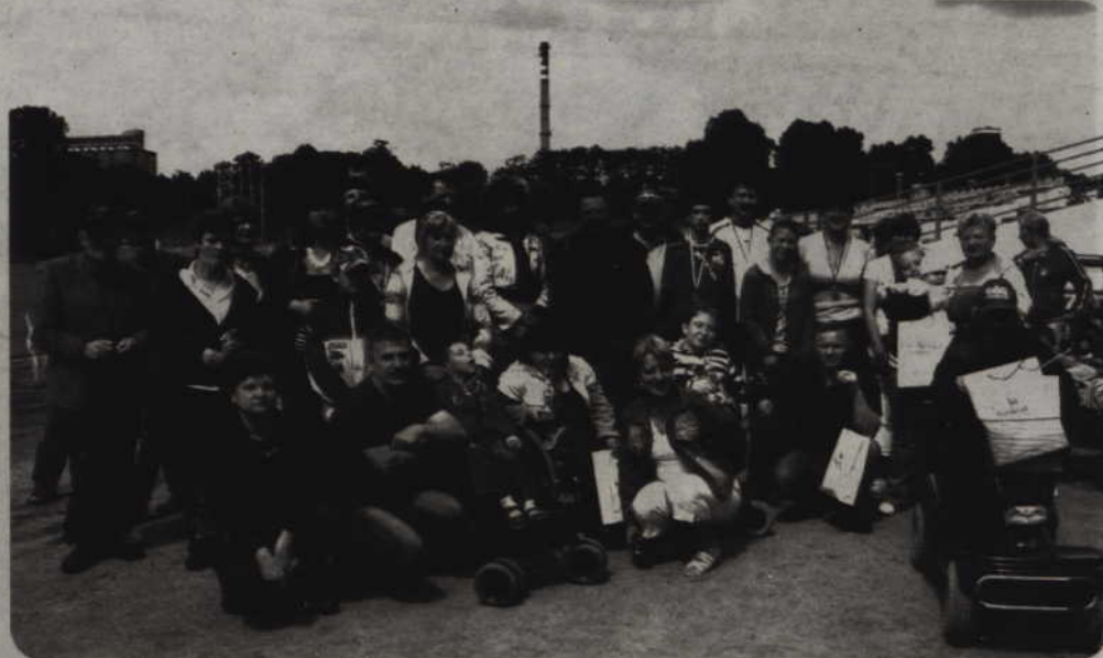
Tradycyjnie organizatorem Mistrzostw Bocce dla Niepełnosprawnych było Kwidzińskie Stowarzyszenie „Bocce”. Pogoda, chociaż w ostatnich dniach bardzo kapryśna, dopisała.

Turnieje bocce oraz mini golfa dla niepełnosprawnych odbyły się w Kwidzynie. Imprezy zostały zorganizowane w ramach Dni Kwidzyna. Tradycyjnie organizatorem Mistrzostw Bocce dla Niepełnosprawnych było Kwidzińskie Stowarzyszenie „Bocce”. Pogoda, chociaż w ostatnich dniach bardzo kapryśna, dopisała.