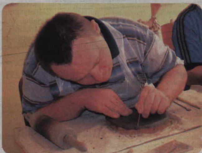
Uczestnikami warsztatu mogą zostać osoby niepełnosprawne posiadające znaczny lub umiarkowany stopień niepełnosprawności. Na zdjęciu: zajęcia w pracowni ceramicznej.