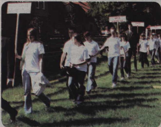
Niepełnosprawni zawodnicy z Marzęcina po raz pierwszy wzięli udział w mityngu.