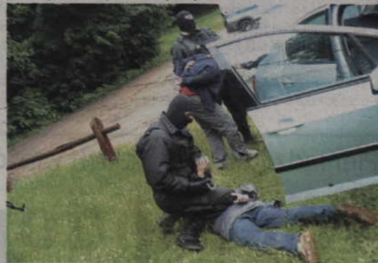
Policjanci wkroczyli do akcji, gdy jeden z bandytów strzelił w ich stronę.