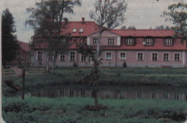
Warsztat Terapii Zajęciowej powstał w październiku 1993 roku przy Domu Pomocy Społecznej w Kwidzynie. Od stycznia 2004 roku prowadzi go Fundacja „Misericordia” w Kwidzynie, w zabytkowym dworcu w Górkach. Na zdjęciu: praca wykonana przez niepełnosprawnych uczestników.

Warsztat Terapii Zajęciowej powstał w październiku 1993 roku przy Domu Pomocy Społecznej w Kwidzynie. Od pierwszego stycznia 2004 roku prowadzi go Fundacja „Misericordia” w Kwidzynie, w zabytkowym dworcu w Górkach. Zajęcia prowadzone są w pracowniach terapii życia codziennego, stolarskiej, ceramicznej, plastycznej, komputerowej, wikliniarskiej, redakcyjnej i ogrodniczo-gospodarczej. Podczas zajęć rozwijane są między innymi psychofizyczne sprawności niezbędne w pracy, podstawowe, a także specjalistyczne umiejętności zawodowe. Umożliwiają one podjęcie pracy zarobkowej lub szkolenia zawodowego. Wobec wszystkich uczestników zajęć terapeutycznych stosowane są dwie