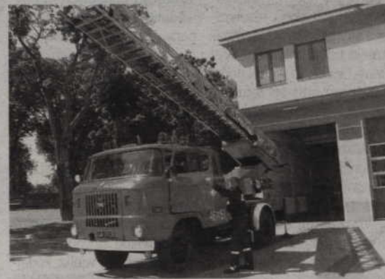
Organizator letniego wypoczynku musi mieć sprawną łączność ze służbami ratowniczymi.