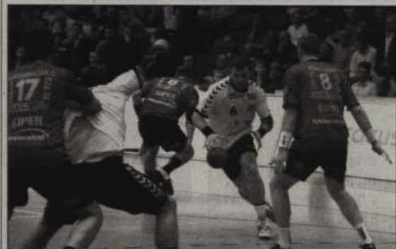
MMTS w pierwszym meczu ligowym zmierzy się z zespołem Focus Park-Kiper.

który zajął II miejsce w A klasie i będzie walczył o awans do wyższej klasy rozgrywkowej. Niestety spadek odnotują Rodło Trzciano i GKS Gardeja. W klasie A natomiast pojawi się Zawisze Czarne Dolne (I miejsce w klasie B), a Spójnia Sadlinki zagra o awans w meczach barażowych.