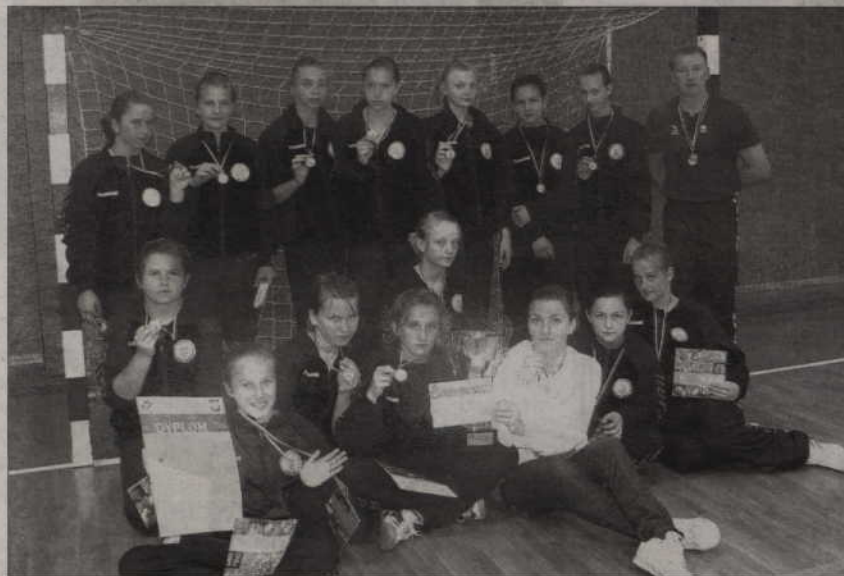
Złote medalistki - MTS Kwidzyn.