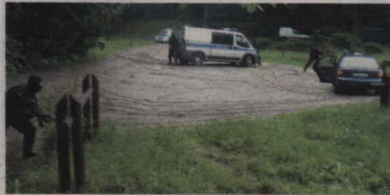
Uzbrojeni więźniowie wraz z zakładniczką udali się na leśny parking. Tam dopadła ich policja.