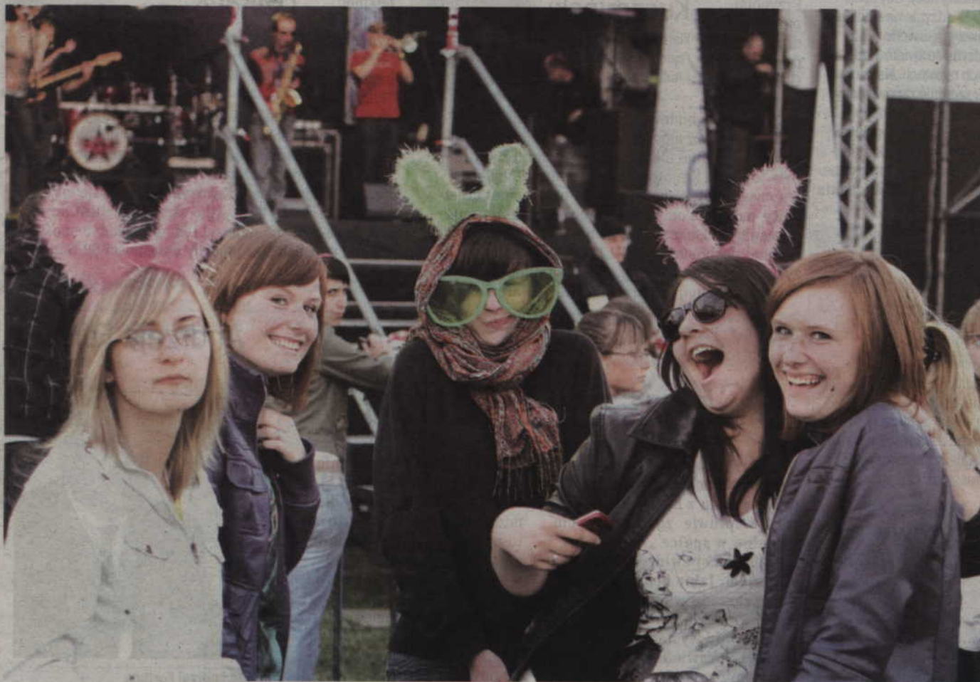
Kwidzyńskie fanki królowej popu. Zabawa przed sceną była wspaniała.

KWIDZYN. Jak co roku w przedostatni weekend czerwca kwidzyńskie festywnie obchodzili święto miasta. Gwiazdami tego największego festynu była Doda i Formacja Nieżywych Schabuff. Nie zabrakło konkurencji sportowych i zabawnych konkursów rekreacyjnych. Stosika gastronomiczne, wysta-