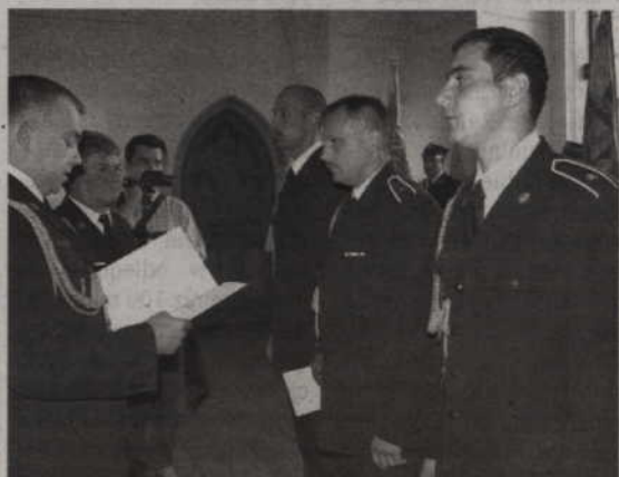
Podczas uroczystości nie zabrakło awansów na wyższe stopnie.