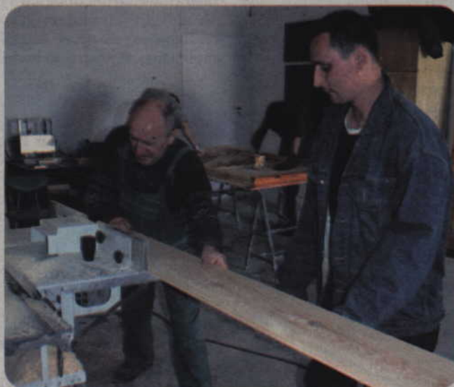
Zajęcia prowadzone są w pracowniach terapii życia codziennego, stolarskiej, ceramicznej, plastycznej, komputerowej, wikliniarskiej, redakcyjnej i ogrodniczo-gospodarczej.

formy rehabilitacji medycznej: kinezyterapia (obejmuje między innymi ćwiczenia gimnastyczne i różne formy czynnego wypoczynku i relaksu) i fizykoterapia (elektroterapia, termoterapia, światłolecznictwo i ultradźwięki, magneto-