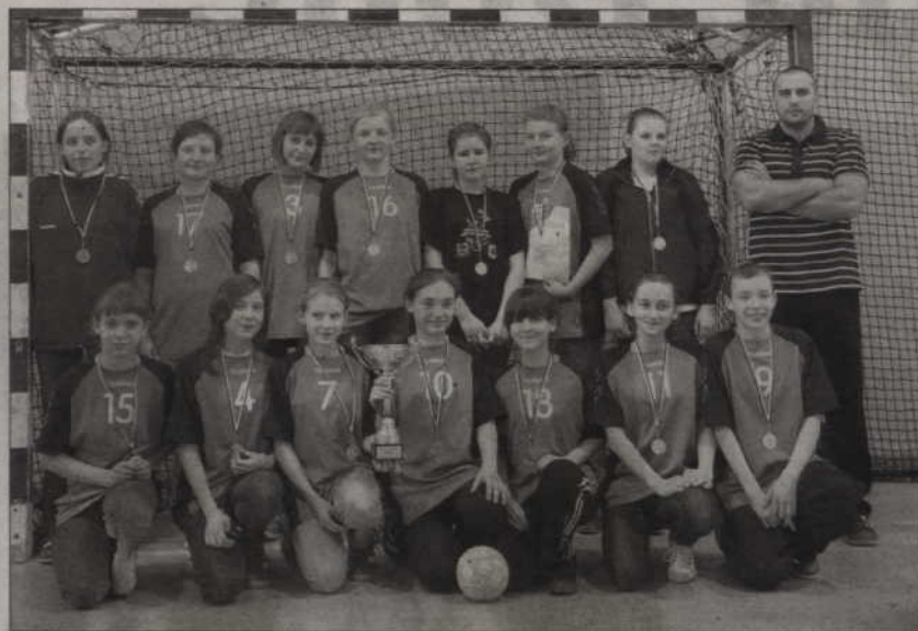
Brązowy medal zdobył Bellator Ryjewo.

Taka sytuacja nie zdarza się dość często, aby w pierwszej trójce najlepszych zespołów w Polsce znalazły się dwa zespoły z powiatu kwidzyńskiego. MTS Kwidzyn został jednak Mistrzem Polski rocznika 1996, a trzecie miejsce w tych rozgrywkach wywalczyła ekipa Bellatora Ryjewo.