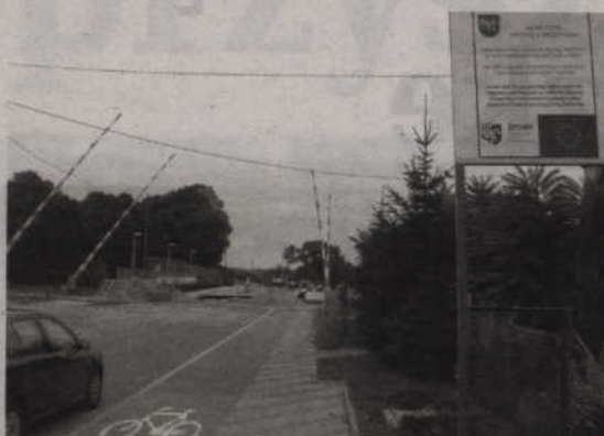
W 2005 roku oddano do użytku pierwszy odcinek małej obwodnicy, od ul. Łużyckiej do Południowej i Zwirowej.