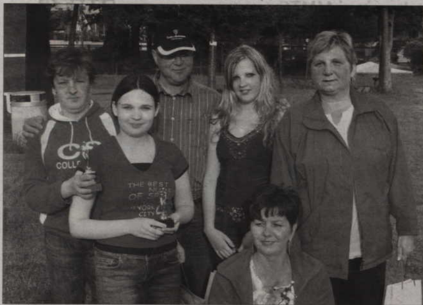
Medalistki XI Mistrzostw Pań.