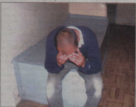
Piotr K. pobił kierownika łamiąc mu szczękę.

KWIDZYN. Nawet do 5 lat więzienia grozi mężczyźnie, który uderzył swojego kierownika łamiąc mu szczękę. Do zdarzenia doszło na budowie.