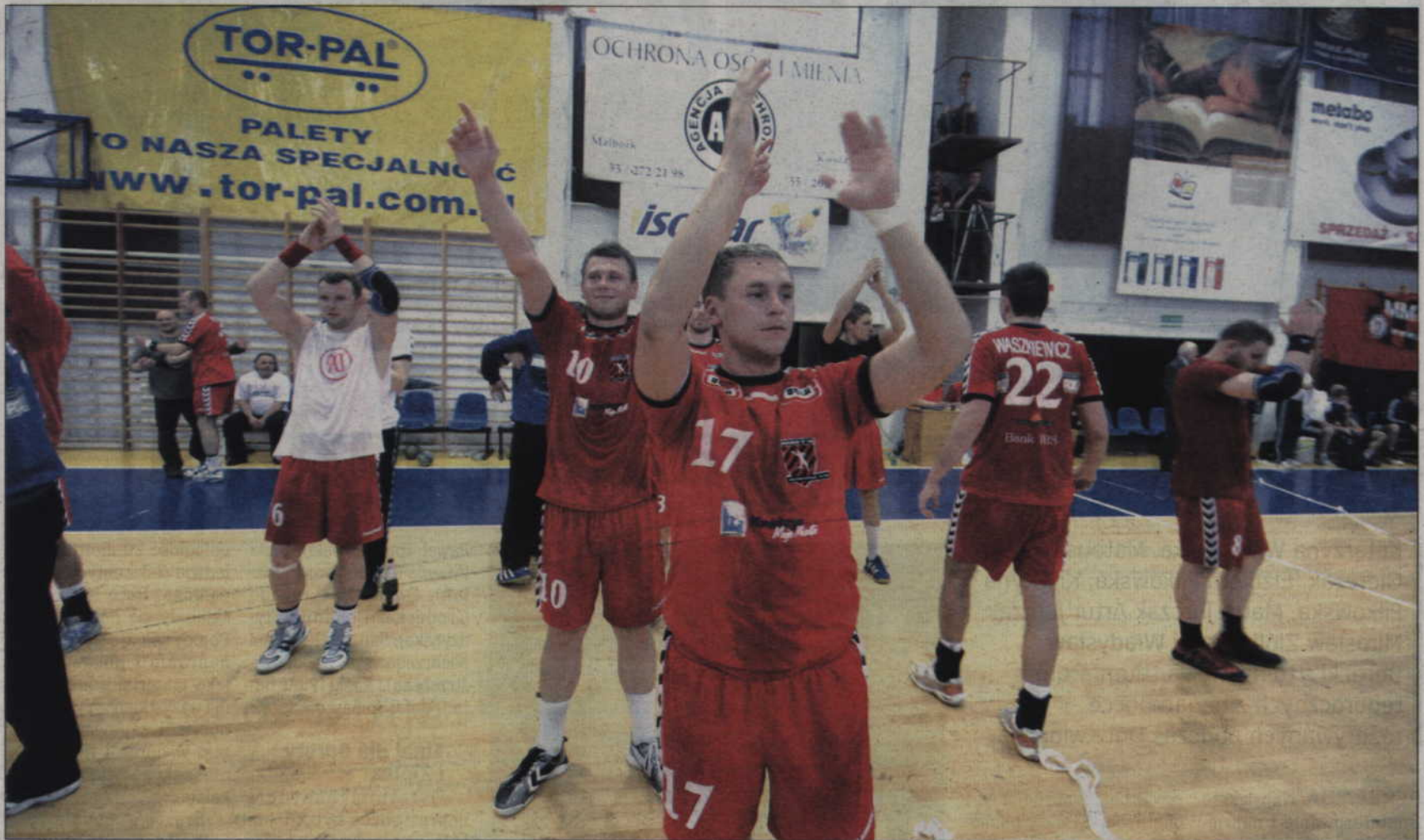
MMTS Kwizdyn rozpocznie przygotowania do sezonu od treningów na kwizdyńskich obiektach sportowych.