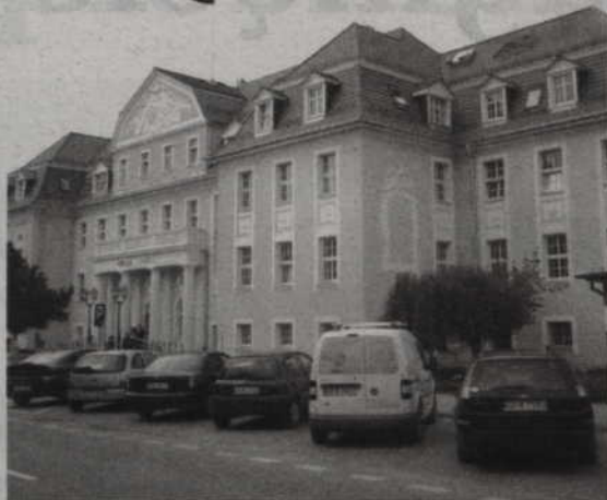
Dzwon znajdujący się na odnowionym budynku Urzędu Miejskiego oznajmiał będzie tylko godzinę 12. Wcześniej dzwonił co godzinę, jednak hałas przeszkadzał mieszkańcom.