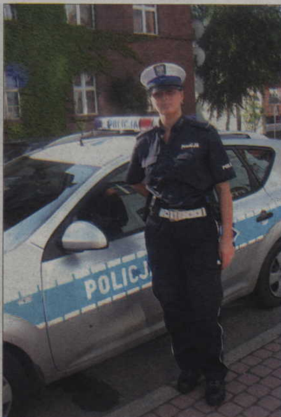
Kwidzińska policjantka w nowym granatowym mundurze.

Już dzisiaj na drogach powiatu kwidzińskiego można było spotkać funkcjonariuszy w nowych mundurach. Do policjantów drogowki trafiła pierwsza partia nowego umundurowania, w dalszej kolejności wymieniane będą mundury pozostałych służb policyjnych. (ad)