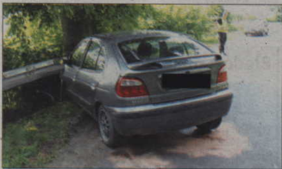
Kierująca tym samochodem kobieta jechała na tyle nieostrożnie, że pojazd na zakręcie wypadł z drogi i uderzył w drzewo.

GARDEJA. Na zakręcie drogi między Wandowem a Jaromierzem renault megane wbiło się w drzewo. Samochodem jechały cztery osoby. Na szczęście nikt poważnie nie ucierpiał.