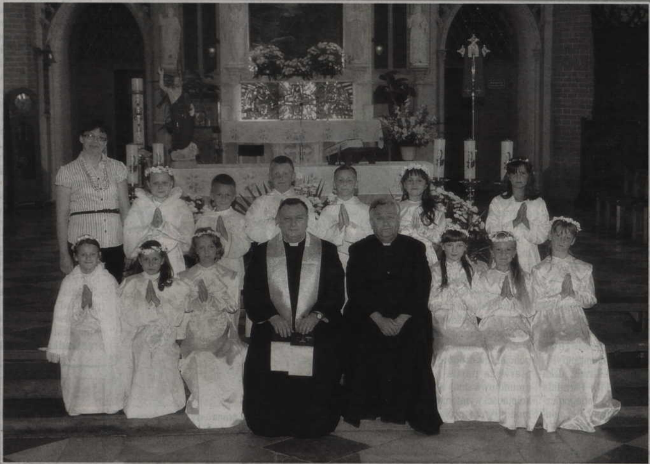
Pierwsza Komunia Święta 16.05.2009r.