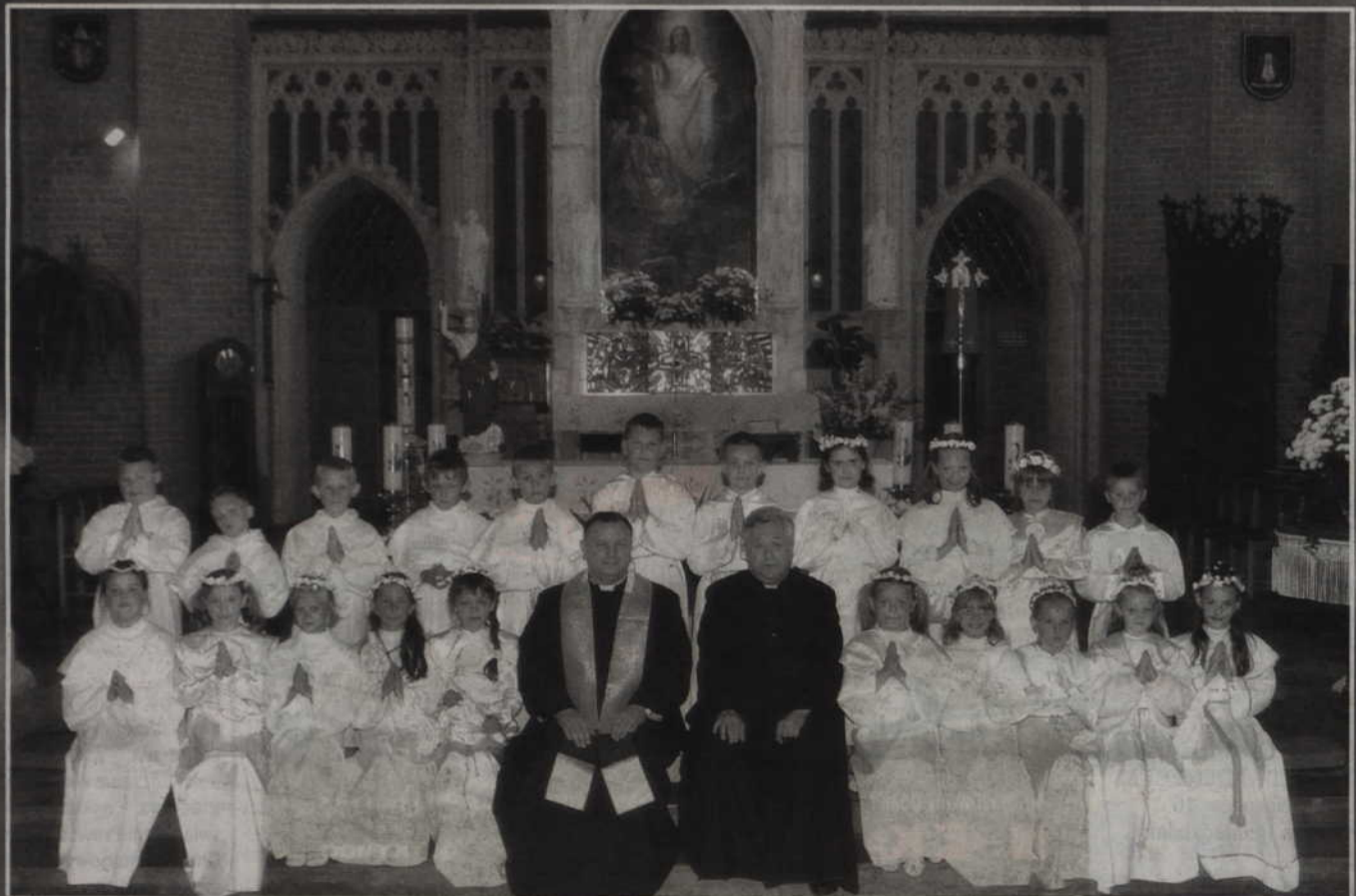
Pierwsza Komunia Święta 16.05.2009r.