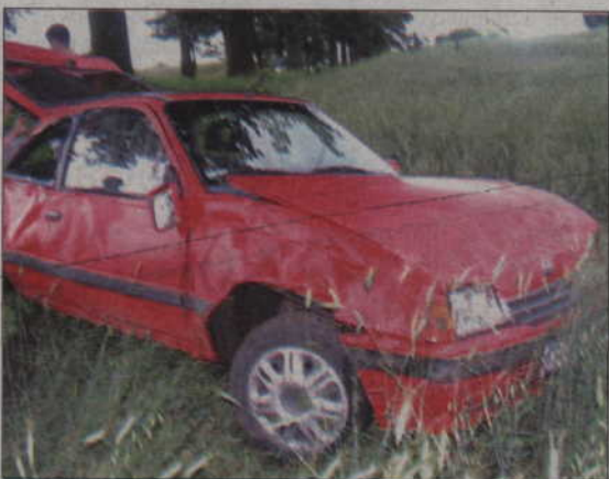
Kierowca parkując samochód nie zamknął go i zostawił w środku kluczyki. Z tej okazji skorzystał złodziej, który potem porzucił auto.