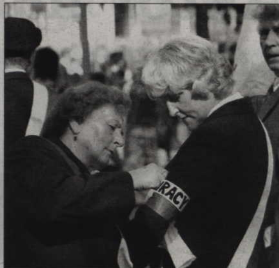
Kwidzyńscy Sybiracy biorą udział w wielu patriotycznych uroczystościach obchodzonych w mieście.

- Nie będzie się to wiązało z żadnymi kosztami dla mieszkańców, gdyż budynki dopiero będą miały nadawane adresy, nie