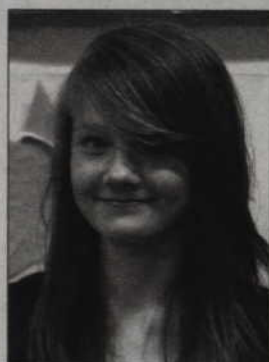
Maria Wodzińska 6A