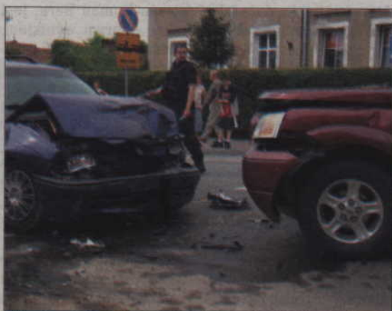
W tym wypadku ranne zostały trzy osoby.