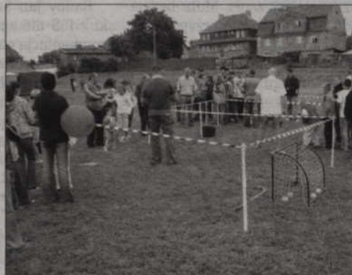
Dzieci brały udział w wielu konkursach zręcznościowych.