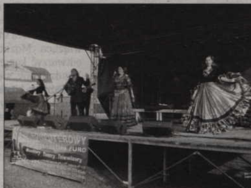
Na scenie zespół Cygańskie Czary.