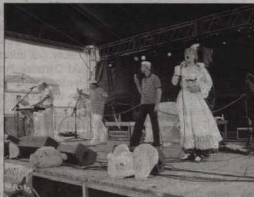
Teatr HALS przedstawił program artystyczny specjalnie