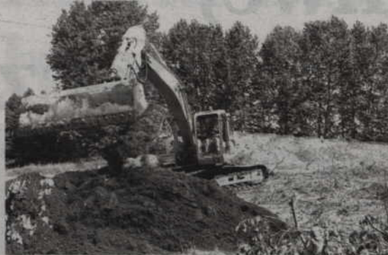
Mała obwodnica ma powstać do końca listopada. Na zdjęciu: prace w okolicach Dankowa.

Utrudnienia niestety wystąpią, za co przeproszam wszystkich mieszkańców. Nie ma jednak innego wyjścia. Oczywiście mieszkańcom Dankowa oraz osobom, które w rejonie tej inwestycji mają nieruchomości zostanie zapewniony dojazd. Wszyscy, którzy w sąsiedztwie działki lub rozpoczną budowę domu mogą więc być