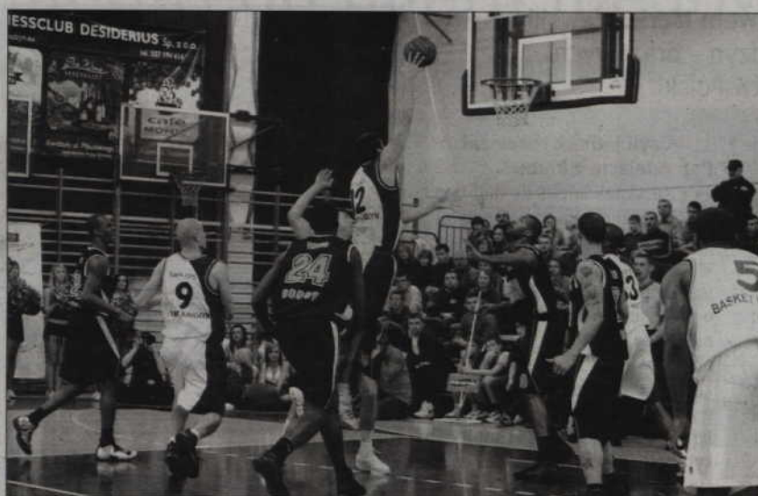
Kibice Basketu z niecierpliwością czekają na skompletowanie składu na nowy sezon.