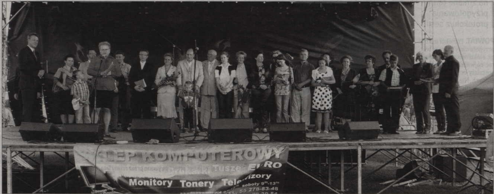
Laureaci festynowych konkursów.