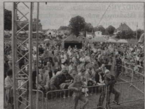
Mieszkańcy Prabut tłumnie przybyli na festyn.