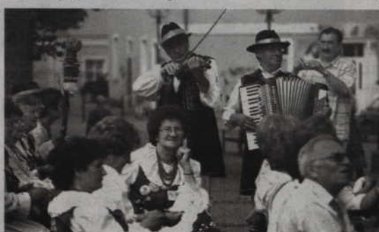
Na IV Ogólnopolskim Spotkaniu Zespołów i Kapel Ludowych „Folsiada” wystąpi 20 grup z całej Polski.