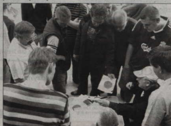
Sędzia zawodów skrupulatnie sprawdzał każdą tarczę.

Reprezentanci firmy Tor-Pal zwyciężyli w otwartych zawodach strzeleckich rozgrywanych o puchar burmistrza Kwidzyna.