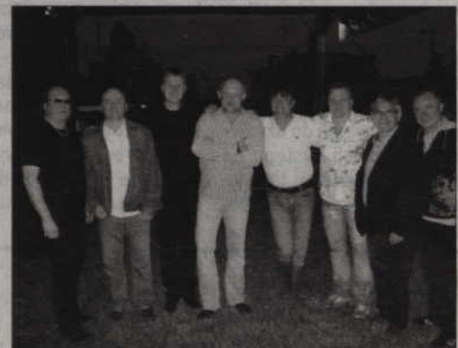
Burmistrz i radni Prabut zrobili sobie pamiątkowe zdjęcie z zespołem Żuki.