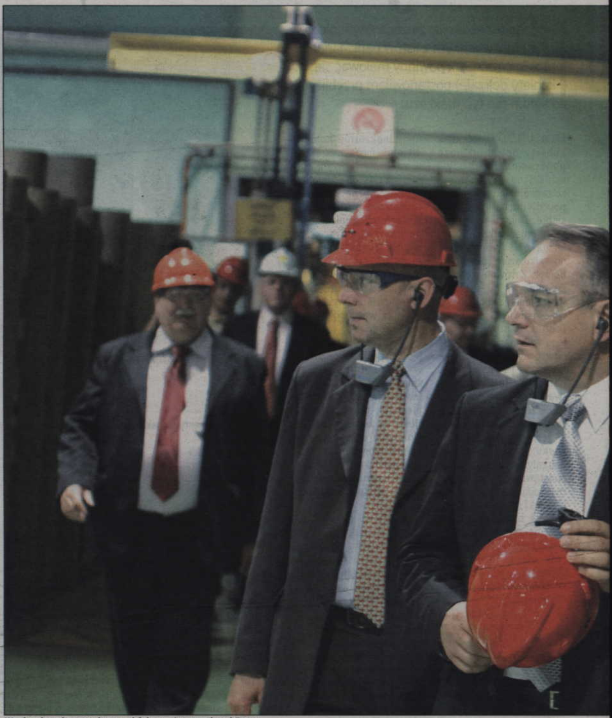
Wycieczka wicepremiera pod fabryce International Paper.

- Pomyślcie sobie o czymś takim, jak muzyka Chopina - mówił. - On nie wstydził się muzyki ludowej, ani kraju, z którego pochodził. Potrafił jednak