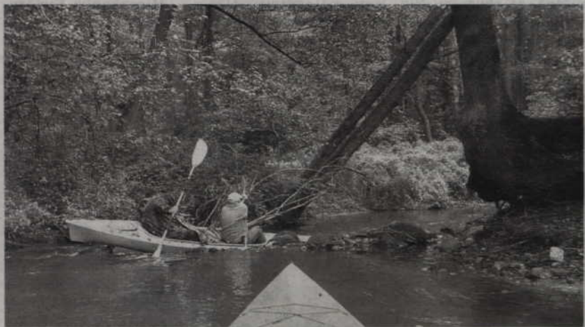
Do Liwy wpływa 90 proc. wszystkich wód na terenie powiatu.

Rzeka Liwa kilka razy dawała się rolnikom we znaki. W 2001 roku na terenie gminy z powodu powodzi ucierpiało 270 gospodarstw. Zalanych lub potopionych zostało około wówczas 2100 ha w tym 1150 ha zbóż, 780 ha warzyw i ponad 350 ha roślin okopowych. Uszkodzone zostały dwa mosty na Liwie. Straty szacowano wówczas na ok. 7 mln zł. Sytuacja została poprawiona w wyniku odbudowy 32 km odcinka koryta rzeki przez Regionalny Zarząd Gospodarki Wodnej w Gdańsku. Jak twierdzą melioranci, Liwa to główny odbiorca wód nie tylko z terenu Niziny Kwidzyńskiej, ale z całego powiatu. Do niej wpływa ok. 90 proc. wszystkich wód.