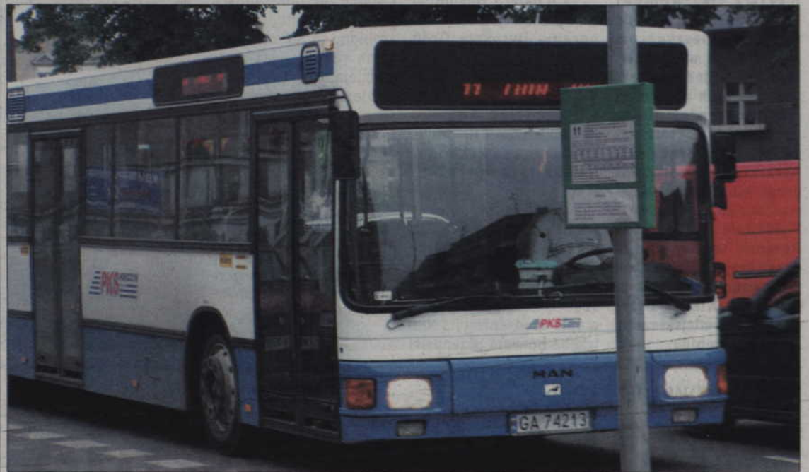
W kwidzyńskim PKS zapewniono nas, że teraz już wszyscy kierowcy prawidłowo interpretują przepisy i każdy, komu przysługuje zniżka, otrzyma ulgowy bilet.