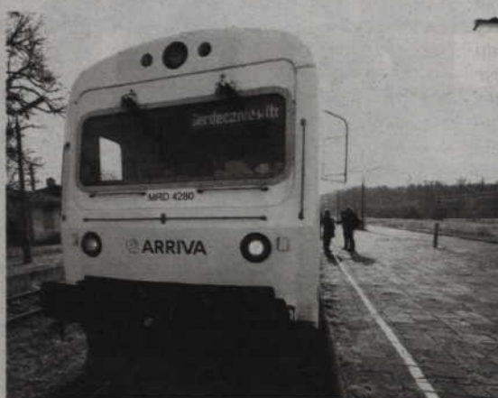
Wyjazd z Kwidzyna o godz. 07.15, powrotny wyjazd ze Sztutowa - 17.35. Wakacyjny pociąg kursuje w każdą sobotę wakacji.

Jest też oferta dla turystów wypoczywających w Steganie, Sztutowie oraz