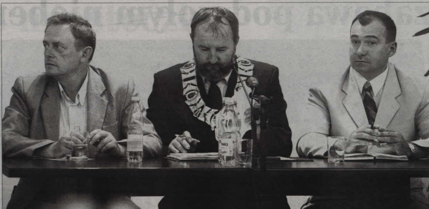
Dokumenty, czyli zapis najważniejszych punktów sesji, w formie elektronicznej mają być przechowywane przez cztery lata, czyli jedną kadencję rady. Nie będzie już szczegółowych notatek z posiedzeń.

Zarząd proponuje, aby bardzo okrojone protokoły były przechowywane w formie elektronicznej. Uważamy, że jest to sprzeczne z ustawą o samorządzie powiatowym, a konkretnie z zapisem ustawy, który mówi, że działalność organów powiatu jest jawna. Ograniczenia jawności mogą wynikać wyłącznie z ustaw. Zapis ten mówi też, że jawność działania organów powiatu obejmuje w szczególności prawo obywateli do uzyskania informacji, wstępu na sesję rady powiatu i posiedzenia jej komisji, a także