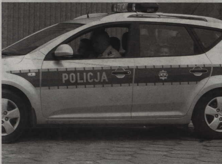
Wielką atrakcją okazała się przejażdżka radiowozem.