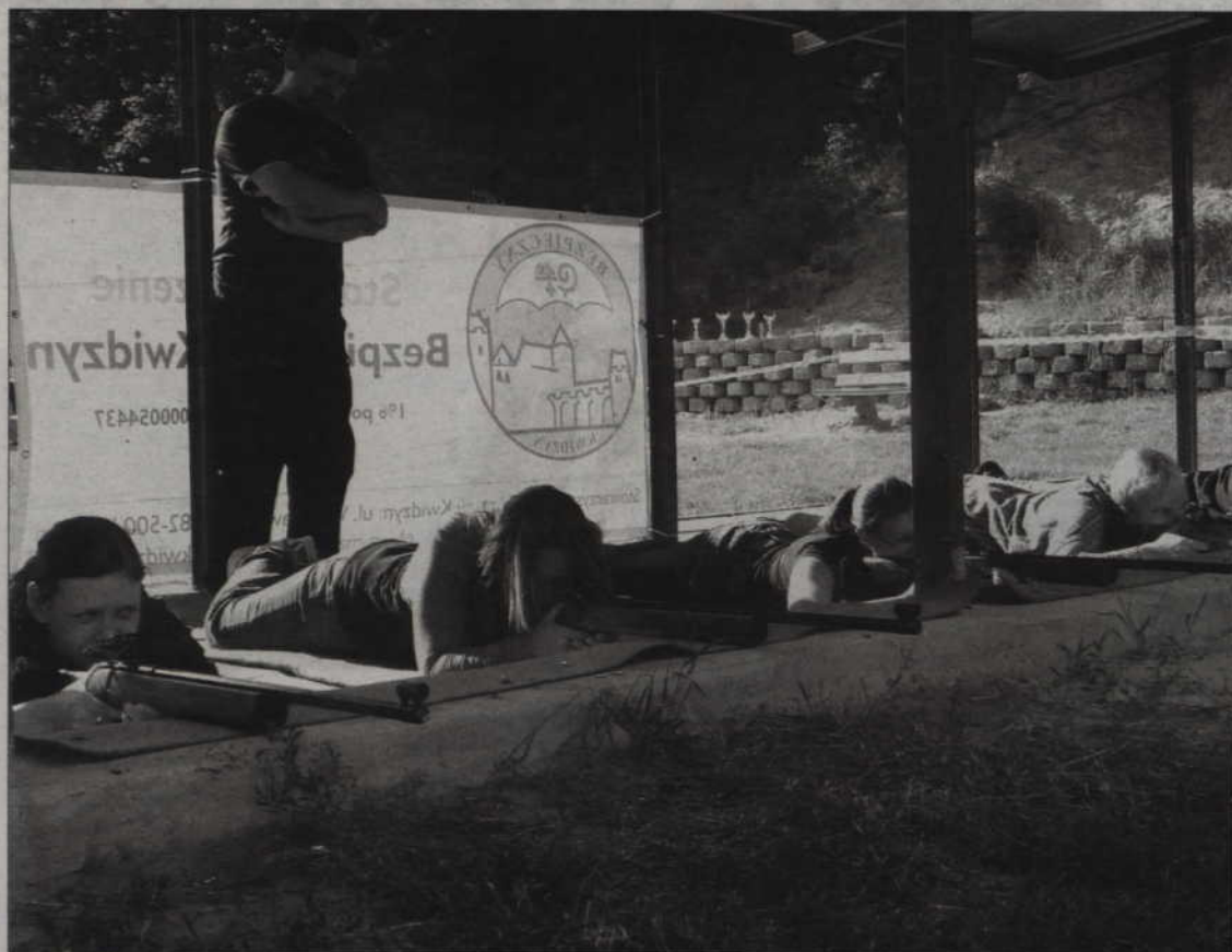
Każdy z zawodników musiał oddawać 5 strzałów z pozycji leżącej. Na zdjęciu strzela ekipa Fundacji WOŚP.