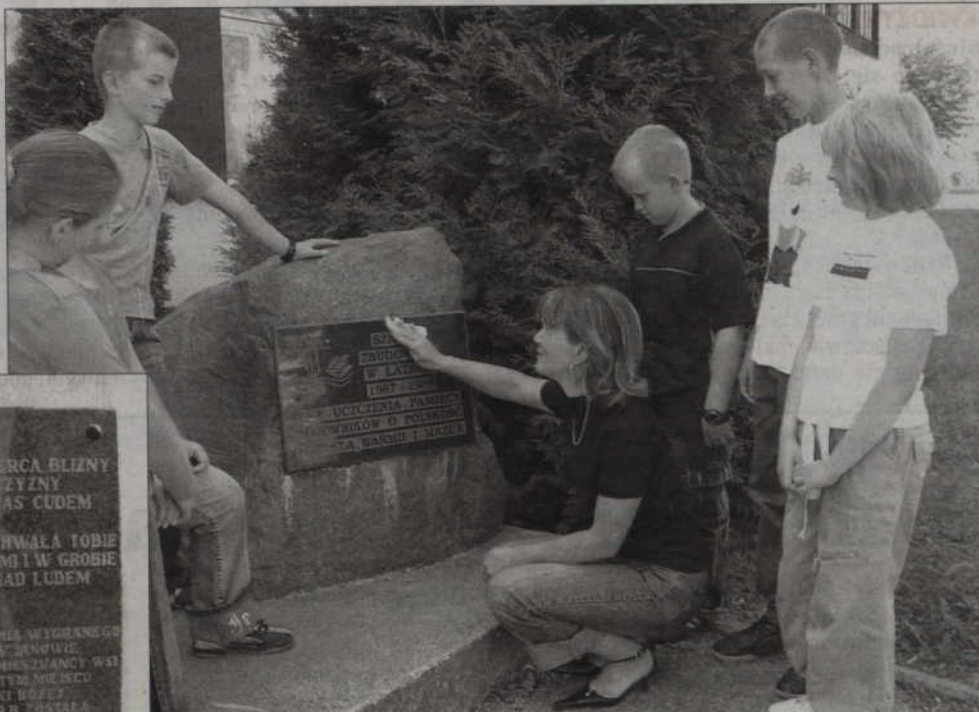
W 2000 roku, w 80 rocznicę Plebiscytu, w Janowie umieszczono pamiątkowy obelisk.