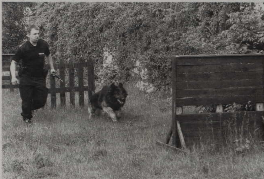
Dzieci przyglądały się tresurze policyjnego psa.