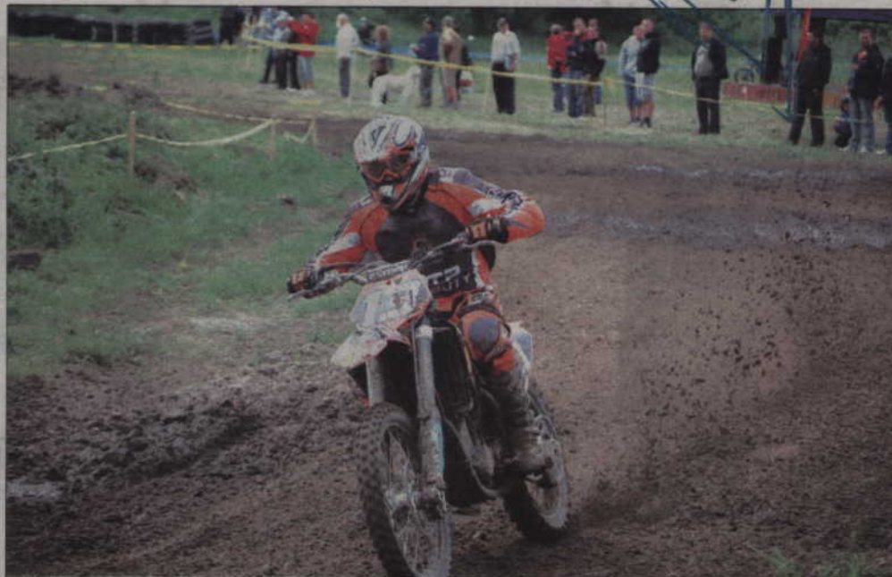
Zawodnicy na prabuckim torze crossowym.