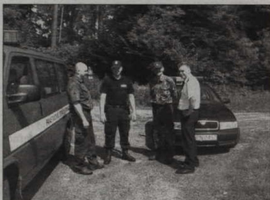
Strażnicy leśni i policjanci wspólnie patrolowali lasy i brzegi jezior, by szukać kłusowników.

- Widok policjantów w towarzystwie przedstawicieli