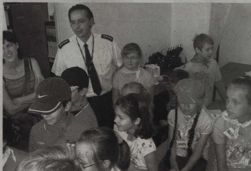
Policjanci opowiadali maluchom o swojej pracy.