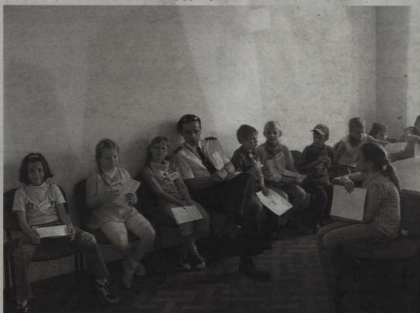
Policjanci opowiadali małym gościom, jak bezpiecznie spędzać wakacje.