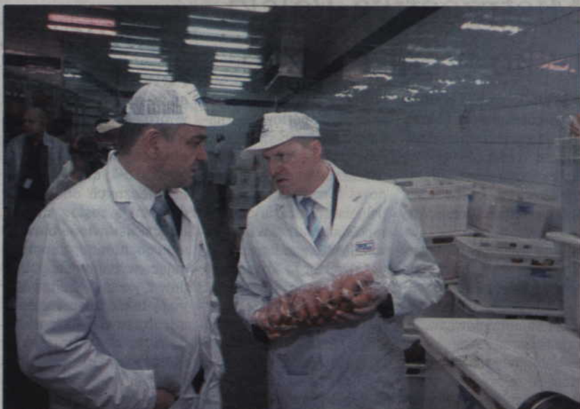
Podczas wizyty w zakładzie masarniczym Waldemar Pawlak z uwagą przyglądał się produkcji.