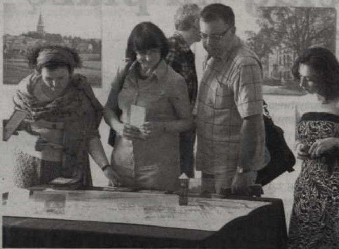
Przedwojenna Gardeja zaciekawała wszystkich oglądających.