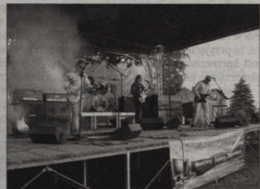
Największą gwiazdą festynu był zespół Nocna Zmiana Bluesa.