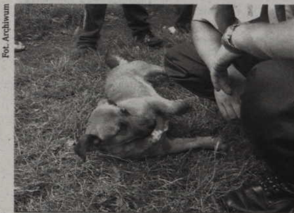
Tego psa potrącił samochód na ulicy Kościuszki.

Zabezpieczyli dziury w jezdni na ul. Wiślanej. Stwarzały one zagrożenie dla pojazdów. Nawierzchnia została zniszczona w wyniku burzy i intensywnej ulewy. Uszkodzona została także ulica Górna. Zapadł się asfalt na odcinku 20 metrów. Przy ulicach Warszawskiej i Kopernika burza, której towarzyszył porwisty wiatr, złamała drzewa.