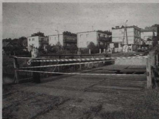
Na ulicy Karowej zarwał się mostek.