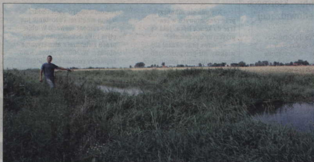
Na zdjęciu: jeden z zatorów utworzonych na rzece w okolicy Pastwy (gm. Kwidzyn).

- Niestety woda na polach ciągle stoi. Nie ma żadnego odpływu. Chyba trzeba czekać aż wyparuje. RZGW twierdzi, że usuwa zatory, ale prace, które są prowadzone nie przynoszą żadnego efektu. Cały czas interweniujemy, ale nie odnosi to