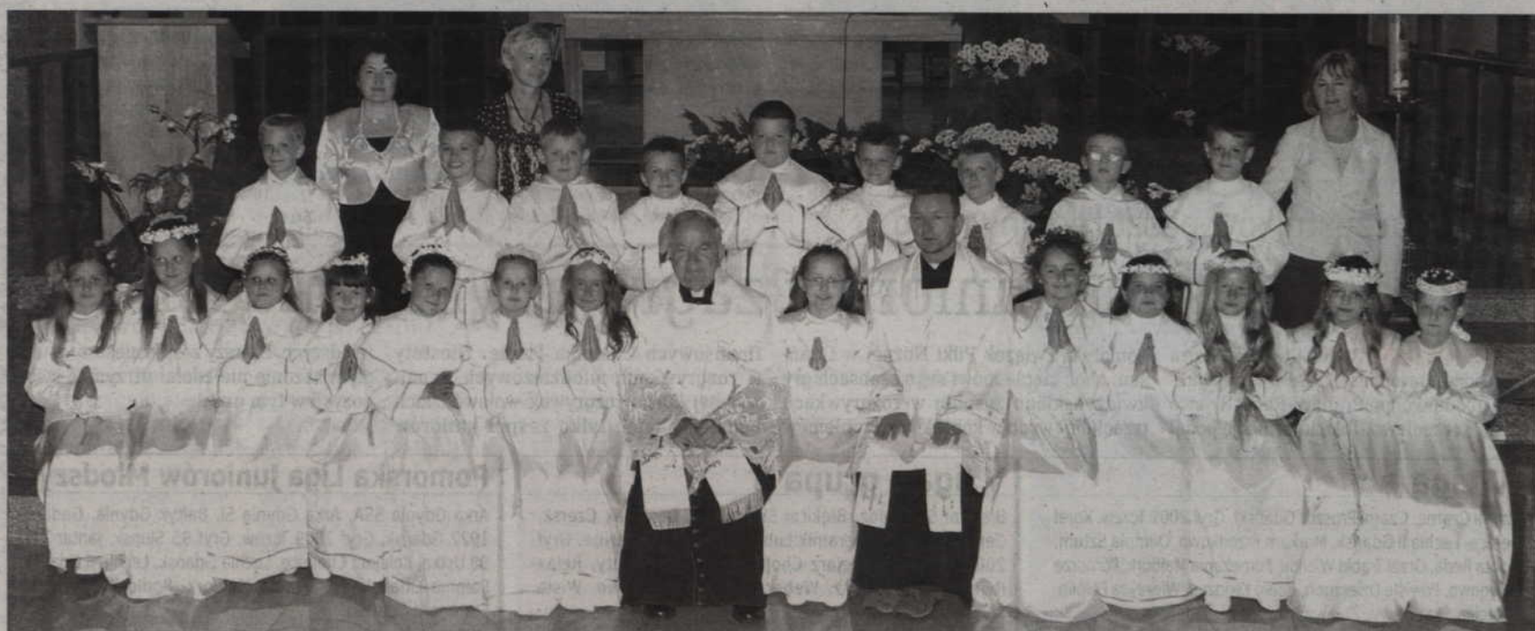
red. tech. - KK