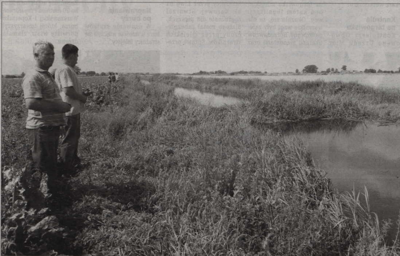
Zatory na rzece Liwie utrudniają odpływ wody z zalanych upraw w gminie Kwidzyn. Rolnicy twierdzą, że woda zamiast spływać kanałami stoi w miejscu. Żądają natychmiastowego ich usunięcia. Na zdjęciu: jeden z zatorów utworzonych na rzece w okolicy Pastwy (gmina Kwidzyn).