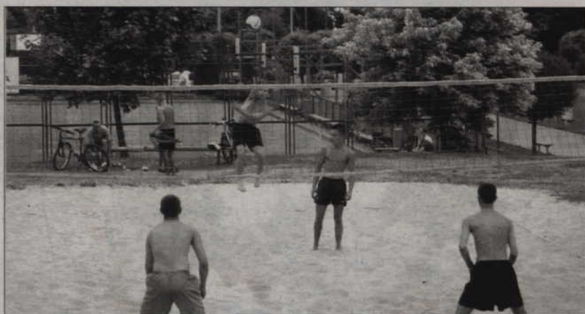
Turniej siatkówki plażowej odbywa się zawsze o godz. 11.00.