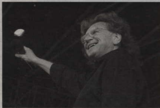
Zbigniew Wodecki.

- Jak wiadomo, na tego rodzaju koncertach nie zarabia się pieniędzy. Dlaczego przyjmuje pan