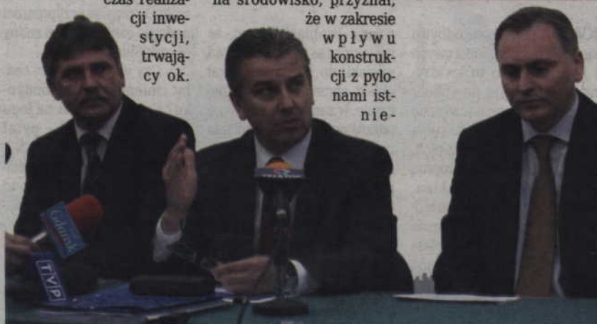
Minister infrastruktury Cezary Grabarczyk w zeszłym roku przyjechał do Kwidzyna i obiecał, że w rządowym budżecie znajdą się pieniądze na „kwidzyński” most.

Do 17 sierpnia wszyscy zainteresowani mogą zapoznać się z raportem środowiskowym o wnieść swoje uwagi i wnioski w formie pisemnej. By to zrobić, należy udać się do Urzędu Gminy Kwidzyn przy ul. Grudziądzkiej 30, do pokoju nr 31.