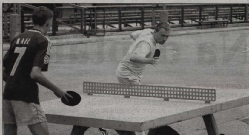
Zmagania pingpongistów odbywają się przy betonowych stołach.