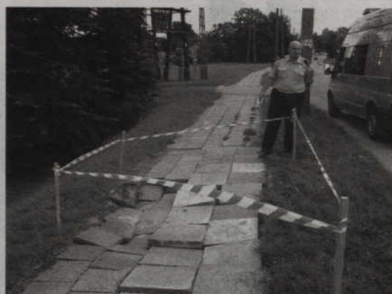
Na ulicy Malborskiej zapadły się płytki chodnikowe.