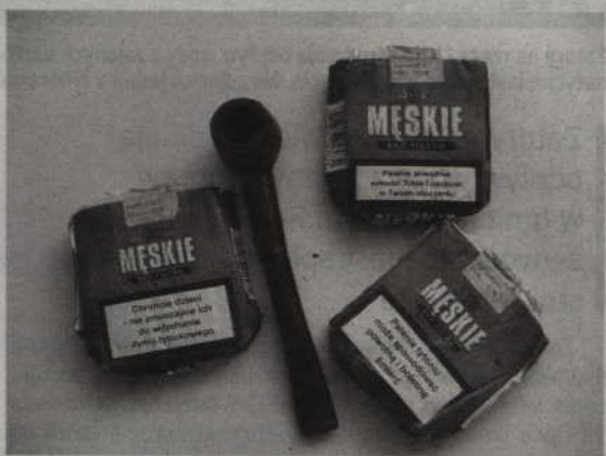
Dwaj młodzi mężczyźni wina ukraść nie zdążyli, ale udało im zabrać z piwnicy papierosy.

Wieczorem 19-latek i jego 18-letni kolega raczyli się alkoholem. Wypili go sporo, jednak ciągle było im mało. Na kupno kolejnej butelki nie mieli jednak pieniędzy. Jeden z nich przypomniał sobie, że jego matka pracowała w ogrodzie u mężczyzny, który w piwnicy pędził swoje wino. Okazało się, że dom jest zabezpieczony, ponieważ właściciel od miesiąca nie żyje. Młodzi mężczyźni wyważyli okienko w piwnicy i weszli do środka. Nie zdą-