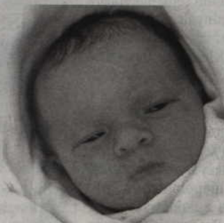
Córka Aliny i Marka Lipskich z Grabowa przyszła na świat 26 lipca o godz. 13.05 (waga: 3,6 kg, długość: 58 cm).