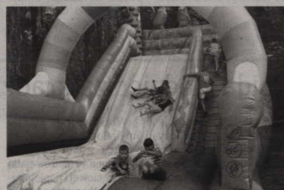
Podczas festynu nie mogło zabraknąć zjeżdżalni.