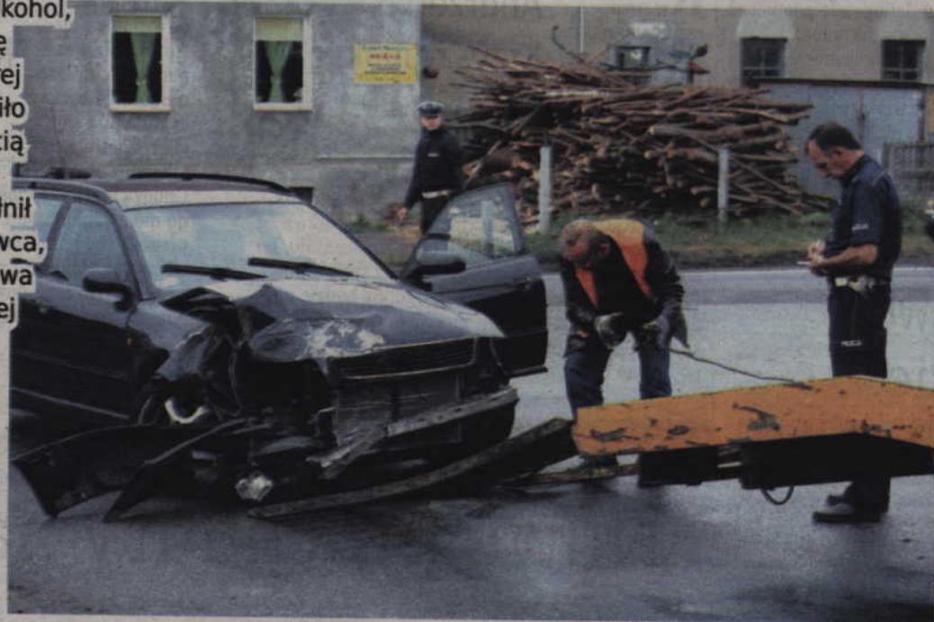
Kolizja drogowa w okolicach Bądek. Nieostrożność i rutyna to wrogowie każdego kierowcy.

Miał prawie 2 promile alkoholu, gdy usiadł za kierownicę opla. Razem z nim czterej pasażerowie. Auto pędziło ulicą Miłosną z prędkością 150 km na godzinę. Do przestępstw, jakie popełnił tego dnia 22-letni kierowca, trzeba doliczyć brak prawa jazdy, które już wcześniej odebrał mu sąd.