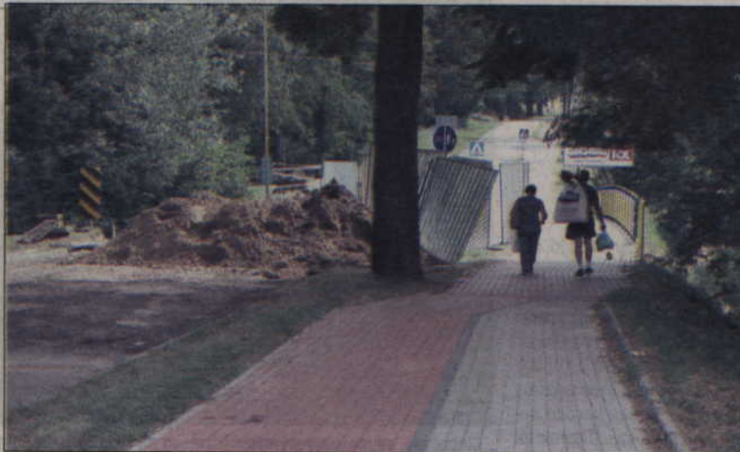
Kierowcy przejeżdżają samochodami po kładce dla pieszych i rowerzystów w Górkach. Władze gminy chcąc ukrócić ów proceder ustawiły metalowe słupki. Te jednak ukradziono po kilku godzinach.