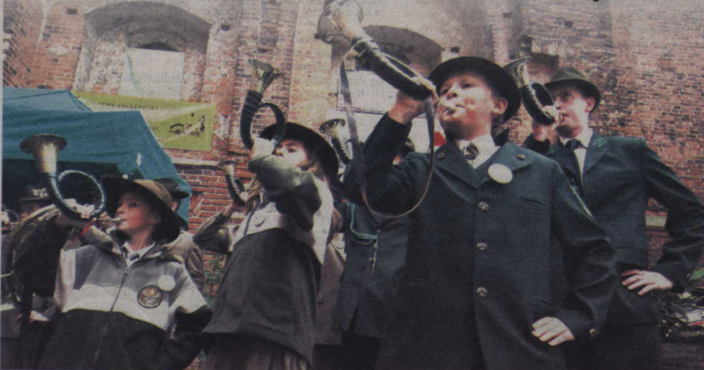
W miniony weekend w na dziedzińcu kwidzyńskiego zamku odbył się IX Powiślański Przegląd Muzyki i Kultury Myśliwskiej im. Tomasza Bielawskiego. Bracia i siostry myśliwscy z całej Białej

KWIDZYN. IX Powiślański Przegląd Muzyki i Kultury Myśliwskiej im. Tomasza Bielawskiego