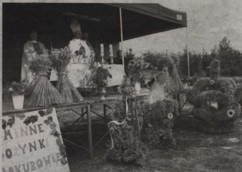
Tradycją dożynek jest konkurs wieńców.