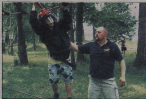
Chętni mogli spróbować swych sił na torze survivalowym.