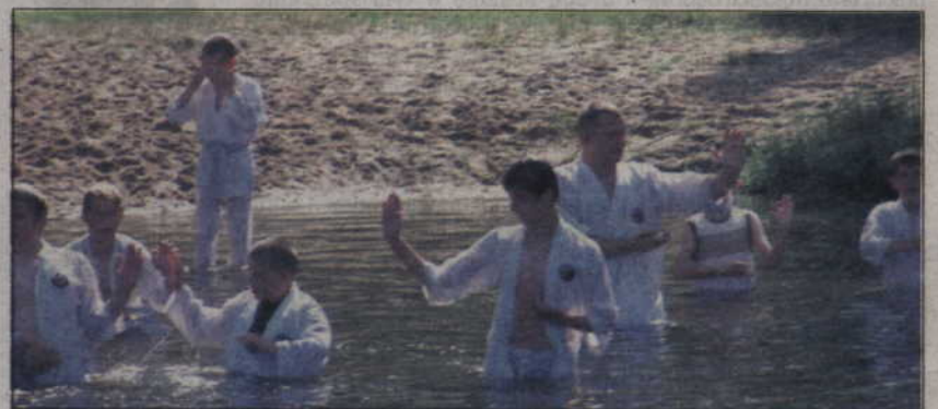
Karatecy trenowali także w wodzie.