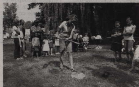
Organizatorzy przygotowali gry i zabawy dla dzieci i młodzieży.