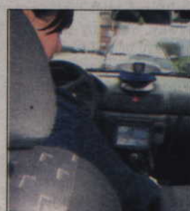
22-latek, który pędził oplem ulicą miłosną, był pijany, podobnie jak jego dwaj nieletni pasażerowie.

pasażerów. Dwójka z nich to 16- i 17-latek będący również pod wpływem alkoholu. Chłopcy wydmuchali po 1,6 promila. Wybrykiem nieletnich zajmie się sąd rodzinny. Za złamanie zakazu sądowego grozi kara do 3 lat pozbawienia wolności. 22-latek odpowie również za brawurą jazdę oraz brak wymaganych podczas kontroli dokumentów. (ad)