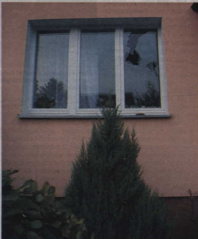
(ad) Młody bandyta, który pobił i okradł człowieka, wpadł w ręce policji, gdy wybiłszy szyby w oknach.

Krewki 21-latek tydzień temu w nocy wtargnął na teren prywatnej posesji w powiecie kwidzyńskim i zaczął rzucać kamieniami i butelkami w okno domu. Powybiłszy szyby, był agresywny i groził jednemu z mieszkańców. Zaalarmowano policjantów, którzy zatrzymali 21-latka. Okazało się, iż jest on sprawcą rozboju sprzed miesiąca, kiedy to napadł, pobił i okradł mieszkańca powiatu kwidzyńskiego. Bił go i kopał po całym ciele, a następnie zabrał mu telefon komórkowy i pieniądze. Mężczyzna usłyszał już zarzuty. Sąd zastosował wobec niego 2 miesiące tymczasowego aresztu. 21-latek odpowie za rozbój. Grozi mu kara do 12 lat pozbawienia wolności.