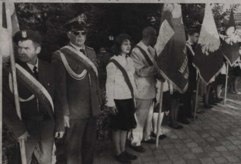
Przedstawiciele organizacji społecznych przed Pomnikiem Pamięci w Prabutach.

■ 70 rocznica wybuchu II wojny światowej