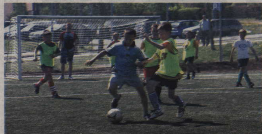
Dwudniowy turniej rozgrywany będzie na boisku Orlik na osiedlu Piastowskim.