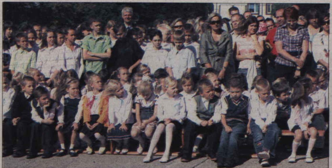
Miejskie uroczystości rozpoczęcia nowego roku szkolnego z udziałem władz samorządowych odbyły się w tym roku w Szkole Podstawowej nr 2.

- Będzie nauka, ale będzie też zabawa. Klasy bardziej przypominają sale, które są w przedszkolu. Po raz pierwszy klasy pierwsze rozpoczną naukę według nowej podstawy programowej.