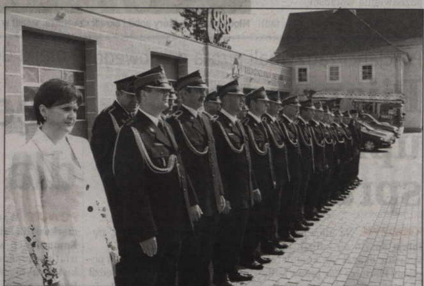
W siedzibie kwidzyńskiej straży pożarnej odbyła się uroczystość pożegnania komendanta oraz powołania nowego.