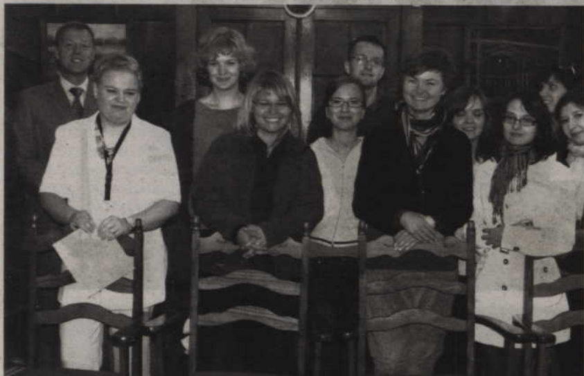
Studenci Akademii Medycznej w Gdańsku na praktykach w prabuckim szpitalu.

PRABUTY. Do Prabut przyjechała grupa studentów Akademii Medycznej w Gdańsku, którzy w ramach dwutygodniowego obozu odbywać będą praktyki w prabuckim szpitalu.