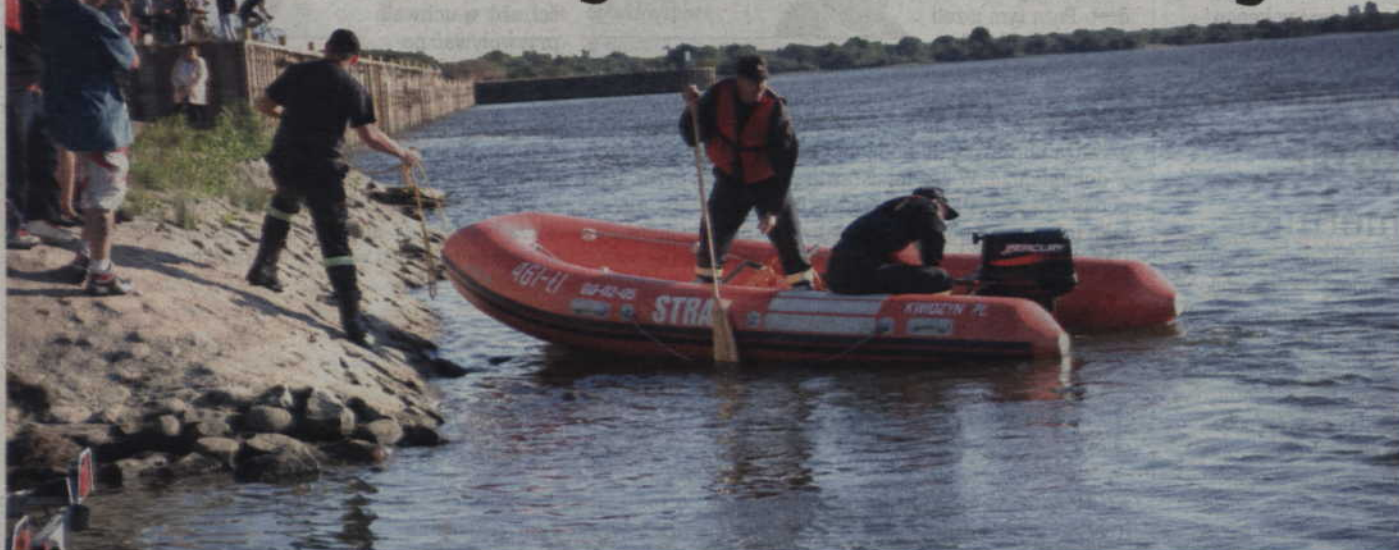
Trwa akcja poszukiwawcza na Wiśle. Ratownicy szukają ciała mężczyzny, który prawdopodobnie chciał odebrać sobie życie wskakując do rzeki.