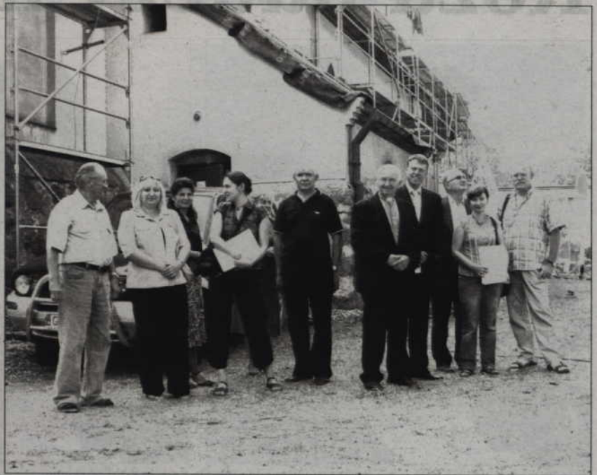
Przed kościołem w Obrzynowie. Trwa tam właśnie remont dachu.

konsultowali technologię i metody odnowienia sufitu w kościele. Wizyta była też okazją do wstępnego zaplanowania remontu w kościele w Gdakowie oraz dachu Bramy Kwidzyńskiej. Goście zwiedzili też zabytkowe wodociągi