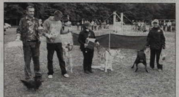
Zwycięcy w kategorii „Psiej piękności”.