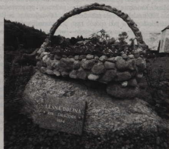
Ogrody działkowe „Leśna Dolina” założono w 1984 roku.

- Zdarzało się wiele razy, że niszczone drzwi i wynoszono ze środka co się dało - sztucze czajniki i inne niezbyt cenne