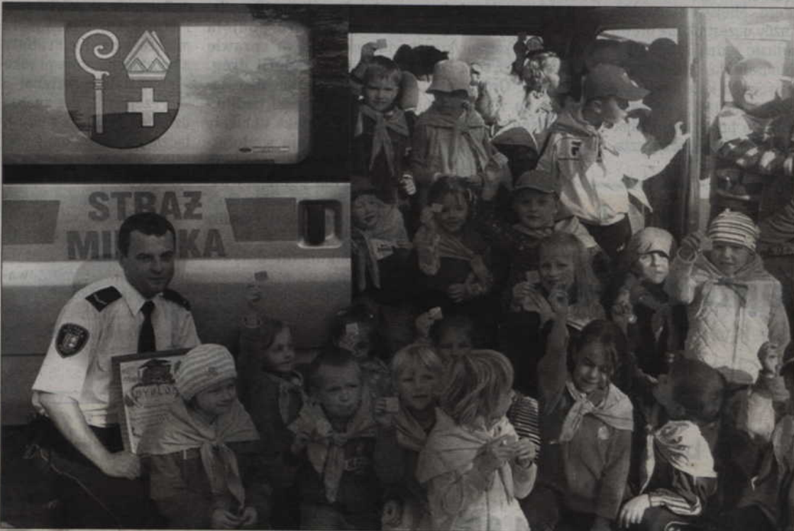
KWIDZYN. Dzieci z Przedszkola „Chatka Puchatka” odwiedzili siedzibę Straży Miejskiej. Maluchy mogły obejrzeć komendę, a także sprzęt, którym dysponuje straż, dowiedzieć się jak wygląda codzienna praca strażnika. Dzieci wsiadły też do pojazdu służbowego. Wszystkim zrobiono pamiątkowe zdjęcie.