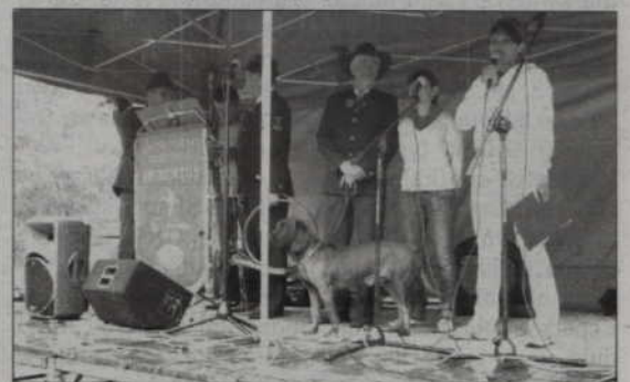
Ważny moment ogłoszenia wyników konkursu.