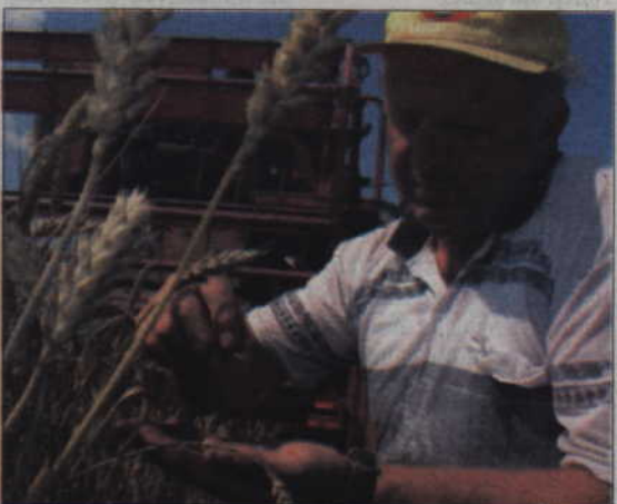
Wiele hektarów ziemi leżących odłogiem na Pomorzu po zakupie rolników może dać obfite plony.