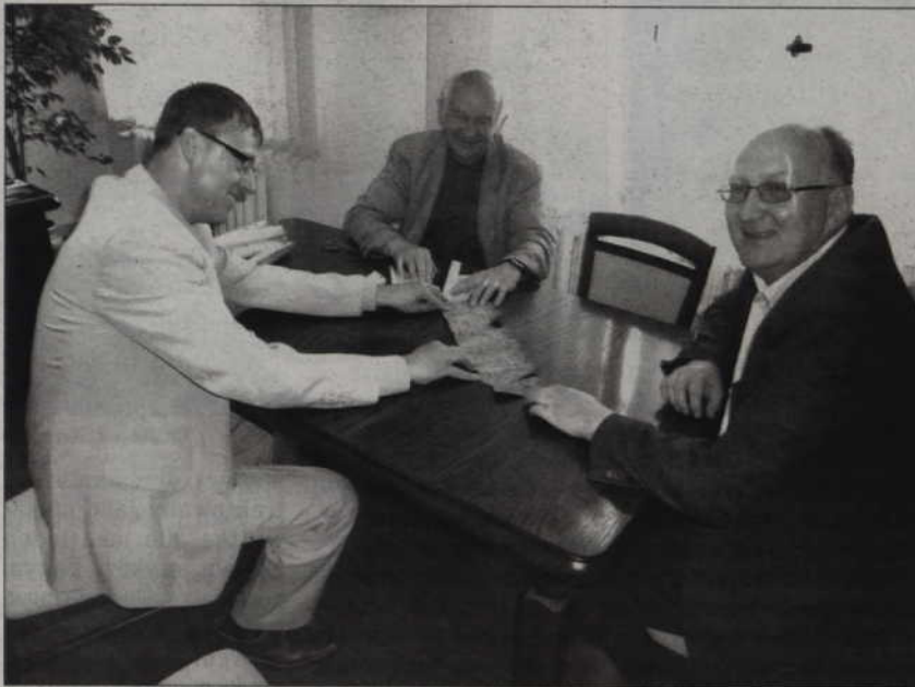
Konserwatorzy mieli okazję zobaczyć niedawne znalezisko w obrzynowskim kościele - broszury i list na pergaminie z lat 1899 - 1910.

W trakcie spotkania, które miało konsultacyjno - roboczy charakter, dokonano odbioru odnowionych właśnie witraży w prabuckiej konkatedrze i skontrolowano prace w Kościele Polskim w kościele w Obrzynowie, gdzie remontowany jest dach. Konserwatorzy