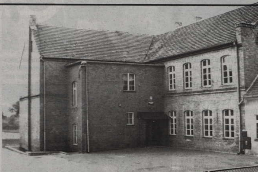
Budynek zlikwidowanej kilka lat temu Szkoły Podstawowej nr 3 przy ul. Malborskiej, nadal świeci pustkami.