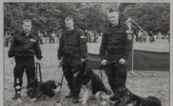
Najlepsze policyjne psy służbowe i ich opiekunowie.