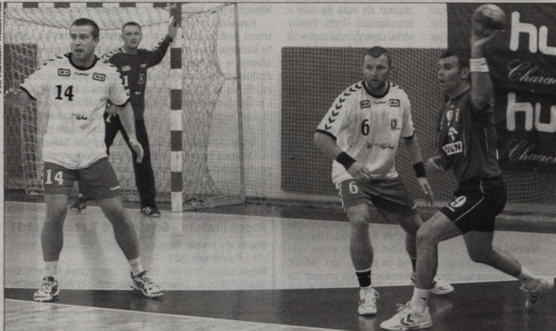
Po dwóch zwycięstwach przyszła porażka z Wisłą Płock. Nafciarze skutecznie wykorzystali indywidualną grę kwidzyńskiego zespołu.