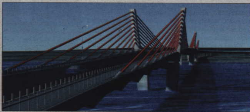
Będzie most na Wiśle - zapewnią min. Nowak

POMORZE. Na mistrzostwa piłkarskie ma być gotowa obwodnica południowa Gdańska. Dwujezdniowa droga ekspresowa S-7 łączy autostradę A-1, obwodnicę Trójmiasta z drogą krajową nr 7 w miejscowości Koszwały. Jest także zgoda (i zapewnienie o środkach finansowych) na budowę mostu na Wiśle w Kwidzynie.