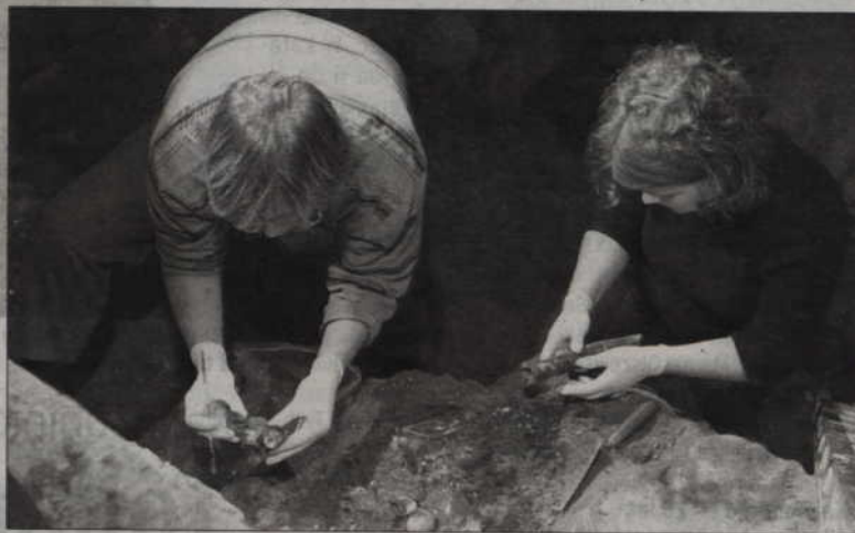
Odkrycie szczątków wielkich mistrzów krzyżackich w katedrze nie doczekało się jeszcze odpowiedniej ekspozycji. Samorządowcy poprosili o opinię aktualnego mistrza zakonu rezydującego w Austrii.

Dwa lata temu Kwidzyn stał się na chwilę sławny w całej Polsce, dzięki sensacyjnemu odkryciu w katedrze. Szczątki trzech mistrzów krzyżackich są sensacją, bo nigdzie indziej nie zachowały się takie pochówki. Czy miasto wykorzystało tę wielką szansę na promocję. Na razie nie.