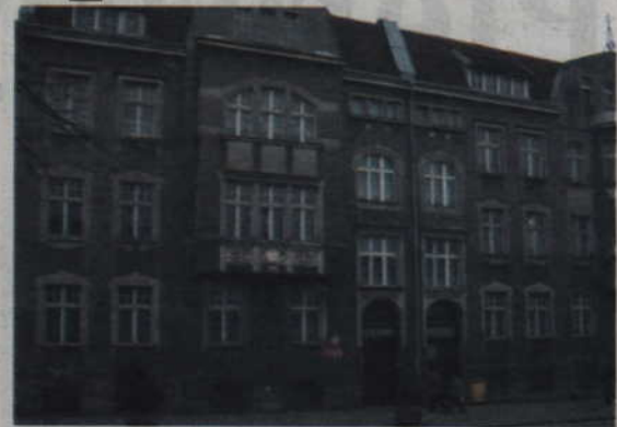
Budynek Domu Dziecka stoi pusty od końca ubiegłego roku, kiedy dzieci wyprowadziły się do mniejszych placówek.