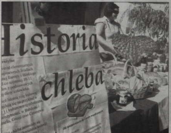
Swoje wyroby zaprezentowali też kwizdyńscy piekarze.