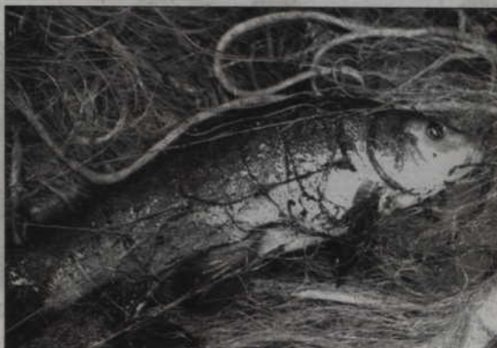
Porażonych prądem zostało ok. 50 kg ryb.