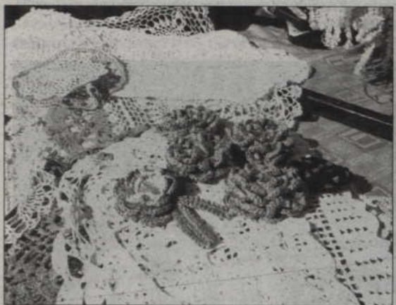
Szydełkowe cudowna wykonane przez panią Grażynę Śliwińską.