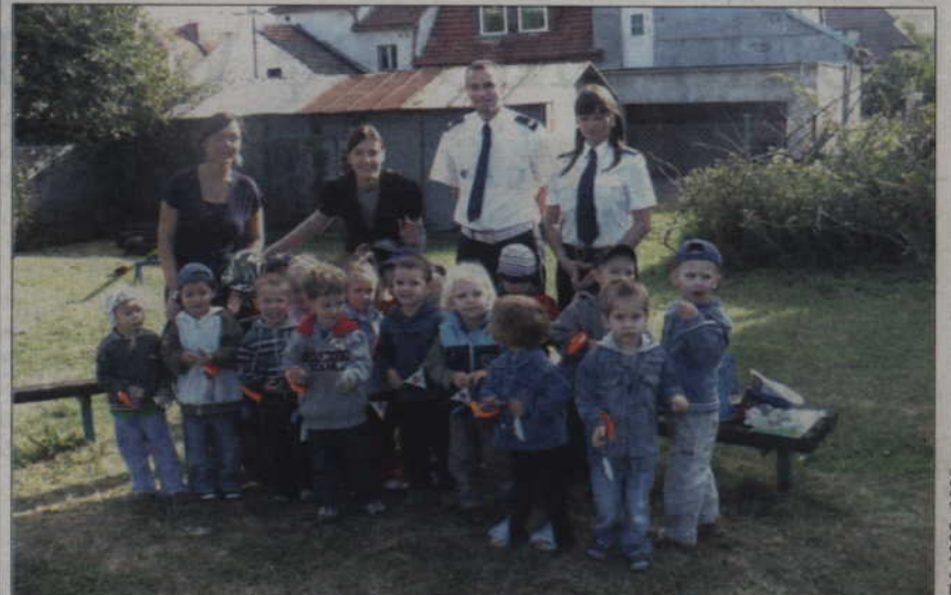
Pamiątkowe zdjęcie policjantów i przedszkolaków.