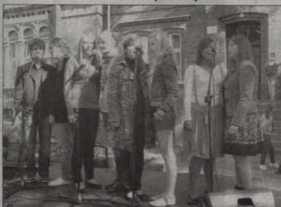
Atrakcją imprezy były występy artystyczne. Na zdjęciu: młodzi wokaliści z Klubu Dobrej Piosenki.