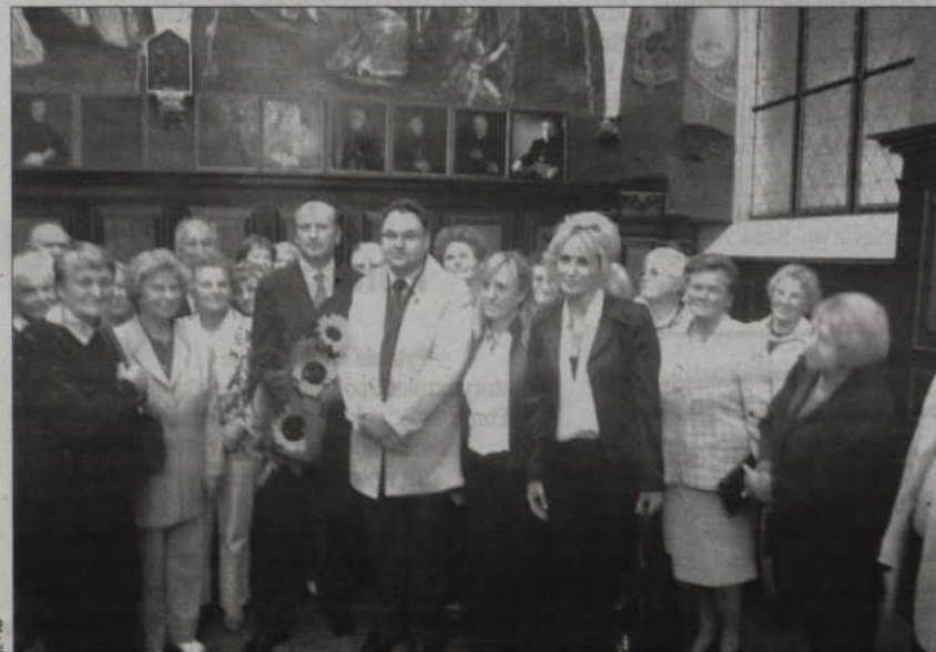
Uczestnicy prabuckich uroczystości.