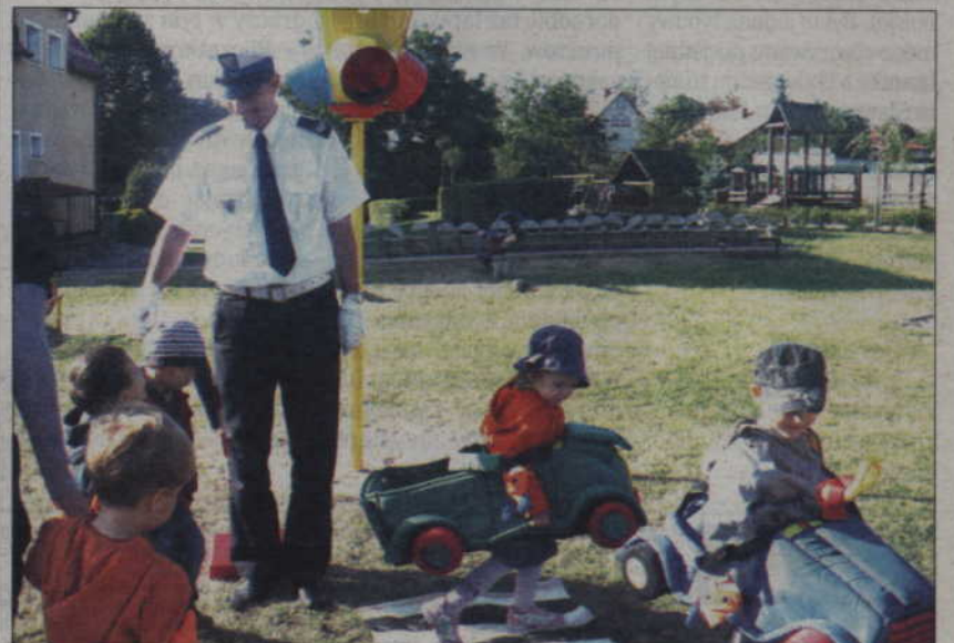
Jak poruszać się na ulicy? Ćwiczenia praktyczne na podwórku.