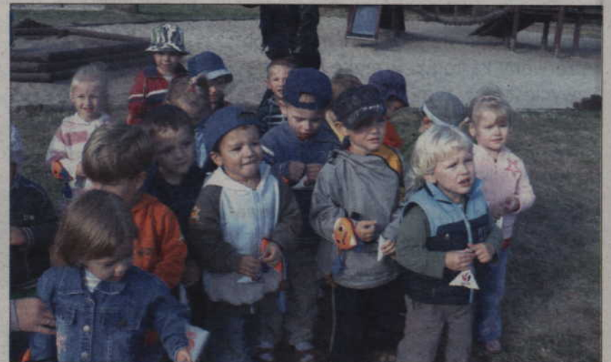
Policjanci odwiedzili grupę trzylatków w przedszkolu „Chatka Puchatka”.

Funkcjonariusze kwidzyńskiej drogówki odwiedzili najmłodszą grupę dzieci w przedszkolu „Chatka Puchatka”. Policjanci opowiedzieli im o zasadach poruszania się na drodze.