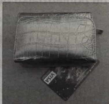
Portfel skradziony sprzedawczyni i karta, którą złodziej próbował wypłacić pieniądze z bankomatu.