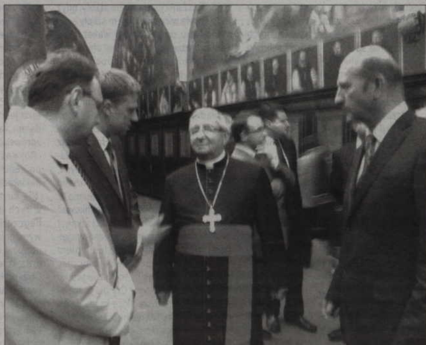
Mszę odprawił arcybiskup gdański gen. Sławoj Leszek Głódź w asyście biskupów, infułatów i prałatów diecezji gdańskiej.

grafiki obrazujące dążenia niepodległościowe od powstania kościuszkowskiego do 20-lecia międzywojennego.