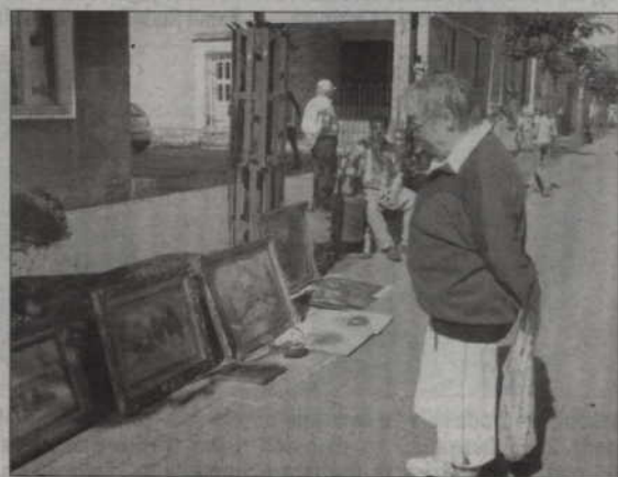
Na jarmarku znalazły się też stoiska z obrazami.