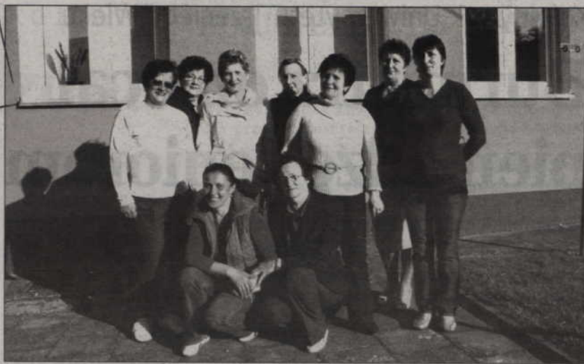
Panie z Koła Gospodyń Wiejskich w Tychnowach, zwyciężczynie naszego plebiscytu. Otrzymały 104 głosy.