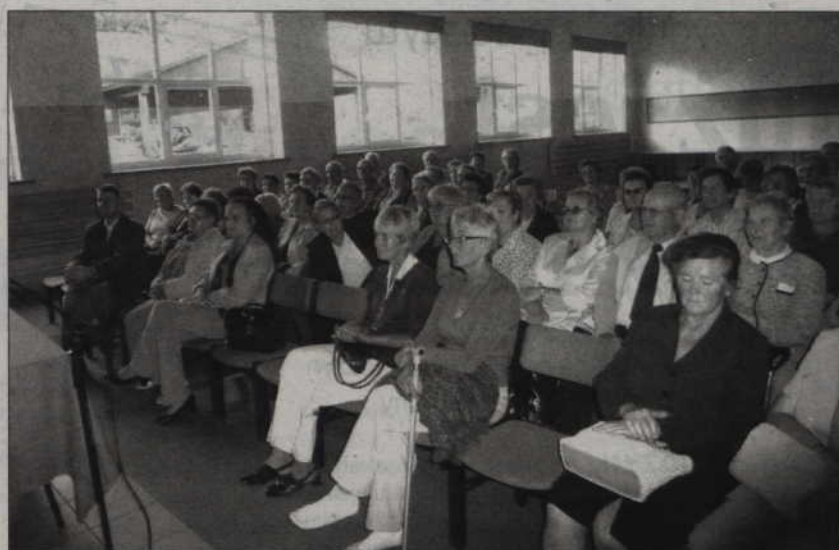
Spotkanie studentów - seniorów odbyło się w prabuckim domu kultury.