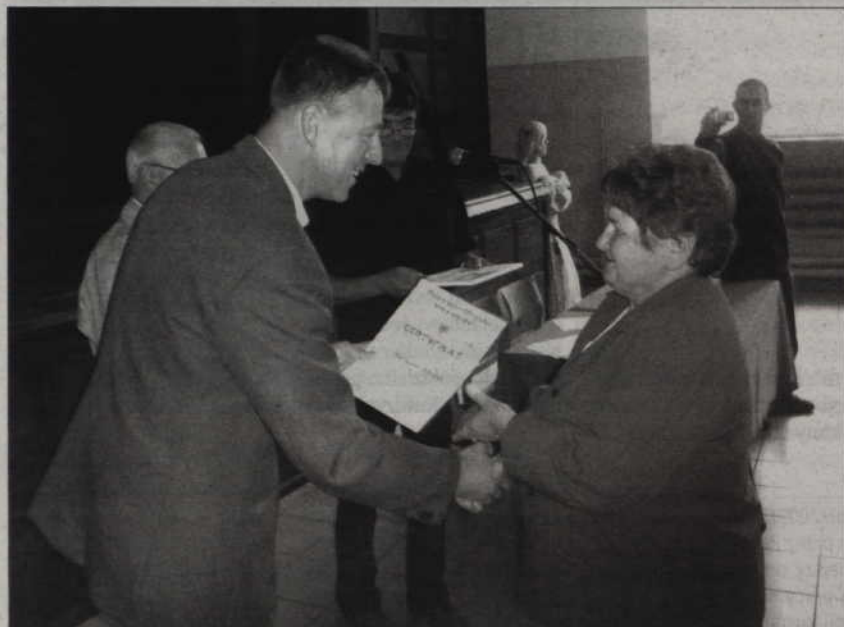
Wręczenie certyfikatów zaliczenia ubiegłorocznych zajęć.