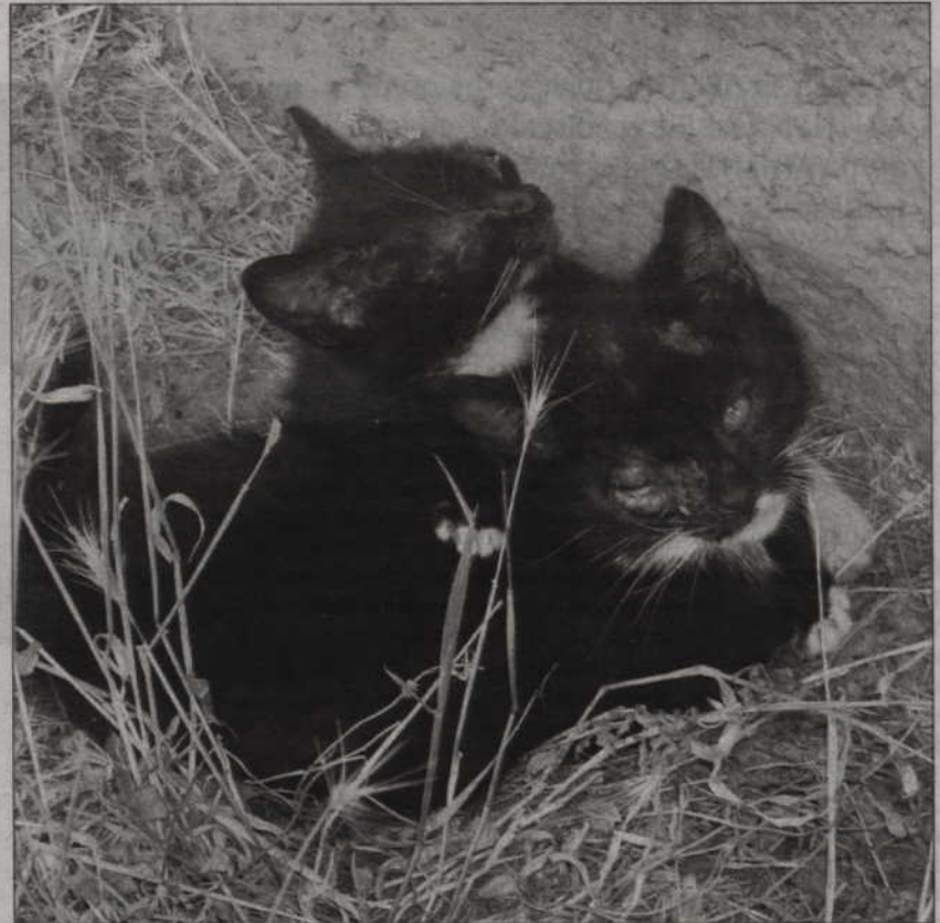
Dziki koty wcale nie wyglądają groźnie...

Być może nie wszyscy zdają sobie sprawę jak surowo karane są tego typu wykroczenia. W myśl podanej na wstępie ustawy: „Ten kto zabija, uśmierca zwierzę albo znęca się nad