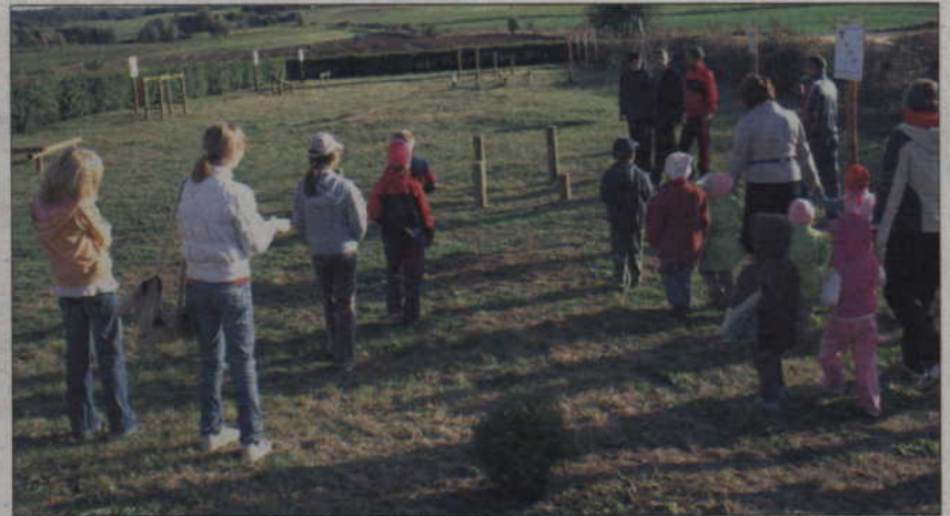
Ścieżka zdrowia przy gardejskim przedszkolu składa się z czternastu punktów ćwiczeniami dla dzieci i dorosłych.