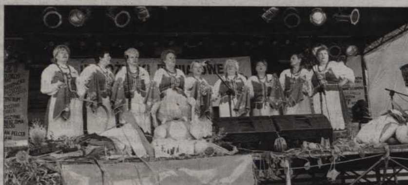
14 listopada o godz. 11.00 w Teatrze Miejskim w Kwidzynie odbędzie się uroczysty koncert z okazji 10-lecia istnienia zespołu ludowego Powiślanki.

22:00 Gwiazda wieczoru - BOOGIE BOYS Bilety w cenie: 20 zł do nabycia w kasie teatru, rezerwacja telefoniczna 055 279 34 24, 055 279 20 08.