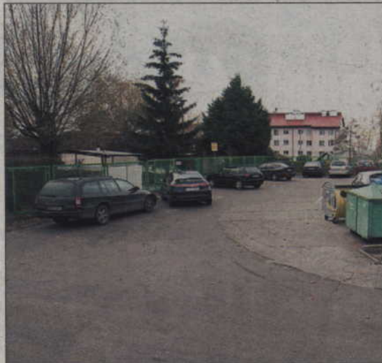
Parking ma powstać między przedszkolem a budynkami mieszkalnymi.