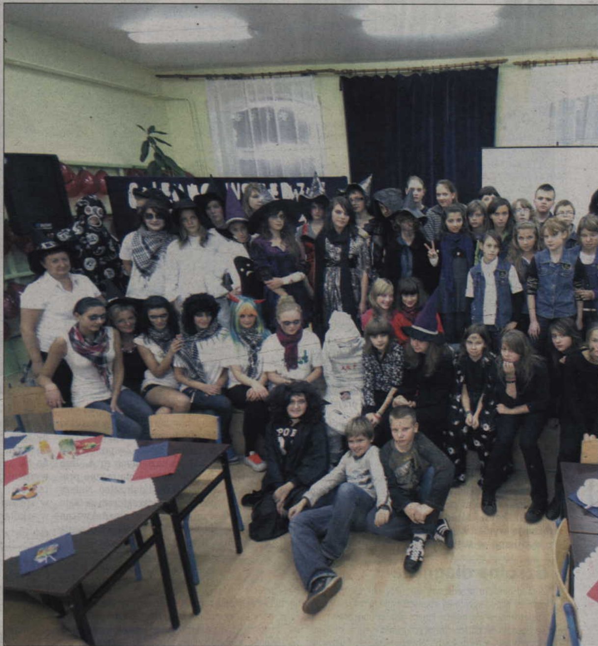
Do gimnazjum nr 1 przysli uczniowie z innych szkół podstawowych

Uczniowie i nauczyciele kwidzyńskiego Gimnazjum nr 1 bawili się razem. Gimnazjaliści zaprosili do zabawy uczniów wszystkich kwidzyńskich szkół podstawowych.