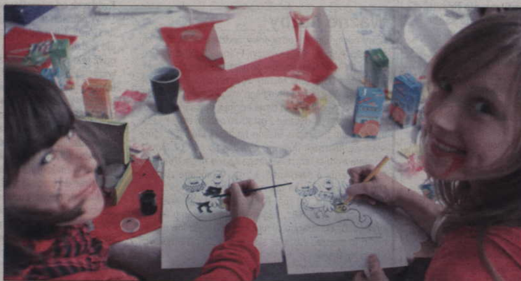
Szkolna zabawa w Gimnazjum nr 1

- Uważam, że to dobry pomysł, pilni uczniowie będą mogli się pochwalić swoimi sukcesami nie tylko na forum szkoły, ale dzięki