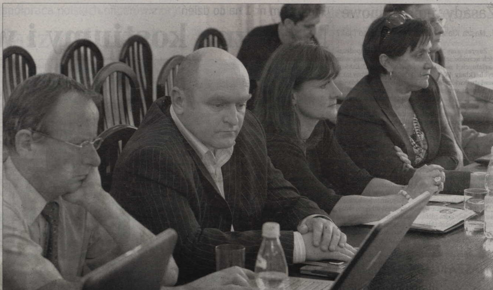
Radni powiatu kwidzyńskiego dyskutowali o przyszłości oświaty.