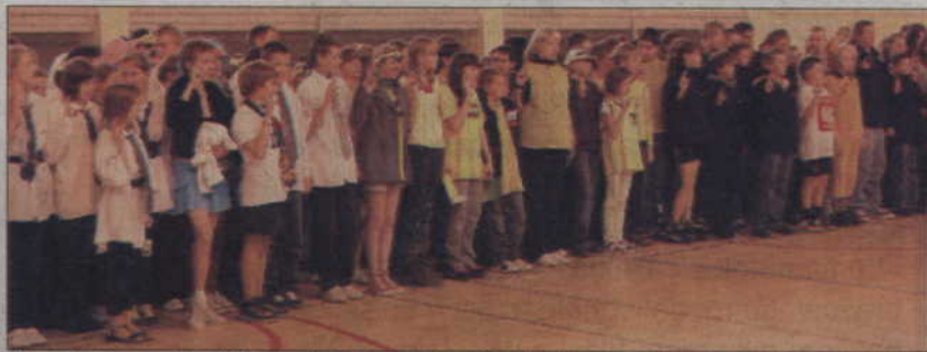
Chrzest pierwszoklasistów w gimnazjum nr 3 w Kwidzynie.