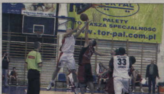
Kwizdynianie nawiązali walkę tylko w pierwszej połowie meczu z Gniewinem.

Na przerwę zespoły schodziły przy stanie 29:30, więc po zmianie stron jeszcze wszystko mogło się wydarzyć.