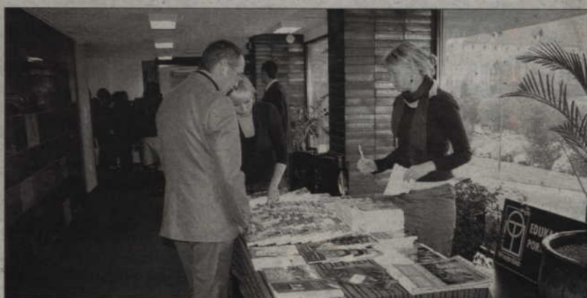
Podczas konferencji można było zaopatrzyć się w różnego rodzaju specjalistyczne publikacje.