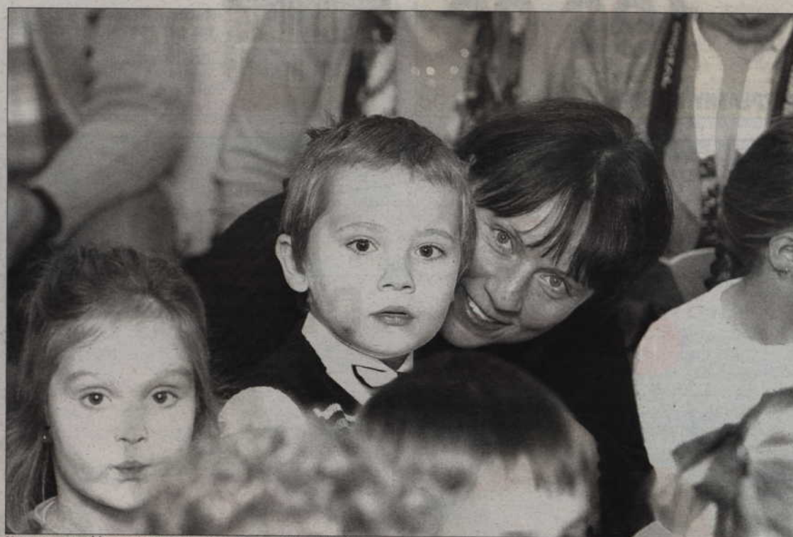
Na uroczystość przedszkolaki zaprosiły swoich rodziców.