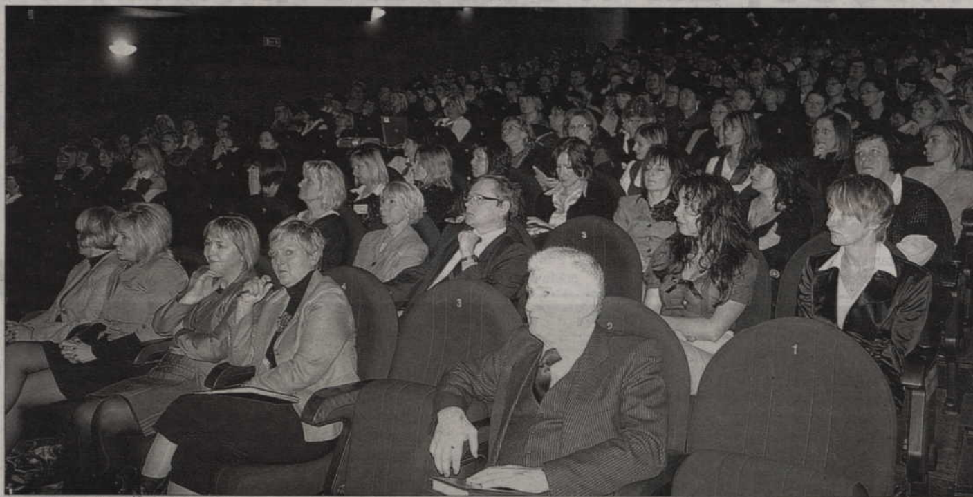
Ponad 200 osób wzięło udział w konferencji poradni psychologiczno-pedagogicznych województwa pomorskiego.

Gospodarzami drugiej Pomorskiej Konferencji Poradni Psychologiczno-Pedagogicznych, oprócz kwidzyńskiej poradni, byli Starostwo Powiatowe oraz Urząd Miejski w Kwidzynie.