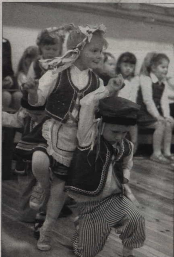
Na zakończenie dzieci z Przedszkola Ekologicznego zaprezentowały ludowe tańce.

W Przedszkolu Ekologicznym odbył się wyjątkowy konkurs recytatorski. Wiersze, związane z niedawną rocznicą odzyskania przez Polskę niepodległości, mówiły dzieci z kilku kwidzyńskich przedszkoli. Na to odświętne spotkanie zaproszono też rodziców przedszkolaków, dwoje z nich na zakończenie konkursu także wygłosiło okolicznościowe wiersze. Choć wszystkich wykonawców oceniała specjalna komisja, to nie wyłoniono zwycięzców, zdecydowano, że nagrody otrzymają wszystkie dzieci. Finałem imprezy było krótkie przedstawienie w wykonaniu gospodarzy, czyli dzieci z Przedszkola Ekologicznego. Maluchy zaśpiewały pieśni patriotyczne i odtńczyły ludowe tańce.