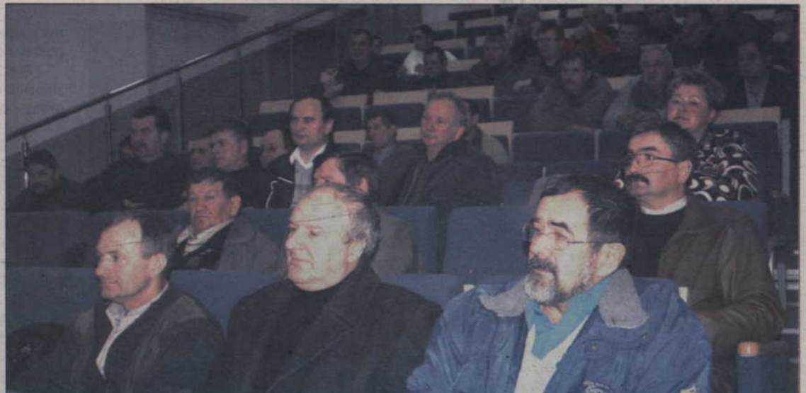
Rolnicy obecni na nadzwyczajnym spotkaniu Zrzeszenia Plantatorów Warzyw i Owoców zapowiedzieli, że nie będą podpisywali umów z Warmińskimi Zakładami Przetwórstwa Owocowo-Warzywnego w Kwidzynie.

zakładem zdarzały się różne sytuacje, ale nawet w najtrudniejszych czasach tak źle nie było. Dzisiaj trudno mówić o jakiegokolwiek współpracy. Decyzja o areale przewidzianym pod kontraktację podejmowana była zwykle we wrześniu. Nowy zarząd WZPOW, który rozpoczął pracę pod koniec ubiegłego roku, przedstawił nam wówczas jedyną alternatywę, jaką było obniżenie ceny. Część z nas nie przyjęła oferty, ale większość była zmuszona to zrobić z powodu poniesionych nakładów. Mało korzystne dla nas warunki zostały poddane renegotjacji w czasie siewów. Pojawiła się wtedy próba wydłużenia terminów płatności, szczególnie drugiego. Nie zgodziliśmy się, gdyż już wtedy wiedzieliśmy, że jest to metoda małych