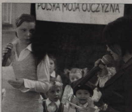
Wystąpili także rodzice przedszkolaków.