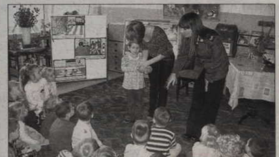
Na spotkaniu z policjantami przedszkolaki poznały zasady ruchu drogowego.