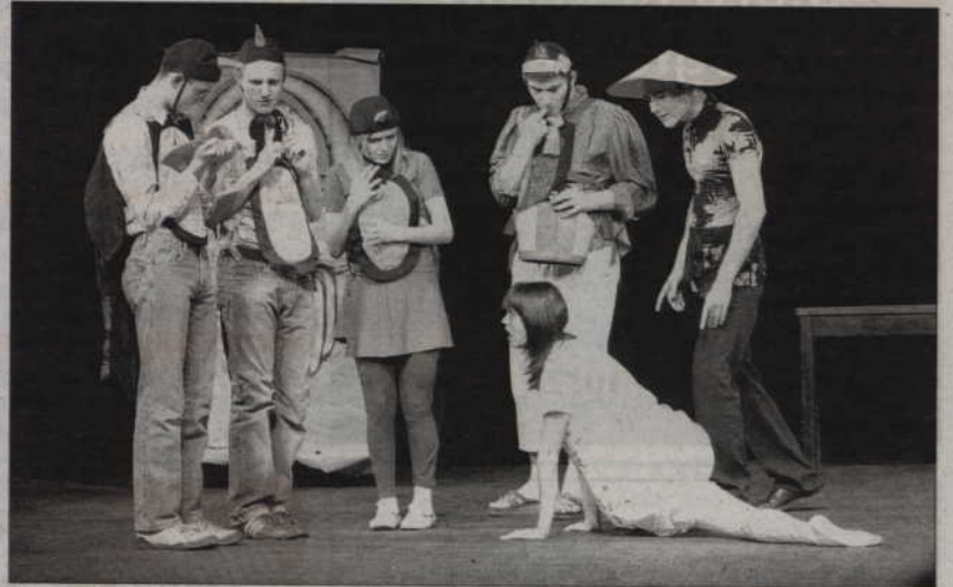
Na scenie kwidzyńskiego teatru wystąpią grupy aktorskie szkół i przedszkoli powiatu kwidzyńskiego.

Występy potrwają do soboty (z przerwą w piątek). Najpierw wystąpią uczniowie szkół podstawowych i gimnazjów, potem szkół ponadgimnazjalnych, a na koniec, w sobotę, przedszkolaki. Od lat imprezę organizuje Kwidzyńskie Centrum Kultury oraz działający w nim amatorski teatr Scena2, który założył i prowadzi Adama Karaś.