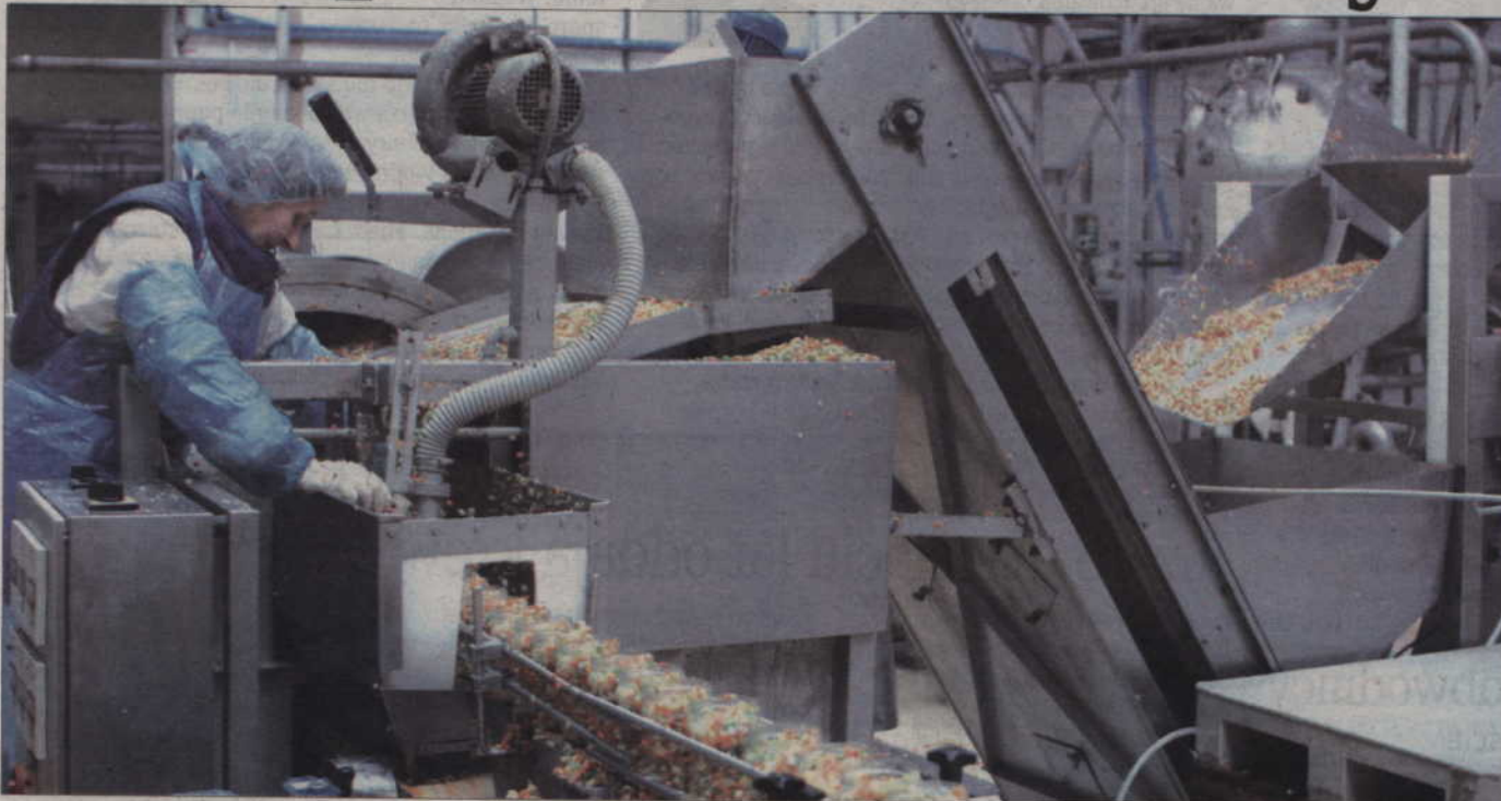
Podstawą produkcji Warmińskich Zakładów Przetwórstwa Owocowo - Warzywnego są wyroby z warzyw, które firma skupuje od okolicznych plantatorów.