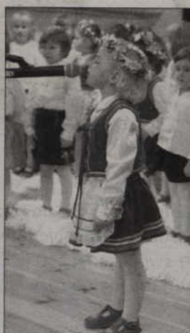
Dzieci recytowały patriotyczne wiersze.