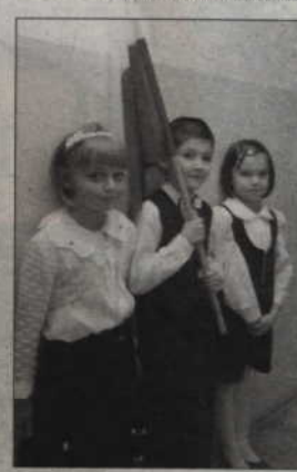
Spotkanie w przedszkolu zorganizowano z okazji rocznicy odzyskania przez Polskę niepodległości.