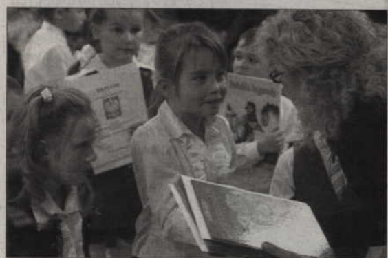
Wszyscy uczestnicy konkursu otrzymali nagrody.