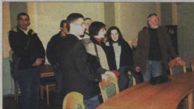
Burmistrz oprowadził niepełnosprawnych po Urzędzie Miejskim. Odwiedzili m.in. salę obrad rady miejskiej.