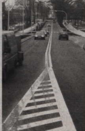
Obwodnica będzie miała 2855 m długości, dwa pasy jezdni, każdy o szerokości 3,5 m.

Osobiście czuję dużą satysfakcję, że udało się nam zakończyć tak dużą inwestycję. Zaplanowaliśmy uroczystość oddania do użytku obwodnicy na 4 grudnia. Trwają obecnie odbiory techniczne. Po ich zakończeniu wystąpimy o pozwolenie na użytkowanie obwodnicy. Powinniśmy je uzyskać do 2 grudnia, czyli na dwa dni przed oficjalnym otwarciem. Wykonawca zakończył prace przed terminem. Mogły one trwać do 30 listopada. Dzięki temu odbiory techniczne mogły rozpocząć się szybciej. Zapraszamy na uroczystość oddania do użytku obwodnicy marszałka województwa pomorskiego, wojewodę oraz wszystkich, którzy przy niej pracowali. Planujemy przepiłowanie belki na moście na