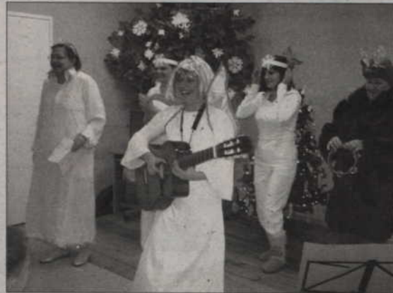
Panie bibliotekarki na scenie

Przedszkole Chatka Puchatka i Integracyjne