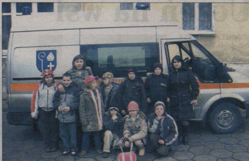
Dzieci z Ośrodka Szkolno-Wychowawczego w Barcicach odwiedziły strażników miejskich.

Dzieci zobaczyły, na czym polega praca strażnika miejskiego i utrwaliły sobie podstawowe zasady ruchu drogowego. Największą atrakcją była możliwość samodzielnej obsługi kamer monitorujących miasto oraz obejrzenia samochodu służbowego. Dzieci z Barcic mogły wsiąść do pojazdu i oczywiście użyć sygnałów świetlnych i dźwiękowych. Na zakończenie odwiedzin