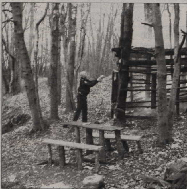
Niektórzy bezdomni niechętnie korzystają ze schronisk, bo musieliby tam przestrzegać regulaminu, który zakazuje m.in. picia alkoholu. Wołać spać altankach, na dworcach albo skleconych samodzielnie szopkach. Jednak z takich budowli (na zdjęciu) została niedawno podpalona i zniszczona.