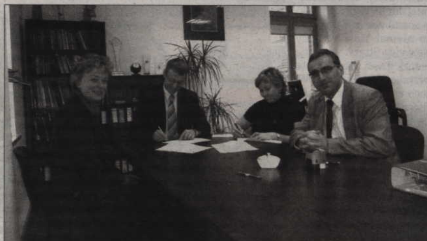
Pieniądze z programu mają pomóc zdobyć wykształcenie niepełnosprawnym uczniom z gminy Prabuty.

Idea programu jest pomoc w zdobyciu wykształcenia przez osoby niepełnosprawne zamieszkujące tereny wiejskie gminy Prabuty. W ramach 26 138 zł dofinansowania wytypowani niepełnosprawni uczniowie będą mogli pokryć koszty dostępu do internetu, biletów dojazdu