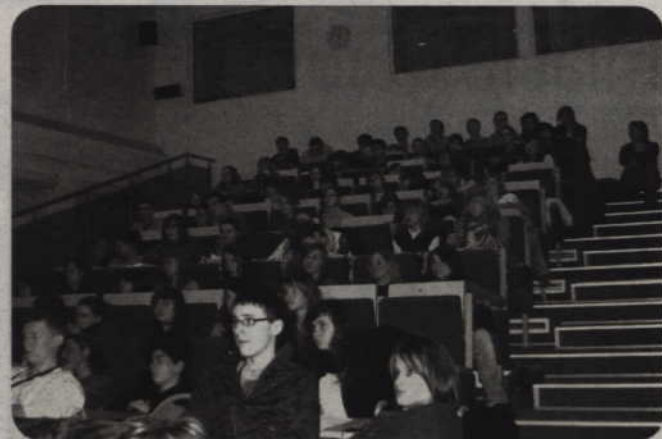
28 stypendiów przyznał studentom samorząd miasta. Studenci będą otrzymywali 350 zł przez dziewięć miesięcy roku akademickiego. Dodatkowo przyznano 4 stypendia naukowe.

28 stypendiów przyznał studentom samorząd miasta. Studenci będą otrzymywali 350 zł przez dziewięć miesięcy roku akademickiego. Dodatkowo przyznano 4 stypendia naukowe. Osoby te otrzymywać będą od miasta 650 zł miesięcznie.