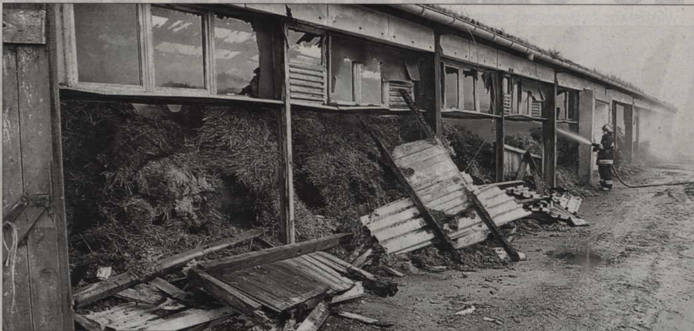
Podpalacz podłożył ogień w dużym gospodarstwie w Półku. Spłonęła obora i stodoła. Straty szacuje się na kilkaset tysięcy złotych.

Pożar gospodarstwa w Półku nadal budzi wiele emocji. Zatrzymano już 18-letniego podpalacza, który jednak, jak podejrzewa nadkom. Jan Kościuk, rzecznik prasowy Komendy Wojewódzkiej Policji w Gdańsku, złożył fałszywe zeznania posadzając policjantów o pobicie.