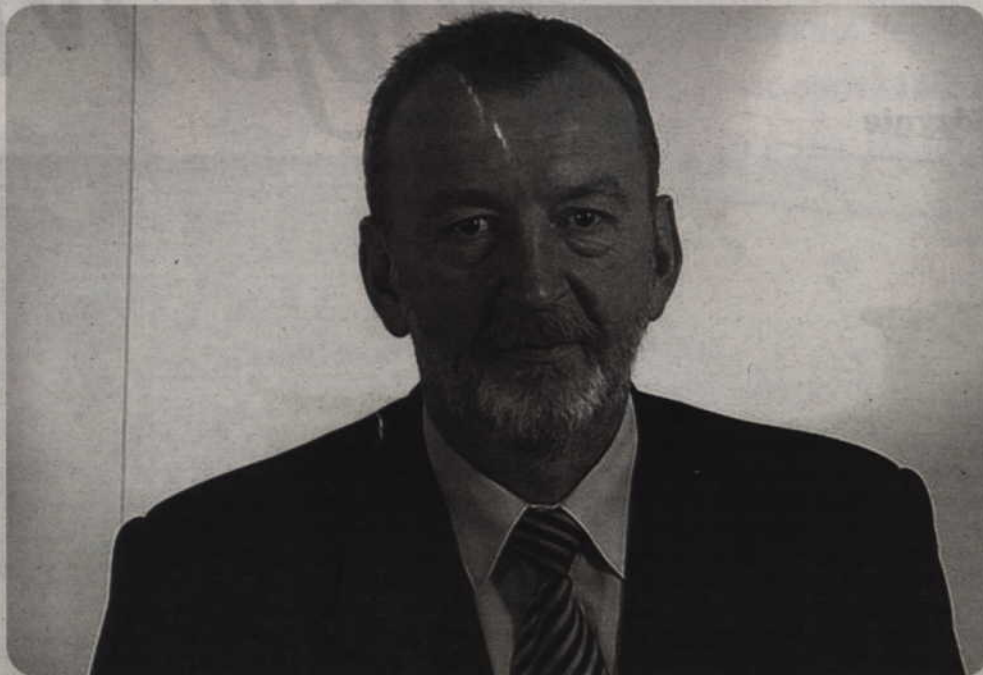
- Mimo pesymistycznych prognoz rok okazał się dobry dla miasta. Możemy go zamknąć z podniesionym czołem. Tempo rozwoju zostało zachowane - uważa Andrzej Krzysztofiak, burmistrz Kwidzyna. Wspomina, że w styczniu pojawiły się obawy, czy przychody pokryją zaplanowane wydatki.

ców. Dochód ten zmalał o ok. 10 proc. co było odczuwalne dla budżetu. Znaczna część naszego budżetu, wynosząca ok. 30 proc. to podatek od nieruchomości. W dochodach własnych jest to ponad 50 proc. 10 największych firm w mieście płaci 90 proc. tego podatku i wszystkie wywiązują się z tego obowiązku - podkreśla Andrzej Krzysztofiak.