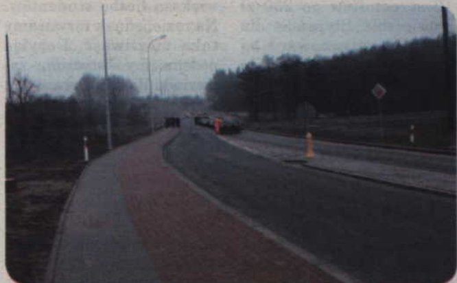
Nowa droga ma ok. 2,85 km długości. Powstał na niej jeden most przez Liwę.