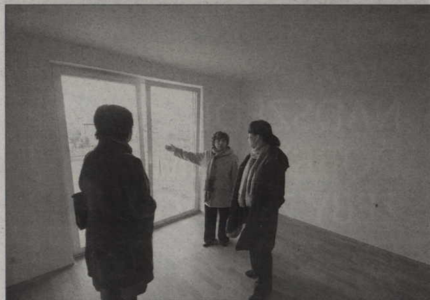
Mieszkania zostały wyposażone zgodnie z życzeniami przyszłych lokatorów.