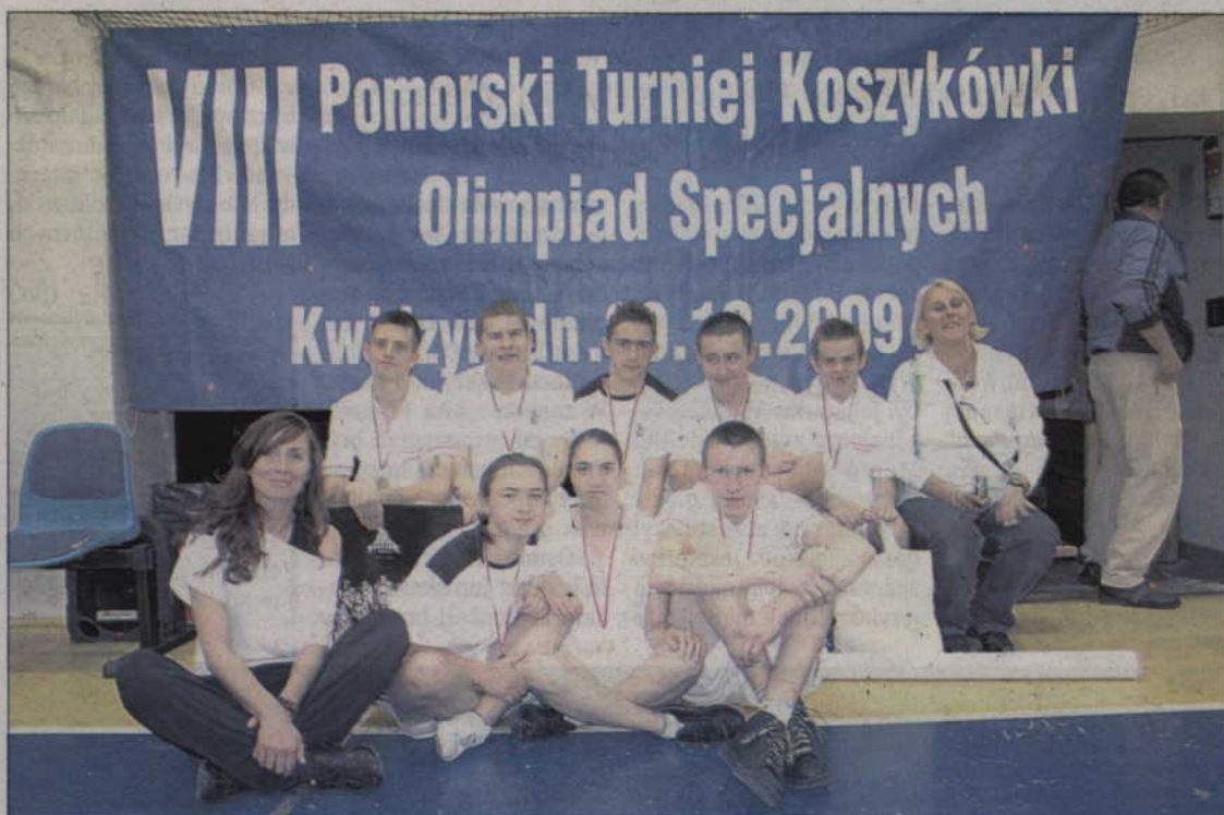
Koszykarze ze Specjalnego Ośrodka Szkolno-Wychowawczego w Kwidzynie zwyciężyli w Pomorskim Turnieju Koszykówki Olimpiad Specjalnych.