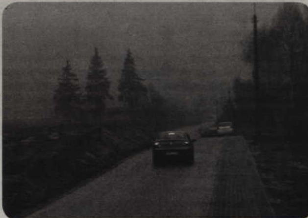
Burmistrza Kwidzyna najbardziej cieszą inwestycje drogowe, poprawiające funkcjonowanie miasta i jakość życia mieszkańców. Na zdjęciu nowa nawierzchnia ul. Drzymały.

- Nie mamy wyjścia. Musimy ścigać się z rozwojem cywilizacji. Uważam, że w tym roku wygraliśmy ten wyścig. Zbudowaliśmy wspólnie z powiatem małą obwodnicę. Odciążą ona ulice Warszawską, Grunwaldzką i Sportową. Będzie bezpieczniejszej i ciszej. Odczują to mieszkańcy, którzy są prawdziwymi beneficjentami tej inwestycji. Oczywiście bardzo ważne było pozyskanie pieniędzy unijnych na budowę hali widowiskowo-sportowej przy ul. Wiejskiej, ale budowa obiektu to zadanie przyszłoroczne. Skoncentrowaliśmy się na pozyskaniu pieniędzy na duże zadania. Nie zabiegaliśmy o środki na inne mniejsze projekty. Solidaryzując się z gminami, które także zabiegały o pieniądze, sta-