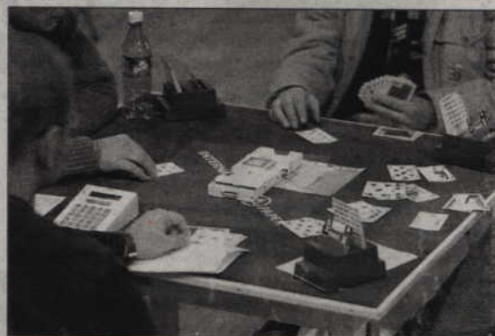
Zapisy chętnych teamów przyjmowane będą do godz. 17.