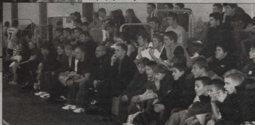
Turniej zorganizowano na miejskiej hali sportowej.