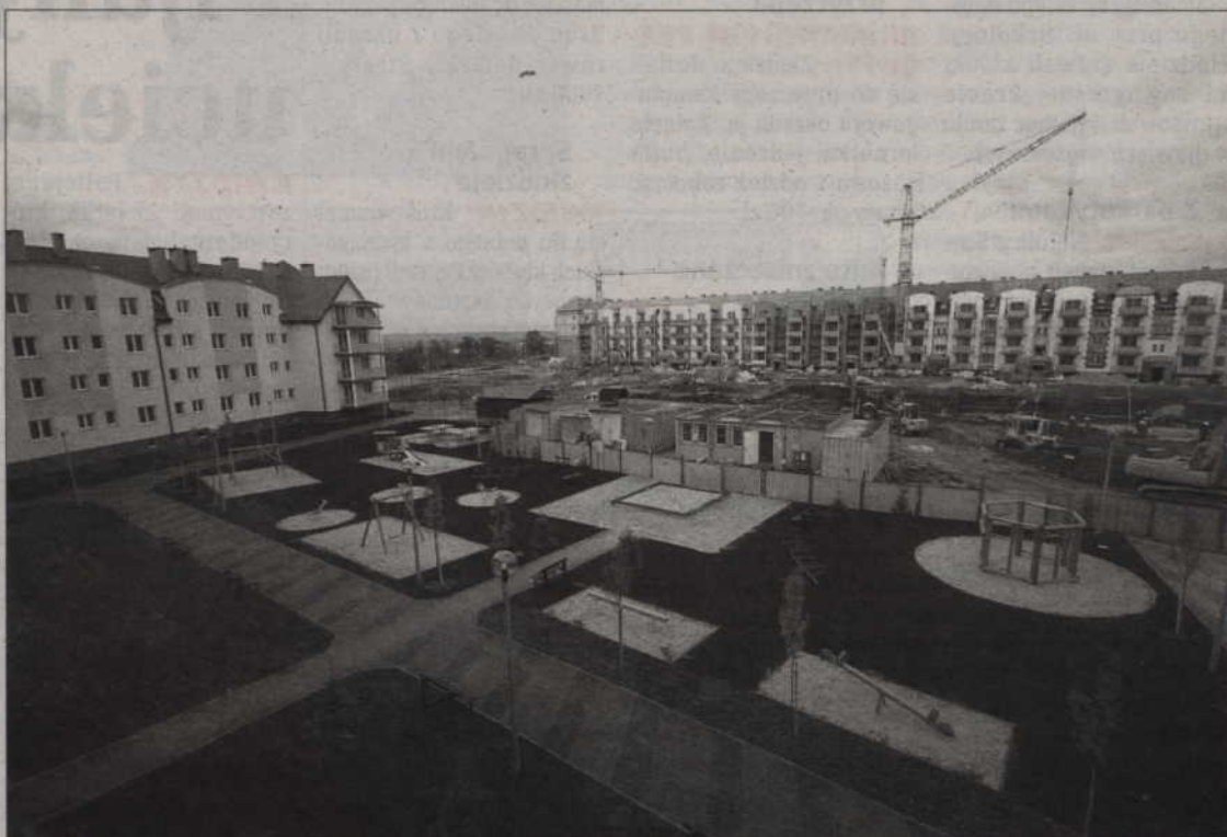
Obok bloku nr 6 to przy ulicy Sybiraków powstają dwa inne budynki wielorodzinne.