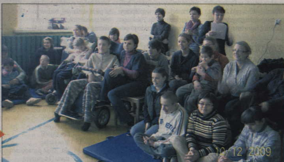
Widownia, czyli podopieczni Ośrodka Rehabilitacyjno - Edukacyjno - Wychowawczego.