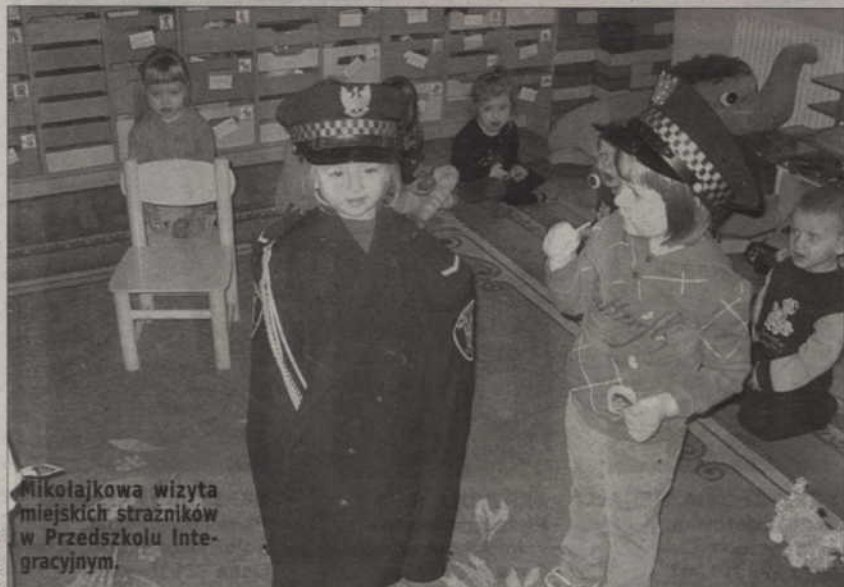
Mikołajkowa wizyta miejskich strażników w Przedszkolu Integracyjnym.