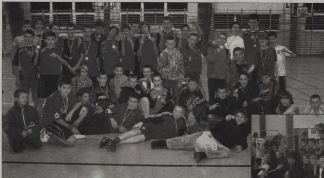
Najlepsi uczestnicy turnieju.

PRABUTY. Jak co roku przed świętami w Prabutach zorganizowano cykl imprez sportowo-rekreacyjnych pod hasłem „Sportowy Miko-