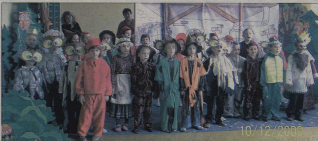
Sześciolatki z Jedyneczki na scenie w Okrągłej Łące.

Sześciolatki kwidzyńskiego Przedszkola Niepublicznego „Jedyneczka” odwiedziły Ośrodek Rehabilitacyjno - Edukacyjno - Wychowawczy w Okrągłej Łące. Zaprezentowały im spektakl „Nie ma tego złego, co by na dobre nie wyszło”. Potem wszystkie dzieci wspólnie się bawiły i śpiewały piosenki.. Mali artyści serdecznie dziękują wychowawcom oraz wspaniałej widowni za mile spędzony czas.