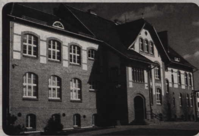
Największy postęp w porównaniu do klasy trzeciej nastąpił w Szkole Podstawowej nr 2