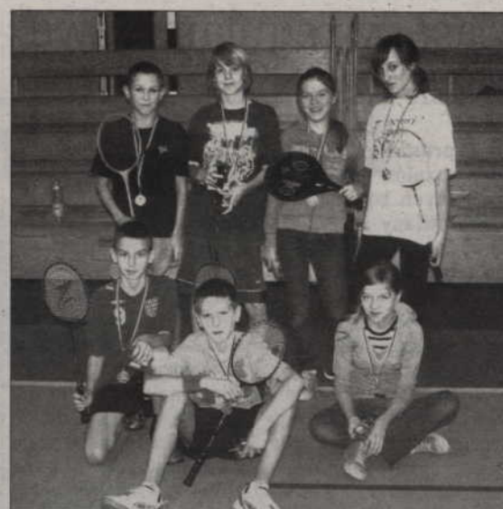
Zwycięzcy turnieju badmintonu.