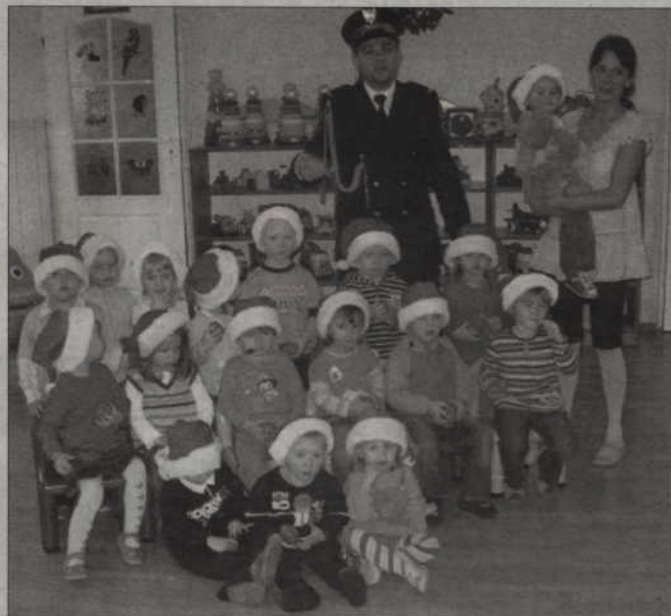
Strażnicy w Przedszkolu Chatka Puchatka.