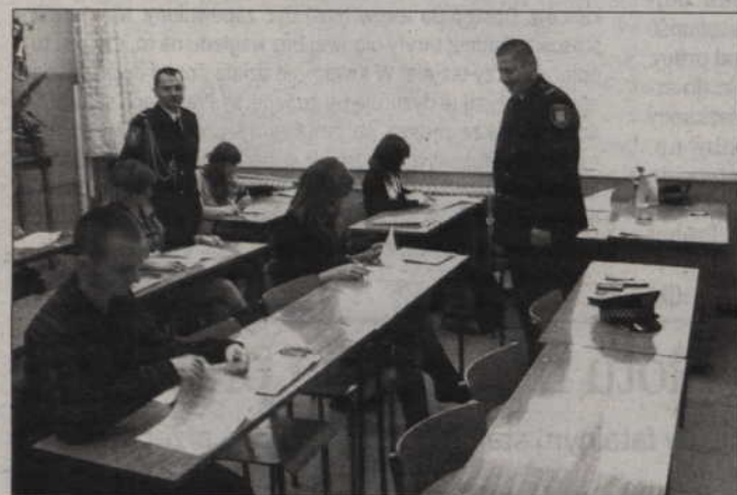
W konkursie wzięło udział ośmiu uczniów dwóch kwidzyńskich szkół ponadgimnazjalnych.

„Bezpieczne i Przyjazne Pomorze” - olimpiada dla licealistów