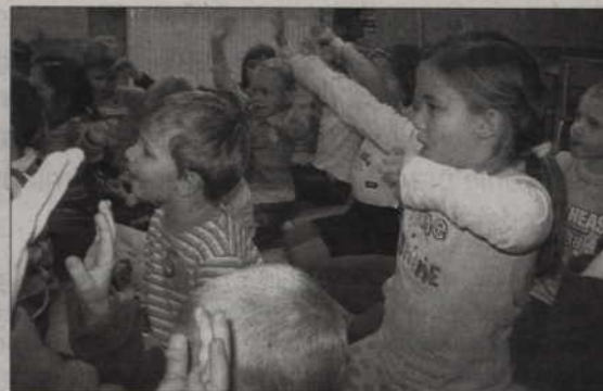
Grupa teatralna odwiedziła przedszkola: Radość, Integracyjne i Ekologiczne.