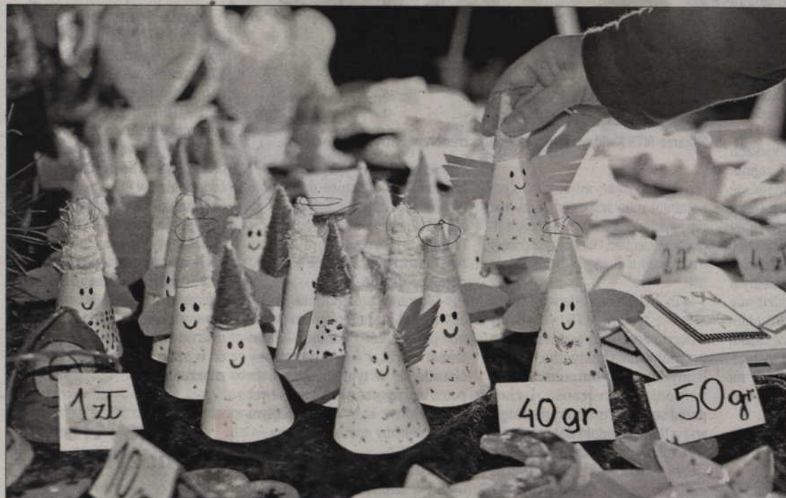
Najchętniej kupowano papierowe i drewniane anioły, wykonane przez podopiecznych ośrodka podczas zajęć warsztatowych.