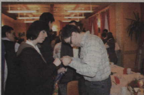
Niepełnosprawni uczestnicy warsztatu podzielili się opłatkiem.