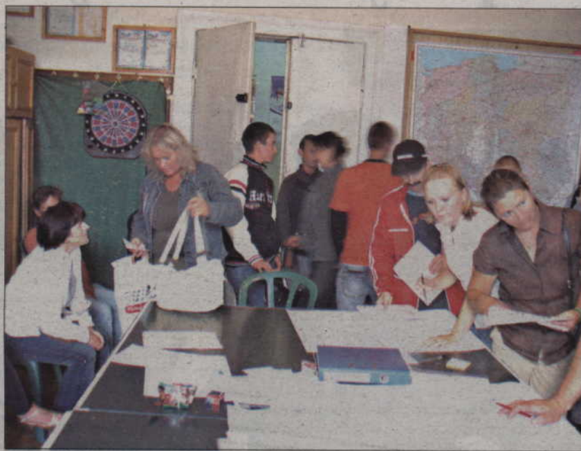
Obecnie siedziba OHP mieści się w niewielkim biurze na piętrze w centrum Kwidzyna.

- Nie ma jeszcze budżetu państwa dla OHP. Chcemy jednak, aby komendant główny przyjrzał się planowanemu przedsięwzięciu. Ma także ocenić koszty, które będzie trzeba ponieść,