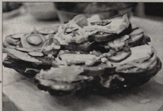
Wszystkie potrawy sprzedawane na kiermaszu przygotowali uczniowie.