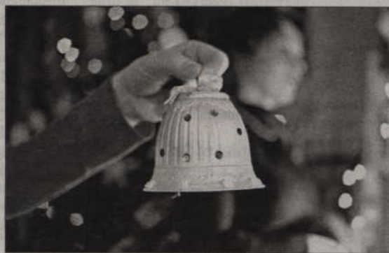
Co roku w Specjalnym Ośrodku Szkolno - Wychowawczym odbywa się kiermasz, z którego dochód przeznaczony jest na Wielką Orkiestrę Świątecznej Pomocy.