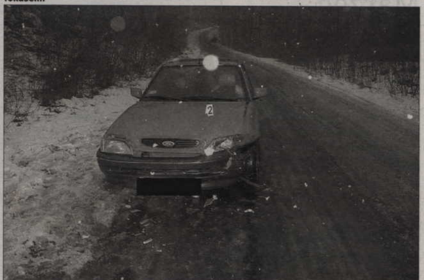
W Wandowie zderzyły się dwa ford. Ranna została jedna osoba.

Młodzi ludzie podpalili pojemniki na używaną odzież