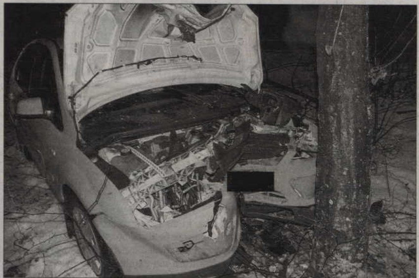
Ten wypadek wydarzył się w Brachlewie. Ranna została 26-letnia kobieta kierująca forem fokusem.