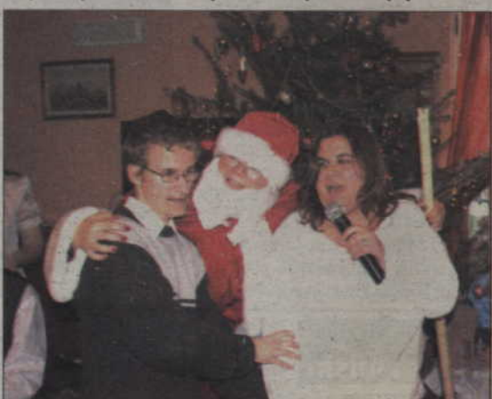
Niepełnosprawnych odwiedził święty Mikołaj.