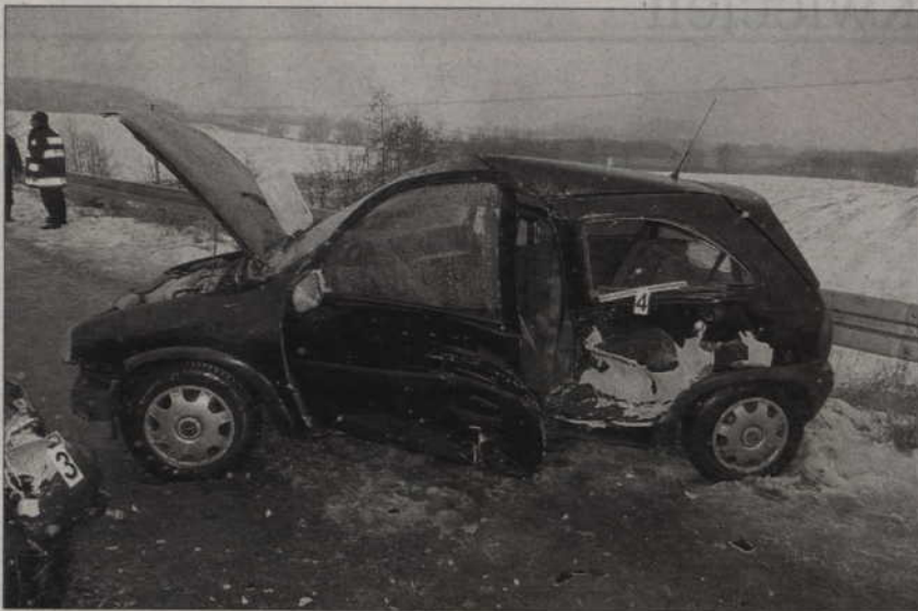
Na trasie Cygany - Szczepkowo zderzyły się dwa auta. Do szpitala trafiły cztery osoby.