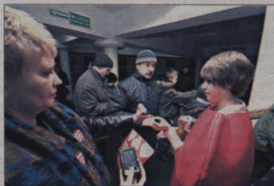
Przed wejściem na halę kwestujący zbierali pieniądze do puszek.

Po upływie 20 minut sytuacja na boisku zmieniła się diametralnie. Najlepiej o tym świadczy statystyka