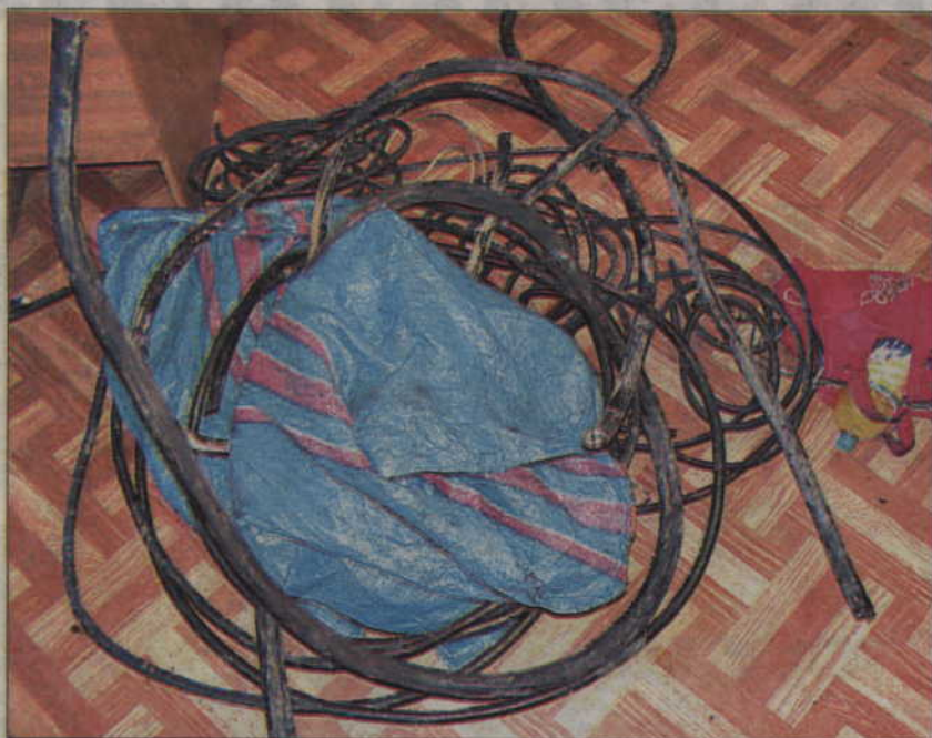
Złodzieje regularnie wynosili kable z terenu zakładu pracy i sprzedawali je na złom.

Policjanci wydziału kryminalnego obserwowali miejsca, z których od jakiegoś czasu notorycznie ginęły przewody elektryczne oraz złom. Podczas kontroli terenu jednego z kwidzyńskich zakładów zauważyli dwóch mężczyzn, którzy piłą ręczną przecinali przewody i wkładali je do worka. Natychmiast ich zatrzymali. Okazało się, że 49-latek