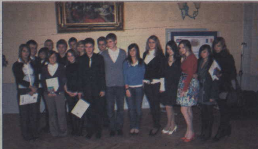
Laureaci II Międzyszkolnego Konkursu Recytatorskiego.