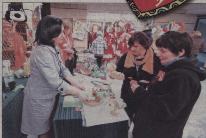
Przez całą niedzielę na aukcjach i kiermaszach można było kupować przeróżne przedmioty i w ten sposób wspierać Wielką Orkiestrę.