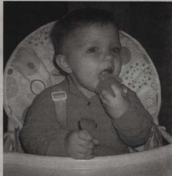
Powinniśmy uczyć dzieci dobrych manier przy stole, by w przyszłości nie czuły się zagubione w trudnych, oficjalnych sytuacjach, by nabrały pewności siebie.

Podsumowując, trzeba zaznaczyć, że najważniejsza w nauce kulturalnego zachowania przy stole jest konsekwencja. Cierpliwie korygujmy złe zachowanie, uparcie poprawiajmy dziecko i udzielajmy ostrzeżeń.