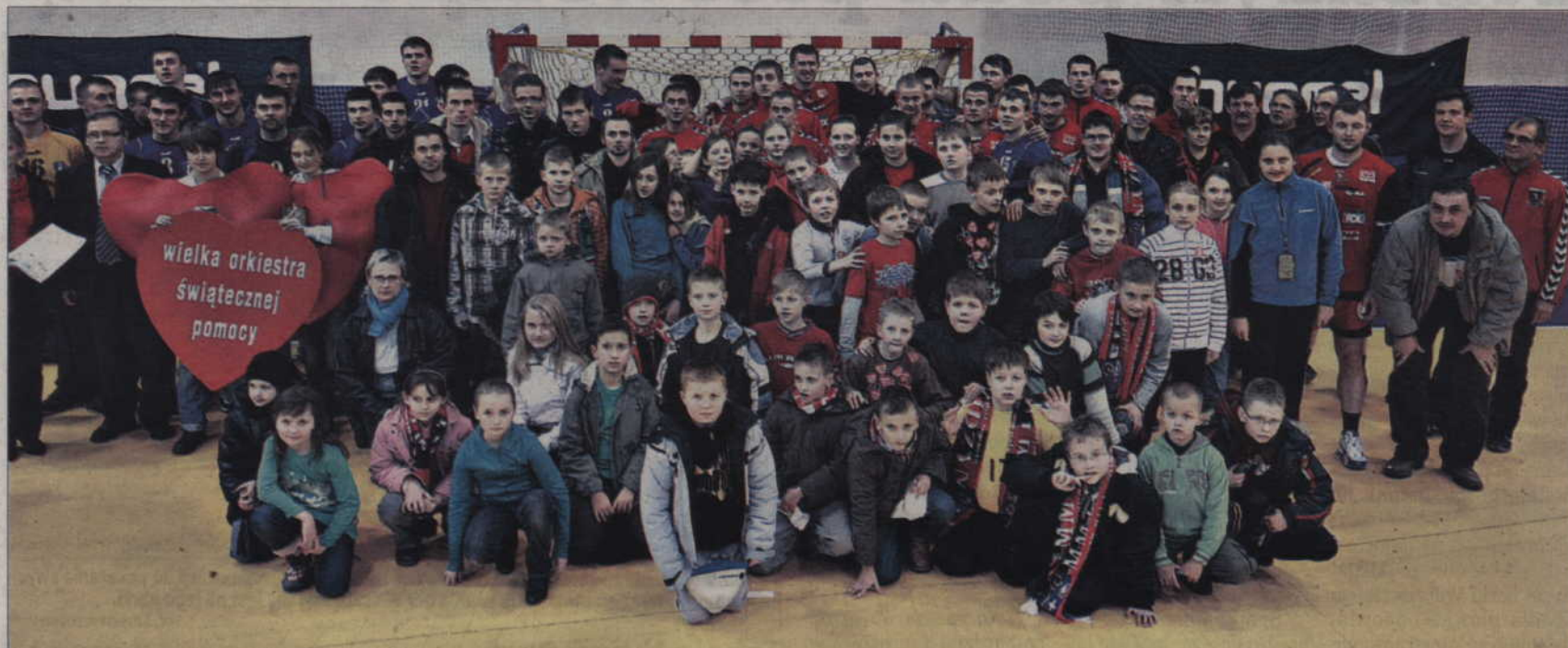
Wspólne zdjęcie zawodników Wisły, MMTS, kibiców oraz organizatorów WOŚP.