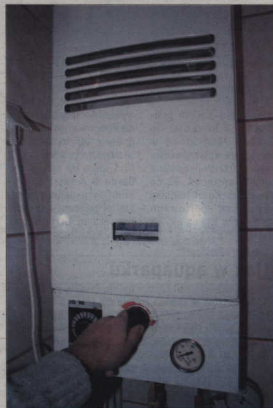
Tylko szybka interwencja zapobiegła śmiertelnemu zatruciu tlenkiem węgla. Zawiniły zasłonięte na zimę kratki wentylacyjne w łazienkach.

- Przeciętą rodziną w ciągu doby może wytworzyć ok. 14 litrów wody w formie wilgoci w powietrzu. W domu, gdzie nie ma skutecznie działającej wentylacji, wilgoć nie zostanie odprowadzona. Na rezultat nie będzie trzeba długo czekać. Wynikiem zawilgocenia mieszkania będzie zagrzybienie ścian. Obecność grzybów czy pleśni może przez dłuższy czas zostać niezauważalna, kiedy jednak jest już widoczna, na tani remont będzie za późno. Podstawową przyczyną słabej wentylacji lub jej braku jest niewystarczający dopływ świeżego powietrza poprzez szczelną stolarkę okienną. Rozwiązaniem jest jej rozszczelnienie np. odpowiednie położenie klamek okiennych lub zamontowanie samoczynnych rozszczelniaczy okiennych. Wprowadziliśmy możliwość montażu takich nawiewników. Użytkownik zleca wykonanie takiego nawiewnika, płacąc 85 zł za sztukę. Otrzyma jednak refundację kosztów po zgłoszeniu montażu i jego odbiorze przez pracowników spółdzielni. Dopuszczamy montaż różnego rodzaju nawiewników, ale muszą one być zgodne