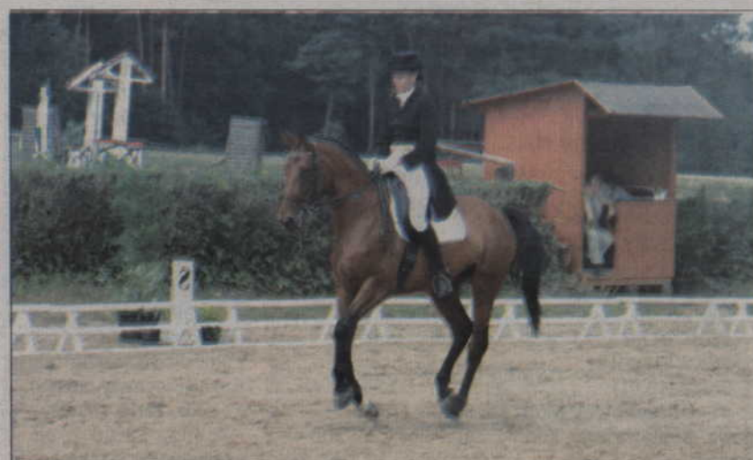
Podkwidzyńska Miłosna słynie z organizacji zawodów konnych.