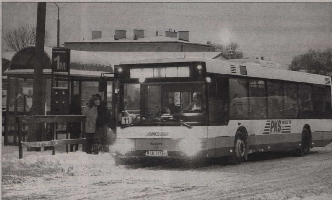
Pasażerowie autobusu, który w piątek rano jechał z Kwidzyna do Gdańska, narzekali na przenikliwy chłód w środku pojazdu. Jak zapewniono nas w PKS, to jednostkowy przypadek, w większości pojazdów ogrzewanie jest na odpowiednim poziomie.