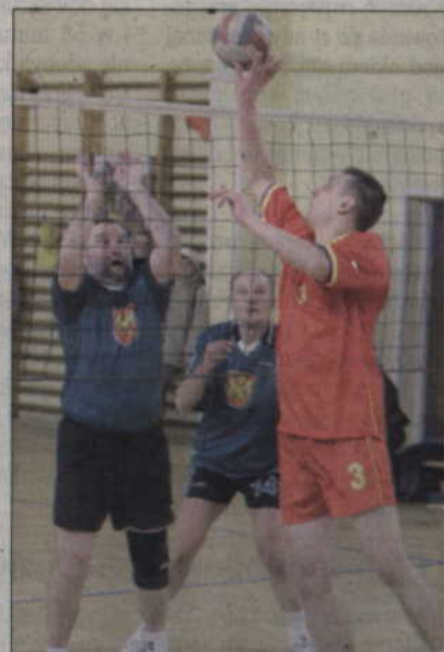
Rozegrano też charytatywne mecze, m.in. w siatkówkę.