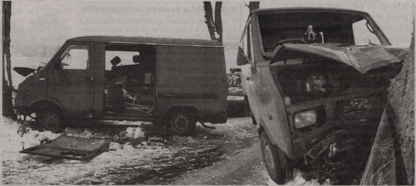
Samochód uderzył w drzewo. Kierowca jest ranny, ma złamaną nogę.