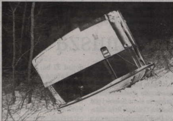
Autobus wpadł w poślizg i stoczył się z trzymetrowej skarpy.