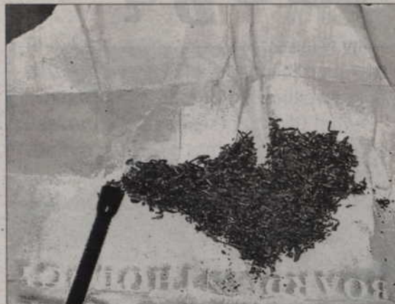
W kieszeni 16-latka znaleziono woreczek z marihuaną.