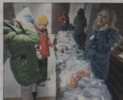
Można było wspierać orkiestrę kupując zabawki.