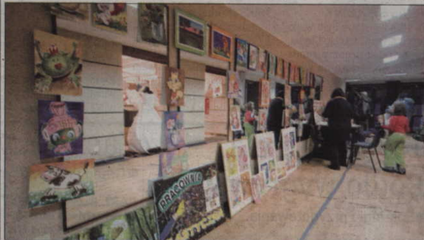
Wystawa prac plastycznych w holu kwidzyńskiego teatru.