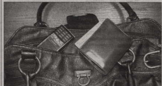
Złodzieje podbiegli do kobiety od tyłu i wyrwali jej z ręki torebkę.

PRABUTY. Policjanci zatrzymali dwóch mieszkańców Prabut, którzy pod koniec grudnia 2009 roku napadli na kobietę na ulicy i ukradli jej torebkę.