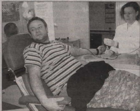
Policjanci regularnie odwiedzają punkt krwiodawstwa, by oddać krew dla chorych.