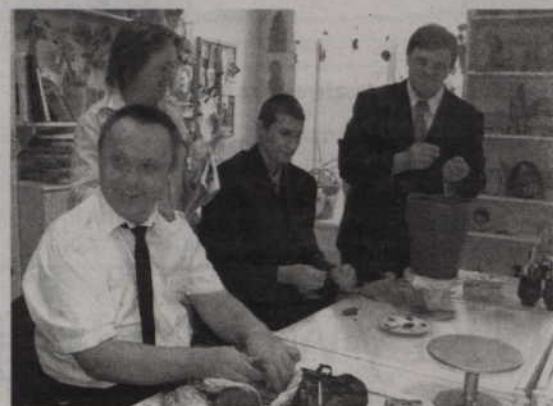
Na przekazany w 2003 roku terenie w Górkach powstało Centrum Rehabilitacji Osób Niepełnosprawnych.