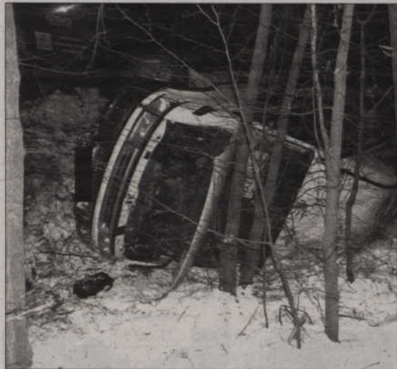
Kierowca i wszyscy pasażerowie są ranni.

RYJEWO. W Ryjewie doszło do poważnego wypadku. Autobus stoczył się ze skarpy. Sześć osób trafiło do szpitala.