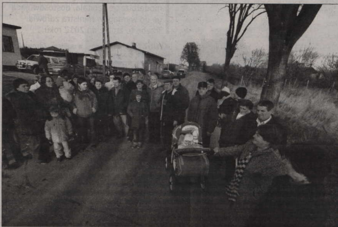
Mieszkańcy wsi między Kwidzynem a Straszewem długo domagali się remontu drogi.

ciniek drogi od Straszewa do skrzyżowania z drogą wojewódzką w kierunku Dubiela. Przypomnę, że uzyskaliśmy w ubiegłym roku pieniądze unijne na