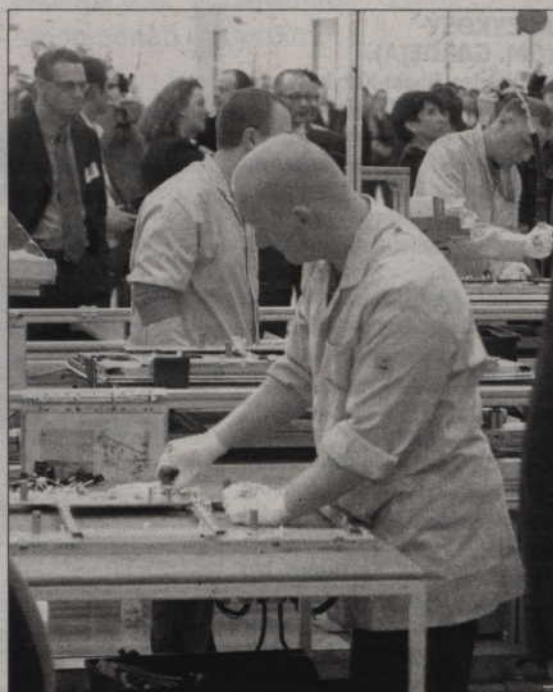
Minął już trudny okres na rynku pracy w powiecie kwidzyńskim. Firmy, które jeszcze niedawno zwalniały pracowników, zaczynają znów zatrudniać. Jabil zamierza w tym roku przyjąć do pracy ponad 500 pracowników.