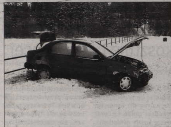
1. Lanos, którym kierował 51-letni mężczyzna stanął w płomieniach, bo kierowca jechał na hamulcu ręcznym.