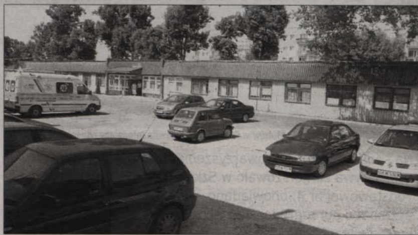
Na świadczenie usług medycznych kliniki mają podpisane umowy z Narodowym Funduszem Zdrowia.

Kliniki tworzone przez American Heart of Poland zajmują się diagnostyką oraz leczeniem chorób serca i naczyń niechirurgicznymi technikami przeszskórnymi. Techniki te pozwalają m.in. na wykrycie miażdżycowych zwężeń tętnic, a następnie na ich poszerzenie i przywrócenie prawidłowego przepływu krwi w mięśniu sercowym, mózgu, nerkach i kończynach dolnych. Leczenie to zapobiega zawałom serca, udarom mózgowym, niedokrwieniu kończyn dolnych oraz niewydolności nerek. Zabiegi te nie wymagają długich hospitalizacji. Trwa ona zwykle od jednego do dwóch dni i umożliwia szybką rehabilitację i powrót do pełnej aktywności życiowej w większości przypadków.