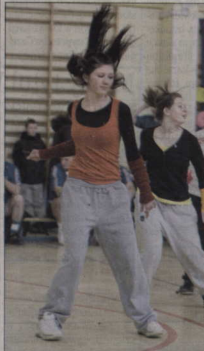
Wśród imprez towarzyszących tegorocznej Wielkiej Orkiestrze były pokazy taneczne.