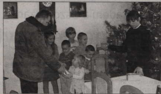
Otrzymane po zabiegu czekolady, policjanci przekazują dzieciom z domu dziecka.