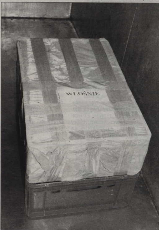
Państwowy Instytut Weterynarii w Puławach zajmie się badaniami pasożyta wykrytego w dziku upolowanym w Białkach (gmina Sadlinki).

KWIDZYN. Nawierzchnia ulicy Sportowej, która od lat jest utrapieniem kierowców, zostanie wyremontowana. Chodzi o jej krótki fragment, na którym, mimo niedawnej modernizacji, nadal leży zniszczona kostka brukowa. Generalna Dyrekcja Dróg Krajowych i Autostrad, która jest administratorem drogi, rozstrzygnęła przetarg na remont i wzmocnienie nawierzchni drogi. (ad)