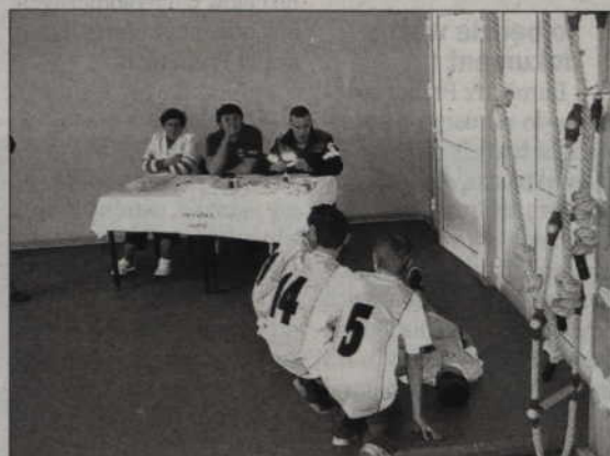
Turniej rozegrano w Szkole Podstawowej nr 2 w Prabutach.