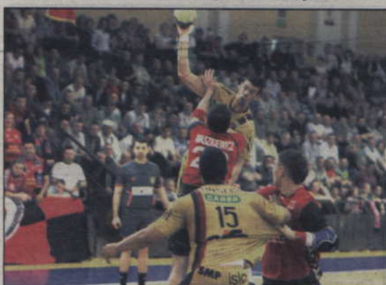
Skuteczna gra obronna okazała się kluczem do zwycięstwa z United.

W finale Challenge Cup MMTS Kwidzyn zmierzy się z portugalskim zespołem Sporting Clube de Portugal Lisboa, który pokonał w półfinale słoweńską drużynę RD Slovan Lublana. Pierwszy mecz finałowy rozegrany zostanie w terminie 22 lub 23 maja w Kwidzynie, natomiast rewanż odbędzie się tydzień później - 29 lub 30 maja.