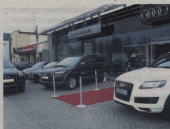
Salon Groblewskiego - Autoryzowanego Partnera Audi przy ul. Dąbrowszczaków 12 w Gdańsku. W minioną środę, tym czerwonym chodnikiem wkroczyło do salonu prawie 200 zaproszonych osób, zainteresowanych premierą najnowszego A8

Masa. Masa własna 1995 kg; dopuszczalna masa całkowita 2660 kg, dopuszczalne obciążenie dachu 100/95 kg, dopuszczalna masa holowanej przyczepy (bez hamulca) 750 kg, dopuszczalna masa holowanej przyczepy (przy wzniesieniu 8%) 2300 kg. Pojemność bagażnika 510 l. Zbiornik paliwa 90 l.