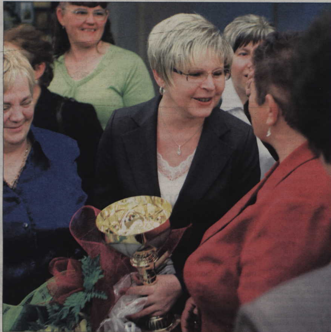
Gala podsumowująca plebiscyt odbyła się w Tczewskim Centrum Kultury. Atrakcją wieczoru był koncert Krzysztofa Krawczyka.