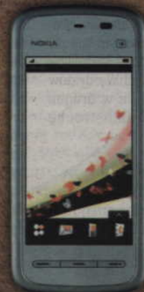
Nokia 5230 już od 1 zł

Zostań jednym z 12 zwycięzców. Wygraj voucher o wartości 20 000 zł. Kup w Orange dowolny telefon Nokia w abonamencie 59 zł lub wyższym i wymyśl hasło reklamowe, które połączy słowa: Nokia, Orange i podróż.