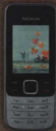
Nokia 2730 classic już od 1 zł