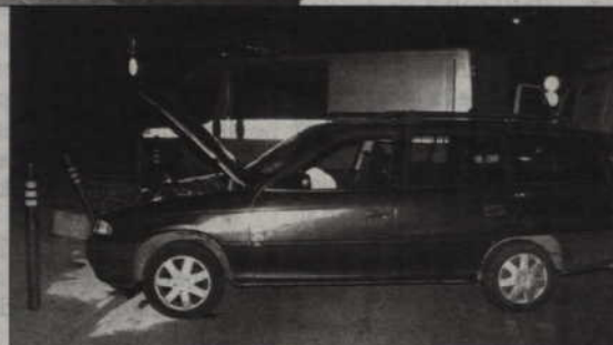
57-letni kierowca astry uderzył w przydrożne słupki uciekając przed patrolem policji.

Krańcowej w Kwidzynie. Postanowili zatrzymać samochód. Kierowca zatrzymał się do kontroli