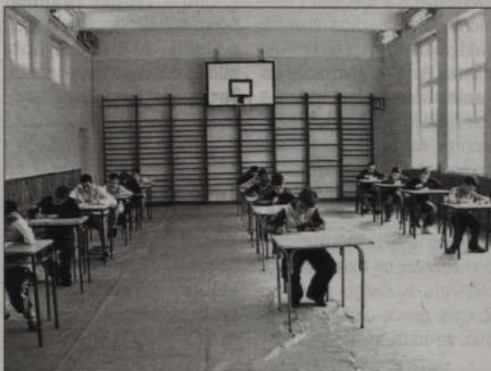
Uczniowie musieli rozwiązać test na temat przepisów ruchu drogowego.

Podstawowej nr 5 w Kwidzynie. Natomiast z gimnazjów dwa następne miejsca na podium zajęła młodzież z Garde i z Licza.