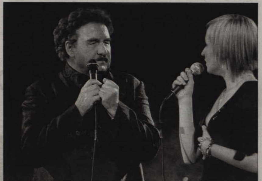
Krzysztof Krawczyk zaśpiewał specjalnie dla uczestników i gości finału naszego plebiscytu.

Gałę kończącą plebiscyt zakończył koncert Krzysztofa Krawczyka. (ad)