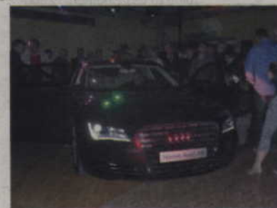
Najnowsze A8 oblegane przez gości firmy Groblewskiego

Firma Groblewski jest Autoryzowaną Stacją Dealerską Audi, zajmującą się sprzedażą samochodów tej marki oraz Oryginalnych akcesoriów Audi® i Oryginalnych części Audi®. Oferuje także profesjonalną obsługę serwisową, realizując okresowe przeglądy samochodów, naprawy gwarancyjne i pogwarancyjne. Zaplecze firmy stanowi wykwalifikowana grupa sprzedawców i serwisantów, których wiedza i umiejętności opierają się na wieloletnim doświadczeniu w branży motoryzacyjnej oraz regularnie przeprowadzanych szkoleniach z zakresu pełnej oferty Audi oraz wytycznych dotyczących napraw. Dzięki ścisłej współpracy z producentem firma Groblewski gwarantuje najwyższą jakość usług, a wyposażenie stacji serwisowej spełnia najsurowsze normy obowiązujące Audi na całym świecie.