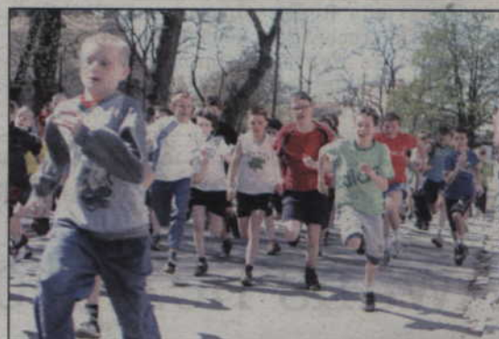
W zawodach Polska Biega wystartować może każdy zainteresowany.