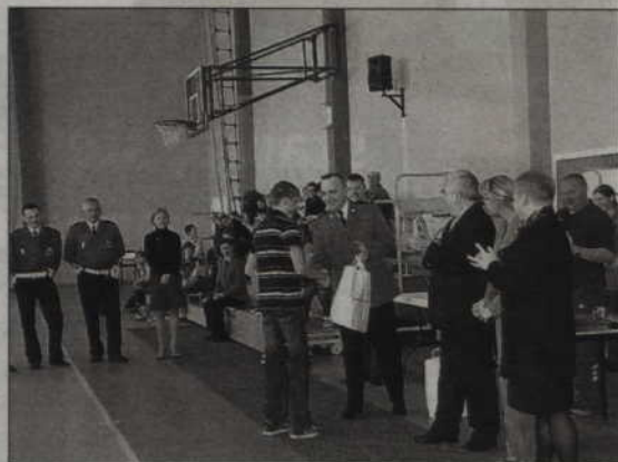
Zwycięzili uczniowie prabuckich szkół.