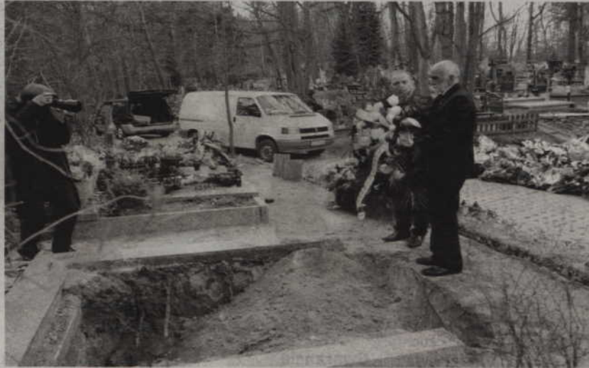
2,5 godz. po uroczystościach żałobnych dowieziono wieńiec od marszałka Komorowskiego.

Chwała natomiast tym redakcjom i dziennikarzom, którzy podrażyli temat i uzyskali własne informacje, wskazujące, że Panowie, którzy przewieźli wieńiec Marszałka przyznali, iż wypili trochę do obiadu, że faktycznie – jak podaliśmy – „byli zmęczeni”. Potwierdzili podane przez nas informacje, że przyjechali z wieńcem (choć niektórzy dziennikarzom urzęd-