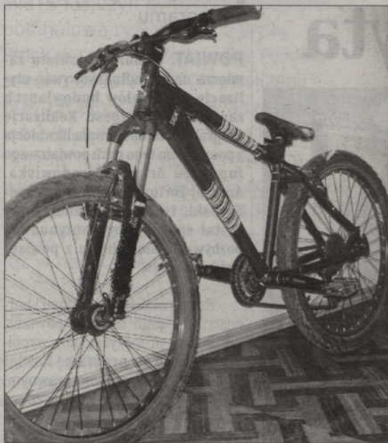
Udało się odnaleźć rower górski, który 13-latkowi ukradli starsi koledzy.

■ Zaplanowana akcja nastoletnich złodziei