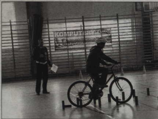
Pratyczny egzamin to rowerowy tor przeszkód i udzielanie pierwszej pomocy.