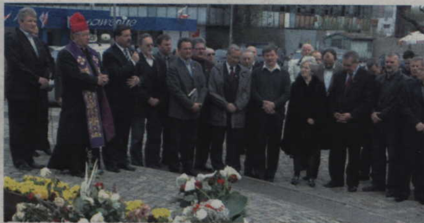
Wspólna modlitwa pod pomnikiem Trzech Krzyży.

- Nikt z nas w „Solidarności” nie przysięgał wierności pańskim poglądom. Dlatego bardzo proszę o większą powściągliwość w oskarżaniu o zdradę - odpowiedział Wałęsie szef „Solidarności” Janusz Śniadek.