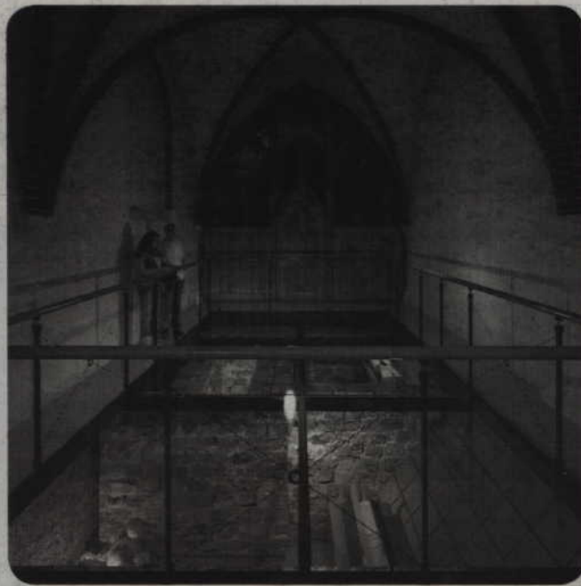
Samorząd chce, aby w szkołach uczono historii Kwidzyna. Na zdjęciu: projekt krypty wielkich mistrzów krzyżackich.

Do Urzędu Miejskiego wpłynęły propozycje zajęć, związanych z historią miasta, które miałyby być prowadzone w kwidzińskich szkołach. Autorzy prac musieli przygotować propozycje swego rodzaju podręcznika historii Kwidzyna dla uczniów szkół podstawowych, gimnazjów oraz szkół ponadgimnazjalnych.