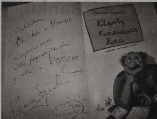
Chętni mogli zdobyć książkę z autografem autora.