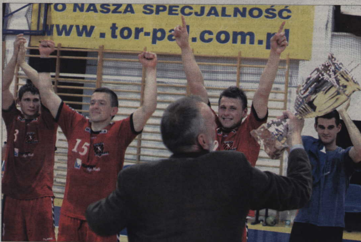
Tak zawodnicy MMTS Kwidzyn cieszyli się z ubiegłorocznego medalu. W tym sezonie zdołali poprawić to osiągnięcie i walczyć w wielkim finale Mistrzostw Polski.