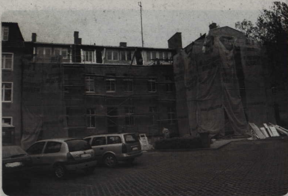
Trwają remonty kamienic. W tym roku nowe elewacje pojawią się na 16 budynkach wspólnot oraz dwóch budynkach, które w całości należą do miasta.

Trwają remonty kamienic. W tym roku nowe elewacje pojawią się na 16 budynkach wspólnot oraz dwóch budynkach, które w całości należą do miasta. Podobnie jak w latach ubiegłych, miasto będzie sponosał odsetki od kredytów zaciągniętych przez wspólnoty. Będą one płaciły tylko raty kapitałowe. Miasto jest także gwarantem spłaty kredytów.