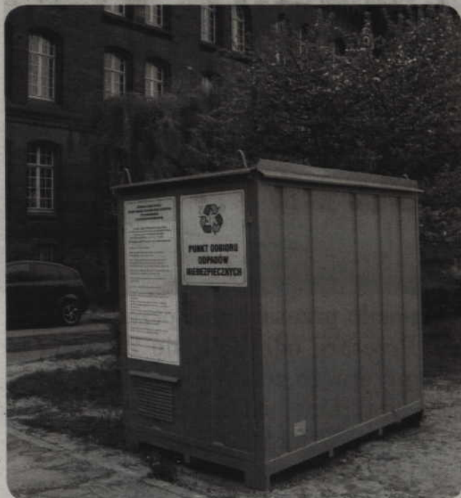
Pojemniki znajdują się przy ul. Mostowej (teren stacji paliw BP) oraz na parkingu Kwidzyńskiego Centrum Kultury przy ul. 11 Listopada (teren dawnej jednostki wojskowej).

Zakład Utylizacji Odpadów zachęca do oddawania zużytego sprzętu elektrycznego i elektronicznego. W mieście ustawiono dwa pojemniki na elektroniczne śmieci.