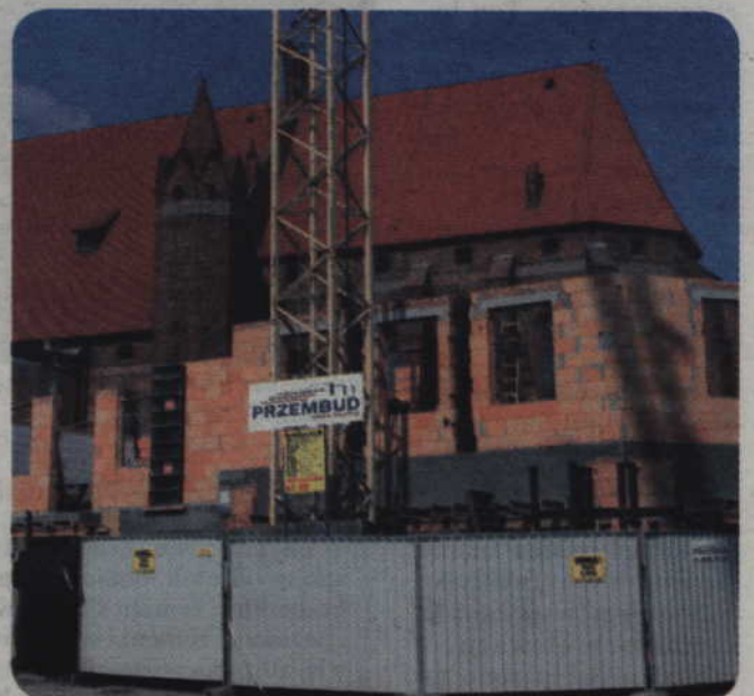
Investycje prowadzi Towarzystwo Budownictwa Społecznego w Kwidzynie. Lokale mają być gotowe w tym roku.