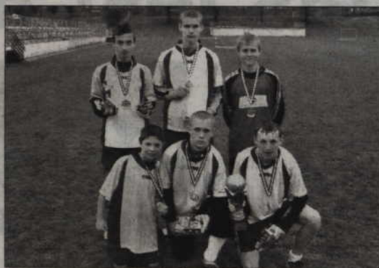
Mistrzowski zespół Nowej Zelandii ze zdobytym trofeum.

nałów kwidzyńskich Minimistrzostw Świata awansowały ekipy USA, Nowej Zelandii, Niemiec, Szwajcarii, Danii, Anglii, Brazylii oraz Hondurasu. Pewnym półfinalistą okazał się zespół Nowej Zelandii, który pokonał Szwajcarię aż 19:1! W pozostałych spotkaniach wyniki były już dużo mniej efektowne.