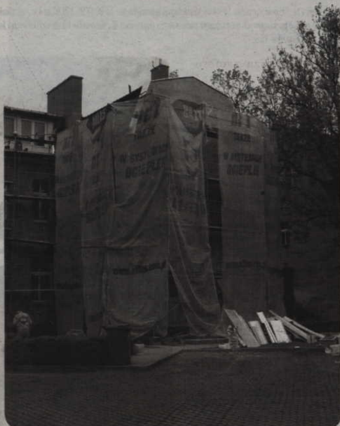
Zakres prac, które dofinansuje miasto, w formie spłaty odsetek, obejmuje remont elewacji, docieplenie budynków i remont dachu.