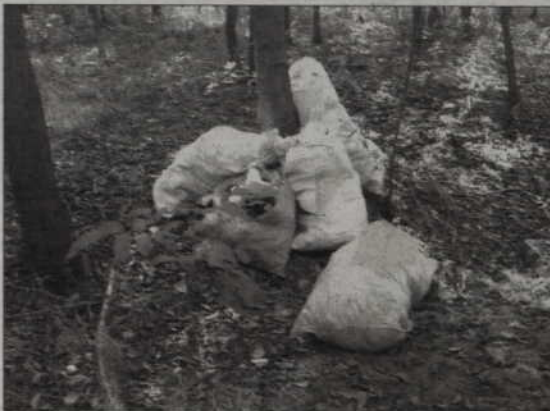
Ludzie wyrzucają stare ubrania, resztki jedzenia, puszki, meble, zużyte pieluchy, butelki.

Komenda Powiatowa Policji w Kwizdynie apeluje do mieszkańców, by informowali policjantów o osobach, które zaśmiecają lasy, parki, skwery i inne miejsca. Można dzwonić: przez całą dobę numer alarmowy 997 z telefonu stacjonarnego oraz 112 z telefonu komórkowego.