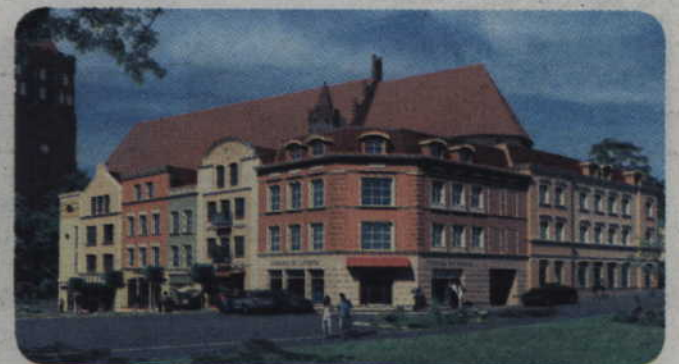
Tak będą wyglądały kamienice po zakończeniu budowy.