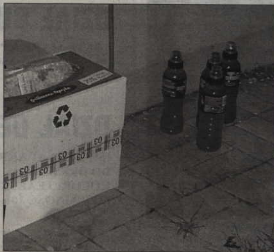
(ad) Dzieci okradły szkolny sklepik. Zabraly słodycze, napoje i pieniądze.

w ręce jednego z funkcjonariuszy. Okazało się, że 12-latek wraz dwoma kolegami postanowili zrobić skok na sklepik szkolny. 12-latek i 13-latek weszli na teren szkoły, wybili szybę i przez okno dostali się do środka sklepu. Najmłodszy z nich stał na czatach. W ten sposób chłopcy ukradli kanton słodyczy, napoje i 50 zł. Kiedy uciekali ze swoim łupem, jeden z włamywaczy wpadł prosto w ręce policjanta. Funkcjonariusze szybko ustalili pozostałych dwóch członków gangu. Teraz ich sprawą zajmie się sąd rodzinny.