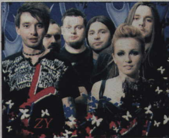
Zespół Łzy wystąpi w Kwidzynie 19 czerwca.

Zespół Łzy będzie główną gwiazdą. Ma na swoim koncie wiele przebojów i powinien spodobać się kwidzyńskiej publiczności. Przygotowywane są materiały informacyjne. Program obchodów Dni Kwidzyna powinien dotrzeć do każdego. Planowany jest przegląd orkiestr dętych. W tym roku w organizację imprezy włączyli się kwidzyńscy przedsiębiorcy, którzy pomogą finansowo organizatorom