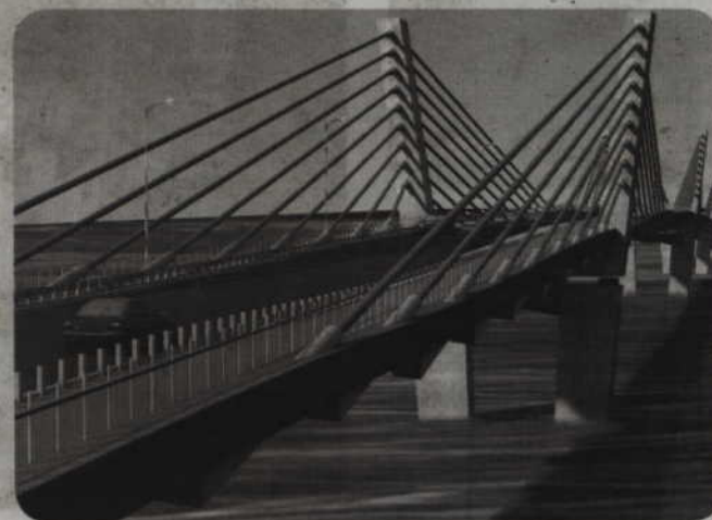
Most będzie miał ponad 800 metrów. Do tego dojdą trzy estakady o łącznej długości ok. 1030 m.