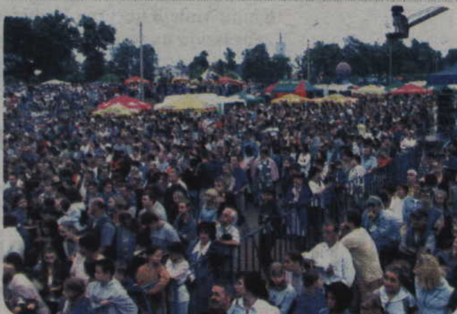
Tegoroczne Dni Kwidzyna odbędą się od 18 do 20 czerwca. Wszystkie imprezy odbywać się będą na stadionie miejskim.