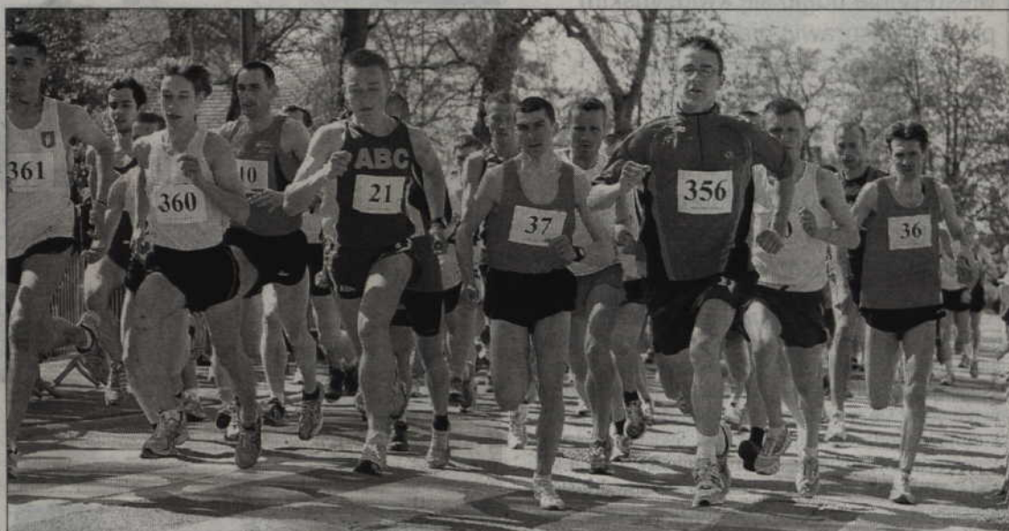
Na starcie biegu stanie ponad dwustu zawodników z kraju i zagranicy.

Zawodnicy pobiegą ulicami: Sportową, Wiejską, Lotniczą oraz Żwirową. Na 3 i 7 km trasy biegu przewidziano punkty kontrolne, gdzie obsługa zawodów będzie rejestrowała numery startowe zawodników skracających trasę. Zawodnicy ci zostaną zdyskwalifikowani. Na 3 i 7 km trasy znajdować się będą również punkty odświeżania dla zawodników (gąbki, woda,