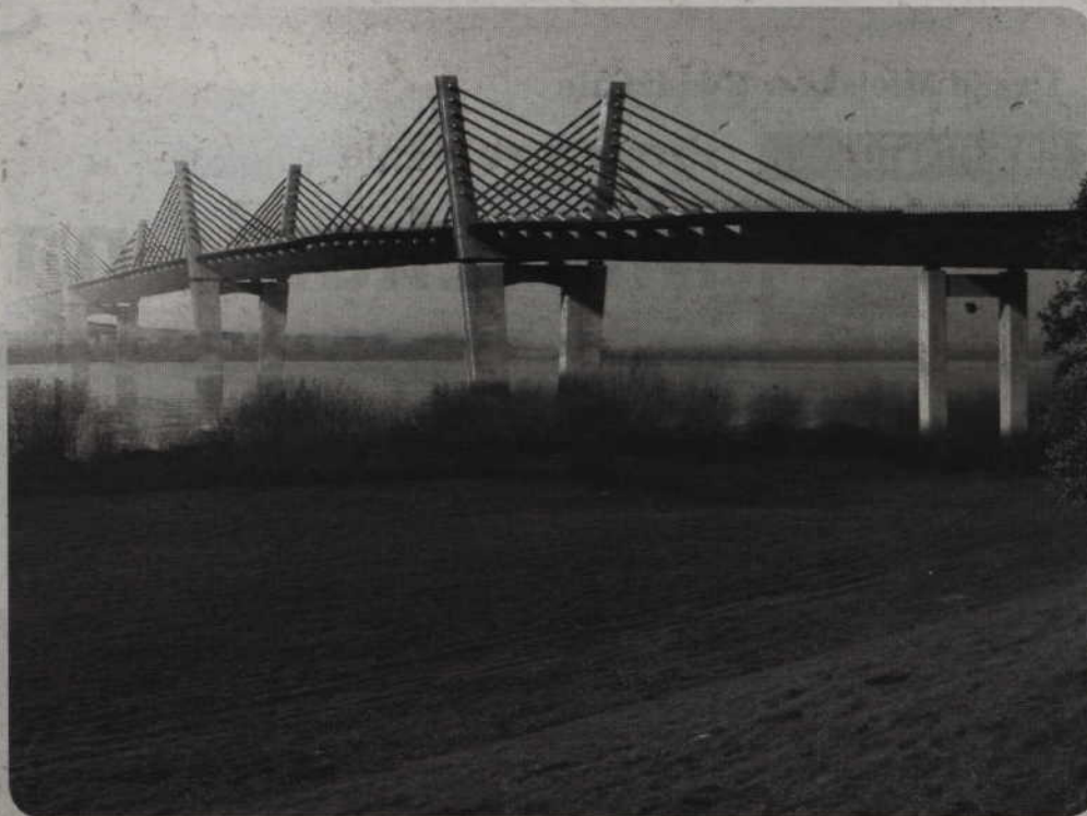
8 czerwca nastąpi otwarcie ofert dotyczących budowy mostu przez Wisłę w okolicy Kwidzyna.

8 czerwca nastąpi otwarcie ofert dotyczących budowy mostu przez Wisłę w okolicy Kwidzyna. Generalna Dyrekcja Dróg Krajowych i Autostrad ogłosiła przetarg na budowę mostu. Inwestycja ma rozpocząć się w tym roku. Potrwa ok. 27 miesięcy.