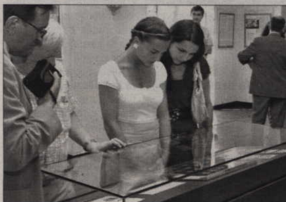
Na ekspozycji oglądać można m.in. oryginalne karty do głosowania z roku 1920.