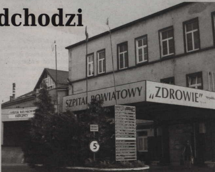
Trwają poszukiwania nowego szefa kwidzyńskiego szpitala.

Przed wakacjami rada powiatu wyraziła zgodę na objęcie nowych udziałów w spółce „Zdrowie”. Oznacza to, że samorząd powiatu będzie ich miał ponad 90 proc. Samorząd postanowił podwyższyć kapitał zakładowy wnosząc do spółki nieruchomości. Jak tłumaczył rząd to krok zmierzający do usamodzielnienia się spółki. Ich wniesienie ma umożliwić spółce realiza-