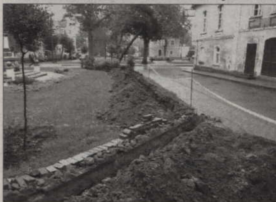
Trwa wymiana lamp na ulicy Warszawskiej.