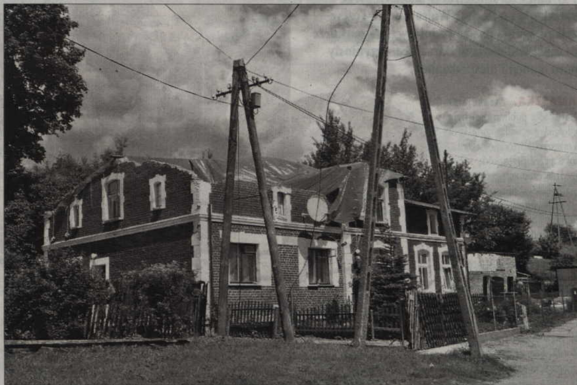
Przy Cystersów 2 Marockim i Steinerowi związał część piętra i dach.

- Ścianek na górze jeszcze nie mamy. Instalacje elektryczną chcemy zakładać. Na razie prąd ciągniemy od brata, po sąsiedzku, ale niedługo będzie i elektryka nowa i nowy licznik.