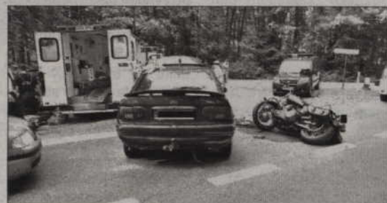
Policja prosi o kontakt świadków niedawnych wypadków drogowych, m.in. tego w okolicach Ryjewa, w którym samochód osobowy zderzył się z motocyklem.

- 22 lipca 2010 roku na drodze krajowej nr 55 Kwidzyn - Sztum w rejonie skrzyżowania z drogą podporządkowaną prowadzącą do Ryjewa zderzył się samo-