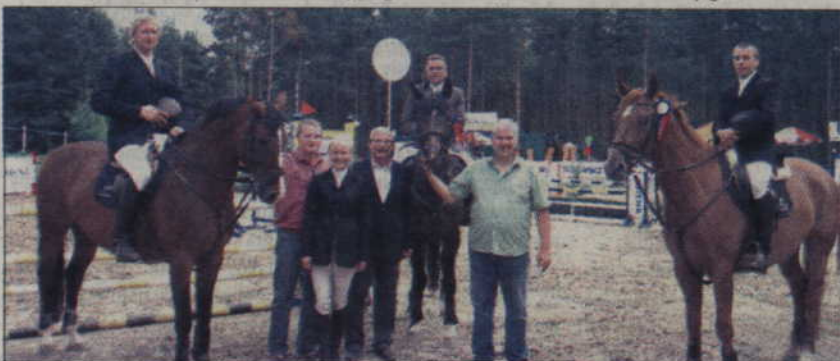
Zwycięzcy i sponsorzy Klasy P.