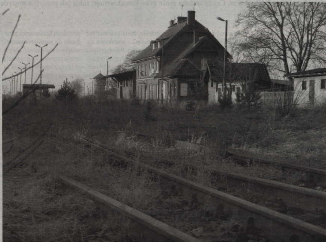
Skórczkie tory szpecą miasto, czy mieszkańcy wyrażą zgodę, aby przebiegła nimi obwodnica?

Dla ZDW nie ma różnicy, kto będzie właścicielem gruntu, bo nieruchomości zostaną przeznaczone pod inwestycję na mocy Zezwolenia Realizacji Inwestycji Drogowej czyli specustawy umożliwiającej wywłaszczenie gruntów. Dyrektor Kubiak jest przekonany,