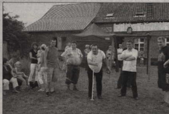
Mieszkańcy mogli bawić się uczestnicząc w konkurencjach rekreacyjnych.