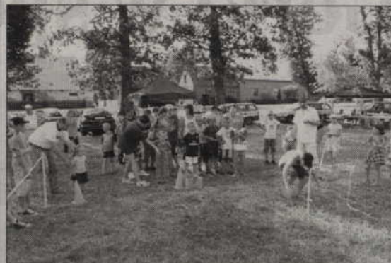
Wakacyjne festyny odbyły się we wszystkich sołectwach gminy Prabuty.