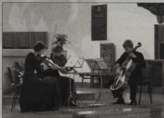
Koncert odbył się w prabuckiej konkatedrze.