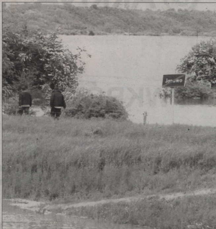
Woda nie przerwała wałów znajdujących się na terenie gminy. Mimo to jednymi z najbardziej poszkodowanych zostali rolnicy z Janowa.

wych złożyła wniosek do wojewody o powołanie komisji szacującej szkody. Komisja pracowała w terenie i zakończyła już prace.