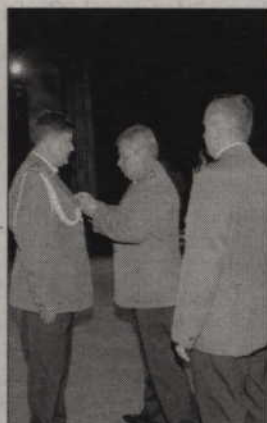
Kilkudziesięciu policjantów otrzymało odznaczenia i medale.