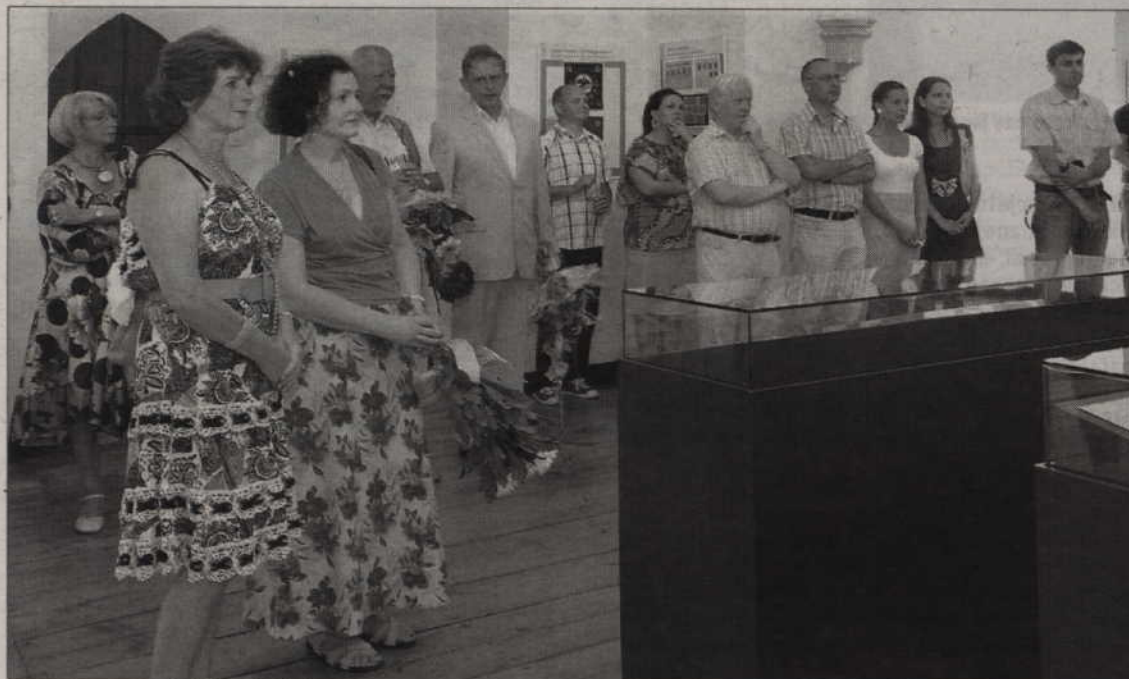
Otwarcie wystawy uświetniło obchody 90 rocznicy Plebiscytu na Powiślu, Warmii i Mazurach.

90 rocznica Plebiscytu na Powiślu, Warmii i Mazurach stała się okazją do przybliżenia mieszkańcom wydarzeń plebiscytowych odbywających się w 1920 roku m.in. na obecnym terenie powiatu kwidzyńskiego.