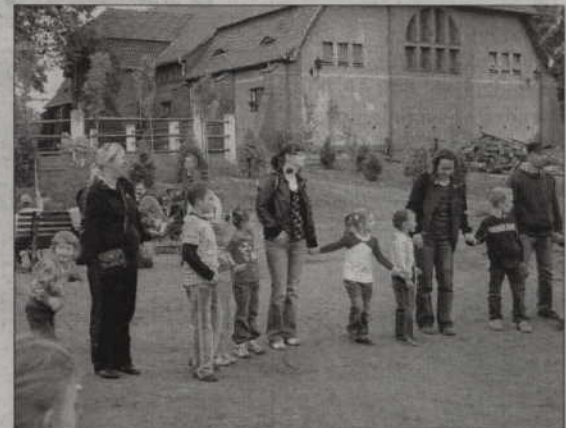
Przedшкоlne święto zorganizowano na Terenach Rekreacyjno-Wypoczynkowych „Miłosna”.

Spotkanie z pisarzem Zbigniewem Dmitrocią