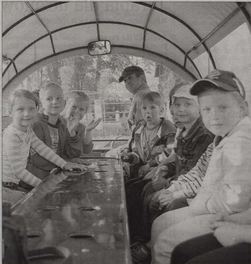
Wiele radości sprawiła dzieciom przejażdżka wozem cygańskim.

Przedszkole może pochwalić się bardzo bogatą ofertą edukacyjną. Zapewnia wszechstronną opiekę pedagogiczno-specjalistyczną. Jego dorobek był wielokrotnie prezentowany podczas spotkań krajowych liderów integracji, oraz gości z kraju, a także spoza granic Polski. Przedszkole wyposażone jest w najnowsze środki i pomoce dydaktyczne oraz sprzęt rehabilitacyjny. Cały budynek jest dostosowany do potrzeb dzieci niepeł-