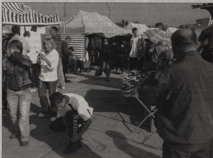
- To chyba jakaś sztuka? - reakcje przechodniów były „prawidłowe”.