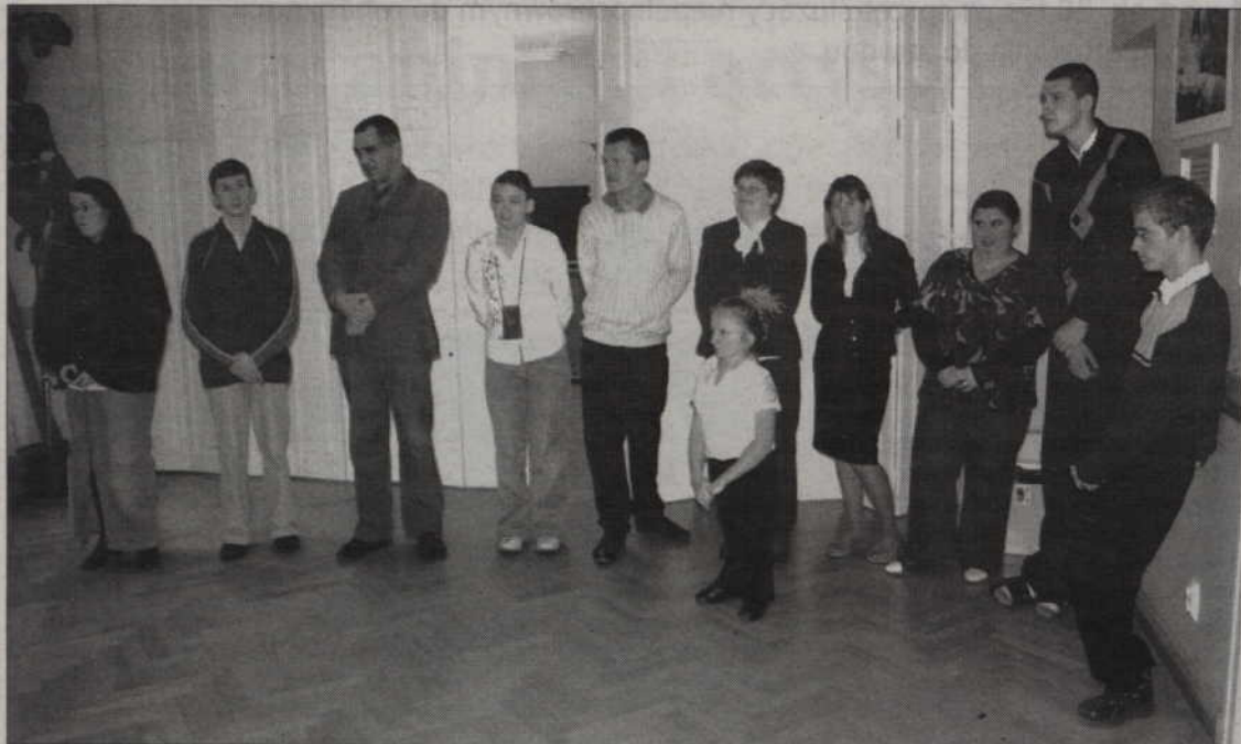
Uczestnicy projektu, który został wyróżniony w konkursie.