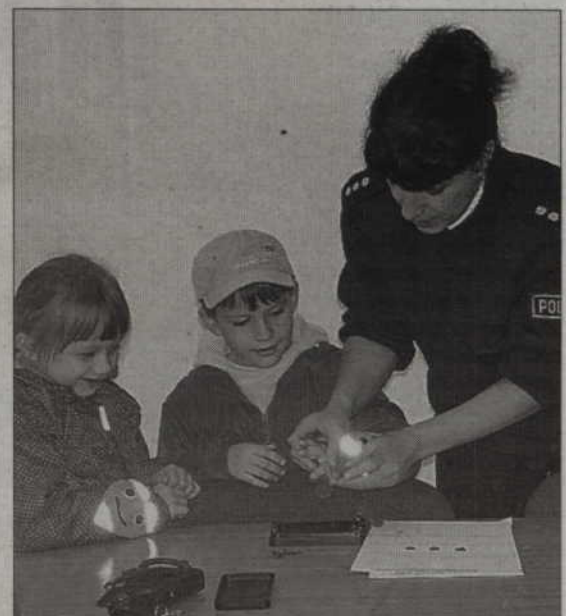
Ogromne emocje towarzyszyły zdejściowaniu odcisków palców.

KWIDZYN. Przedшкоlaki są częstymi gośćmi kwidzyńskiej komendy policji. Tym razem prace policjantów poznawały dzieci z Chatki Puchatka.