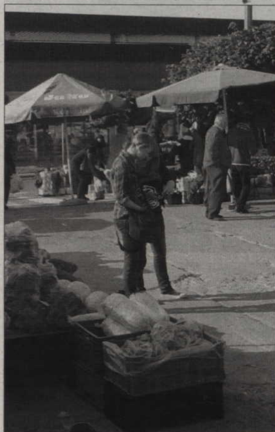
Odczytywanie sms-a też mogło zwrócić uwagę.