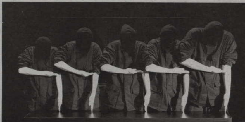
Rękodzieło artystyczne w wykonaniu Teatru Figur z Krakowa obejrzeć można w środę, 6 października o godz. 11.00.

W tym roku prezentacje festiwalowe rozpoczęły się