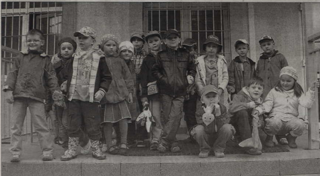
Przedшкоlaki z Chatki Puchatka przed kwidzyńską komendą policji.