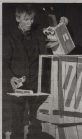
Staffan Björklunds Teater (Szwecja) zaprezentuje spektakl „Two on toe”.