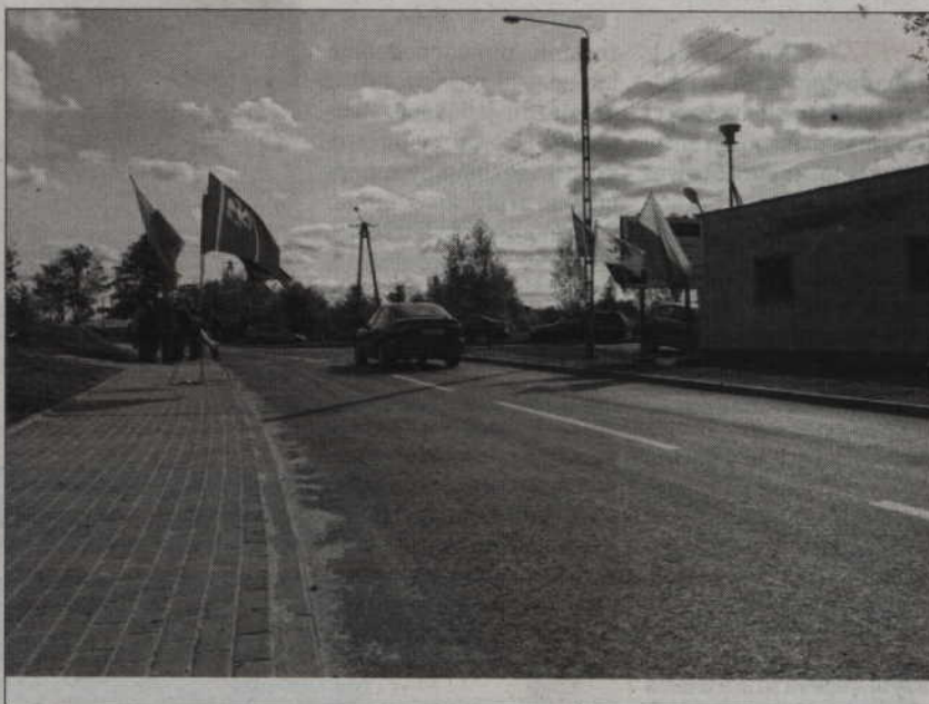
W Straszewie uroczystie otwarto zmodernizowany odcinek drogi Kwidzyna-Straszewo, na odcinku od skrzyżowania z drogą wojewódzką do Straszewa.

- Dlatego postanowiliśmy wspierać wszelkie starania władz gminnych i powiatowych w tym zakresie. Gratuluję przede wszystkim tym, którzy pisali wniosek o dofinansowanie tej inwestycji. Niemożliwe jest wsparcie bez dobrego przygotowa-