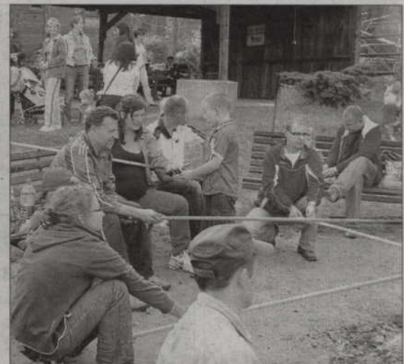
Celem imprezy jest integracja dzieci i rodziców 5 i 6-latków.