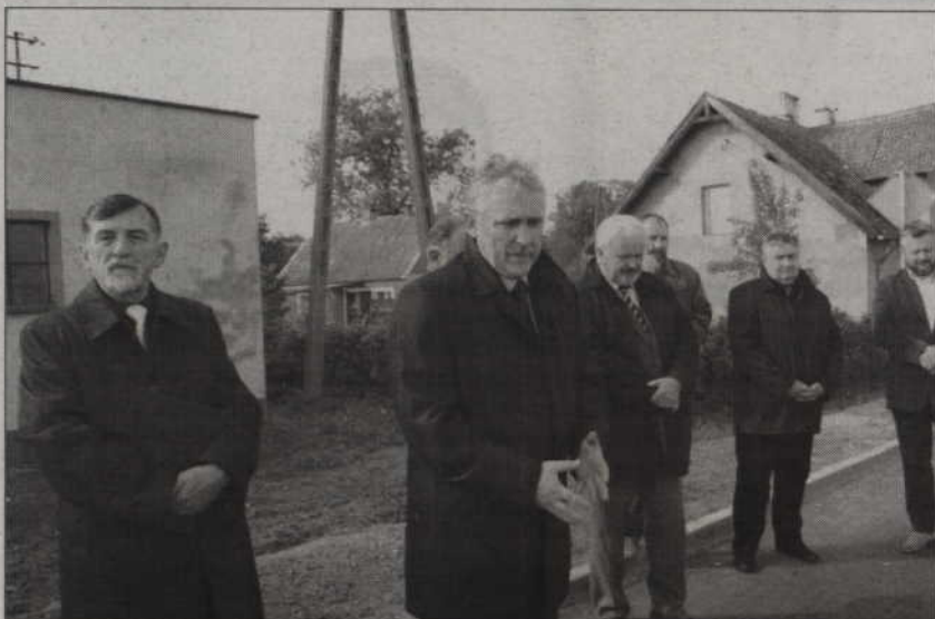
Kiedyś powiat kwidzyński miał najgorsze drogi w tej części województwa pomorskiego, która kiedyś należała do elbląskiego - przypomniał Leszek Czarnobaj, wicemarszałek województwa pomorskiego.

nia takiego wniosku. Mam nadzieję, że coraz częściej będziemy otwierać drogi w powiecie kwidzyńskim - mówi Leszek Czarnobaj.