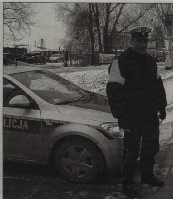
Policjanci drogówki w ciągu kilku dni zatrzymali sześciu nietrzeźwych kierowców.

Tego samego dnia ok. godz. 20.30 na ul. Piastowskiej w Kwidzynie