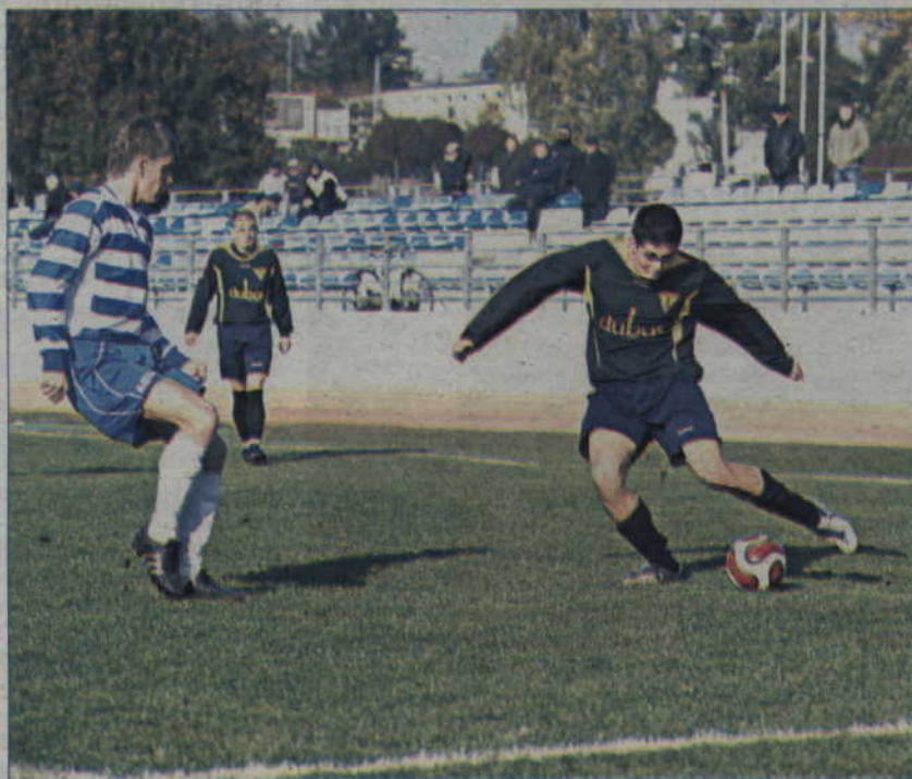
Seniorzy kwidzyńskiego Rodła są zdeterminowani. Żądają odejścia dotychczasowego zarządu klubu, który według nich nie interesuje się tym co dzieje się w zespole.

Walne Zgromadzenie, rezygnacja obecnego zarządu Rodła Kwidzyn oraz wybór nowych władz klubu - to grudniowa przyszłość kwidzyńskiego klubu piłkarskiego. Zdesperowani piłkarze zażądali ustąpienia władz klubu i ...otrzymali odpowiedź twierdzącą.