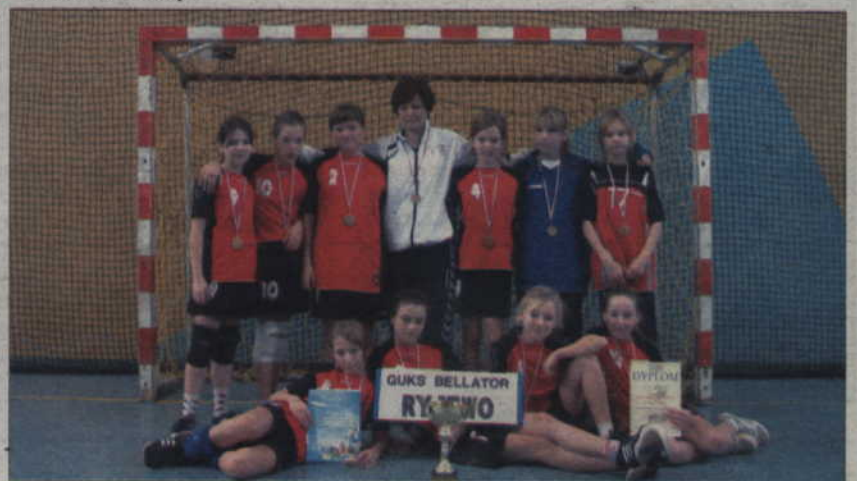
Bellator Ryjewo zajął w turnieju III miejsce: