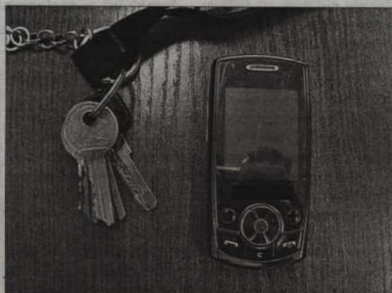
Znaleziono klucze i telefon komórkowy. Policja szuka ich właściciela.

13 listopada na ul. Sportowej w Kwidzynie obok siedziby straży pożarnej znaleziono telefon komórkowy oraz pęk pięciu kluczy zawieszonych na smyczy. Właściciel proszony jest o kontakt z Komendą Po-