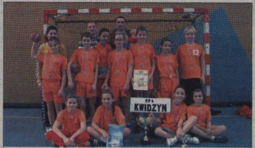
Zwycięska ekipa SP 4 Kwidzyn:

Organizatorzy turnieju nagrodzili również wyróżniające się zawodniczki w każdej z drużyn, które otrzymały pamiątkowe