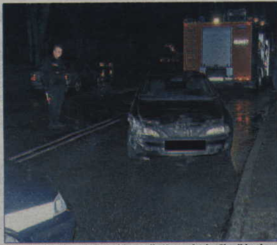
Wypadek wydarzył się u zbiegu ulic Kuracyjnej z Chodkiewicza.

Wstępne ustalenia funkcjonariuszy wykazały, że 51-letnia kierująca skodą fabią prawdopodobnie nie ustąpiła pierwszeństwa przejazdu jadącej oplem tigrą młodej kobiecie i uderzyła w jej samochód. 19-latką kierującą oplem z ogólnymi obrażeniami trafiła do szpitala. Obie kobiety były trzeźwe. Policja ustala wszystkie okoliczności wypadku. (ad)