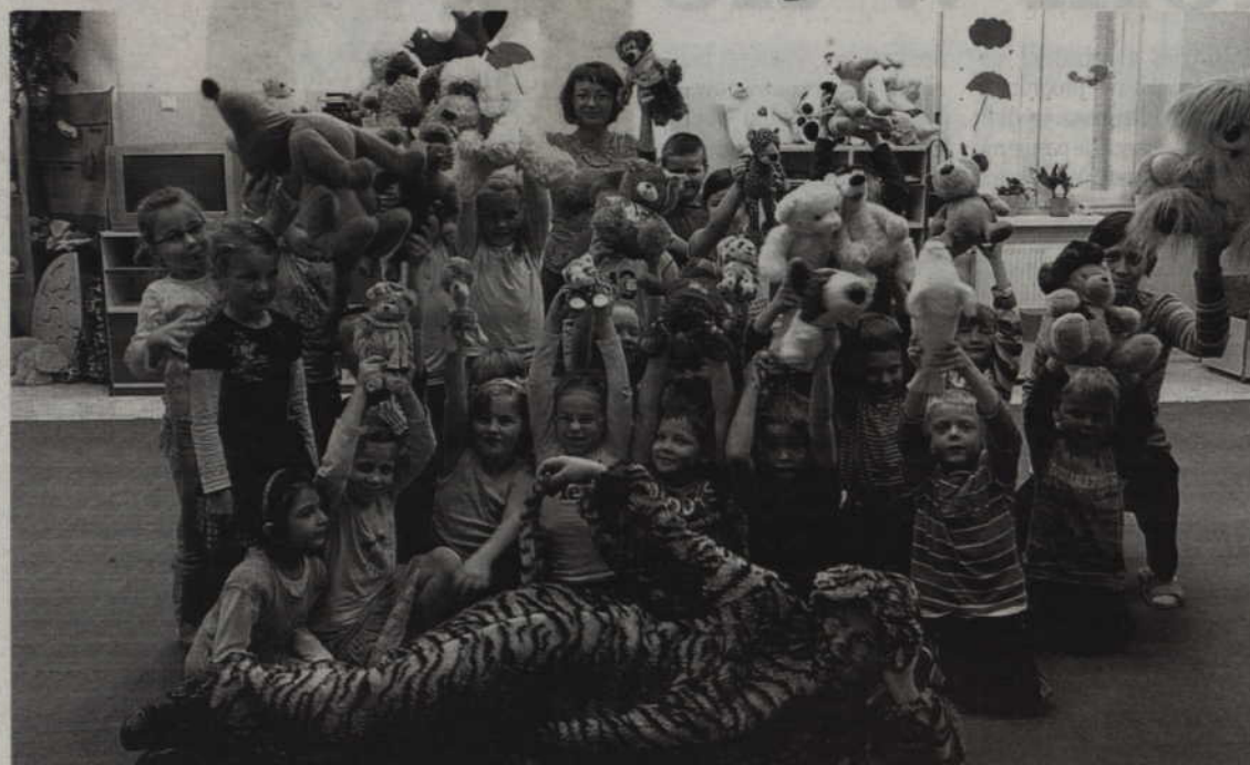
Dzieci z Przedszkola Integracyjnego nie mogą narzekać na nudę. Po niedawnym ślubowaniu najmłodszych przedszkolaków, w placówce zorganizowano Dzień Pluszowego Misia. Na zdjęciu: dzieci z pluszowym tygrysem, który odwiedził placówkę.