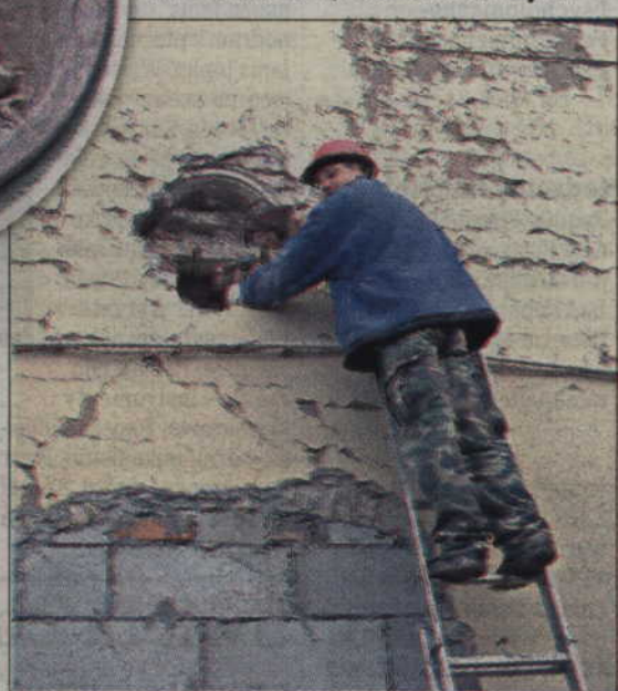
Podczas modernizacji budynku w 2008 r. odkryta została wnęka, w której znajdowała się rzeźba przedstawiająca głowę Chrystusa.