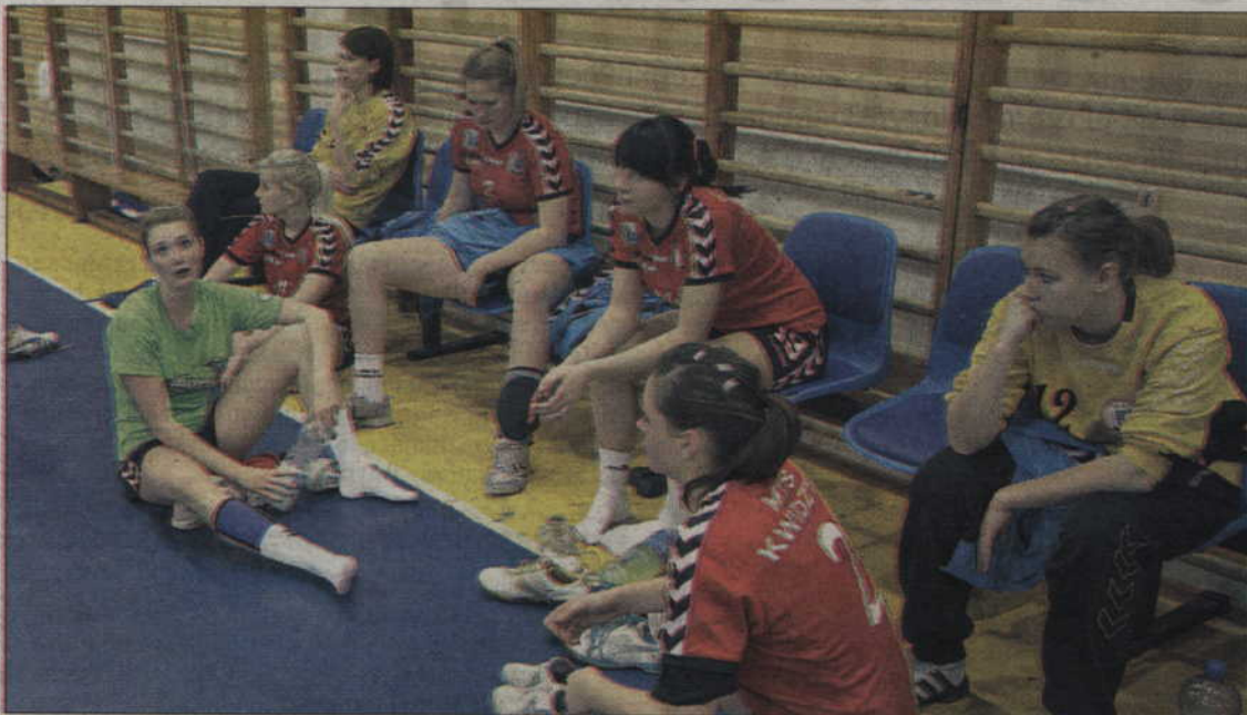
Przegrana ze Spartą to siódma porażka MTS w tym sezonie.