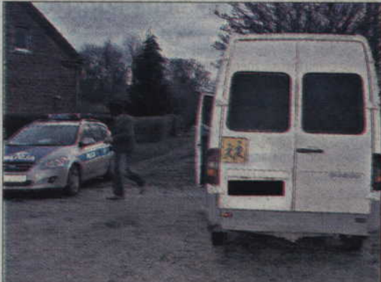
Policjanci sprawdzili dziesięć gimbusów, w czterech wykryli różne nieprawidłowości.

POWIAT. Po niedawnym przypadku zatrzymania w gminie Sadlinki pijanego kierowcy przewożącego dzieci do szkoły, policjanci postanowili częściej sprawdzać gimbusy pod względem technicznym.