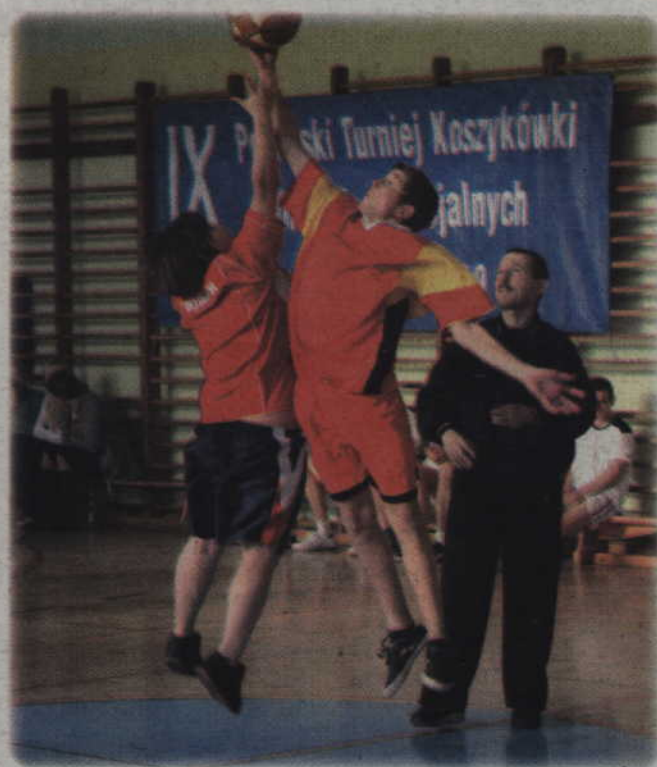
Walka koszykarzy była zacięta.