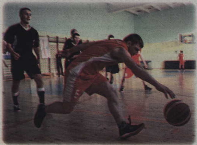
Turniej odbył się w sali Szkoły Podstawowej nr 4 w Kwidzynie.