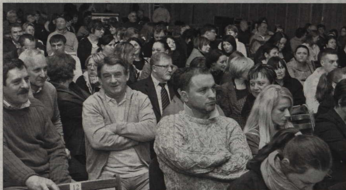
Publiczność nie zawiodła i licznie przybyła na koncert Grażyny Łobaszewskiej.