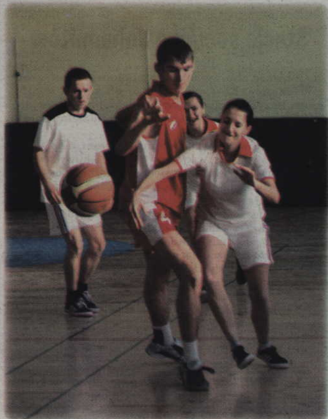
Mimo że jak zawsze w tego typu zawodach zwycięstwo nie jest najważniejsze, drużyny pokazały, że są bardzo dobrze przygotowane do turnieju.

Idea Olimpiad Specjalnych narodziła się w Stanach Zjednoczonych na początku lat 60. Eunice Kennedy Shriver, siostra tragicznie zmarłego prezydenta USA Johna F. Kennedy, zaczęła organizować półkolonie dla dzieci upośledzonych intelektualnie. Okazało się wówczas, że niepełnosprawni sportowcy są bardziej uzdolnieni niż początkowo przypuszczano. W 1968 roku Eunice Kennedy Shriver zorganizowała I Międzynarodowe Letnie Igrzyska Olimpiad Specjalnych w Chicago. Wzięło w nich udział około 1000 niepełnosprawnych zawodników. Obecnie ponad milion dzieci i dorosłych upośledzonych umysłowo z ponad 130 krajów świata bierze udział w programach Olimpiad Specjalnych. Działalność Olimpiad Specjalnych rozpoczęła się w Polsce w 1985 roku. Rok później w 28 województwach zorganizowano wojewódzkie Olimpiady Specjalne. I Ogólnopolska Olimpiada Specjalna odbyła się w Warszawie w 1987 roku.