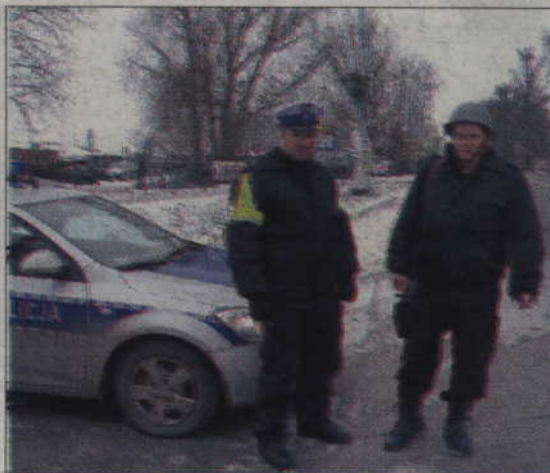
Złodzieje uciekali samochodem. Zatrzymano ich w Prabutach.