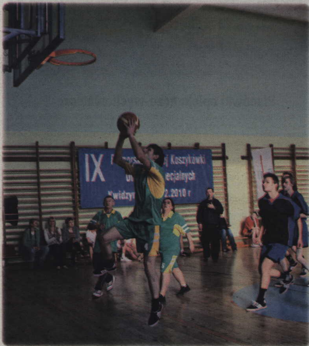
Koszykarze biorący udział w turnieju pokazali, że potrafią rzucać do kosza.