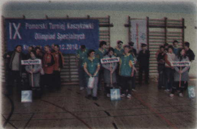
Trzy najlepsze drużyny grupy I w Pomorskim Turnieju Koszykówki Olimpiad Specjalnych.