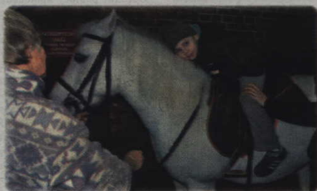
Pracownicy Terenów Rekreacyjno-Wypoczynkowych Miłosna, chcąc odwdziżyć się dzieciom za zbiórkę darów dla zwierząt, przygotowali przejażdżki na koniku Mollie.

- Odwiedziła nas przesympatyczna suczka rasy shih-tzu o imieniu Bessi, która zachwycała wszystkich swoją urodą, dużymi oczami oraz włosami spiętymi w kitki. Mogliśmy pobawić się z Jantarem rasy golden retriever, czempionem Polski przeszkolonym do dogoterapii.