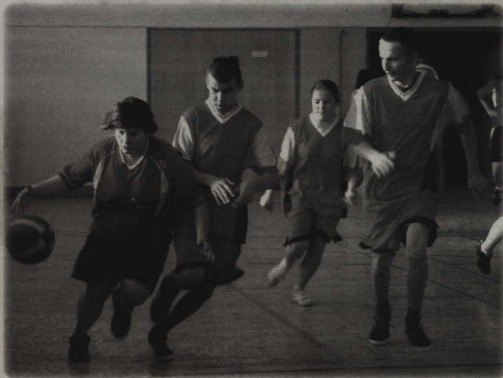
Ponad 80 niepełnosprawnych koszykarzy wzięło udział w Pomorskim Turnieju Koszykówki Olimpiad Specjalnych. Impreza została zorganizowana po raz dziewiąty.

Ponad 80 niepełnosprawnych koszykarzy wzięło udział w Pomorskim Turnieju Koszykówki Olimpiad Specjalnych. Impreza została zorganizowana po raz dziewiąty. Koszykarze zagrali w sali gimnastycznej Szkoły Podstawowej nr 4 w Kwidzynie. Mimo że jak zawsze w tego typu turniejach zwycięstwem nie jest najważniejsze, drużyny pokazały, że są bardzo dobrze przygotowane do turnieju i arkana koszykówki są im znane.