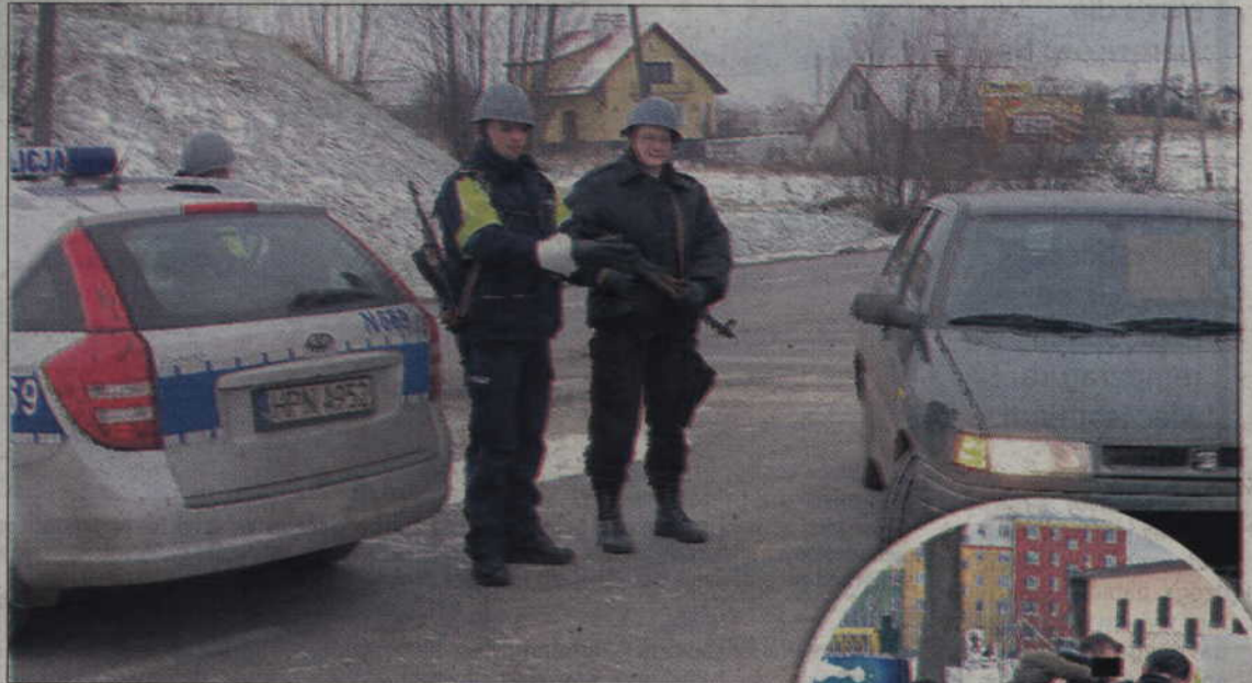
Policjanci sprawdzali, jaka zareagowaliby, gdyby w Kwizdynie rzeczywiście doszło do napadu na bank.

Pewien mieszkaniec Kwizdzyń widział, jak dwaj mężczyźni w kominiarkach wybiegli z jednego z kwizdyńskich banków trzymając w ręku czarny worek. Wsiedli do czarnego opla i odjechali. Mężczyzna zadzwonił na policję. Funkcjonariusze zatrzymali złodziei w Prabutach.