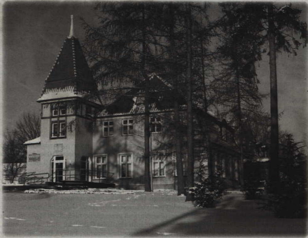
Warsztat Terapii Zajęciowej w Górkach, prowadzony przez Fundację „Misericordia”, zachęca niepełnosprawnych mieszkańców powiatu kwidzyńskiego do uczestnictwa w zajęciach terapeutycznych. Siedziba warsztatu mieści się w zabytkowym dworze w Górkach (gmina Kwidzyn).