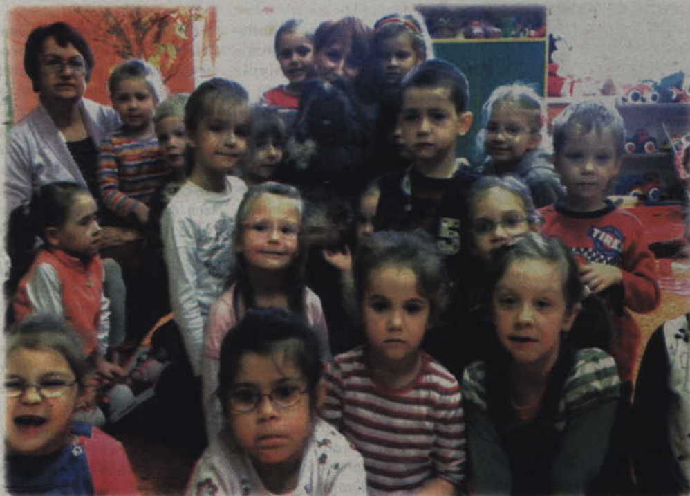
Poraz drugi w przedszkolu zorganizowano miesiąc dobroci dla zwierząt.