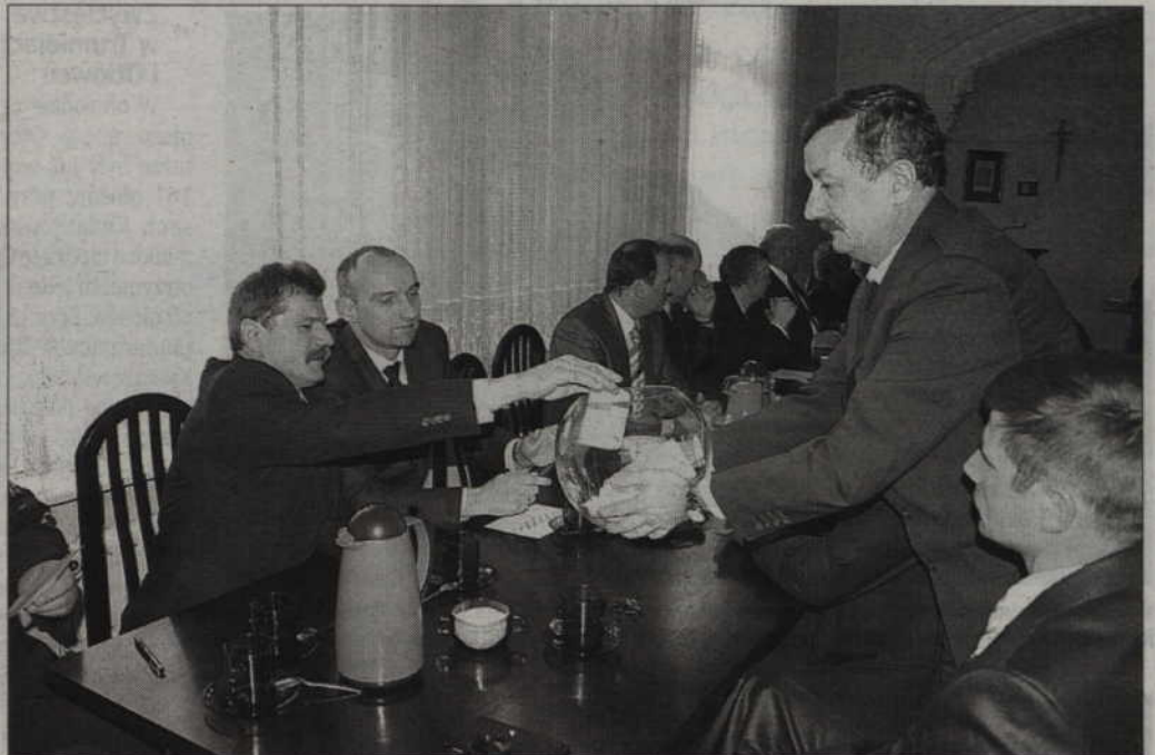
Radni oddają głosy w wyborach na przewodniczącego.

Konsensusu nie osiągnięto tylko w sprawie komisji statutowo-