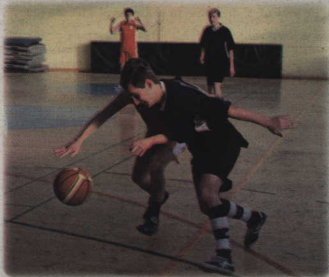
Ponad 80 niepełnosprawnych koszykarzy wzięło udział w turnieju.