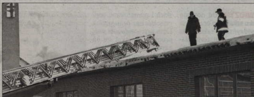
Kwidzyńskie służby przypominają o konieczności usuwania śniegu zalegającego na dachach budynków.

- W związku z wystąpieniem ekstremalnych warunków pogodowych, takich jak silne wiatry oraz intensywne opady śniegu, w wyniku których może nastąpić uszkodzenie obiektu budowlanego lub bezpośrednie zagrożenie takim uszkodzeniem, wzywam właścicieli lub zarządców obiektów budowlanych do usunięcia nadmiaru śniegu z dachów budynków - apeluje Wiesław Gałkowski, powiatowy inspektor nadzoru budowlanego. - Złóżcie z takich miejsc połączy dachowych, gdzie śnieg z powodu wiatru zalega grubszą warstwą. Mogą to być między innymi kosze dachowe. Śnieg może zalegać też przy ścianach attyk. Należy usunąć z elementów elewacji sople, bryły, nawisy lodowe i śniegowe, mogące zagrozić bezpieczeństwu osób znajdujących się na