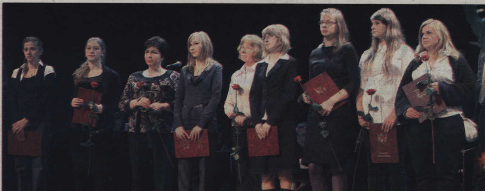
Z programu stypendialnego skorzystało prawie 90 uczniów szkół ponadgimnazjalnych oraz studentów.