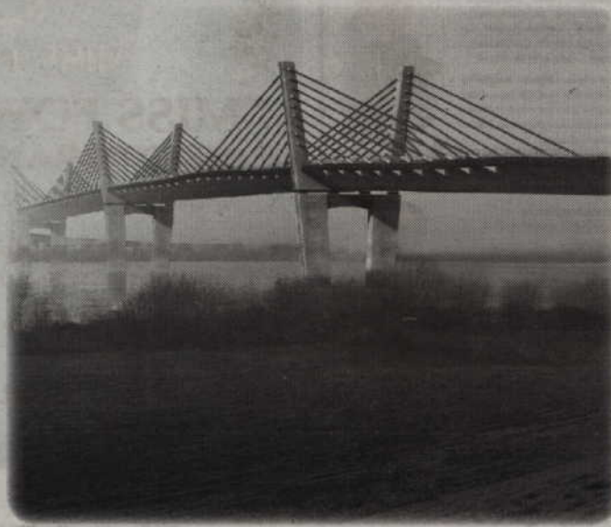
Konstrukcja typu extradosed (z ang. Extradosed prestressed bridge) będzie największą tego typu w Europie i jedną z największych na świecie.