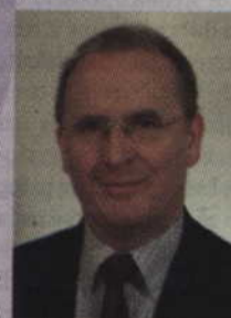
Jan Kulas poseł na Sejm

Z okazji Święta Kobiet wszystkim Szanownym Paniom - życzę dużo zdrowia, życiowej radości i miłości oraz powszechnego szacunku i uznania.