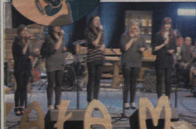
Uczestnicy prezentowali swój talent na scenie kwidzyńskiego teatru.