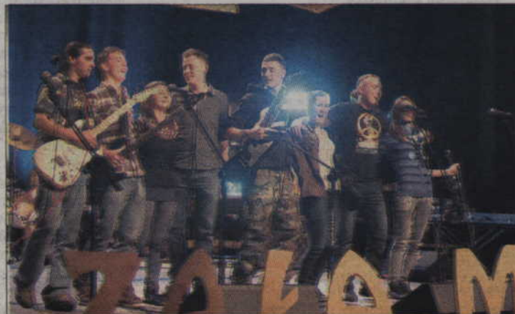
Radość po występie.