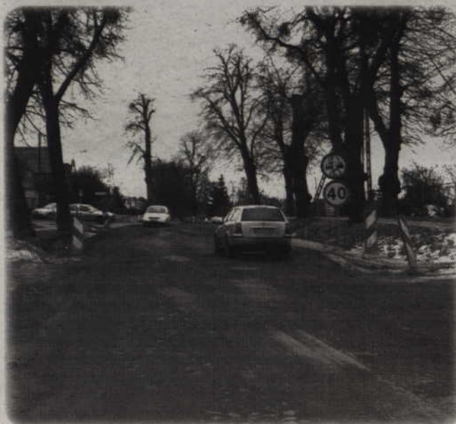
Na poprawę pogody i pojawienie się dodatniej temperatury czeka także Zarząd Dróg Wojewódzkich, który modernizuje odcinek drogi wyjazdowej z Kwidzyna w kierunku Sadlinek.

stwu Spraw Wewnętrznych i Administracji. Koszt inwestycji to ok. 2,8 mln zł, w tym połowa to środki z rządowego programu. Na poprawę pogody i pojawienie się dodatniej temperatury czeka także Zarząd Dróg Wojewódzkich, który modernizuje odcinek