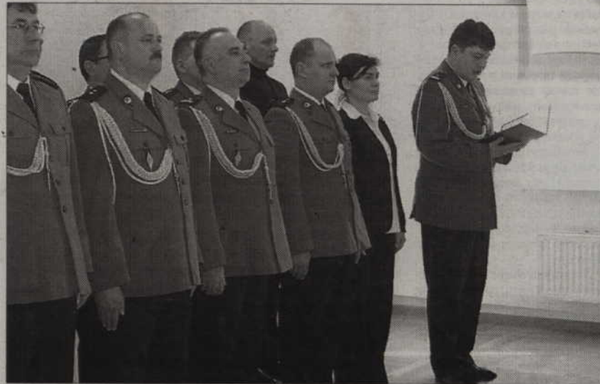
Kwidzyńscy policjanci witają nowych szefów.

We uroczystości uczestniczyli również przedstawiciele władz samorządowych, kierownicy powiatowych służb, prokurator rejonowy w Kwidzynie oraz funkcjonariusze i pracownicy kwidzyńskiego garnizonu. Opr. (ad)