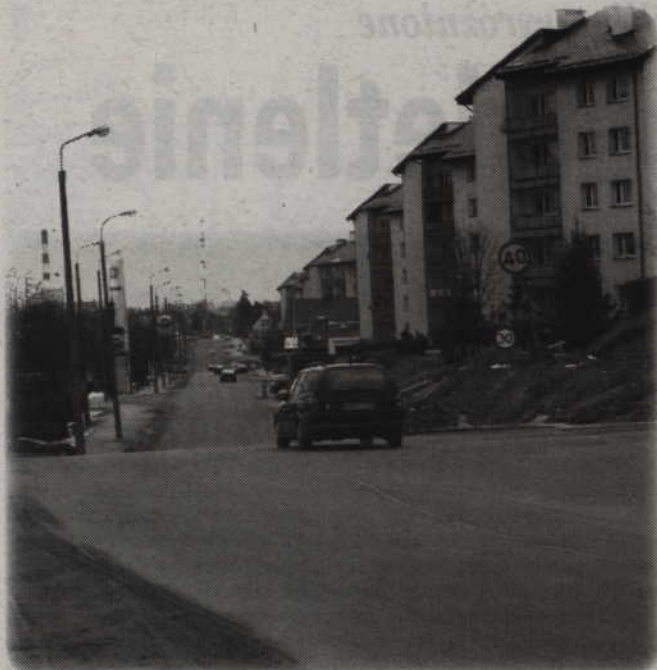
Przy ulicach Polnej i Wschodniej powstaną dodatkowe miejsca parkingowe.

Utrzymujące się mrozy są przyczyną opóźnień w realizacji inwestycji drogowych. Jeśli aura pozwoli, dokończona została modernizacja ulic Wschodniej i Polnej. Nawierzchnia została wykonana w ubiegłym roku. Do dokończenia pozostaje budowa nowych parkingów.