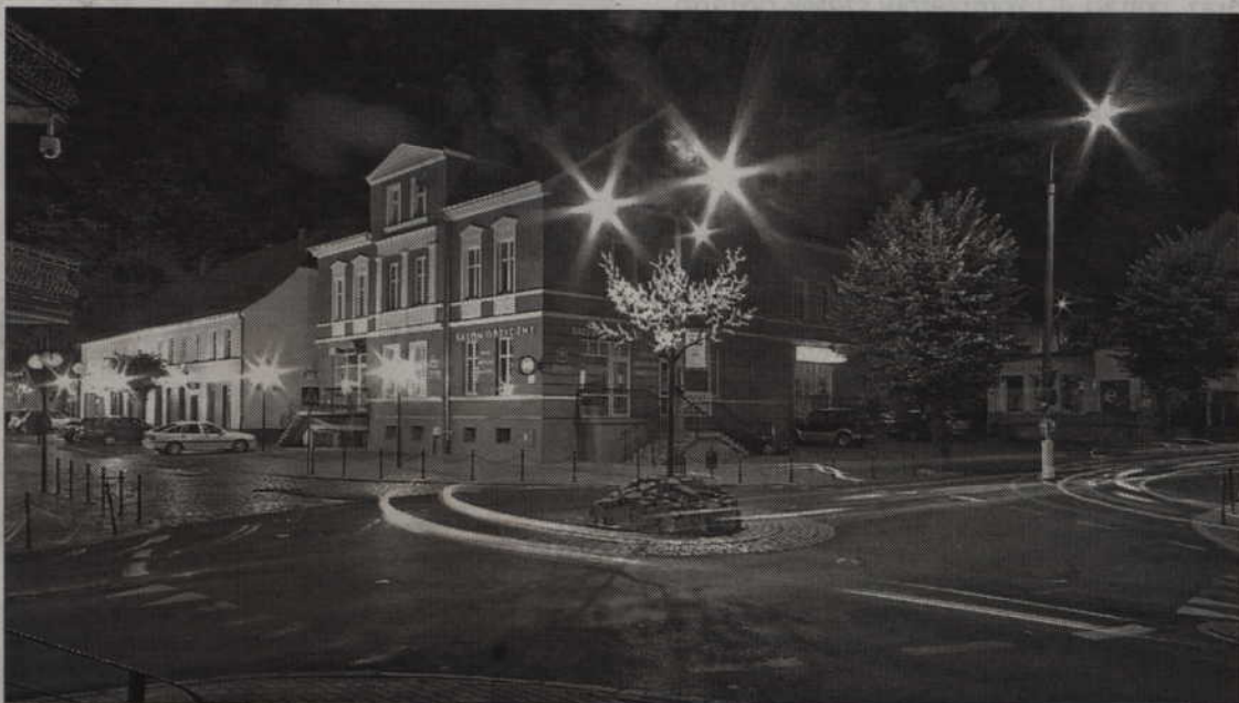
Na kwidzińskich ulicach już kilka razy zgasło światło. Wieczorem nie paliła się żadna latarnia.