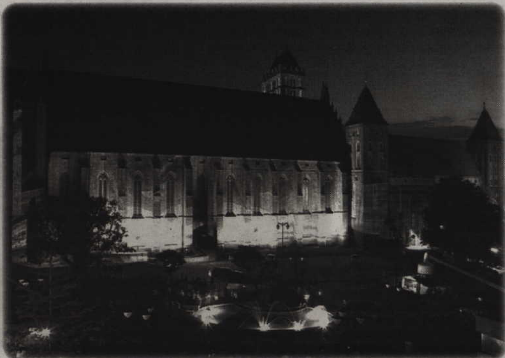
Oświetlenie placu Jana Pawła II i „Orlika” przy ul. Hallera zostało uznane za jedno z najlepszych i najładniejszych w Polsce. Wyróżnienia przyznano w ramach ogólnopolskiego konkursu dla miast i gmin, które w dwóch ostatnich latach przeprowadziły inwestycje oświetleniowe.

Oświetlenie placu Jana Pawła II i „Orlika” przy ul. Hallera zostało uznane za jedno z najlepszych i najładniejszych w Polsce. Wyróżnienia przyznano w ramach ogólnopolskiego konkursu dla miast i gmin, które w dwóch ostatnich latach przeprowadziły inwestycje oświetleniowe. Organizatorami konkursu są Polski Związek Przemysłu Oświetleniowego oraz Agencja SOMA.