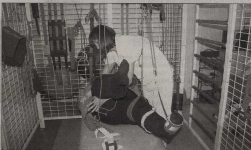
O ok. 200 tys. zł mniej niż w ubiegłym roku Państwowy Fundusz Rehabilitacji Osób Niepełnosprawnych na rehabilitację społeczną i zawodową w powiecie kwidzyńskim. To na zdjęciu: rehabilitacja prowadzona w Warsztacie Terapii Zajęciowej w Górkach (gm. Kwidzyn).