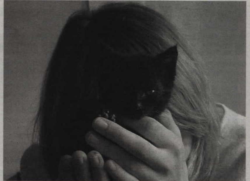
Dzieci mogą być szczęśliwe. Jednakże szkoła i rodzina powinny włączyć się w program "Zero tolerancji dla przemocy w szkole".

Choć uczniowie ukończyli już dziś 18 lat, to odpowiadając przed wydziałem rodzinnym i dla nieletnich, nadal zagrożeni są karą umieszczenia w zakładzie poprawczym. Może być ona jednak warunkowo zawieszona. Z racji osiągnięcia przez chłopców pełnoletniości nie można natomiast zastosować wobec nich nadzoru rodzicielskiego.