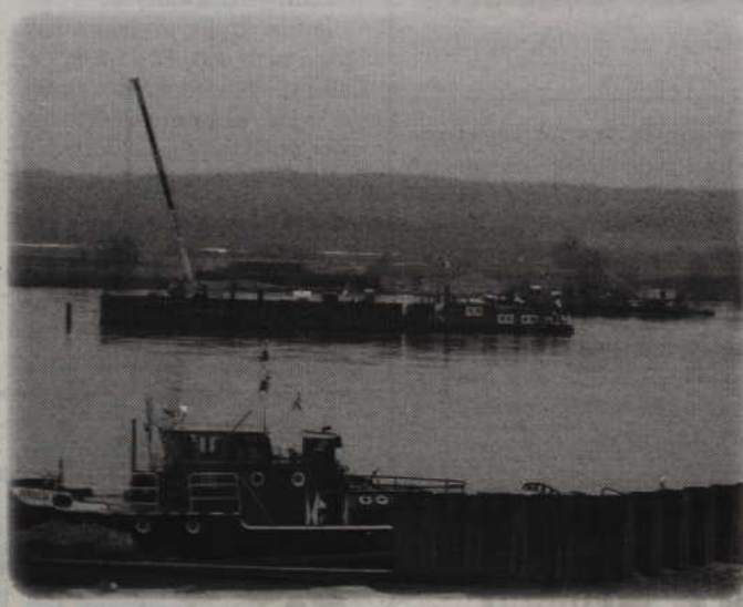
Wykonawcą mostu przez Wisłę jest konsorcjum polsko-hiszpańskie firm Budimex i Ferrovial Agroman. Most ma zostać oddany do użytku w grudniu 2012 r.