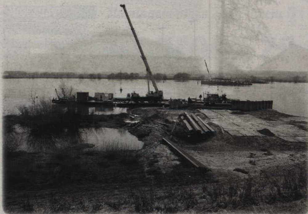
W Lipiankach (gmina Kwidzyn) trwa budowa mostu przez Wisłę. Budowane są też drogi dojazdowe.

Trwa budowa mostu przez Wisłę. Most będzie miał ponad 800 m długości. Konstrukcja typu extradosed (z ang. Extradosed prestressed bridge) będzie największą tego typu w Europie i jedną z największych na świecie.