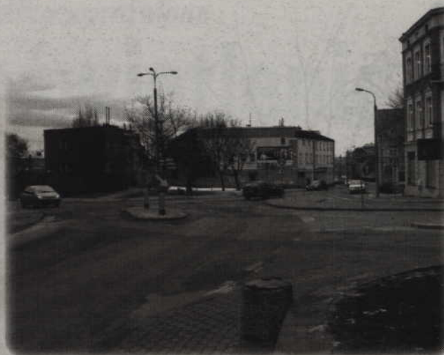
U zbiegu ulic Batalionów Chłopskich, Chopina i Targowej powstanie nowe rondo. Poprawi ono ruch w tej części miasta. Zaplanowano także modernizację ulic.

Nowe rondo zostanie zbudowane u zbiegu ulic Batalionów Chłopskich, Chopina oraz Górnej. Zaplanowano także modernizację ulic. Inwestycja zostanie wykonana w tym roku. Na realizację zadania zaplanowano ok. 3,5 mln zł.