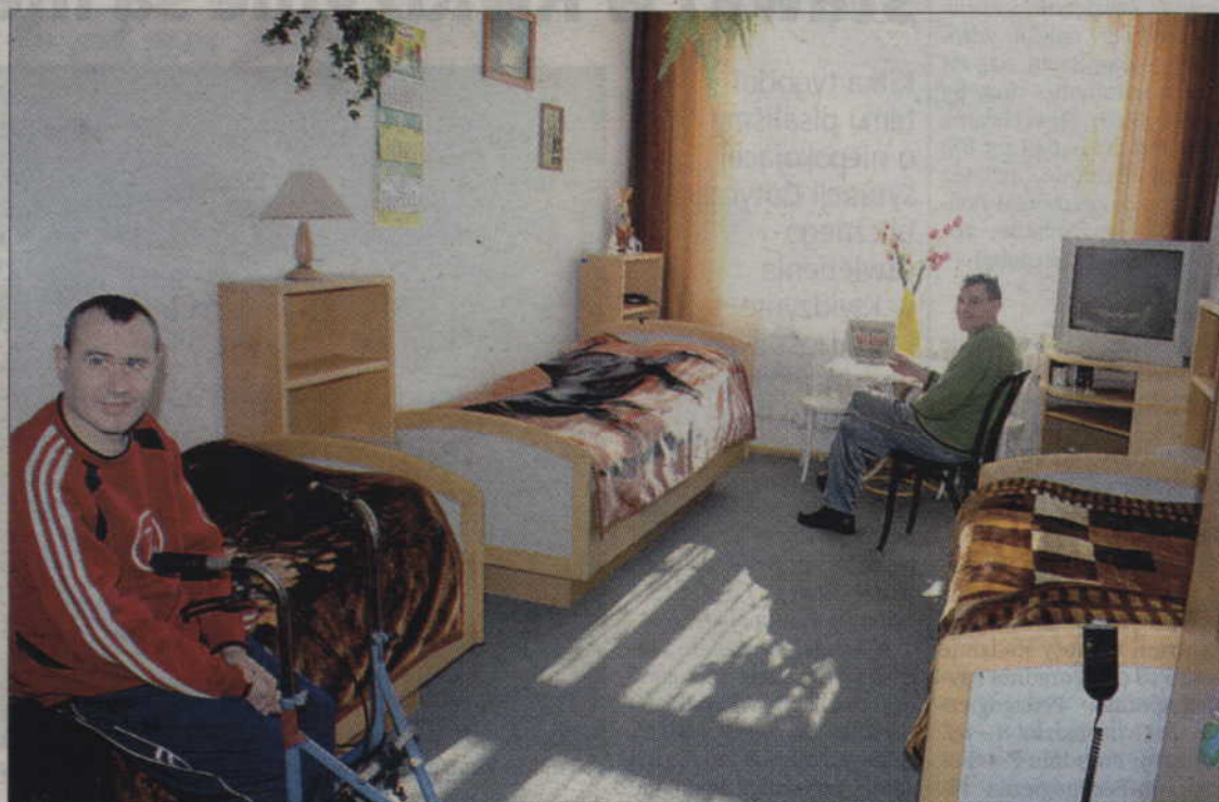
Mieszkańcy Domu Pomocy Społecznej w Ryjewie korzystają już z łóżek rehabilitacyjnych oraz szafek, które są darem zakonu Johannitów. Łózka można regulować elektrycznie.