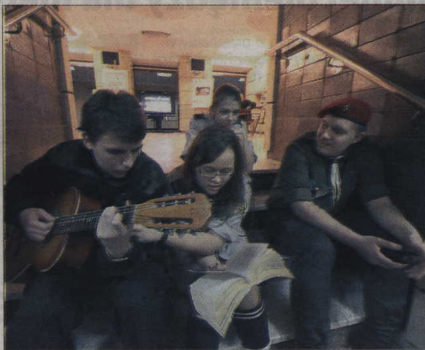
Ostatnia próba przed występem na scenie.

Jury oceniało także solistów w poszczególnych kategoriach.