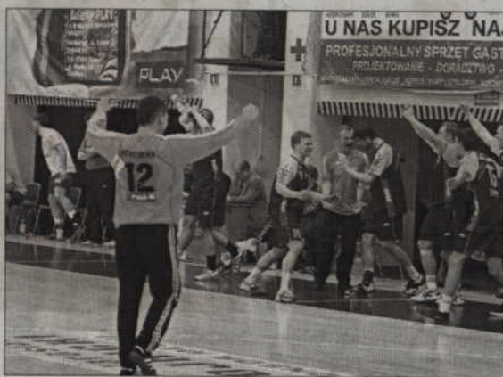
Tak ze zwycięstw nad Wicemistrzem Polski cieszyli się zawodnicy Głogowa.

Przez następne 8 minut goście doliczyli 5 trafień przy 2 bramkach Seroki oraz Mroczkowskiego. W efekcie w 52 minucie MMTS przegrywał z teoretycznie słabszym rywalem 25:28. Kwidzynianom