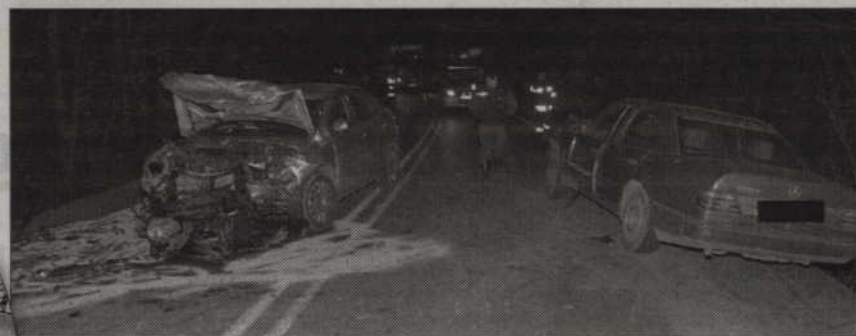
W Brachlewie zderzyły się trzy samochody osobowe.

W wypadku w Prabutach ranny został ośmiolatek, który jechał skuterem jako pasażer.