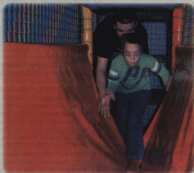
Dla w pełni sprawnych osób tego typu wyjazdy nie wydają się niczym specjalnym, jednak dla wychowanków ośrodka to możliwość poznania świata, który dotychczas był dla nich niedostępny.