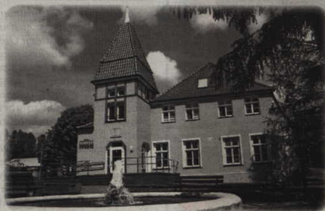
Warsztat Terapii Zajęciowej powstał w październiku 1993 roku przy Domu Pomocy Społecznej w Kwidzynie. Od 1 stycznia 2004 roku prowadzi go Fundacja „Misericordia” w Kwidzynie, w zabytkowym dworze w Górkach.

Warsztat Terapii Zajęciowej powstał w październiku 1993 roku przy Domu Pomocy Społecznej w Kwidzynie. Od pierwszego stycznia 2004 roku prowadzi go Fundacja „Misericordia” w Kwidzynie, w zabytkowym dworze w Górkach. Zajęcia prowadzone są w pracowniach terapii życia codziennego, stolarskiej, ceramicznej, plastycznej, komputerowej, wikliniarskiej, redakcyjnej, artystycznej i ogrodniczo-gospodarczej. Podczas zajęć rozwijane są między innymi psychofizyczne sprawności niezbędne w pracy, podstawowe, a także specjalistyczne umiejętności