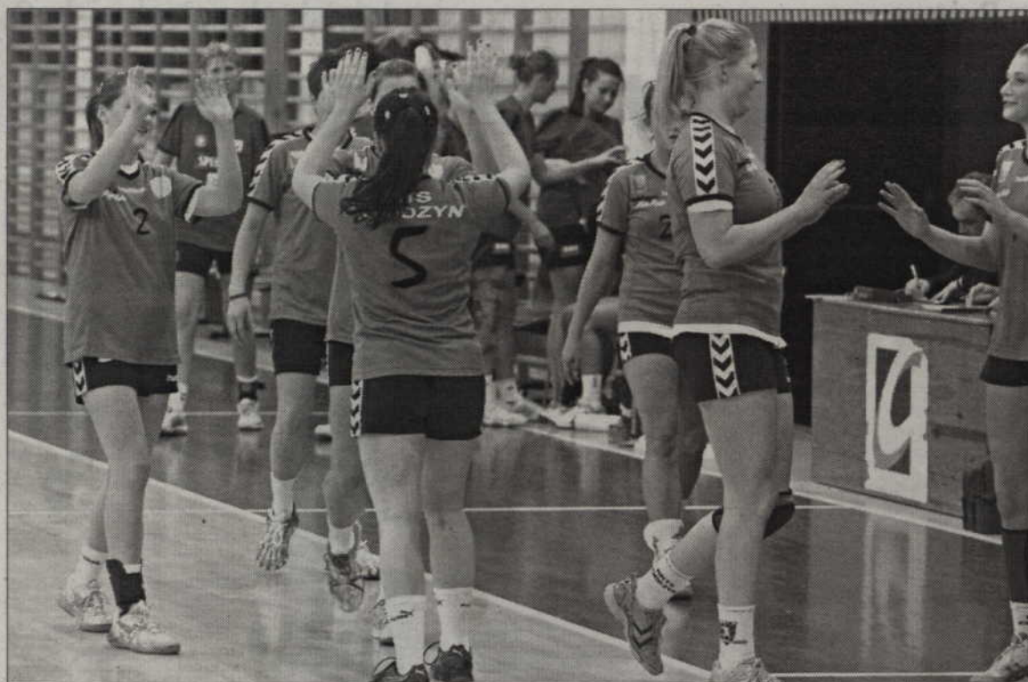
Piłkarki MTS Kwidzyn cieszyły się z czwartego zwycięstwa w lidze.