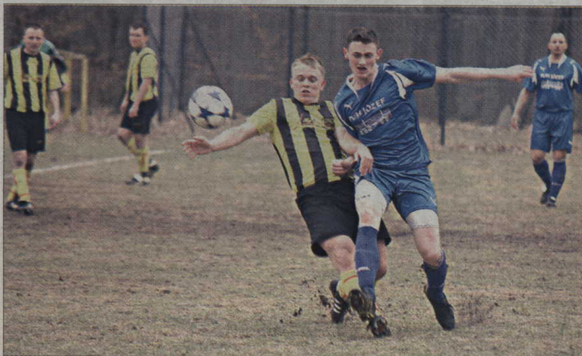
Spotkanie w Ryjewie obfitowało w twarde starcia na boisku.

W 58 minucie bramkarza gospodarzy próbował