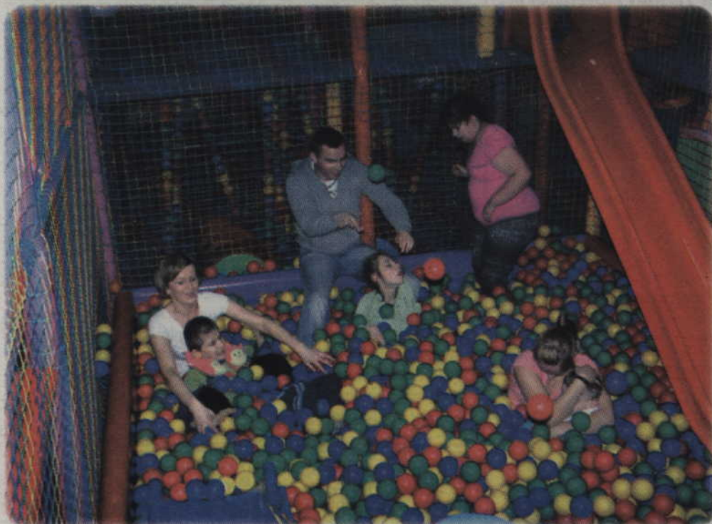
Wychowankowie Ośrodka Rehabilitacyjno-Edukacyjno-Wychowawczego w Okrągłej Łące odwiedzili kwidzyńską „Kulkolandię”.

Dla wielu niepełnosprawnych dzieci, które większość czasu spędzają w domu lub ośrodku, doświadczanie zewnętrznego świata często jest utrudnione. Jednak wychodzenie na zewnątrz, pokonywanie barier i ograniczeń to niezbędny element rehabilitacji. Doskonale o tym wiedzą pracownicy Ośrodka Rehabilitacyjno-Edukacyjno-Wychowawczego w Okrągłej Łące (gmina Sadlniki). Placówka jest przeznaczona dla dzieci i młodzieży z wieloraką niepełnosprawnością, z upośledzeniem umysłowym w stopniu głębokim oraz z upośledzeniem umysłowym w stopniu umiarkowanym i znacznym, a także dla dzieci z autyzmem.