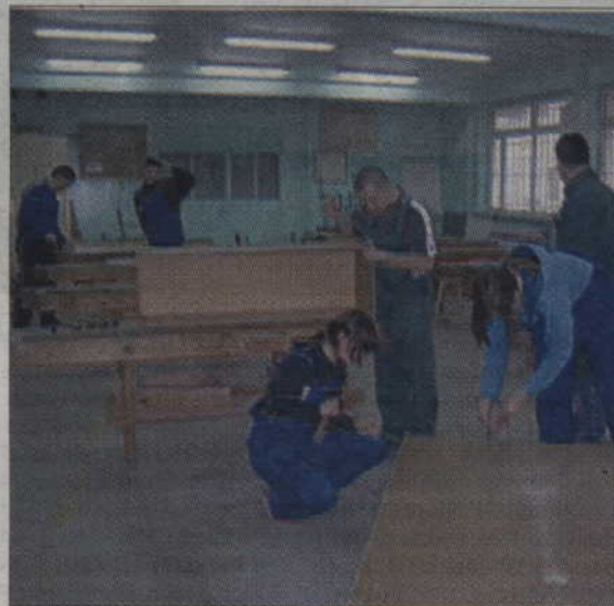
W Centrum Kształcenia Praktycznego ma się odbywać nauka wszystkich zawodów, jakie zdobywają uczniowie szkół ponadgimnazjalnych powiatu kwidzyńskiego.

- Pozwoli to na wykonanie jeszcze w tym roku ca-