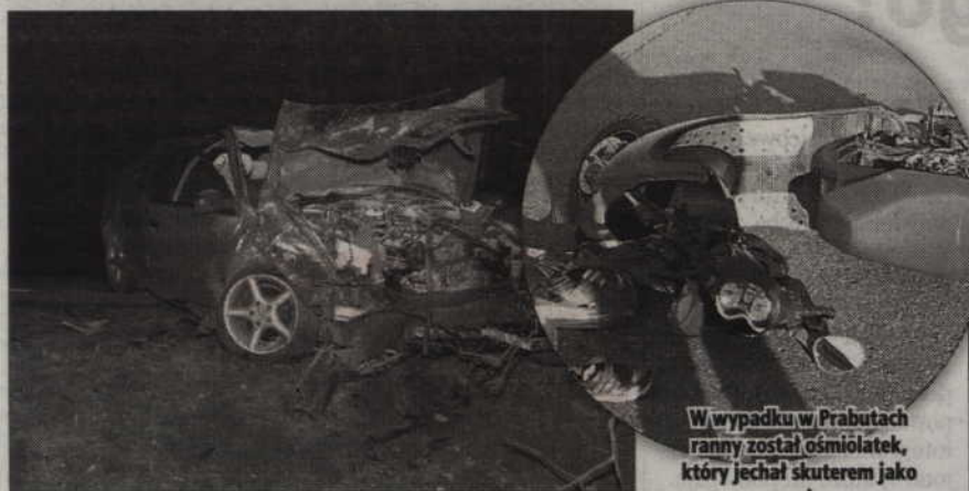
W Brachlewie doszło do zderzenia czołowego na drodze krajowej nr 55.

W wypadku w Prabutach ranny został ośmiolatek, który jechał skuterem jako pasażer.