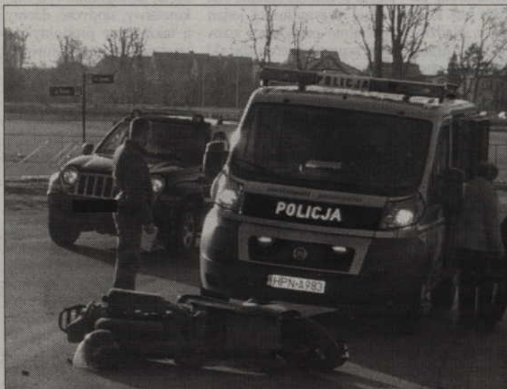
W Prabutach kierowca samochodu nie ustąpił pierwszeństwa skuterowi.

Przed godz. 19.00 tego samego dnia na drodze krajowej nr 55 w Brachlewie wydarzył się drugi wypadek, w którym zderzyły się trzy samochody osobowe. Policjanci ustalili, że volkswagen pasat na łuku drogi zjechał na przeciwległy pas ruchu uderzył czołowo w jadące z przeciwka audi. Następnie odbijając się od samochodu, pasat uderzył tyłem w jadącego za nim mercedesa. 30-letni kierowca audi z obrażeniami