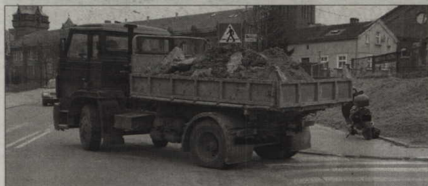
Do wypadku doszło, ponieważ kierowca ciężarówki nie ustąpił pierwszeństwa skuterowi.