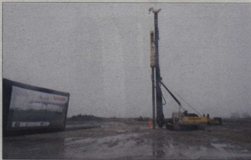
Budowa mostu rozpoczęła się jesienią ubiegłego roku. Most ma być oddany do użytku w grudniu 2012 roku.