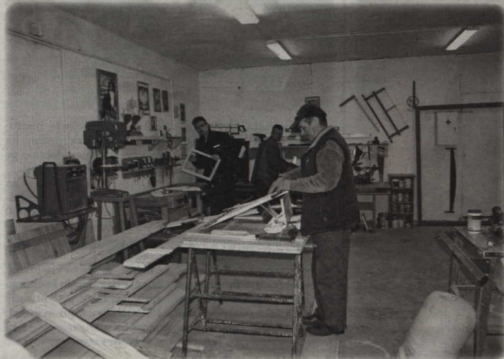
Zajęcia prowadzone są w pracowniach terapii życia codziennego, stolarskiej, ceramicznej, plastycznej, komputerowej, wikliniarskiej, redakcyjnej, artystycznej i ogrodniczo-gospodarczej. Na zdjęciu: zajęcia w pracowni stolarskiej.