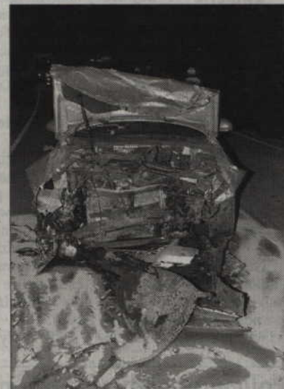
Auta zostały całkowicie zniszczone.

ciała trafil do szpitala. Kierowcy wszystkich pojazdów uczestniczących w wypadku byli trzeźwi.