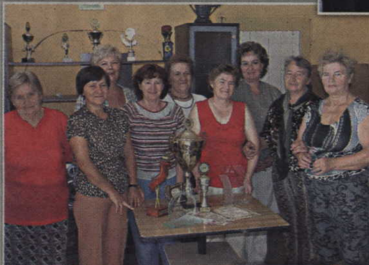
5. KGW Cygany