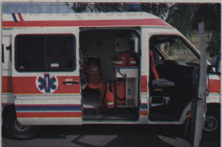
999 to numer alarmowy na Pogotowie Ratunkowe w Kwidzynie. Dyrekcja szpitala zapewnia, że wykręcając go, uzyskamy połączenie.

– Mamy dwie niezależne linie telefoniczne, więc nawet jeśli jedna linia jest