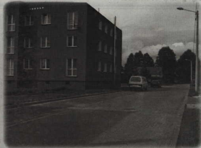
Dobiega końca przebudowa dróg osiedlowych w Marezie Osiedlu.

Dobiegła końca przebudowa dróg osiedlowych w Marezie Osiedlu. Wykonawcą był Zakład Usług Wielobranżowych w Prabutach. Koszt inwestycji to ok. 650 tys. zł. Inwestycja została dofinansowana ze środków Agencji Nieruchomości Rolnych.