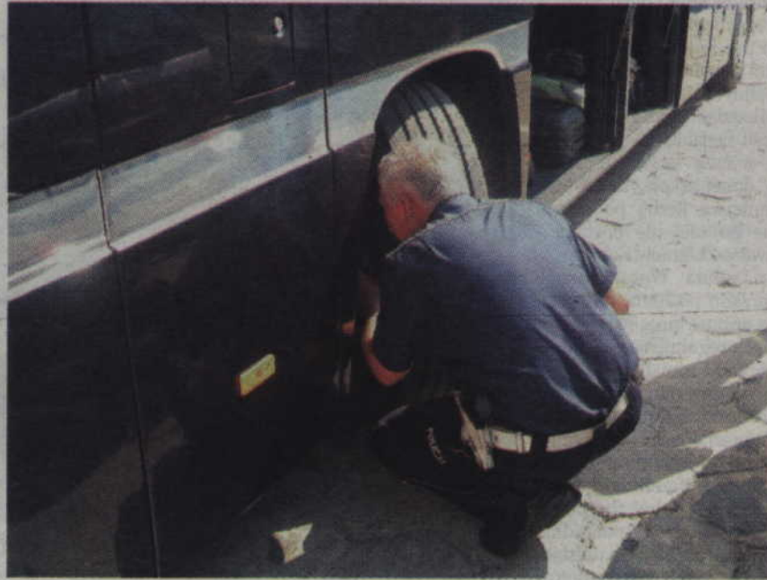
Funkcjonariusze kwidzyńskiej drogówki kontrolują autokary przewożące dzieci i młodzież.

- Kontrole odbywać się będą w Kwidzynie przy skrzyżowaniu ul. Malborskiej z ul. Furmańską, w zatoce Inspekcji Transportu Drogowego – dodaje rzeczniczka.