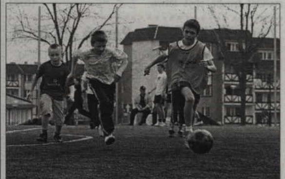
Do turnieju piłkarskiego „Renawy” zapisywać się można tylko do 9 września.