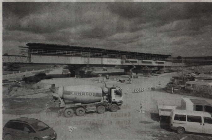
red tech. MK