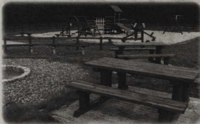
Plac zabaw w Tychnowach.