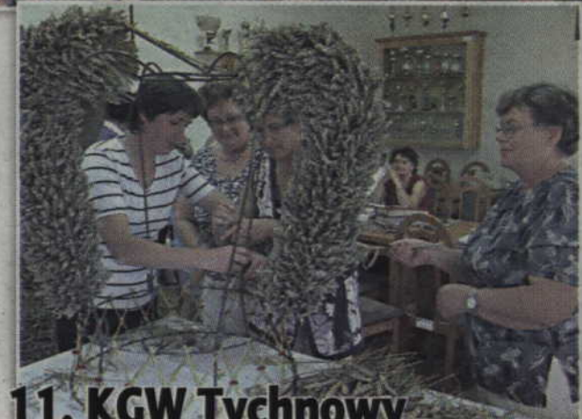
11. KGW Tychnowy