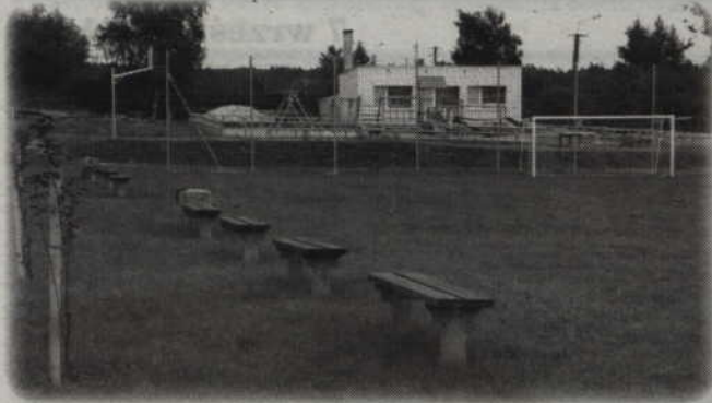
Nowe miejsce do zabawy i rekreacji dla mieszkańców Kamionki.

Nowe miejsca do zabawy oraz rekreacji powstały w gminie. Nowy plac zabaw mają dzieci w Kamionce. Powstał też teren do rekreacji dla wszystkich mieszkańców sołectwa.