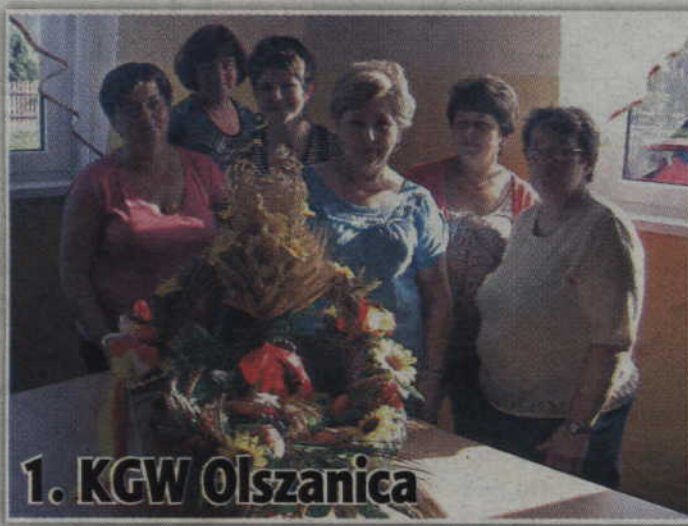
1. KGW Olszanica