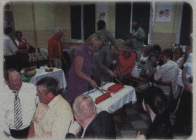
Wspólne dzielenie dwóch tortów podczas spotkania w Rakowcu.