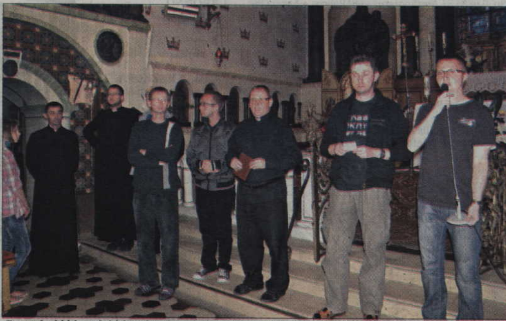
- To prawda, dzisiejsza młodzież przeżywa kryzys wiary, więc naturalnym jest, że w społeczności szkół katolickich łatwiej odnajdą odpowiedzi na nurtujące ich pytania – podkreśla ks. Szopiński.

- Owszem, Collegium Marianum jest szkołą humanistyczną.