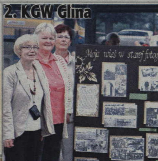
2. KGW Głina