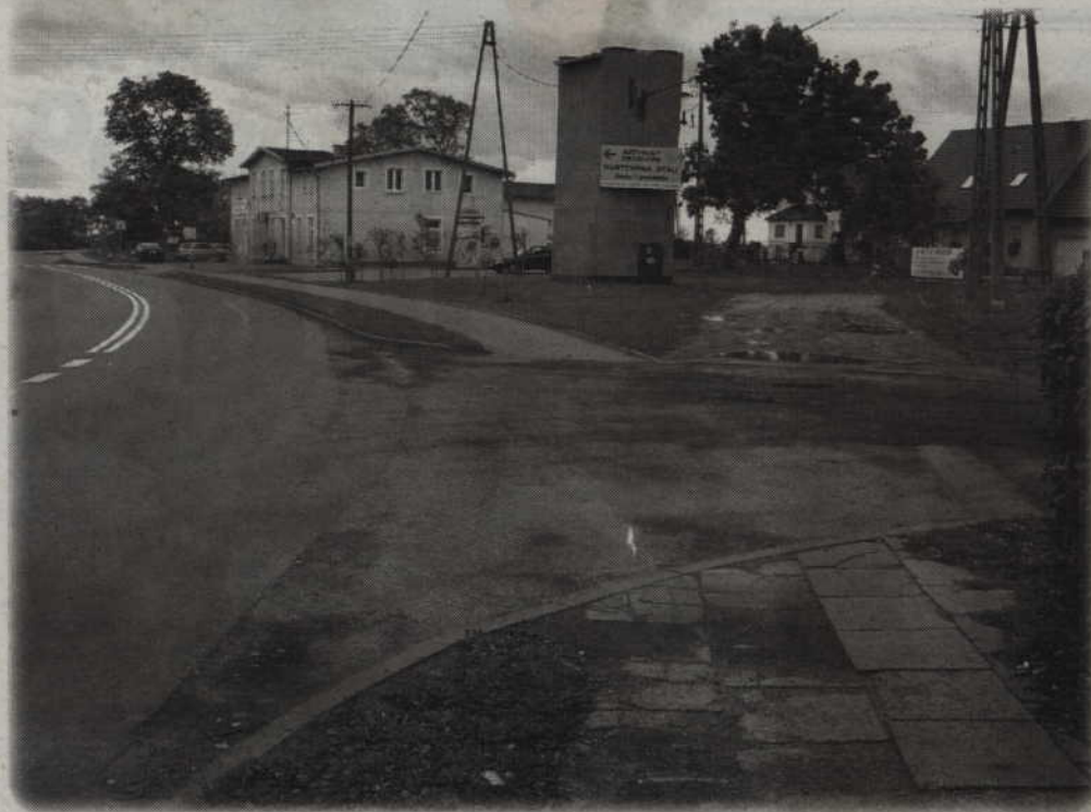
W Tychnowach powstanie ścieżka pieszo-rowerowa. Będzie miała ok. 1 km długości. Powstaną także trzy zatoki autobusowe.