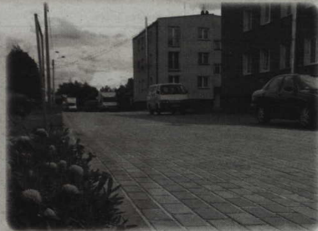
Nawierzchnie ulic są już gotowe.

zastoje wody. O problemie tym informowali nas także mieszkańcy. W przepompowniach kanalizacji burzowej nie dzia-