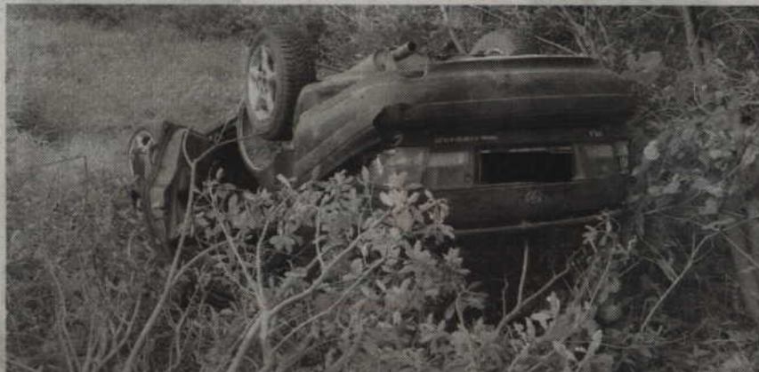
Mieszkaniec powiatu grudziądzkiego najprawdopodobniej zasnął za kierownicą i uderzył w drzewo. Do wypadku doszło w Gardai.

W niedzielę w Gardei rozbił się 45-letni mieszkaniec powiatu grudziądzkiego. Mężczyzna, jadący skodą fabią, na prostym odcinku drogi zjechał na prze-