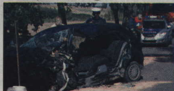
W Gardei kierowca skody fabii uderzył w drzewo. Prawdopodobnie zasnął za kierownicą.