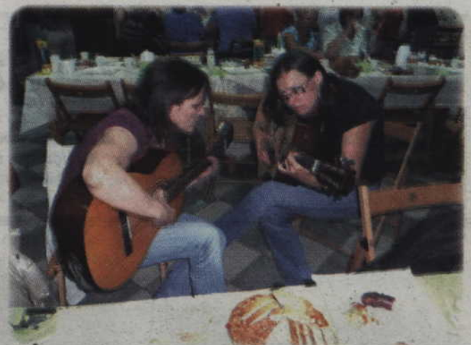
Nie wszystkie spotkania miały oficjalny charakter.

Samorządowcy z gminy Orechowo z Autonomicznej Republiki Krym byli gośćmi gminy Kwidzyn. Gmina Orechowo znajduje się w rejonie saskim, odpowiedniku naszego powiatu. Rejon zamieszkuje ponad 80 tys. mieszkańców, czyli podobnie jak powiat kwidzyński. Gmina Orechowo liczy 10 tys. mieszkańców. To podobnie jak gmina Kwidzyn. Siedzibą władz rejonu jest miasto Saki, w którym mieszka ok. 27 tys. osób. Miasto znane jest z uzdrowiska i rozlewni wody mineralnej. Autonomiczna Republika Krymu położona jest na północnym wybrzeżu Morza Czarnego, na półwyspie Krym. Stolicą republiki jest Symferopol. Autonomiczna Republika Krymu powstała w 1992 r.