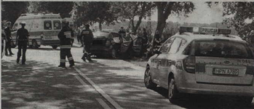
W Kołodziejach zginął 44-letni mieszkaniec powiatu iławskiego. Podczas manewru wyprzedzania stracił panowanie nad autem.

ciwny pas i uderzył w drzewo. Policjanci wstępnie ustalili, że mężczyzna wracał z pracy i prawdopodobnie zasnął za kierownicą. Był trzeźwy – dodaje Bożena Schab, rzeczniczka kwidzińskiej policji. – 45-latek ze złamaną kością udową został przewieziony do szpitala.