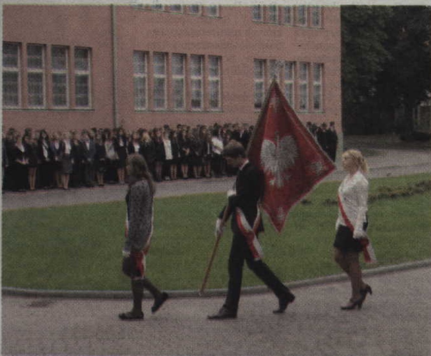
Tak prezentował się poczet sztandarowy w I Liceum Ogólnokształcącym im. Władysława Gębika w Kwidzynie.