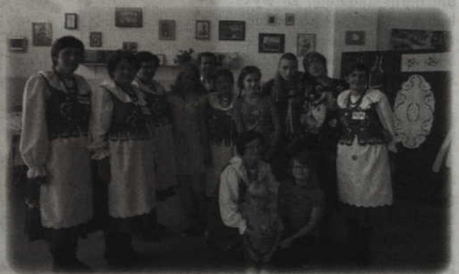
Twórczość ludowa, w tym stroje to jeden z tematów warsztatów.

Tematyka dotychczas organizowanych warsztatów to „Hafciarstwo, czyli jak