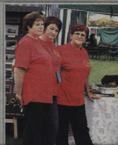
7. KGW Okrągła Łąka