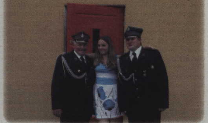
Goście z gminy Orechowo odwiedzili Ochotniczą Straż Pożarną w Tychnowach