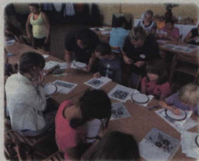
Pracownia haftu artystycznego powstała w świetlicy kulturalno-oświatowej w Pastwie.