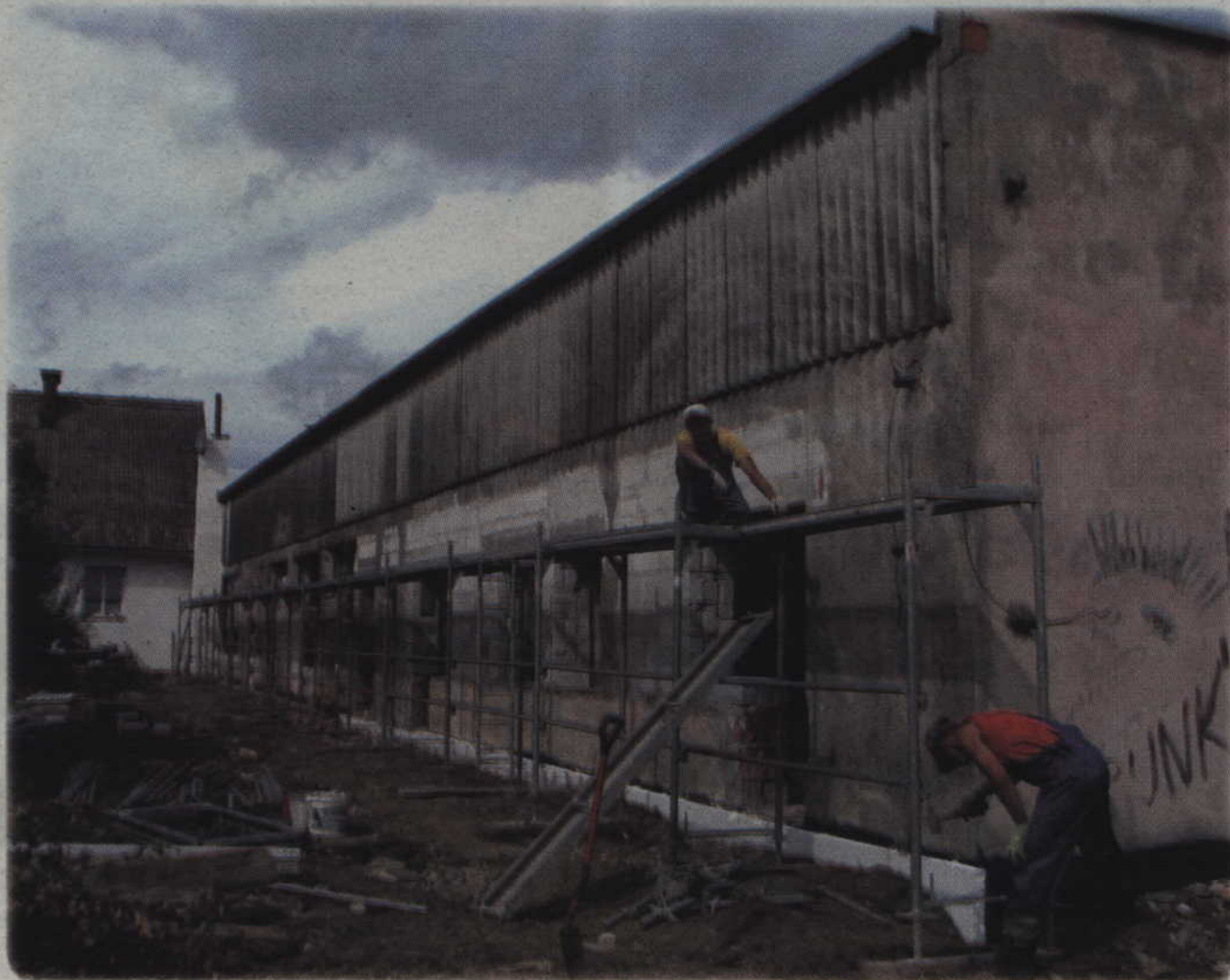
Trwa adaptacja budynku w Marezie Osiedlu na potrzeby mieszkaniowe. W obiekcie powstanie sześć mieszkań.