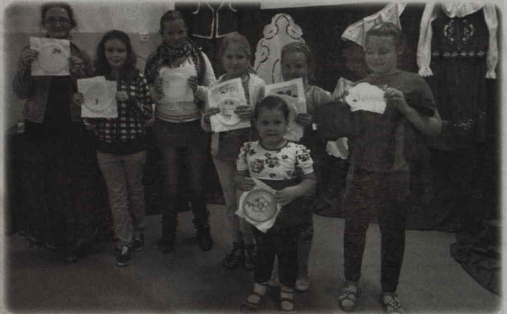
Uczestnicy warsztatów organizowanych w Pracowni Haftu Artystycznego.

„Ginące rzemiosło Dolnego Powiśla - warsztaty hafciarskie” to nazwa przedsięwzięcia realizowanego przez Gminny Ośrodek Kultury w Kwidzynie, w ramach unijnego Programu Rozwoju Obszarów Wiejskich. Projekt realizowany jest w formie warsztatów, podczas których można nauczyć się ginącego rzemiosła, jakim jest haft artystyczny.