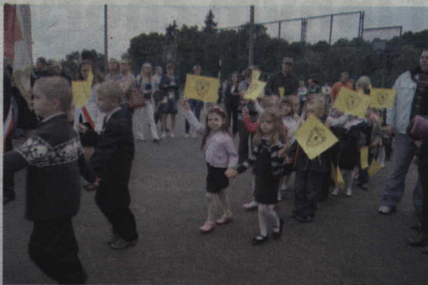
Najmłodsi, czyli sześciolatki z klasy I a w Szkole Podstawowej nr 4 rozpoczęły swoją przygodę z edukacją.