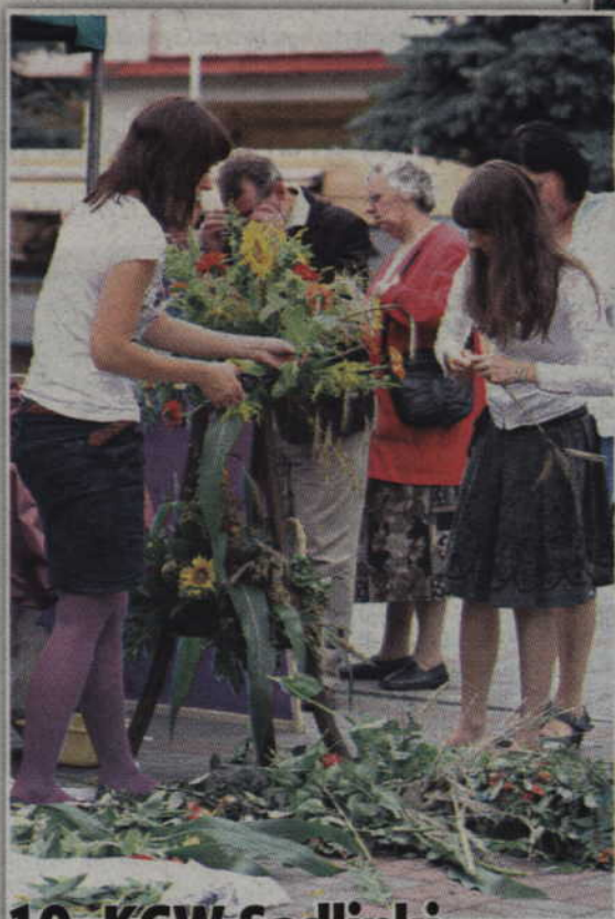
10. KGW Sadlinki