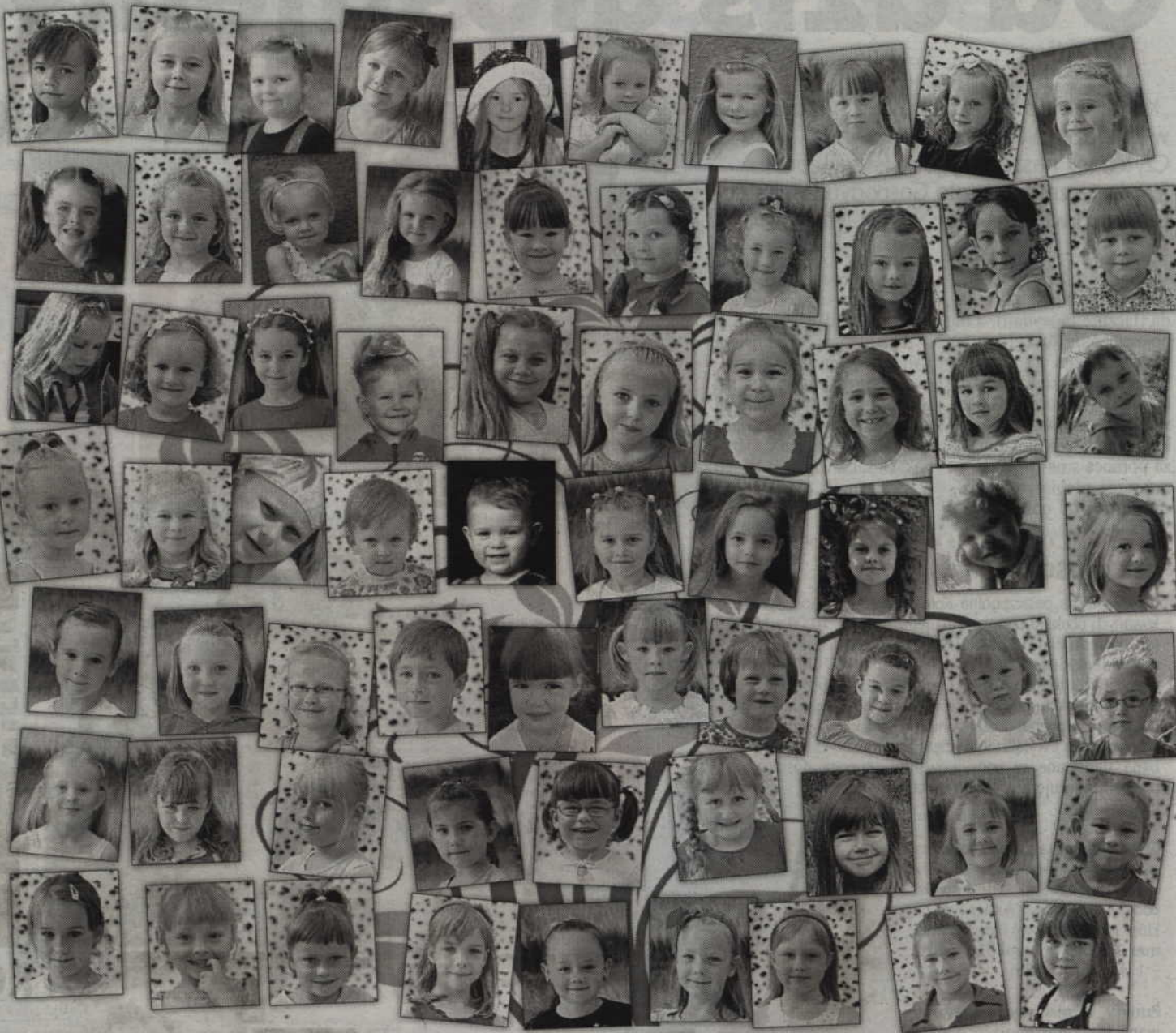
Już w czwartek poznamy nazwisko Małej Miss Lata „Kuriera Kwidzyńskiego. Naszym Czytelnikom przedstawimy ją za tydzień.