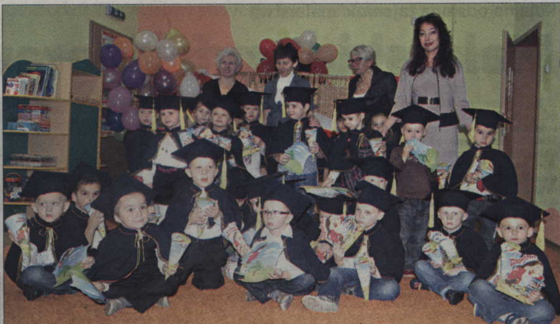
Rodzinne zdjęcie dzieci z grupy rodzinkowej z Przedszkola z Oddziałami Integracyjnymi w Kwidzynie. Dzieciom towarzyszą wychowawczynie oraz dyrektor placówki.

*autorka wywiadu jest uczennicą I Liceum Ogólnokształcącego, klasy o profilu dziennikarskim