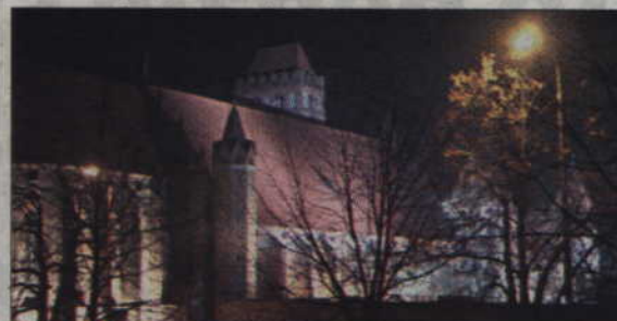
Kwidzyńska katedra ma szansę otrzymać pieniądze na remont z norweskiego mechanizmu finansowego.

80 tys. zł z budżetu miasta trafi do parafii pod wezwaniem św. Jana Ewangelisty. Pieniądze zostaną przeznaczone na prace konserwatorskie. Radni podjęli już decyzję w tej sprawie.