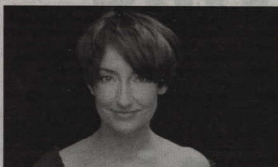
18 listopada w Kwidzynie zaśpiewa Katarzyna Groniec.

Niecałe dwa tygodnie po premierze swojej najnowszej płyty Katarzyna Groniec odwiedzi Kwidzyn. Koncert tej niezwykle utalentowanej piosenkarki i aktorki odbędzie się 18 listopada o godz. 19 w miejskim teatrze.