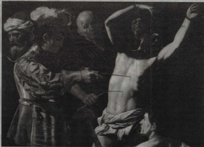
Podczas najbliższego spotkania z cyklu „Malarskie szyfry” omówione zostanie dzieło Cecco del Caravaggio „Męczeństwo św. Sebastiana”.