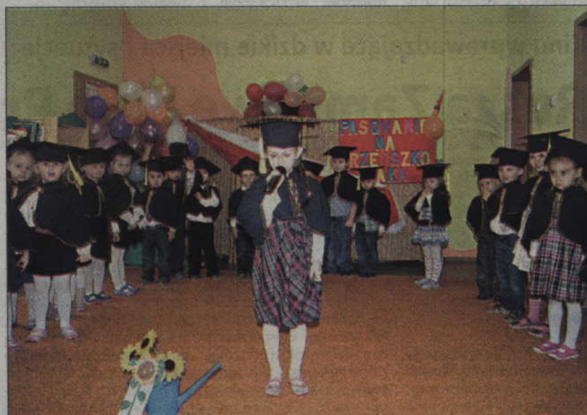
Występ małych artystów został nagrodzony gromkimi brawami.