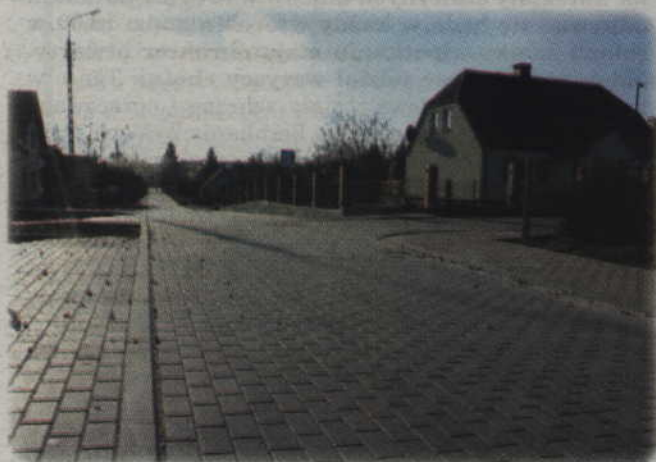
Zakończono modernizację ulic Kolistej, Łamanej, Wielkiej, Stawki, Studziennej i Poligonowej.

Mieszkańcy ulic Kolistej, Łamanej, Wielkiej, Stawki, Studziennej oraz Poligonowej mogą już się cieszyć: zakończyły się prace modernizacyjne, rozpoczęte w ubiegłym roku.