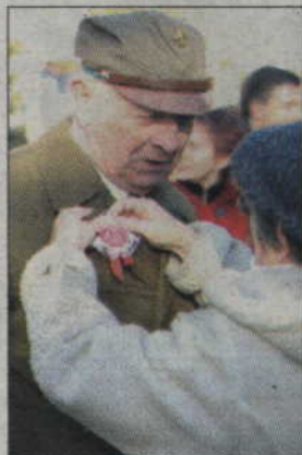
Większość uczestników udekorowana była kokardami w barwach narodowych.