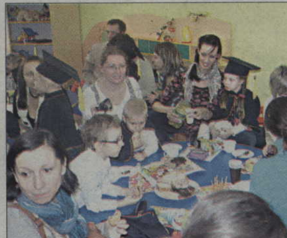
Na dzieci i dumnych ze swoich pociech rodziców czekał pyszny poczęstunek.

Więcej zdjęć na www.portalpomorza.pl portalpomorza.pl