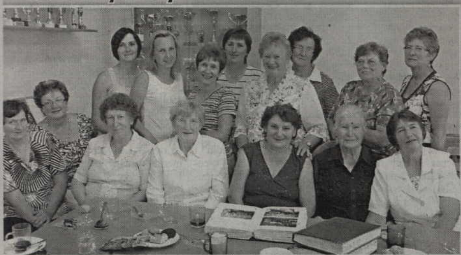
11. KGW Tychnowy