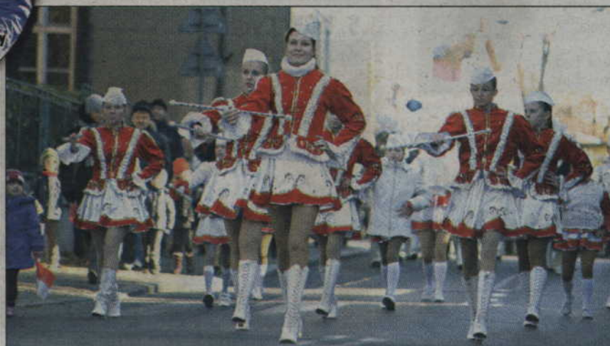
Uroczysty orszak prowadziły mażoretki kwidzyńskiej Orkiestry Dętej „Helikon”.