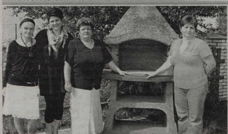
1. KGW Olszanica