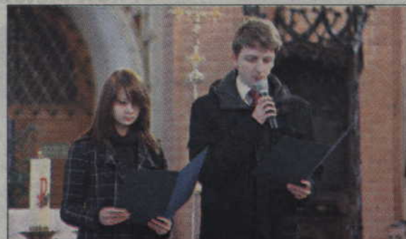
W kościele wysłuchano referatu okolicznościowego.