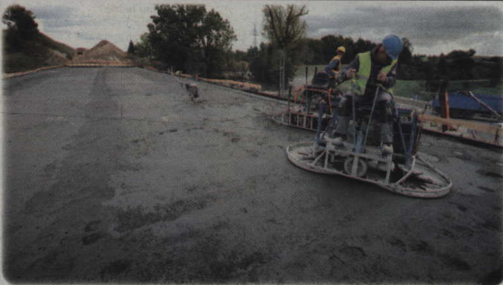
Prace nie obejmują tylko mostu, ale i drogi dojazdowe. Przykładem wiadukt w okolicy ul. Furmańskiej.