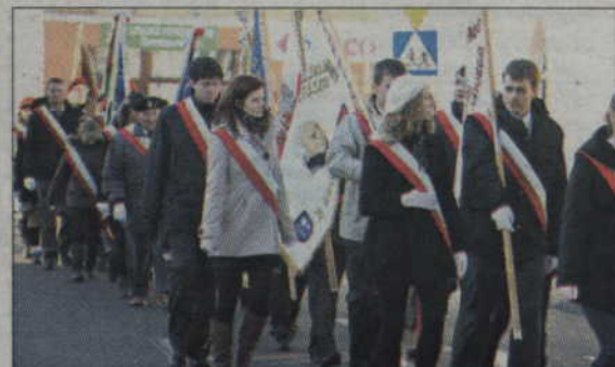
Wśród wielu pocztów sztandarowych nie zabrakło również przedstawicieli kwidzyńskich szkół.