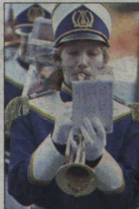
Trębacz z Orkiestry Dętej „Helikon”.