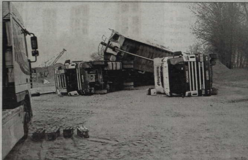
Wypadek samochodu ciężarowego na nadbrzeżu w Korzeniewie.