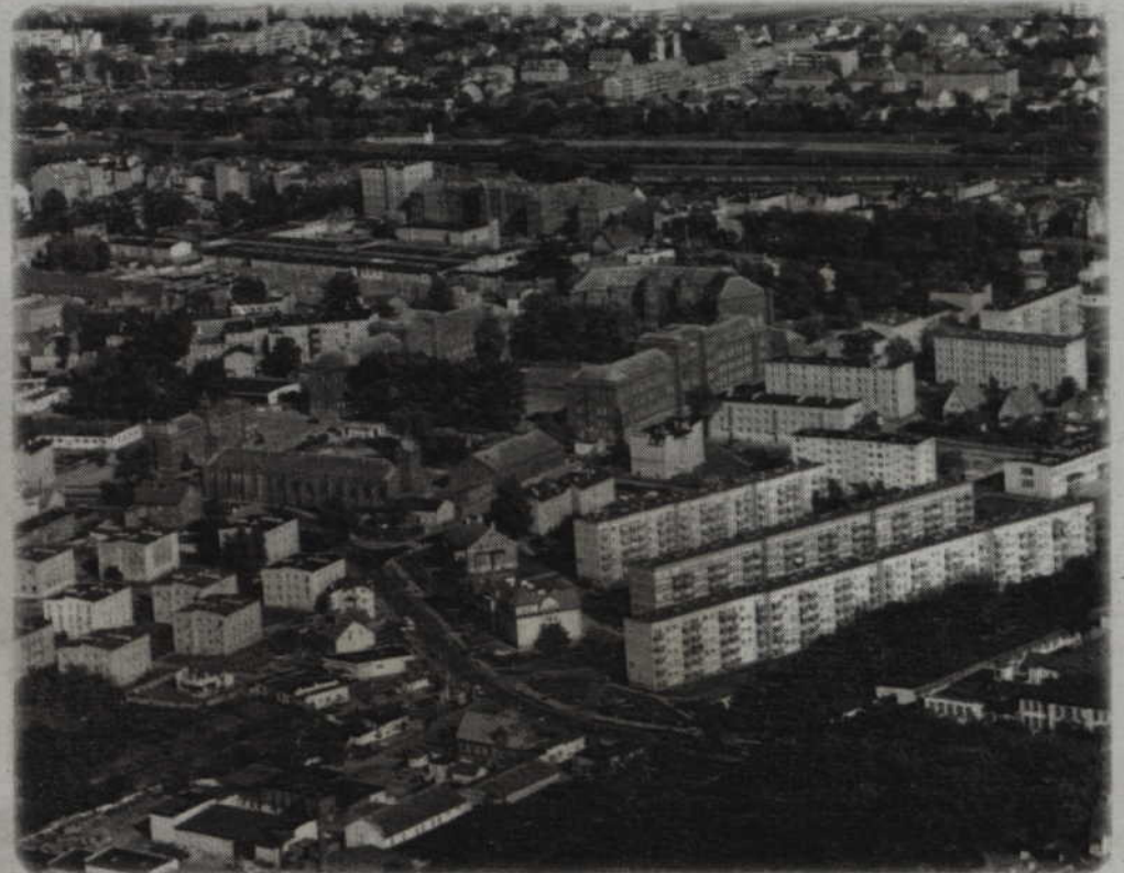
6,4 mln zł będzie musiało w przyszłym roku zapłacić miasto tzw. janosikowe. Podatek płacą najbardziej zamożne gminy, których dochód na jednego mieszkańca przekracza poziom ustalony przez Ministerstwo Finansów.

6,4 mln zł będzie musiało w przyszłym roku zapłacić miasto tzw. janosikowe. Podatek płacą najbardziej zamożne gminy, których dochód na jednego mieszkańca przekracza poziom ustalony przez Ministerstwo Finansów. Pieniądze z janosikowego przeznaczane są dla gmin o niskich dochodach. To drugi raz, kiedy miasto podzieli się z innymi samorządami swoimi dochodami. Andrzej Krzysztofiak, burmistrz Kwidzyna, twierdzi, że od zapłacenia podatku nie ma odwołania. Uspokaja jednak, że mimo ograniczeń poziom inwestowania zostanie tylko lekko „schłodzony”.