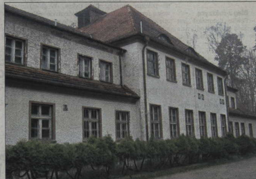
Do 15 grudnia urządzeniami wodnymi przy ul. Sanatoryjnej zarządzać będzie Elektrociepłownia Opole. Co potem, jeszcze nie wiadomo.

Gmina Prabuty już od początku roku starała się rozwiązać problem właścicielski wodociągu. Dlatego odbyły się do tej pory już trzy spotkania, a burmi-