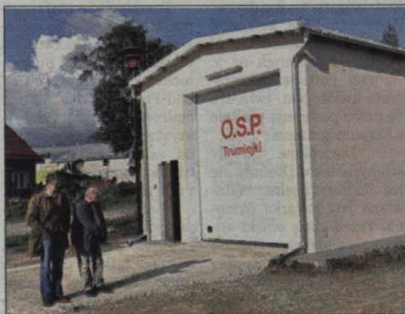
Remont remizy w Trumiejkach kosztował 157 tys. zł.

Strażacy z Trumiejek mają powody do zadowolenia