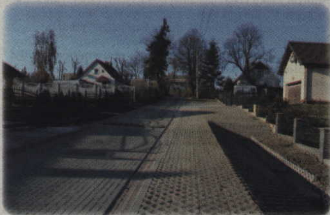
Inwestycja kosztowała ok. 3 mln zł.