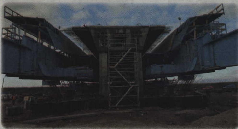
Gotowy segment mostu po rozsunięciu formy

Budowane są już segmenty mostu, który połączy dwa brzegi Wisły. Most będzie miał ponad 800 m długości. Konstrukcja typu extradosed (z ang. Extradosed prestressed bridge) będzie największą tego typu w Europie i jedną z największych na świecie. Rozpiętość przęseł to 204 m. Prace prowadzone są także po drugiej stronie rzeki.