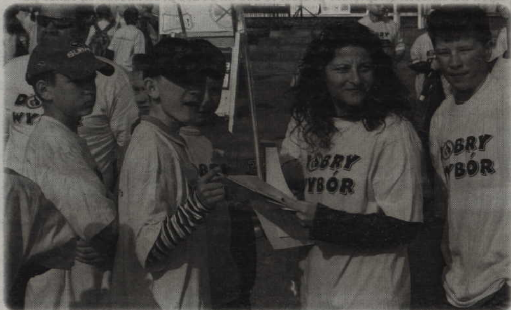
Ruszyła szósta edycja programu profilaktycznego „Dobry Wybór”.

Ruszyła szósta edycja programu profilaktycznego „Dobry Wybór”. Profilaktyczny program dotyczy uzależnień i jest adresowany do uczniów klas szóstych szkół podstawowych. Jego celem jest propagowanie zdrowego trybu życia i dokonywania prawidłowych wyborów.