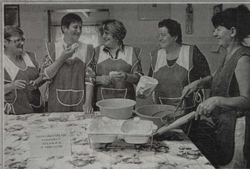
3. KGW Trzciano