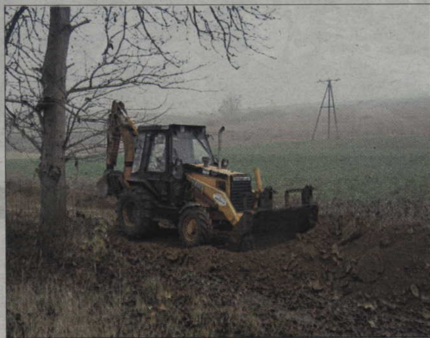
Prace przy budowie wodociągu Prabuty-Kołodziej idą pełną parą.

W sumie wybudowanych zostanie ponad 3 kilometry wodociągu. Inwestycję realizuje Przedsiębiorstwo HYDRO - SERWIS z Sierakowic, które wygrało przetarg. Firma podjęła się budowy wodociągu za 775 tys. zł. Była to najniższa