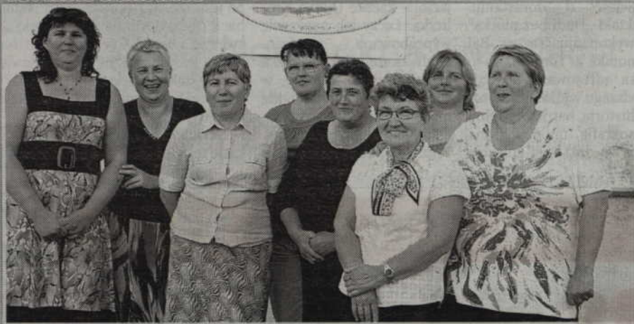
13. KGW Rakowiec