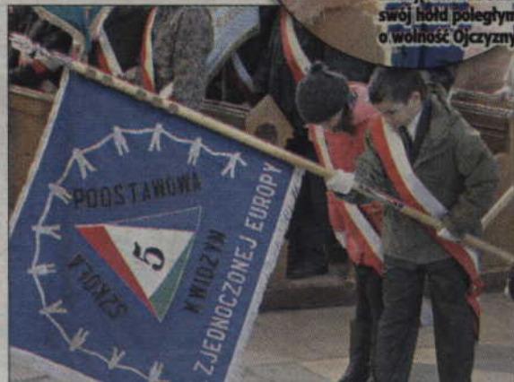
Poczet sztandarowy Szkoły Podstawowej nr 5 w Kwidzynie.