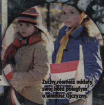
Zuchy, również oddały swój hołd poległym o wolność Ojczyzny.