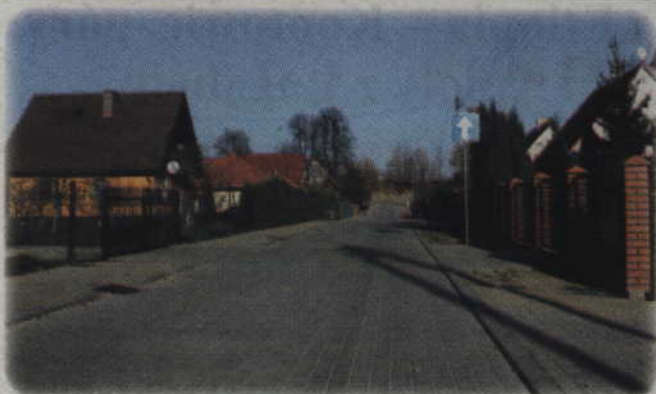
Wcześniej wybudowano kanalizację sanitarną, deszczową oraz wodociąg.