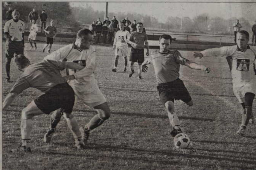
Starcie Wisły Korzeniewo i Pogoni Prabuty zakończyło się podziałem punktów.