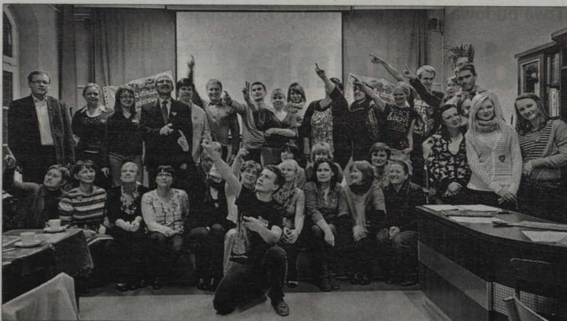
Final dopiero w styczniu, ale sztab kwidzyńskiej Wielkiej Orkiestry Świątecznej Pomocy już pracuje.