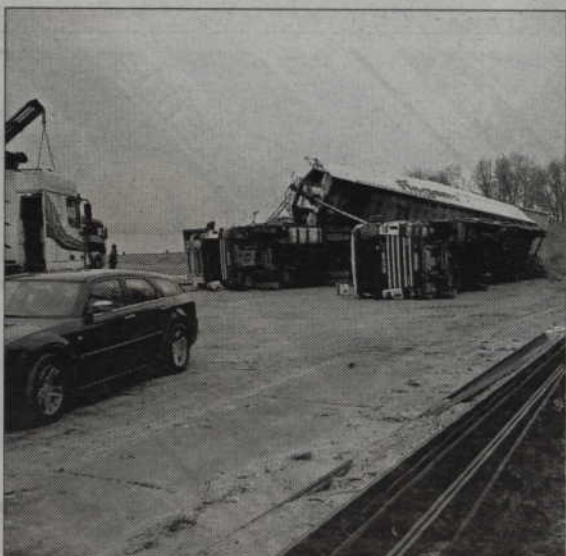
Prawie 5 godzin usuwali skutki tego wypadku.