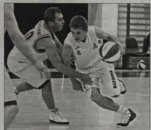
Zwyciężając SportowePomorze.pl kwidzynianie odnieśli czwarte zwycięstwo w 6 rozegranych spotkaniach ligowych.