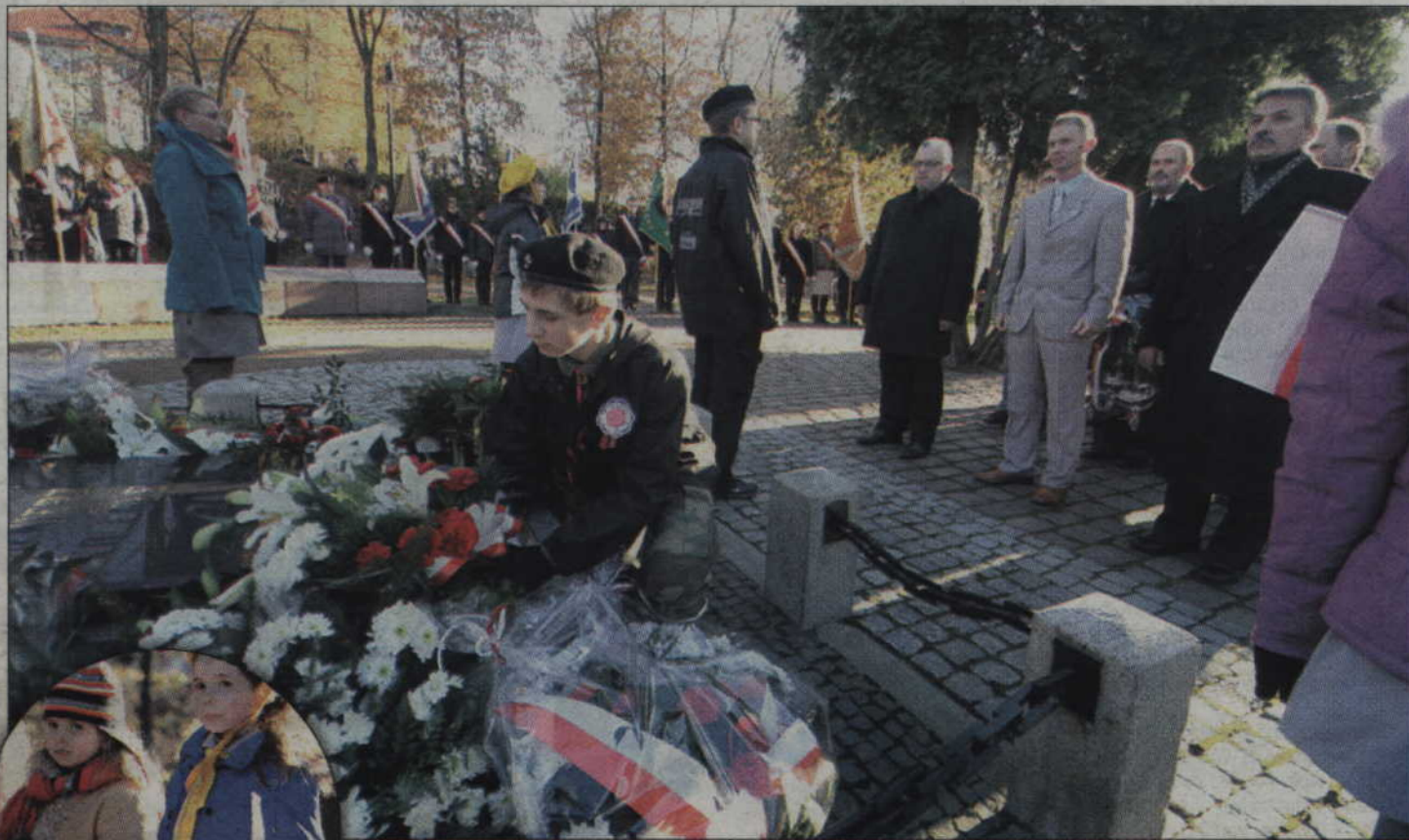
Delegacje złożyły kwiaty na Grobie Nieznanego Żołnierza.