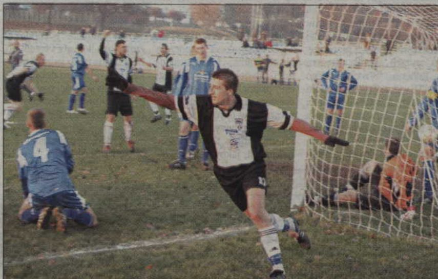
Radość piłkarzy Zawiszy po zdobyciu zwycięskiego gola.