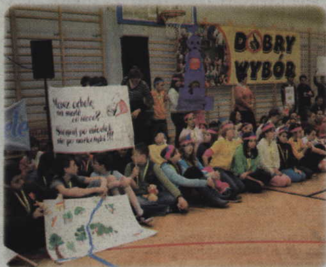
Rozpoczęła się szósta edycja programu profilaktycznego „Dobry Wybór”.

Uruchomienie fontanny zakończyło budowę dojazdu do Szkoły Podstawowej nr 4. Dzięki inwestycji rodzice mogą bezpiecznie dowozić swoje dzieci. Poza tym udało się stworzyć kolejne miejsce, w którym przy ładnej pogodzie będzie można posiedzieć na ławeczce i odpocząć. Koszt prac to ok. 800 tys. zł.