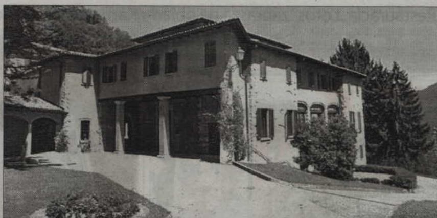
Główny dom Instytutu Chrystusa Króla.

Instytut nie posiada i nie prowadzi własnych dzieł. Służba apostolska każdego