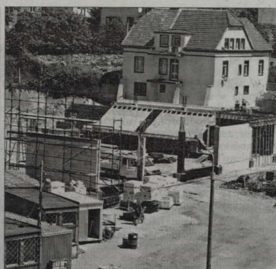
Prace przy budowie hali dla Zespołu Szkół Ponadgimnazjalnych nr 2 idą zgodnie z harmonogramem.