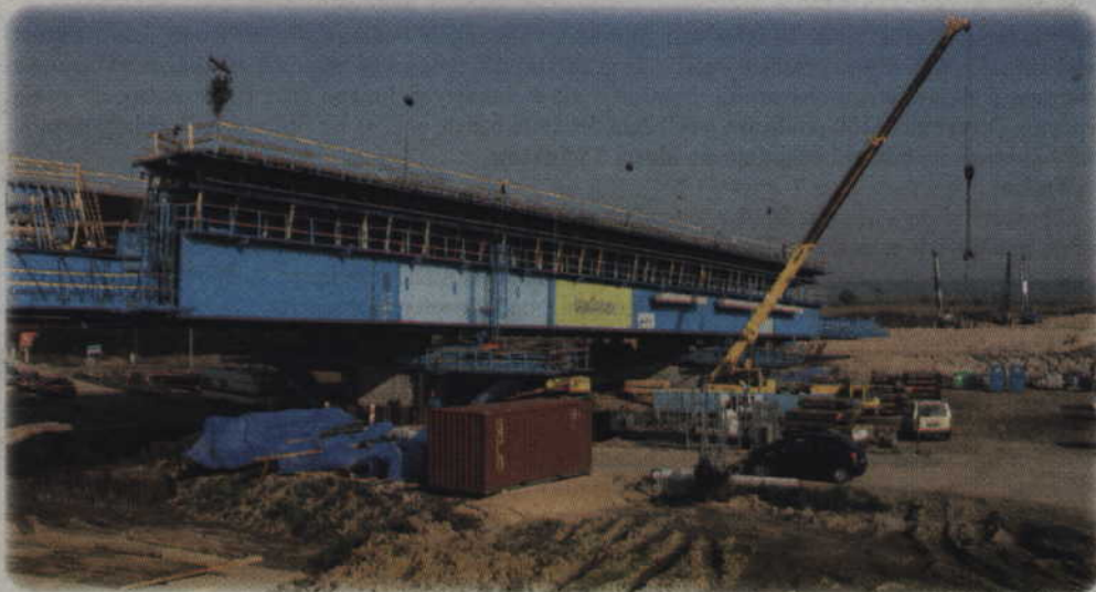
Gotowy segment mostu