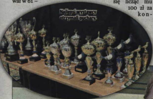
Najlepsi wystawcy otrzymali puchary.

Organizatorzy pragną przy okazji podziękować dyrekcji Szkoły Podstawowej nr 4, która udostępniła hodowcom salę gimnastyczną. (m)