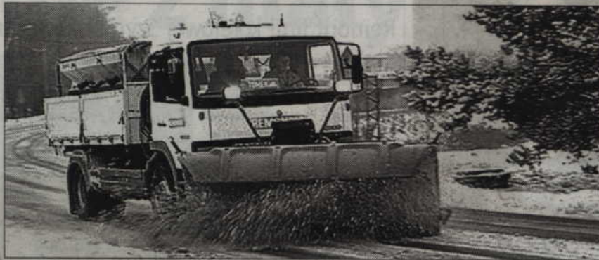
Samorząd liczy, że w tym roku zima będzie łagodna. W ubiegłym odśnieżanie dróg w naszym powiecie kosztowało ponad 1 mln zł.

- Pełna gotowość obowiązuje od połowy listopada. Oznacza to, że firmy, które wygrały przetargi muszą mieć przygotowany sprzęt, ludzi i materiały, aby w każdej chwili mogły rozpocząć działania na drogach. Odbyliśmy już pierwsze spotkania z wykonawcami podczas którego omówiliśmy zasady zimowego utrzymania dróg. Pojawiły się nowe, mam nadzieję, że dadzą sobie radę. Wprowadziliśmy więcej możliwości działań, które zależą od sytuacji na drogach. Istnieje możliwość posypywania piaskiem tylko łuków dróg, wzniesień, przystanków i skrzyżowań. Czasami jest taka sytuacja, że nie ma sensu posypy-