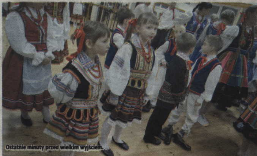
Ostatnie minuty przed wielkim wyjściem.