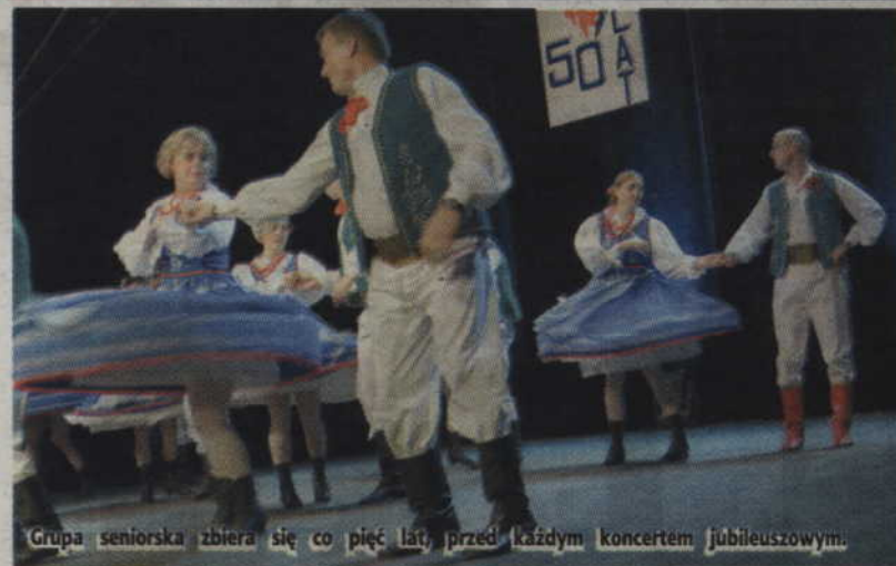
Grupa seniorska zbiera się co pięć lat, przed każdym koncertem jubileuszowym.