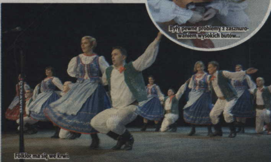
Folklor ma się we krwi.