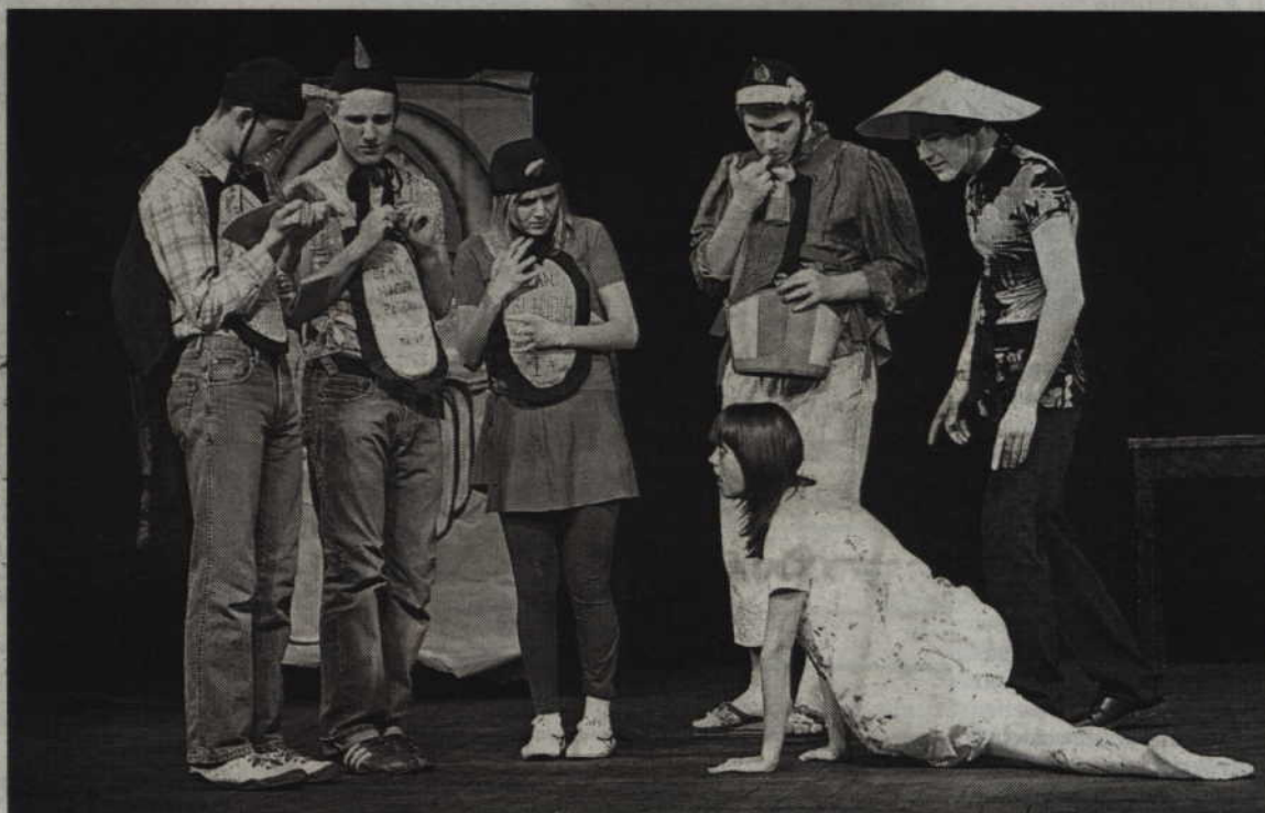
Podczas Kwidzyńskich Spotkań Teatralnych na scenie prezentują się grupy teatralne z przedszkoli, szkół podstawowych, gimnazjalnych i ponadgimnazjalnych, a także grupy dorosłe.

Wiele wskazuje jednak na to, że tegoroczne Teatralia będą ostatnimi