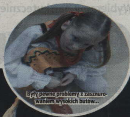
Były pewne problemy z zasznurowaniem wysokich butów...