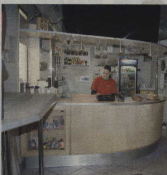
City Pizza zaprasza na obiad

Dla naszych Czytelników mamy niespodziankę – dwuosobowe zaproszenie do lokalu City Pizza, który mieści się przy ul. Grudziądzkiej 22 w Kwidzynie.