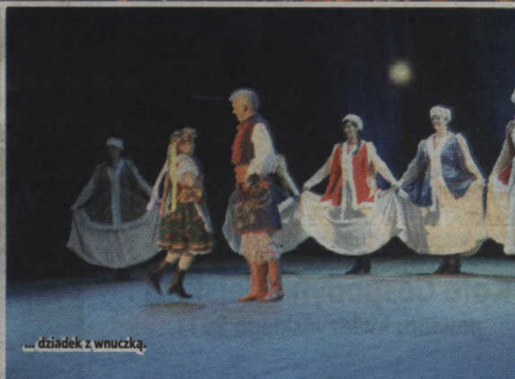
... dziadek z wnuczką.