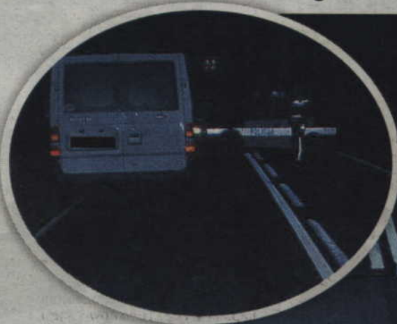
W Otłowcu kierowca forda transita potracił nastolatka. Chłopiec prawdopodobnie wtargnął na jezdnię.