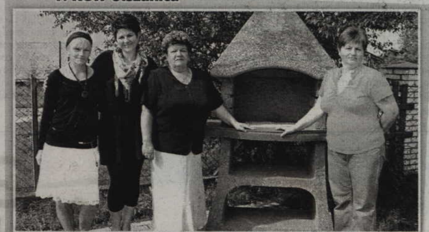
1. KGW Olszanica