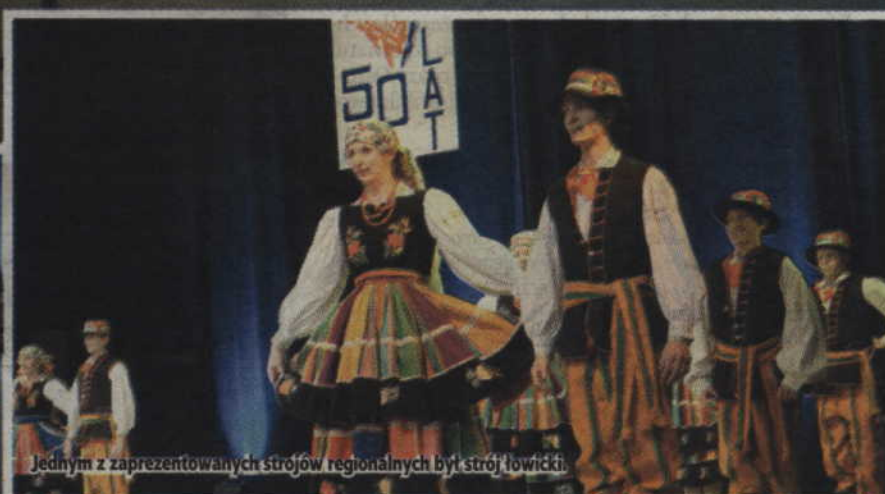
Jednym z zaprezentowanych strojów regionalnych był strój łowicki.