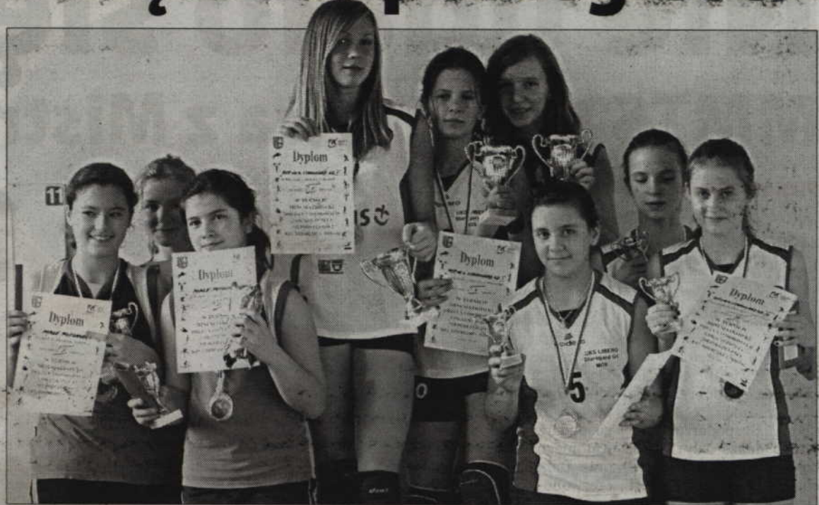
Finalistki rozgrywek w kategorii dziewcząt rocznika 1999 i młodsze. Na najwyższym podium drużyna PSP Starogard Gdański I, po lewej: Małe Potworki, a po prawej od triumfatorek drużyna PSP Starogard Gdański III.

W kategorii kobiet open, w której rywalizowały panie od 15 lat wwyż, rywalizowało 5 drużyn. Wszystkie zespoły rywalizowały więc systemem każdy z każdym. Cukiereczki przegrały z ZSP 2 12:25, Słoneczka pokonały Malagę 25:23, ZSP 2 przegrał ze Słoneczkami 15:25,