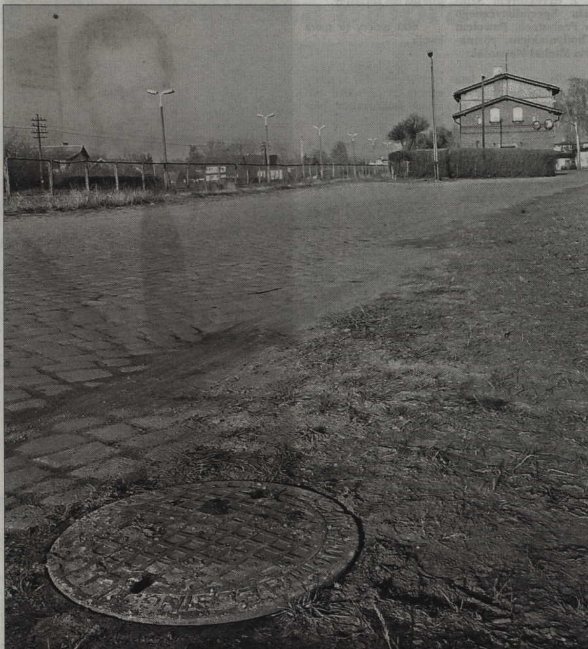
Udało się odmulić praktycznie całą ulicę Kolejową.

- Odmulenie tego przepustu spowoduje, że woda będzie mogła w swobodnie przepływać w tym miejscu - mówi zastępca wójta gminy Ryjewa. - Wówczas pozostanie nam do wykonania jeszcze jedna rzecz czyli rów przy drodze wojewódzkiej w kierunku Jałowca. W tym roku były tam prowadzone różne zabiegi pielęgnacyjne. Czyściliśmy, kosiliśmy. Mieszkańcy również czyścili ten rów. Ma on jednak swojego właściciela i powinien po-