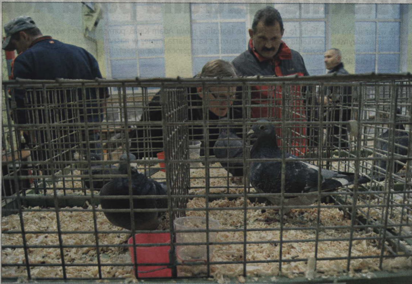
Na wystawie można było zobaczyć 250 gołębi różnych ras.

- Za wygląd sędzia dał mojemu gołębini pierwszą nagrodę, dostał też nagrodę za największą liczbę konkursów, bo w sumie startował w 61 -