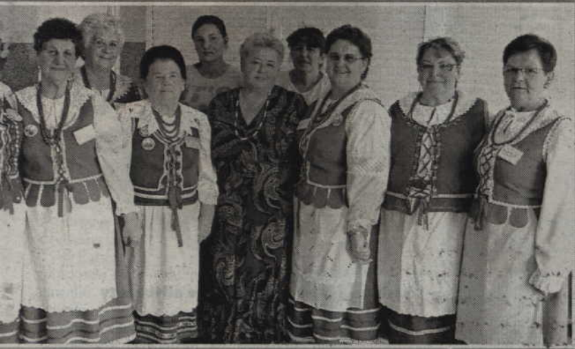
4. KGW Mareza