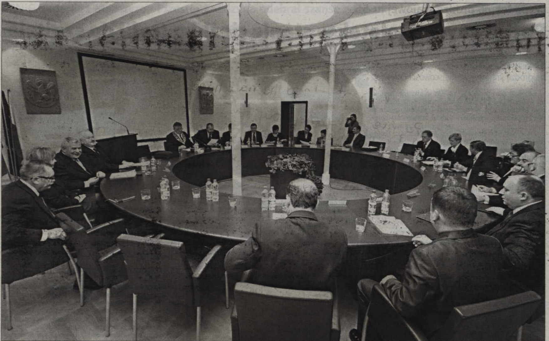
Powiat kwidzyński zdecydował, że będzie spłacał kredyt zaciągnięty przez spółkę „Zdrowie”. Pieniądze mają być przeznaczone na inwestycje w szpitalu w Kwidzynie.