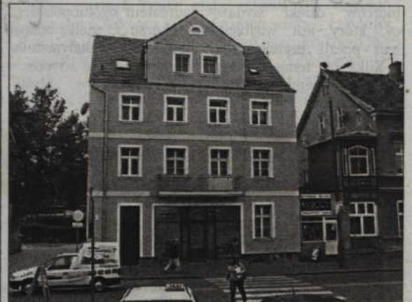
Miasto nie zamierza rezygnować z dofinansowania remontów kamienic. Na przyszłoroczną listę zakwalifikowało się 80 budynków.