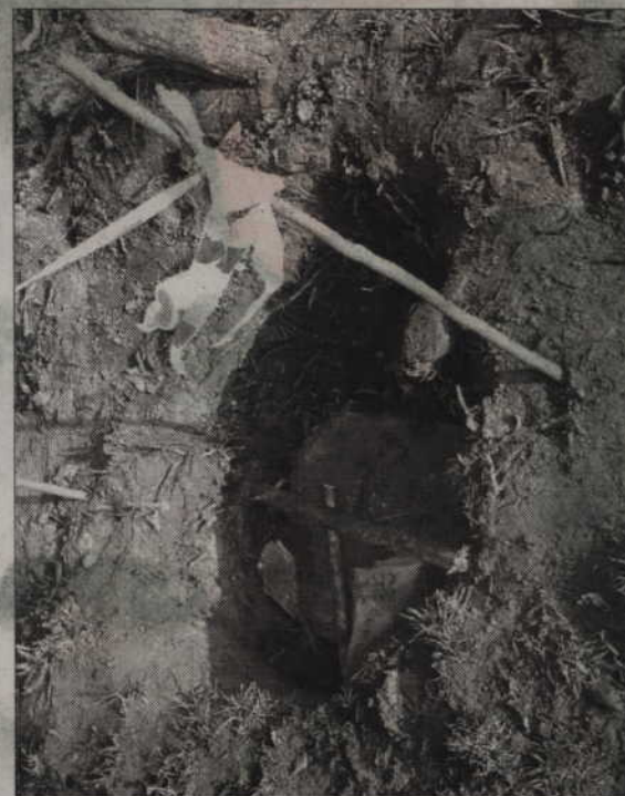
Wiele ze starych studzienek było zasypanych lub zamurowanych.