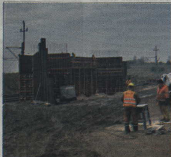
W Gontach powstaje wiadukt nad torami kolejowymi.

Koszt modernizacji odcinka Szymankowo-Prabuty wyniesie prawie 870 mln