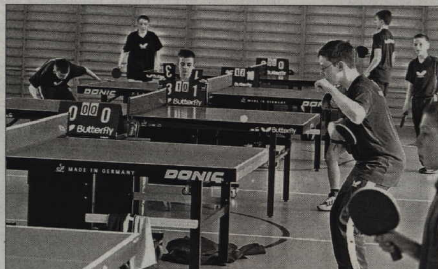
W I turnieju Grand Prix powiatu kwidzyńskiego wzięło udział 60 uczestników z 7 szkół.

- Dla chętnych do udziału w kolejnych odsłonach rywalizacji ważna jest in-