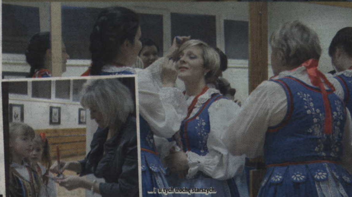
...i u tych trochę starszych.