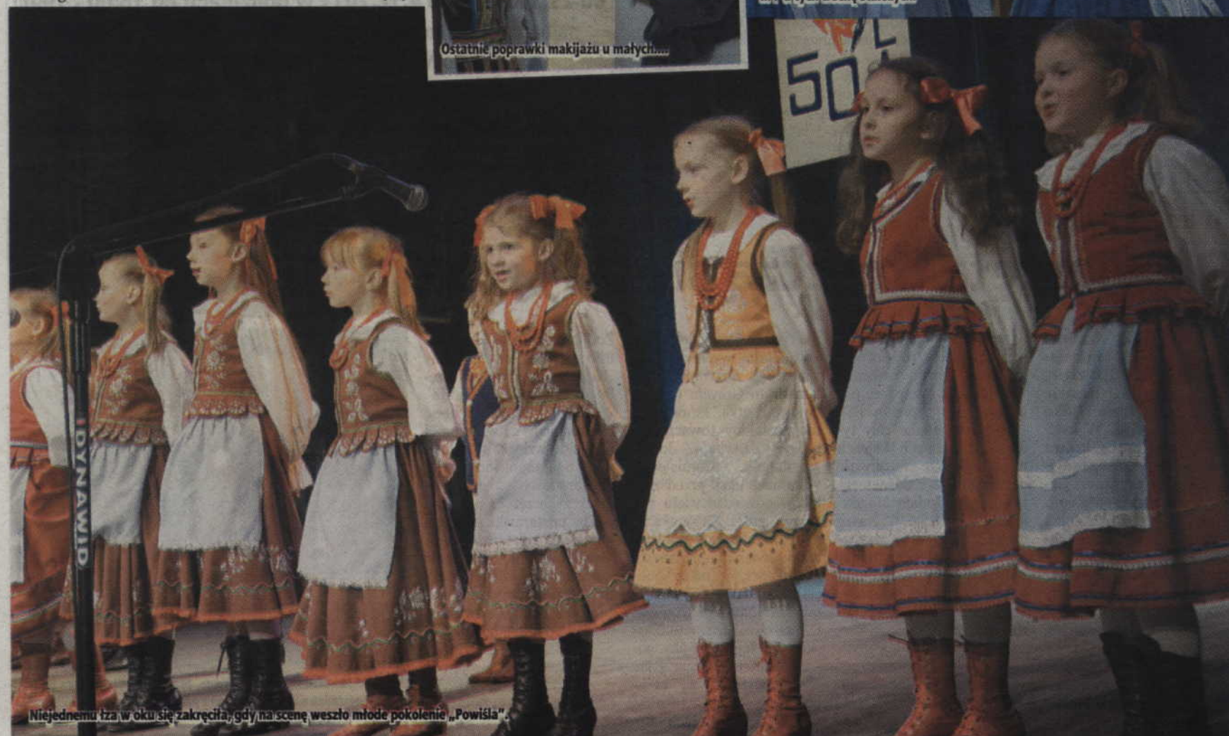
Niejednemu łza w oku się zakręciła, gdy na scenę weszło młode pokolenie „Powiśla”.