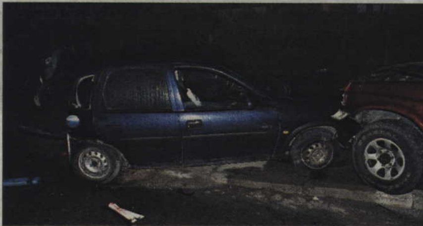
W wypadku w Rakowcu ranna została jedna osoba.

Funkcjonariusze wstępnie ustalili, że 53-letni mieszkaniec Prabut kierujący oplem corsa prawdopodobnie nie udzielił pierwszeństwa przejazdu i zderzył się z oplem fronterą i vw sharanem - relacjonuje Bożena Schab, rzeczniczka policji w Kwidzynie.