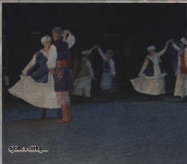
ojciec z córką....