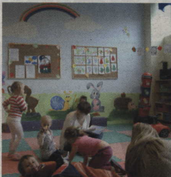
Dla dzieci - zabawa w Gamie

Centrum Twórczej Zabawy GAMA to nie tylko całoroczna sala zabaw z imprezami dla dzieci ale przede wszystkim miejsce, gdzie rodzice mogą znaleźć wiele interesujących zajęć dla swoich. Dodatkowo animatorzy w Gamie zapewniają wykwalifikowaną opiekę dla dzieci w systemie godzinowym. Od września w Gamie funkcjonuje także punkt przedszkolny dla dzieci w wieku od 2,5 do 4 lat.