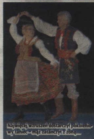
Najwięcej wzruszeń dostarczył pokoleniowy taniec - mąż zatancał z żoną....