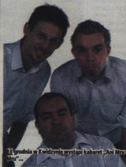
11 grudnia w Kwidzynie wystąpi kabaret „Ani Mru Mru”...