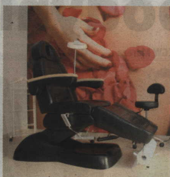
Laserowa depilacja w salonie all4beauty

W tym tygodniu jedną z nagród dla naszych Czytelników sponsoruje Studio Nowoczesnych Technologii Kosmetycznych „all4beauty”, które mieści się w Kwidzynie przy ul. Szerokiej 17/51. W ofercie studia m.in. depilacja laserowa laserem diodowym LightSheer, depilacja cukrowa preparatami firmy Alexandria Professional, zabiegi falami radiowymi RF Apollo TriPollar oraz zabiegi pielęgnacyjne kosmetykami francuskiej firmy THALGO, używanymi w najlepszych ośrodkach SPA.