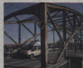
Remontu doczeka się zniszczony wiadukt na ul. Mostowej. Miasto przeznaczyło na ten cel 900 tys. zł.

Remontu doczeka się także zniszczony wiadukt na ul. Mostowej. Na jego modernizację miasto zamierza wydać 900 tysięcy złotych.