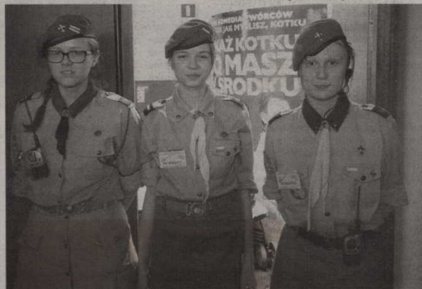
Sympatyczna ochrona tegorocznego festiwalu poprosiła nas o zrobienie pamiątkowego zdjęcia.