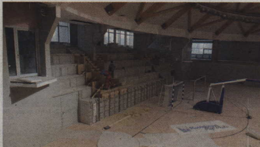
Podstopnie znajdujące się na trybunach budowanej hali sportowej zostały wylane na nowo.

Mowa o barierkach znajdujących się na samej hali, odgradzających zarówno poszczególne trybuny od trybun składanych, jak i tych umiejscowionych na trybunach stałych. Pierwotnie barierki miały mieć wysokość 1,10 m, jednak władze miasta uparły się,