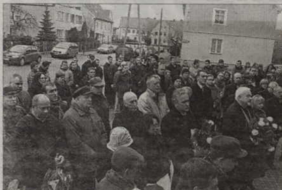
Narodowy Dzień Pamięci „Żołnierzy Wyklętych” uhonorowano apelem przed I LO w Kwidzynie.