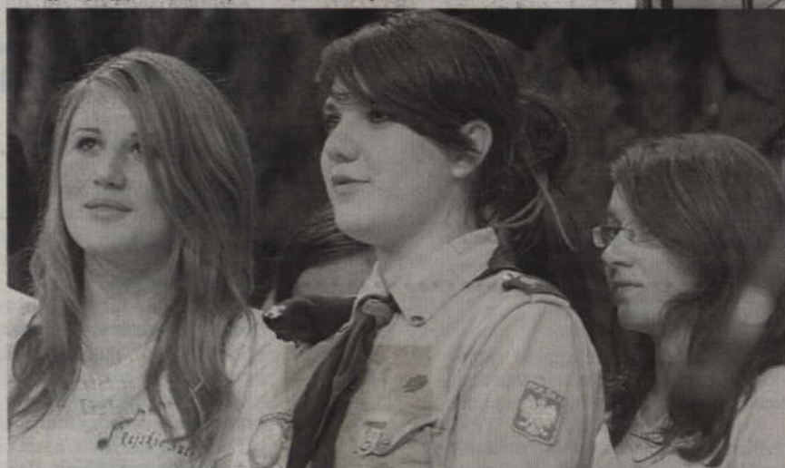
Zespół „Rajskie Nutki” ze Świecia zajął II miejsce wśród zespołów w kategorii piosenki turystycznej i poezji śpiewanej.