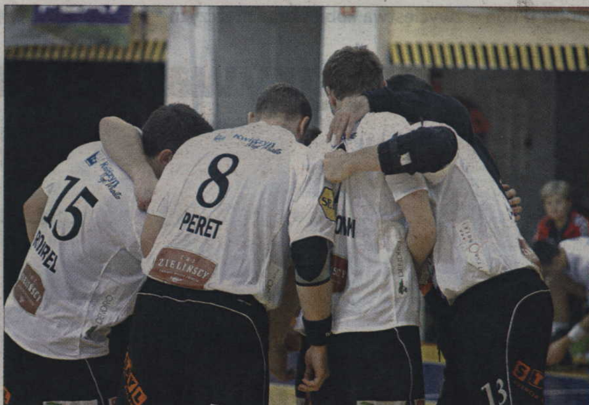
Po zwycięstwie nad Warmią kwidzyńskich piłkarzy czekają ostatnie spotkania sezonu zasadniczego z Jurandem Ciechanów i Orlenem Wisłą Płock.

PGNiG Superliga Mężczyzn – Kwidzynianie punktuja na trudnym terenie