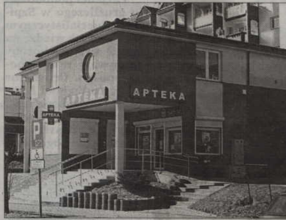
Kwidzińskie apteki znów będą pełniły dyżury.