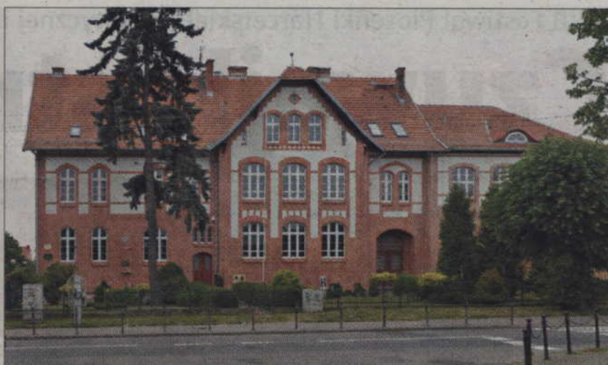
Do tej pory mury kwidzińskiej „dwójki” opuściło 4631 absolwentów.