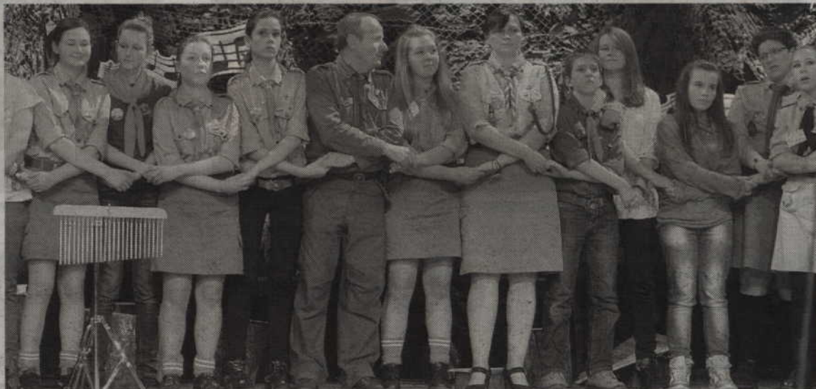
Braterski krąg zakończył 28 „Szałamaję” w Kwidzynie.

- W regulaminie jest wyraźnie napisane: piosenka harcerska, piosenka