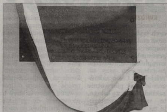
Delegacja złożyła kwiaty pod tablicą upamiętniającą Organizację Młodzieży Demokratyczno-Katolickiej.

KWIDZYN. Otwarcie wystawy Instytutu Pamięci Narodowej „Za świętą sprawę - żołnierze Łupaszki” uświetniło kwidzyńskie obchody Narodowego Dnia Pamięci „Żołnierzy Wyklętych”.