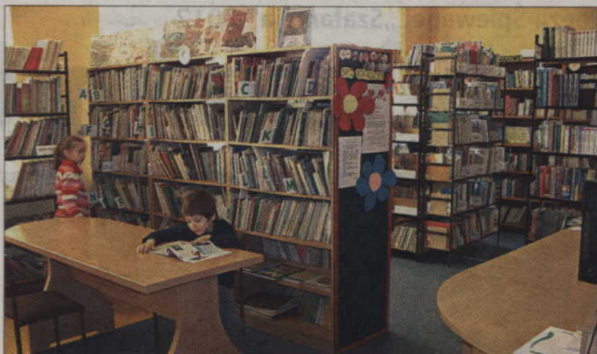
Szkoła Podstawowa nr 2 posiada całkowicie skomputeryzowaną bibliotekę szkolną.