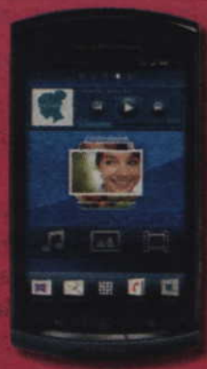
Sony Ericsson Xperia™ neo V