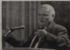
Lech Wałęsa utrzymuje, że skoczył przez płot do Stoczni Gdańskiej w sierpniu 1980 r.

POMORZE. Wraca kontrowersyjna sprawa słynnego skoku Lecha Wałęsy przez płot Stoczni Gdańskiej w sierpniu 1980 r. Niektórzy, w tym Anna Walentynowicz twierdziła, że został on dowieziony motorówką Marynarki Wojennej. ABW dysponuje nagraniem funkcjonariusza WSI, który relacjonuje kulisy dowiezienia Lecha Wałęsy motorówką na strajk w Stoczni Gdańskiej - piśm. „Nasz Dziennik”.