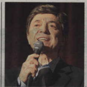
Jerzy Połomski zaśpiewa w Kwidzynie 8 marca.