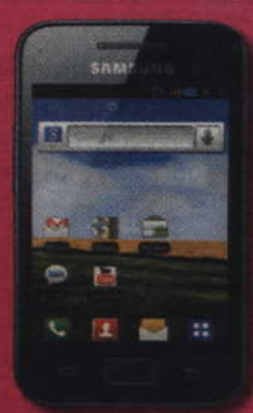
Samsung GALAXY Ace

Najtańsze smartfony przeszły do T-Mobile. Przejdź i Ty!