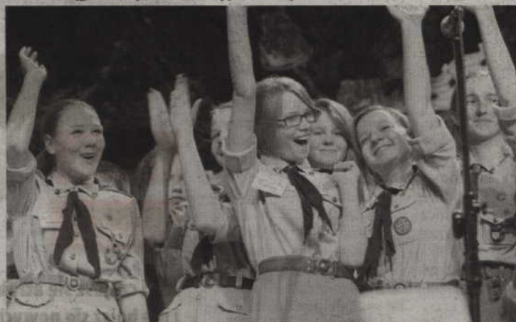
Prabucianki cieszą się ze zdobycia III miejsca wśród zespołów rywalizujących w piosence harcerskiej.