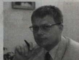
Czy symboliczne odszkodowania jakie sądy przyznawały byłym represjonowanym po 1990 r. nie były uwłaczające na tle odszkodowania jakie otrzymał Janusz Kaczmarski?

sjonowanym po 1990 r. nie były uwłaczające na tle odszkodowań jakie otrzymali Janusz Kaczmarski i Konrad Kornatowski. Podkreślić należy, że wielu więźniów takich odszkodowań nie otrzymało. Państwo nie wiele robi, aby to naprawić, a okres komunistycznych represji zakończyć na 1989 r. Sejm poprzedniej kadencji uznał, że najwyższe odszkodowanie za śmierć zamordowanego przez komunistycznych oprawców wynosi 50 tys. zł. Czy nie jest to zwycięstwo komunistycznego systemu. Utwierdza nas w przekonaniu wyrok sądu skazującego gen. Czesława Kiszcza na 2,5 roku więzienia w zawieszaniu na 5 lat. Wyplaty tak wysokich odszkodowań dla byłych członków PZPR (i prokuratora Mar. Woj. w stanie wojennym Kornatowskiego) za zatrzymanie na niecałe czterdzieści godzin, jest dowodem, że sądy są nadal usłużne dla dawnych towarzyszy i nie liczą się z opinią społeczną. Byłym więźniom takie kwoty przyznawały sądy za kilkanaście miesięcy więzienia. Czy w tej sytuacji moż-