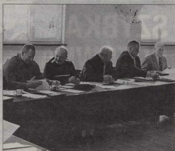
Radni gminy Ryjewo nie zgodzili się na budowę placu zabaw przy ryjewskim przedszkolu.