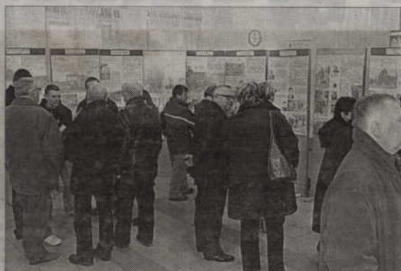
W świetlicy I LO oglądać można wystawę IPN „Za świętą sprawę - żołnierze Łupaszki”.