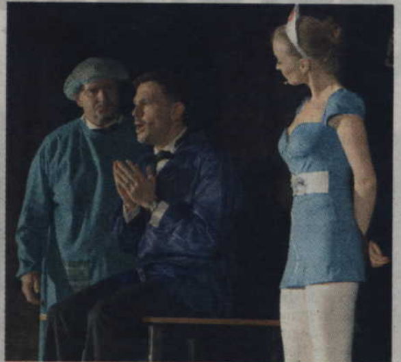
Propozycja na maj to spektakl pt. „Blondynki wolą mężczyzn” z udziałem m.in. Krzysztofa Ibisza.

Spektakl odbędzie się 16 maja o godz. 17 w Kwi-