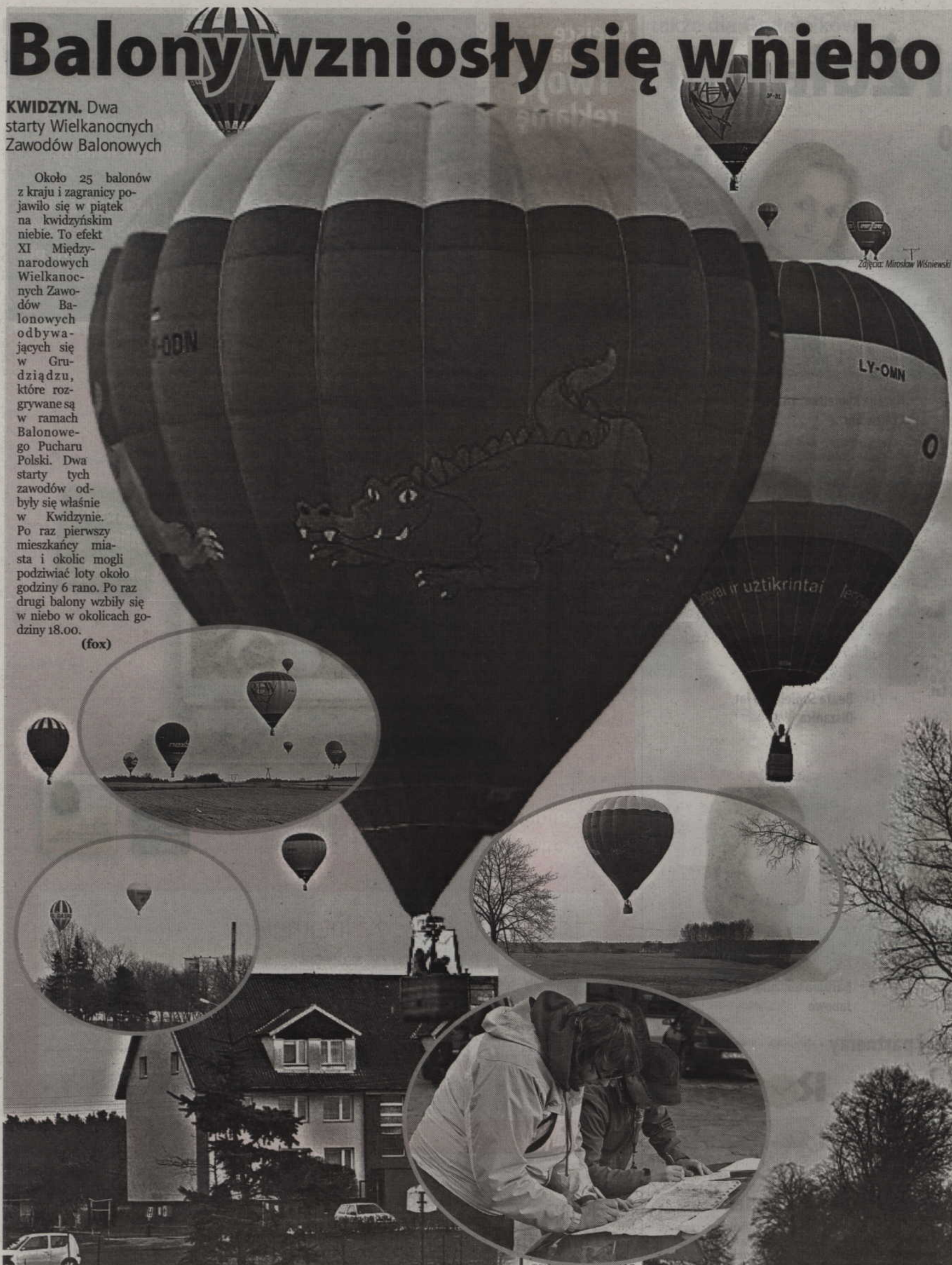
Kwidzyn i okolice były miejscem dwóch startów IX Międzynarodowych Wielkanocnych Zawodów Balonowych odbywających się w Grudziądzu.