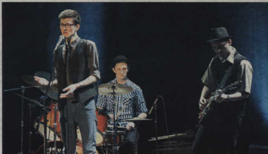
Gałę otworzył koncert kwidzyńskiego zespołu Phunk Off.