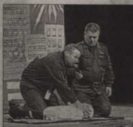
Pokaz ratownictwa medycznego.