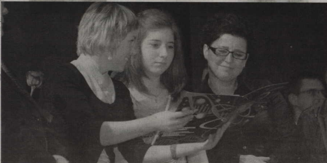
Wszyscy którzy brali udział w tegorocznym finale otrzymali specjalne podziękowania podpisane przez Jurka.

taka jest nasza rzeczywistość - dodaje Owskiak.