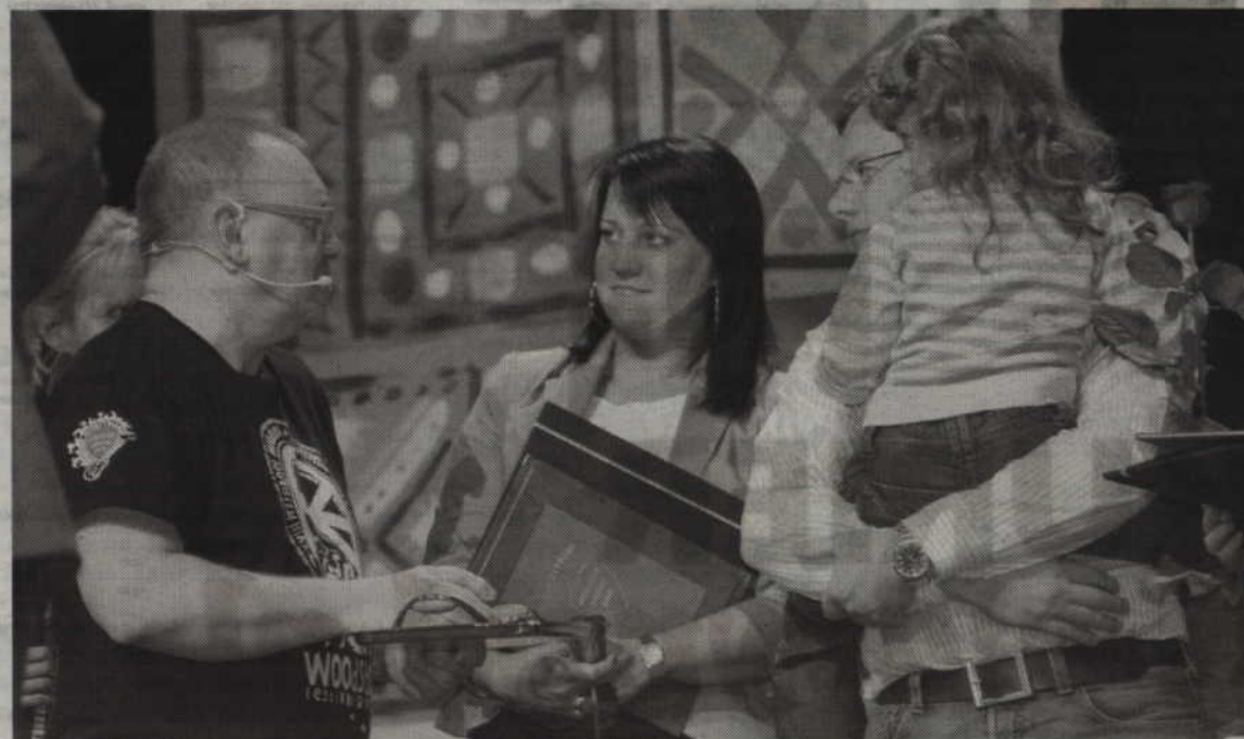
Złote serduszko z nr 1 za kwotę 30 100 zł wylicytowała kwidzyńska firma ROBI.