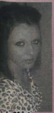
...jak, 21 lat, ...ka