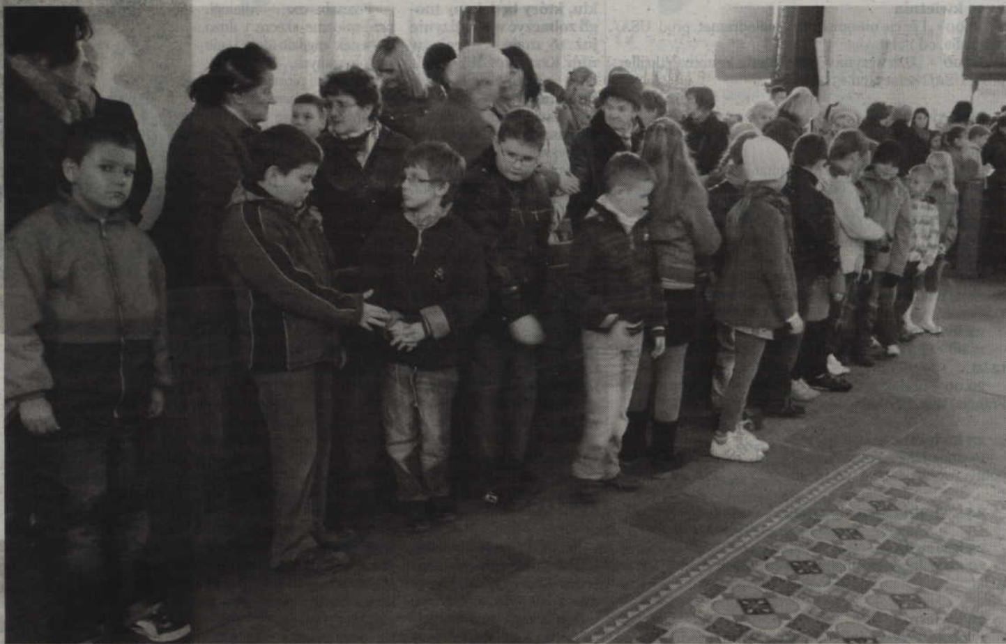
Dzieci przekazują sobie znak pokoju.

Są jednak wody, w których nie można się utopić ani być przemoknięty i chorym. Jest to woda głęboka – wymaga wiary, ale czy można ponieść w niej śmierć? Wręcz przeciwnie. To woda, w której zanurzenie daje życie. Zdrój Bożego Miłosierdzia. Pływanie po tych wodach wymaga również nauki. Naszą nauczycielką jest absolwentka trzech klas szkoły podstawowej, którą wybrał do tego dzieła sam Chrystus jako swoją sekre-