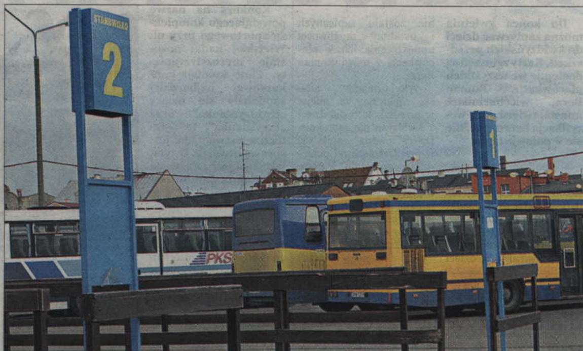
Pijany kierowca został zatrzymany w okolicach dworca PKS w Kwidzynie. Właśnie wyruszał w kolejną trasę.

Kierownik przewozów w PKS Kwidzyn dodaje,