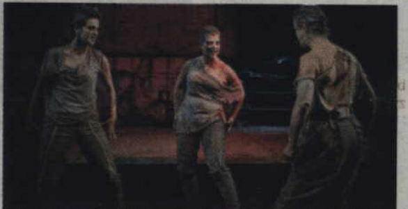
Na deskach kwidzińskiego teatru zobaczymy gdyńskich artystów w spektaklu „Tango Nuevo”.

Spektakl przybliży twórczość Astora Piazzolli - artysty, który zrewolucjonizował tango. Był zarówno uwielbiany, jak i nienawidzony w Buenos Aires za to, że ośmielił się eksperymentować z dumą i narodowym klejnotem Argentyny. To właśnie Piazzolla stworzył oryginalny, niepodrabialny