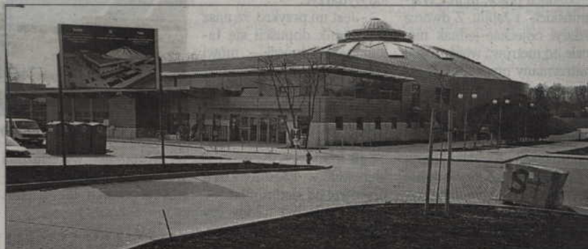
Uroczyste otwarcie nowego kompleksu sportowego przy ul. Wiejskiej planowane jest na ostatni weekend kwietnia.