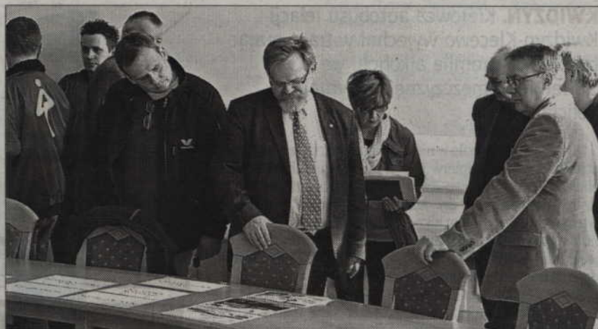
Najpierw komisja konkursowa zapoznała się z nadesłanymi 57 propozycjami nazw nowej hali sportowej.

Nie oznacza to jednak, że nazwa została już wybrana ostatecznie. Jurorzy (burmistrzowie, urzędnicy miejscy, przedstawiciele kultury, sportu oraz lokalnych mediów) zgodnie stwierdzili bowiem, że jeśli mieszkańcy w sposób naturalny nazwą ten obiekt inaczej, wówczas sprawa nazewnictwa hali zostanie rozpatrzona ponownie. Gdy natomiast przyjmie się którąkolwiek z wybra-