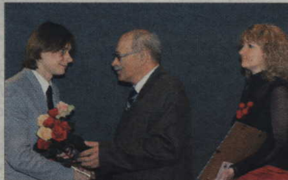
Po prezentacji filmu reżyser na gorąco odbierał gratulacje i dowody uznania.