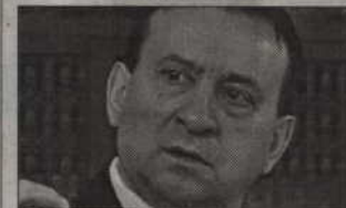
Wiesław Wosiak - zastępca przewod- niczącego Rady Miejskiej w Kwidzynie.