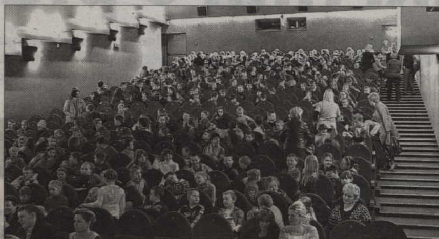
Gala podsumowująca realizację programu „Domofon ICE” odbyła się w kwidzyńskim Kinoteatrze.

W uroczystej gali zorganizowanej w kwidzyńskim teatrze udział wzięli uczniowie z czterech szkół: SP 4 Kwidzyn, SP 5 Kwidzyn, SP Korzeniewo oraz SP Tychnowy.