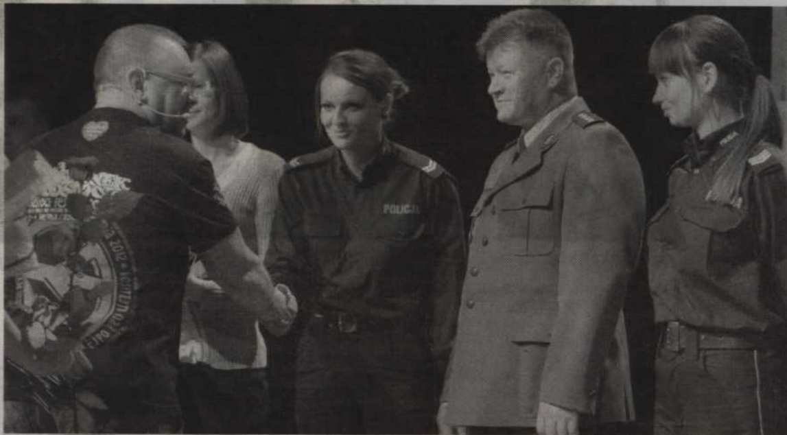
Podziękowania za pomoc dla kwidzyńskiej Policji.