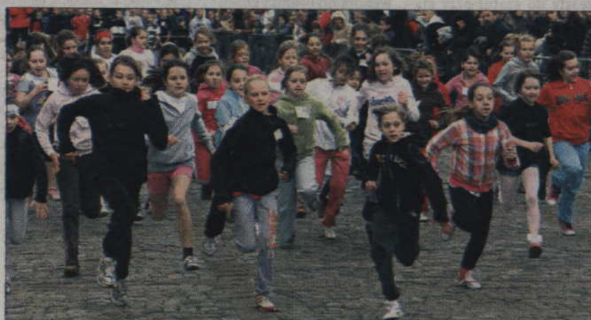
Start do wszystkich zawodów odbywał się na placu Jana Pawła II w Kwidzynie.