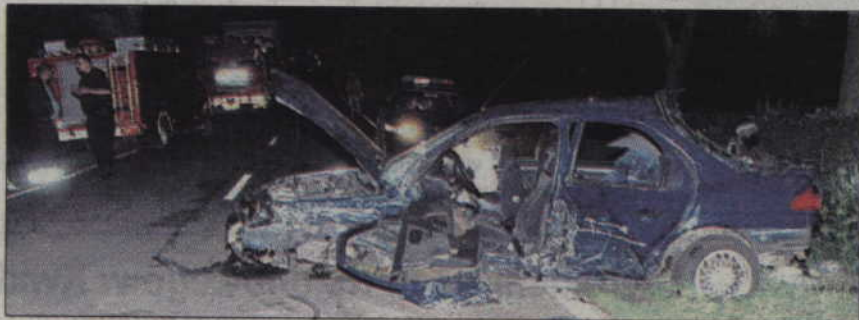
W Gardei renault czołowo zderzył się z fordem mondeo.

KWIDZYN. Cztery osoby, w tym jedna ciężko, zostały ranne w wypadku do którego w Gardei. Renault, którym jechał 22-letni mieszkaniec Kwidzyna czołowo zderzył się z fordem mondeo. Śledczy z kwidzyńskiej komendy ustalają dokładne okoliczności tego zdarzenia.