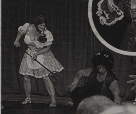
Kasia próbowała zmusić do ożenku nawet diabła.

- Specjalnie dla tej roli zapuściłem sobie włosy – przyznaje.