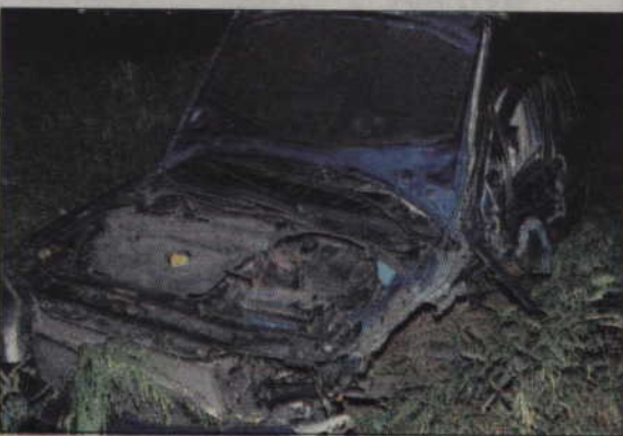
Pasażerowie tego auta zostali odwiezieni do szpitala.

Najciężej ranna była 55-letnia pasażerka forda. Badanie wykazało, że kierowcy obu pojazdów biorących udział w zdarzeniu byli trzeźwi. (m)