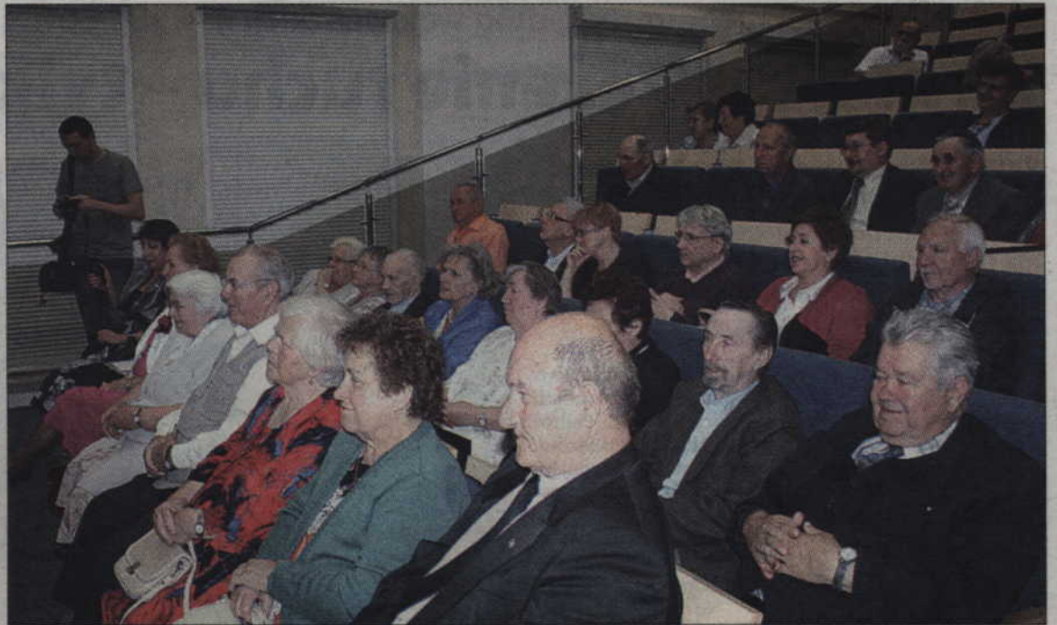
Członkowie oraz sympatycy Towarzystwa Kulturalnego Mniejszości Niemieckiej „Ojczyzna” świętowali 20-lecie utworzenia organizacji.