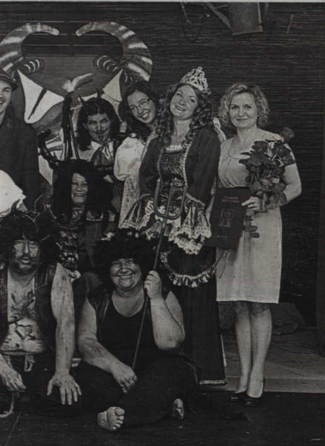
wraz z całą obsadą tego spektaklu.