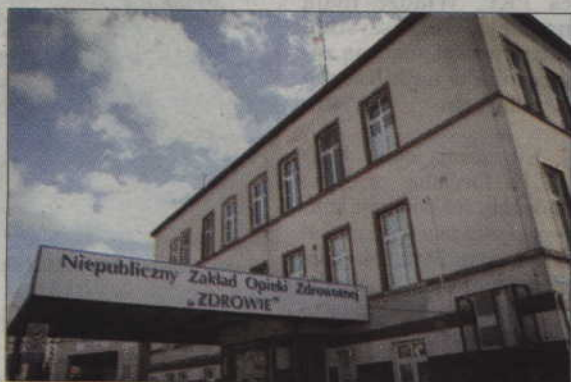
12 sierpnia na terenie powiatu kwidzyńskiego odbędzie się referendum w sprawie kwidzyńskiego szpitala.