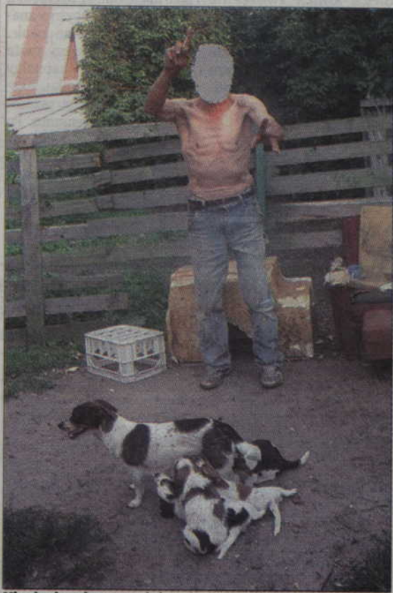
Mieszkaniec miasta znęcał się nad psem rzucając nim o betonową nawierzchnię.

Czworonogi trafiły do schroniska na Miłosnej