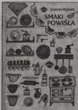
Książkę „Smaki Powiśla” można kupić w Tabularium.

- Przepisy zamieszczone w książce pochodzą od sztumian oraz kwidzyńian mieszkających na Powiślu od urodzenia, inne są wiernymi tłumaczeniami przepisów przekazanych przez mieszkańców Sztumu i Kwidzyna sprzed 1945r., a część stanowią zapamiętane smaki z dzieciństwa - mówi autorka. - Myślę, że niektórzy czytelnicy odnajdą swoje wspomnienie, cząstkę wspólnie obchodzonych świąt, odpustowego obiadu, smak chwil spędzonych z najbliższymi za stołem.