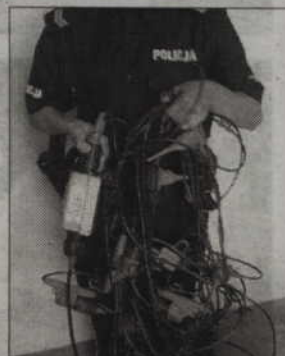
Prabuckim policjantom udało się odzyskać skradziony sprzęt, służący do badań pomiaru wstrząsów ziemi.

- Mundurowi postanowili sprawdzić dokąd zmierza mężczyzna i co niesie w siatce – informuje Bożena Schab,