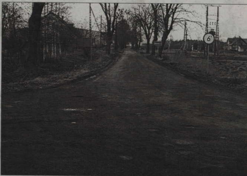
Drogi nr 525 i 607 od lat wymagają gruntownego remontu.

Zastępca wójta gminy Ryjewo podkreśla, że droga