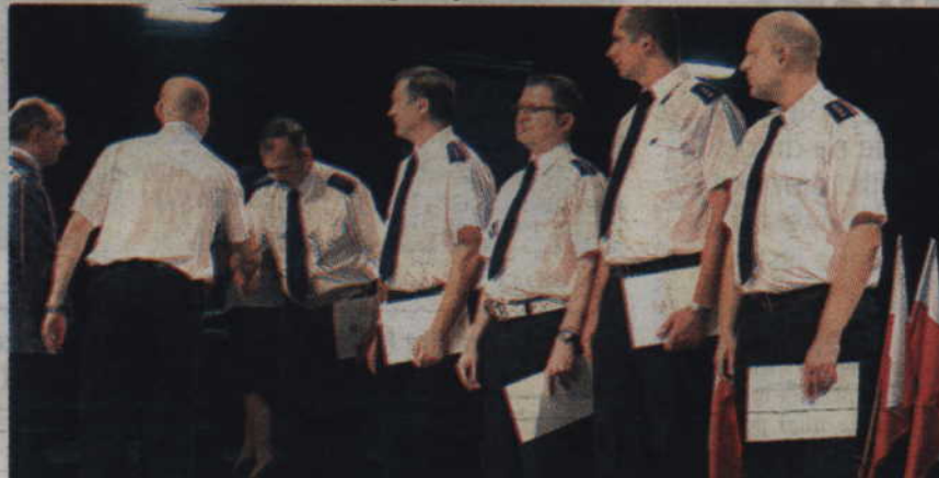
Komendant Komendy Powiatowej Policji w Kwidzynie gratuluje awansowanym aspirantom i starszym aspirantom Policji.