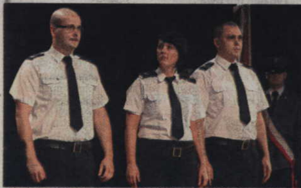
Dziewięciu policjantów otrzymało stopień starszego sierżanta.