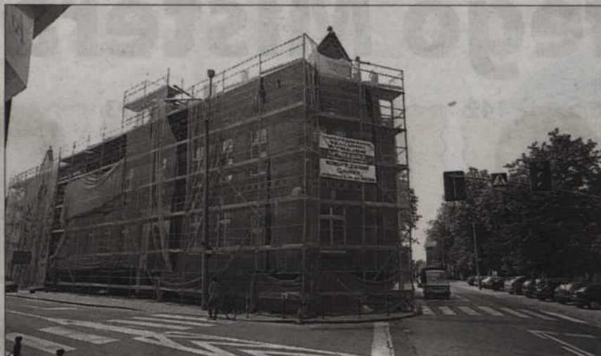
Wykonawcy zgłosili modernizowany budynek przy ul. Chopina do odbioru technicznego.

KWIDZYN. Kończy się remont dawnej „jedyнки”