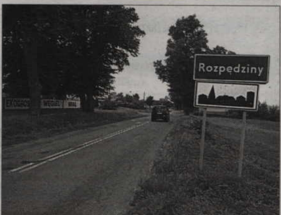
Budowa kanalizacji w Rozpędzinach zakończy się w przyszłym roku.