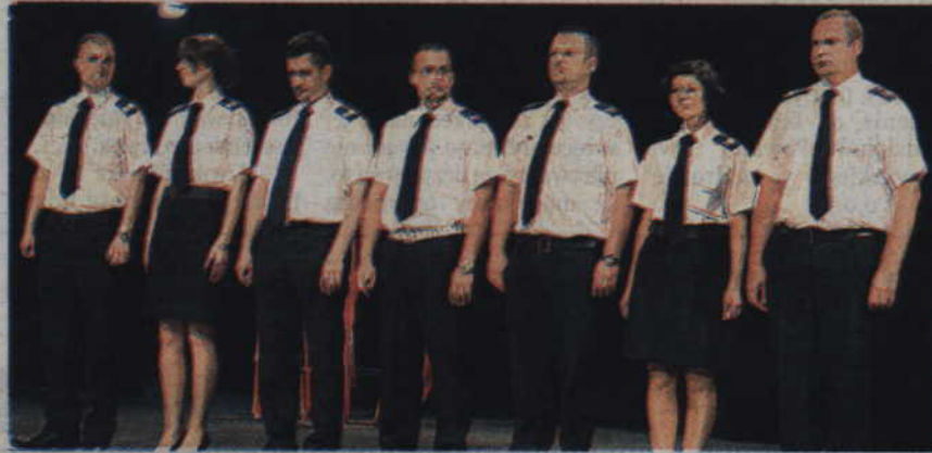
Awansowani na stopień sierżanta sztabowego Policji.