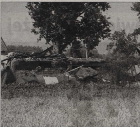
W Gurczu spłonął budynek inwentarski.