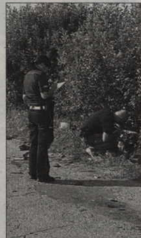
Kierowca skutera trafił do Gdańska, natomiast pasażer do kwidzyńskiego szpitala.

-Ze wstępnych ustaleń funkcjonariuszy wynika, że 20-latek jadący skuterem, na luku drogi z niewiadomych przyczyn zjechał na lewą stronę jezdni i uderzył w jadący z naprzeciwka traktor - wyjaśnia Bożena Schab, rzecznik prasowy Komendy Powiatowej Policji w Kwidzynie. -W wyniku wypadku ucierpiał kierowca jednoślada oraz jego pasażer. Dwudziestolatek z obrażeniami kończyn i głowy