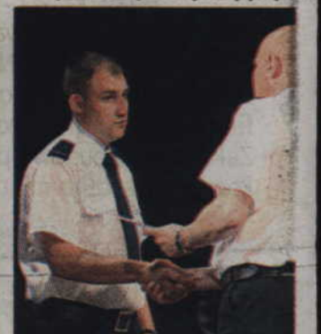
Podczas uroczystości przyznano aż 40 awansów na wyższe stopnie.

jednej z podoperacji, która realizowana była na terenie województwa pomorskiego, uczestniczyli w niej praktycznie wszyscy policjanci ze wszystkich komend miejskich i powiatowych naszego garnizonu. Oficjalnie jak i nie oficjalnie podkreślano, że to co robiliśmy wspólnie, robiliśmy dobrze. Mam nadzieję, że doświadczenia które zdobyliśmy w trakcie tego turnieju będą procentowały przy zabezpieczaniu innych imprez. Mam też nadzieję, że standardy kibicowania, z jakimi zetknęliśmy się ze strony zagranicznych kibiców, przejmą również nasi rodzimi kibice, który podobnie będą dopingować swoich ulubieńców na naszych stadionach.