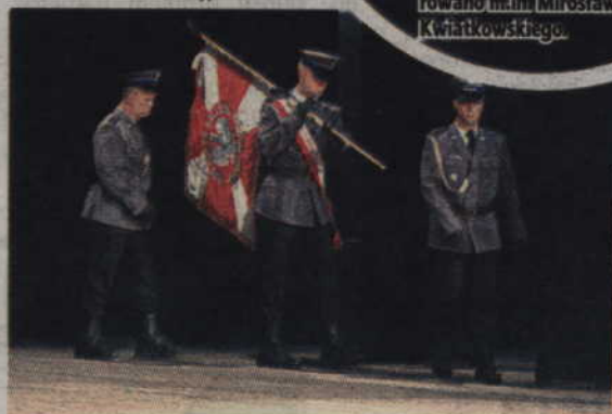
Poczet sztandarowy KPP Kwidzyn.