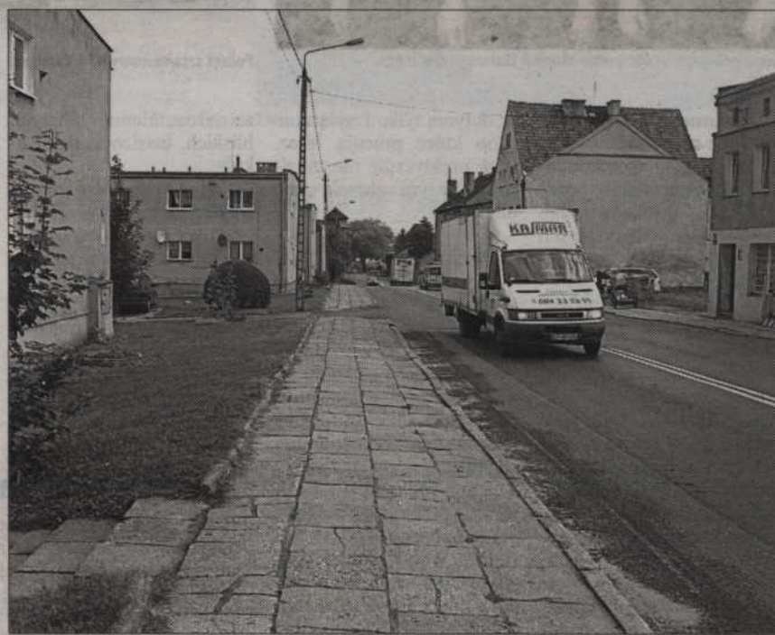
Ulica Kwidzińska w Gardei doczeka się w końcu nowego chodnika.