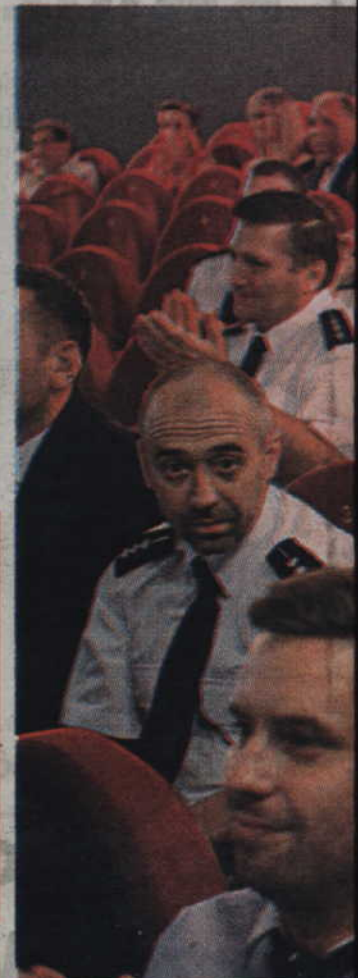
Uroczystości Święta Policji odbyły się w kwidzynie.