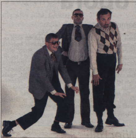
Neo-Nówka zaprasza na swój najnowszy program „The SEJM”.