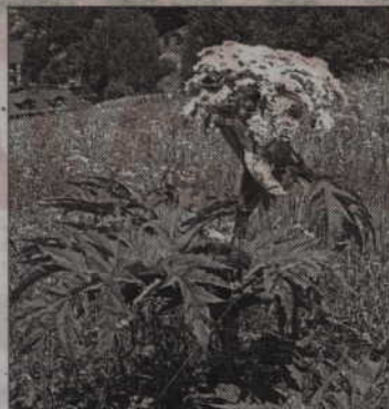
Barszcz Sosnowskiego może mieć nawet 4 metry wysokości.

Barszcz Sosnowskiego to bardzo niebezpieczna roślina, która pojawiła się w naszym kraju pod koniec lat 50-tych ubiegłego wieku. Był to dar narodu radzieckiego dla polskich krów. Polskie krowy bardzo szybko poznały się jednak na niechcianym prezencie i nie chciały go jeść. Roślina natomiast znalazła w naszym kraju doskonałe warunki do życia i rozpoczęła systematyczną ekspansję. Najpierw opanowała południe naszego kraju, skąd przypuściła atak na całe terytorium. Barszcz