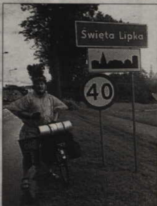
Krzysztof Wojewódzki przed wjazdem do Świętej Lipki.