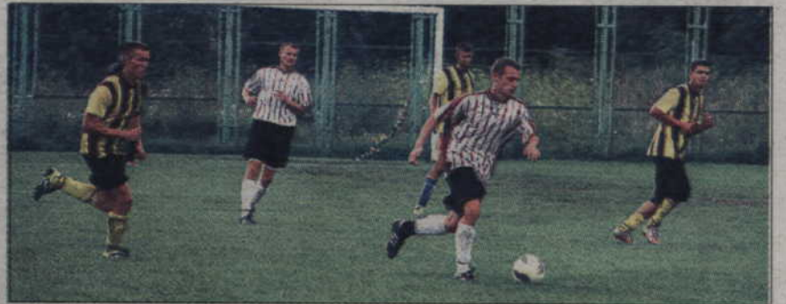
Kwidzynianie w okresie przygotowawczym przegrali m.in. z Wisłą Korzeniewo 0:1.

Już pod okiem nowego szkoleniowca piłkarze przygotowawali się do swego powrotu do rozgrywek IV ligi. Kwidzynianie przygotowawali się na własnych obiektach sportowych, rozgrywając przy tym mecze sparingowe. Kwidzynianie wygrali m.in. z Relaksem Ryjewo 6:2, Olimpią II Elbląg 3:1, zremisowali