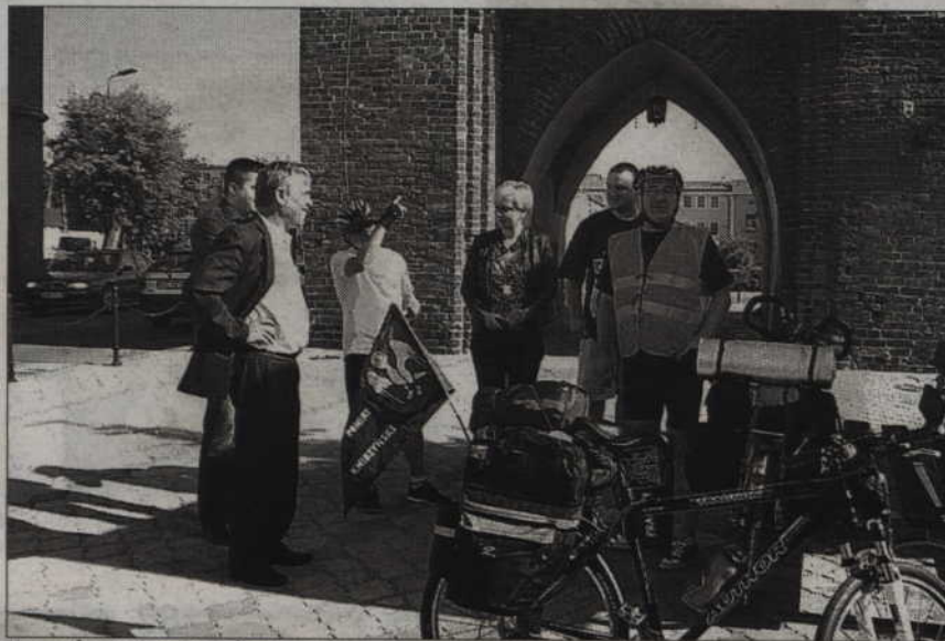
Uczestnicy wyprawy przed wyruszeniem w trasę.

Podczas rajdu spali w najróżniejszych miejscach. Raz