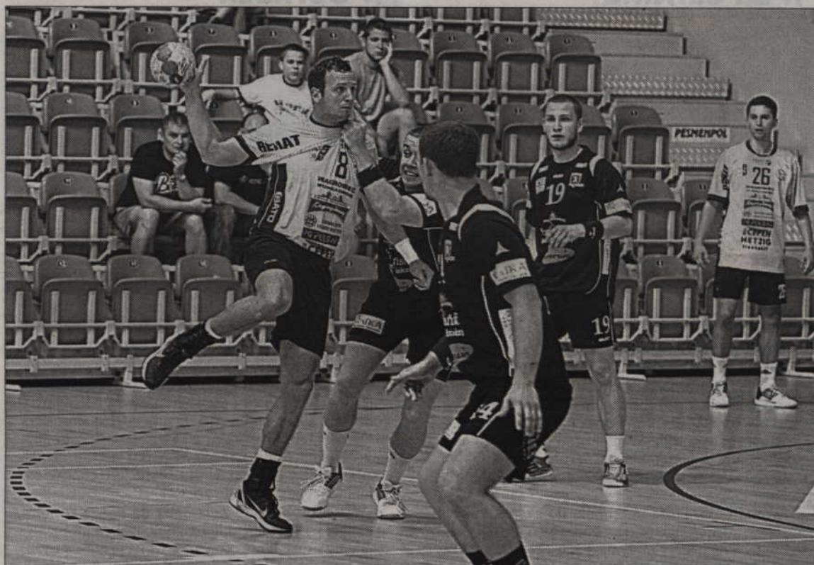
MMTS Kwidzyn w ostatnim meczu turnieju pokonał Nielbę Wągrowiec różnicą aż 9 bramek.