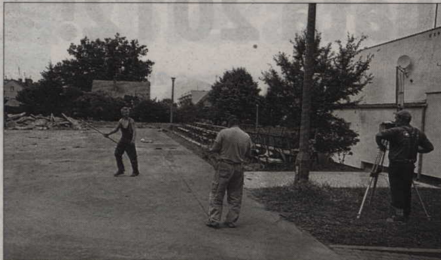
Nowy „Orlik” powstanie przy Gimnazjum nr 3 w miejscu dotychczasowego betonowego boiska.

KWIDZYN. Sportowa inwestycja na ul. Kamiennej