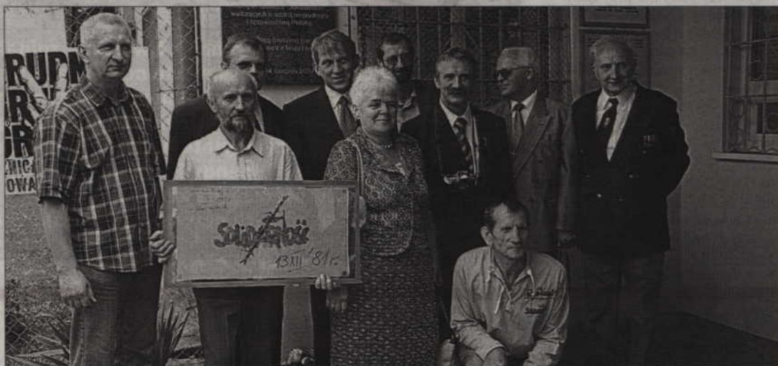
Internowani w kwidzińskim Zakładzie Karnym podczas jednego ze spotkań rocznicowych.