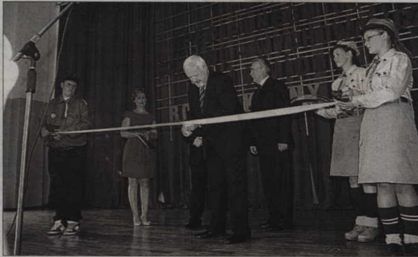
Podczas uroczystego otwarcia nowej siedziby Specjalnego Ośrodka Szkolno-Wychowawczego w Kwidzynie nie zabrakło tradycyjnego przecięcia wstęgi.

- Inwestycja została zrealizowana dużym wysiłkiem. Nasz budżet jest już dość mizerny, ale powiedzieliśmy sobie, że inwestycje oświatowe, a szczególnie ta inwestycja, to nasz priorytet. Kosztowało to nas ok. 2,5 mln zł. Część pieniędzy udało się uzyskać z Narodowego Funduszu Ochrony