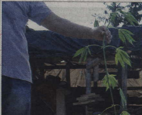
W Ryjewie policjanci zlikwidowali hodowlę konopi indyjskich.

Policjanci znaleźli w szklarni 6 sadzonek