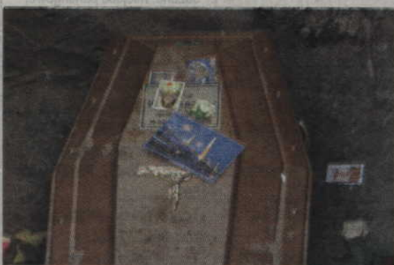
Trumna składana w grobie Anny Walentynowicz, jakie są w niej tajemnice dotyczące katastrofy smoleńskiej?

GDAŃSK. 17 września odbędzie się ekshumacja ciała znajdującego się w grobie Anny Walentynowicz, legendarnej działaczki Solidarności, która zginęła 10 kwietnia 2010 r. w katastrofie smoleńskiej – w tragicznej podróży na uroczystości w Kątyniu.