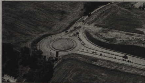
Budowa mostu wymusiła przebudowę skrzyżowania z drogą krajową nr 91 oraz budowę pięciu nowych skrzyżowań - w tym dwóch dwupoziomowych oraz ronda.