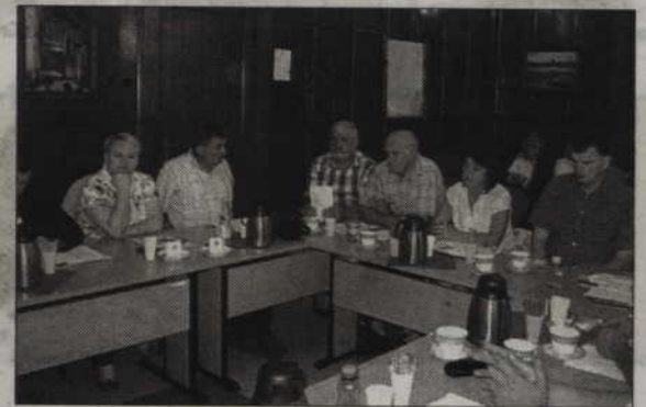
Po dwumiesięcznej przerwie prabucki radni ostro zabrali się do pracy.

- Po przetargu całkowity koszt prac renowacyjnych zamknie się kwotą 108 tysięcy złotych. 54 tysiące otrzymaliśmy z Urzędu Marszałkowskiego, 24 ty-