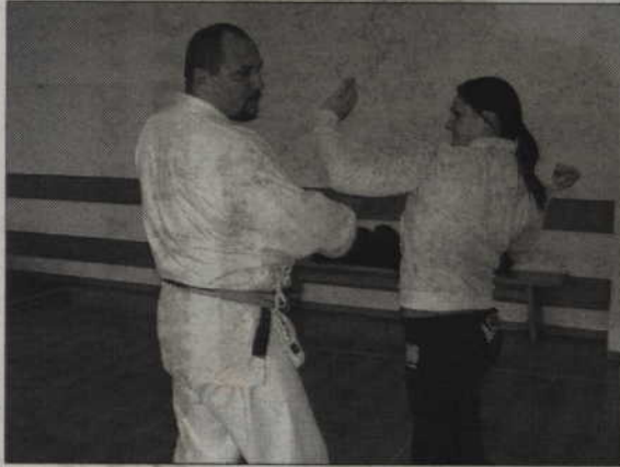
Program „Kobieta 5 kroków po bezpieczeństwo” ruszy 18 września.

„Kobieta - 5 kroków po bezpieczeństwo” to nazwa programu edukacyjno-profilaktycznego, realizowanego co roku przez Stowarzyszenie „Bezpieczny Kwidzyn”.