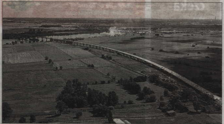
Most przez Wisłę zostanie wybudowany w ciągu drogi krajowej nr 90. Połączy drogę krajową nr 1 - leżącą po zachodniej stronie rzeki z drogą krajową nr 55 - leżącą po jej wschodniej stronie.

Most, który budowany jest w ciągu drogi krajowej nr 90, łączy drogę nr 1 – leżącą po zachodniej stronie rzeki z drogą krajową nr 55 – leżącą po jej wschodniej stronie. Na przeprawę mostową składają się estakady dojazdowe nad terenem zalewowym i most główny. Trasa główna przeprawy będzie miała 11,9 km długości, a w jej ciągu powstaną następujące obiekty inżynierskie: most przez rzekę Wisłę o długości 808,5 m i całkowitej szerokości 15,9 m, trzy estakady o łącznej długości około 1 km, most przez rzekę Strugę Młyńską (25 m) i przez rzekę Liwę (51,6 m), trzy przejścia dla zwierząt, przejście gospodarcze oraz kilkanaście przepustów, pełniących równocześnie funkcję przejść dla małych zwierząt.