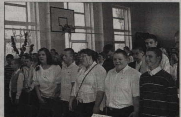
Uczniowie Specjalnego Ośrodka Szkolno-Wychowawczego w Kwidzynie rozpoczęli nowy rok szkolny w nowej siedzibie przy ul. Ogrodowej

(jk) Modernizacja budynku kosztowała ok. 2,5 mln zł.