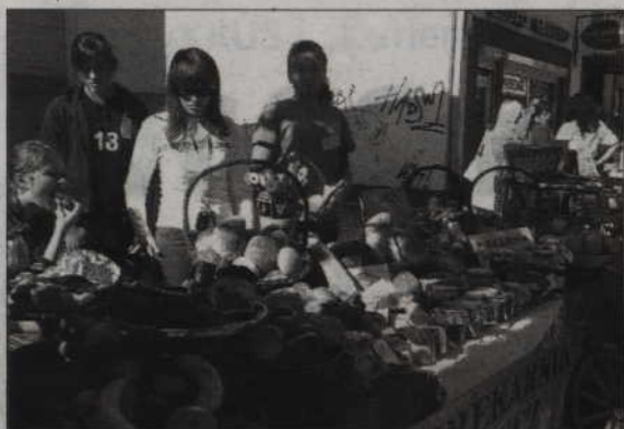
Już w najbliższą sobotę na deptaku odbędzie się festyn „Smaki Jesieni”.