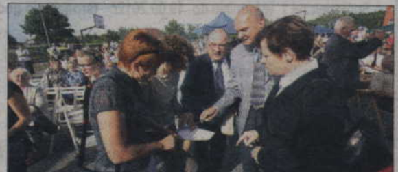
Obrazy komisji konkursowej wybierającej najpiękniejszy wieńiec dożynkowy.