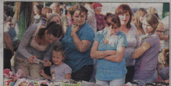
Uczestnicy festynu przyglądają się towarom wystawionym na jednym ze stoisk handlowych.