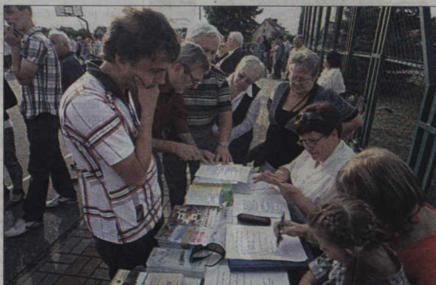
W konkursie zorganizowanym przez placówkę terenową KRUS w Kwidzynie uczestniczyło 25 osób.

Organizatorzy postanowili przyznać dziesięć równorzędnych nagród dla osób, które uzyskają najlepsze wyniki w przeprowadzonej zabawie. Nagrody w postaci blenderów, a także sprzętu bhp i sprzętu przeciwpożarowego (gaśnice, apteczki, kamizelki ostrzegawcze, itp.) ufundowała placówka terenowa Kasy Rolniczego Ubezpieczenia Społecznego w Kwidzynie.