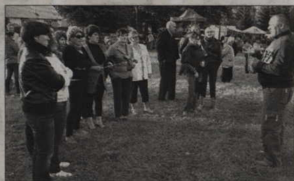
Trumiejki były gospodarzami tegorocznych dożynek w gminie Prabuty.

Organizatorzy dożynek przygotowali sporo atrakcji.