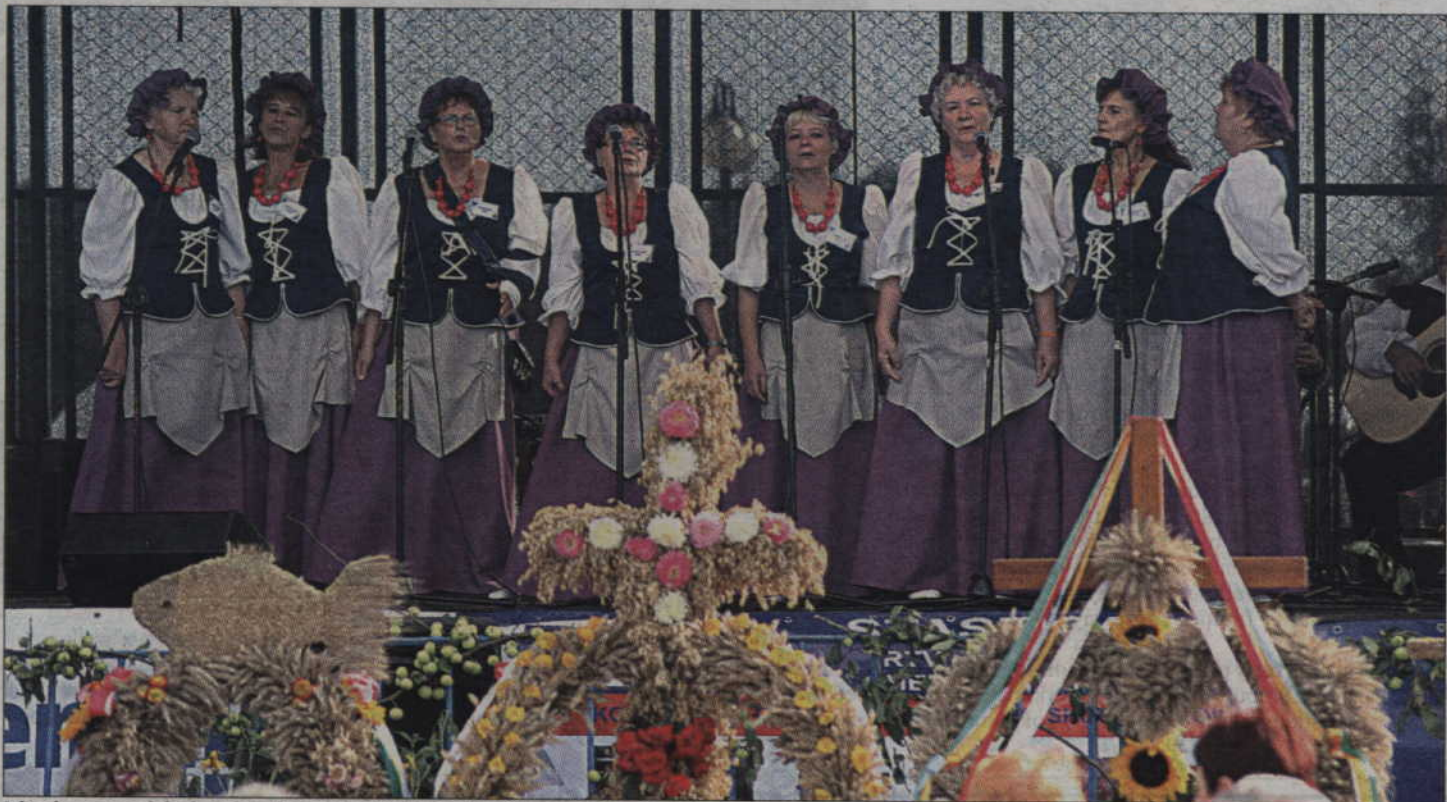
Jako pierwszy na dożynkowej scenie zaprezentował się kwizyński zespół „Powiślanek”.

Gwiazdą muzyczną tegorocznych dożynek powiatowych w Sadlinkach był jednak występ zespołu „InoRos”. To finaliści muzycznego programu „Must be the music” oraz współautorzy głośnego hitu „Czyste szaleństwo”, który stał się nieoficjalnym hymnem naszej reprezentacji. Podczas koncertu w Sadlinkach muzycy urzekli publiczność góralskimi rytmami oraz niesamowitą energią sceniczną. Im-