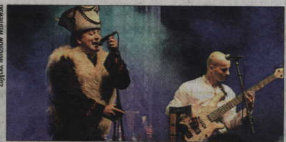
Gwiazdą wieczoru był zespół „InoRos”.