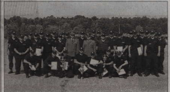
Uczestnicy rywalizacji patroli policyjnych. Kwidzyńskianin po lewej stronie zdjęcia, wraz ze zdobytym pucharem.

Test wiedzy, strzelanie oraz tor przeszkód