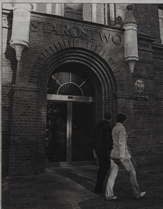
W budynku, w którym mieści się starostwo, zamontowano nowe, automatyczne drzwi. Dzięki nim na przykład niepełnosprawni mieszkańcy łatwiej mogą wejść do środka.