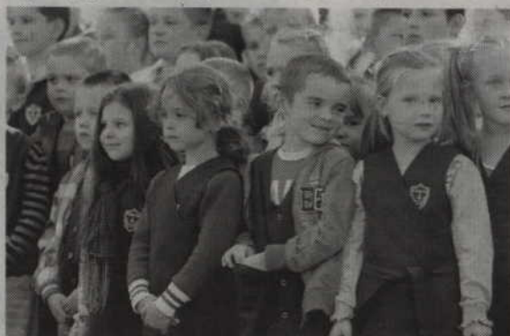
Wśród zebranych nie zabrakło również uczniów pobliskiej Szkoły Podstawowej nr 4.