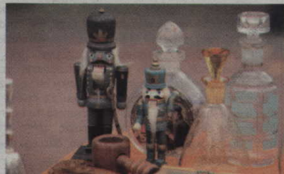
Wśród eksponatów zauważyliśmy także nietypowe dziadki do orzechów.