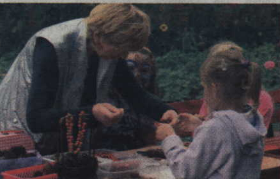
Maluchy chętnie odwiedzały stoisko z własnoręcznie robioną biżuterią.