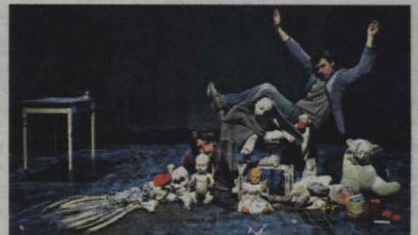
Teatr Malabar Hotel i Figurentheater Wilde & Vogel przedstawi natomiast spektakl zainspirowany prozą Jonathana Safrona Foera.