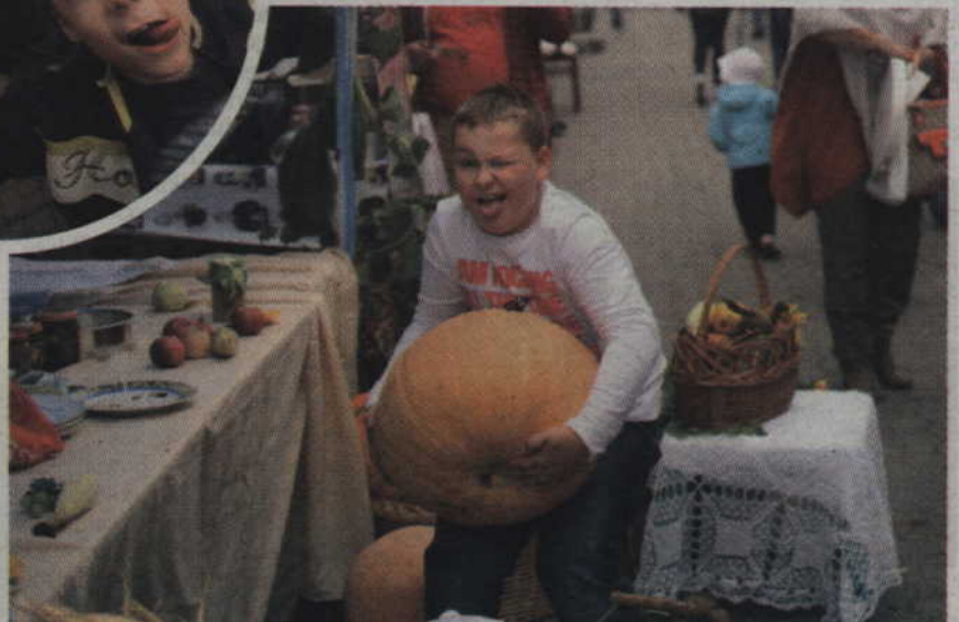
Czasem zwykłe przeniesienie dyni nie jest takie proste.