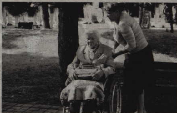
Ostatnia „pestka” - żyjący świadek wydarzeń pod Monte Cassino.