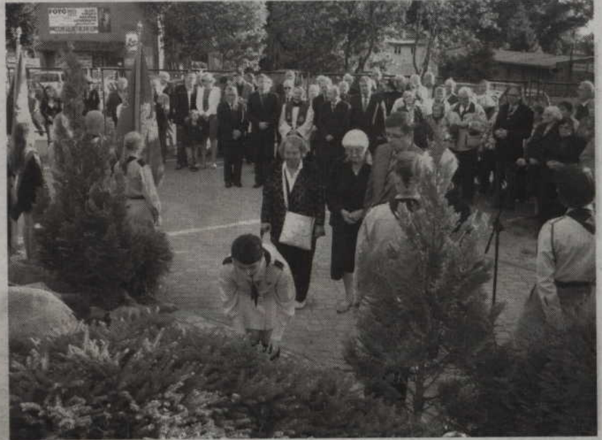
Mieszkańcy Prabut złożyli kwiaty pod pomnikiem pomordowanych na Kresach Wschodnich II Rzeczypospolitej.

- Jestem potomkiem kresowiaków, moi rodzice, dziadkowie pochodzą spod Buczacza. W każdym z nas znajdziemy korzenie kresowe. Uroczystości w Prabutach odbywają się w przeddzień rocznicy ustanowienia przed sześcioma wiekami we Lwowie stolicy arcybiskupstwa rzymskokatolickiego. Musimy pamiętać o tragedii naszych rodaków na Kresach Wschodnich. Są miejsca na Wołyniu, Podolu, gdzie jeszcze kilkadziesiąt lat temu istniały wsie, w których bardzo często mieszkało po kilkaset osób. Dziś po tych wsiach nie ma śladu. W wyniku zbrodniczej działalności najpierw Niemców, a później morderców spod znaku UPA-OUN te wsie na zawsze zniknęły z powierzchni ziemi. Ich mieszkańcy albo zostali wymordowani albo uciekli. Nie możemy zapominać, że tych mordów dokonali ukraińscy nacjo-