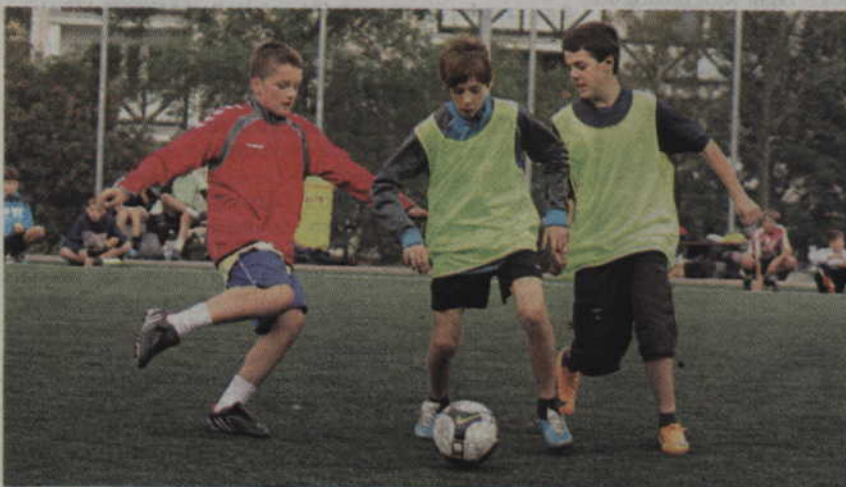
Do tegorocznego turnieju zgłosiło się 29 zespołów.