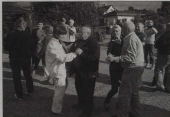
„Dzień Działkowca” zakończyła zabawa pod gołym niebem.