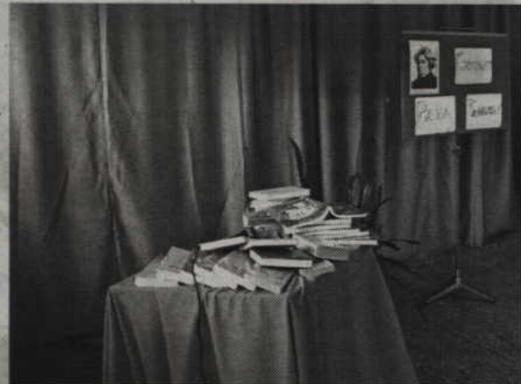
Wspólne czytanie dzieła Mickiewicza odbyło się z okazji 200 rocznicy wydarzeń w Soplicowie.