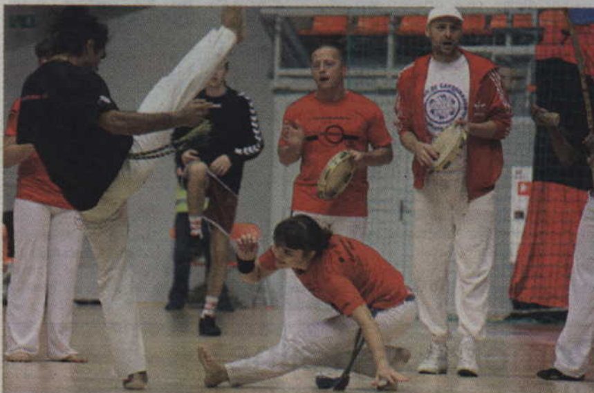
Podczas przerwy na parkiecie pojawili się uczestnicy odbywającego się w Kwidzynie festiwalu capoeiry, którzy dali kibicom specjalny pokaz.

decyzją władz klubu mecz obejrzeć było można już za 5 zł, bowiem właśnie tyle kosztują najtańsze bilety na mecze kwidziń-