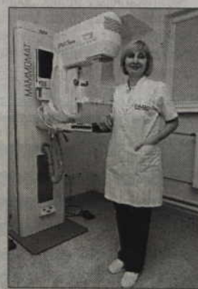
Bezpłatne badania adresowane są do pań w wieku 50-69 lat.

grupą wiekową 50-69 lat mogą przebadać się odpłatnie, po okazaniu skierowania od lekarza.