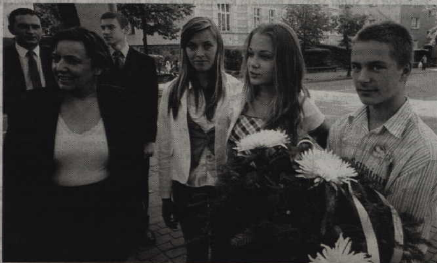
Na „Skwerze Kombatanta” z kwiatami stawili się m.in. uczniowie kwidzyńskich szkół.

Zaczelśmy krzyżać z radości „sobaczki”, czyli pieski. Niestety, była to wataha wilków, która zbliżała się w naszą stronę. Nagle pojawił się Rosjanin, który chwycił nas, kilkuletnie dzieci pod pachy i uratował z opresji.