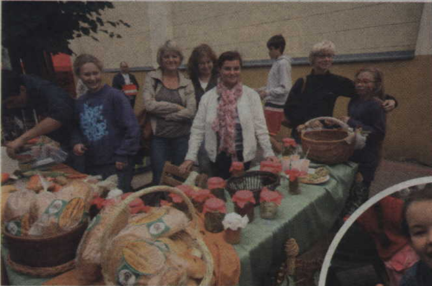
Stoisko przygotowane przez Zespół Szkół Ponadgimnazjalnych nr 4 w Kwidzynie.