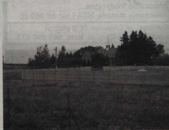
Działka przy ul. Grudziądzkiej w Gardei została sprzedana. Prawdopodobnie ma tu powstać nowy skład opału.

Jak podkreśla sekretarz na chwilę obecną nie ma jeszcze wydanej decyzji o udzieleniu pozwolenia na działalność.