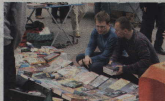
Książki na jednym ze stoisk kwidzyńskich targów staroci.