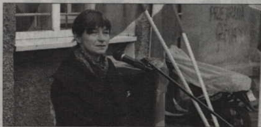
Odsłonięcie tablicy odbyło się 13 września, w rocznicę urodzin tragicznie zmarłej kwidzynianki.