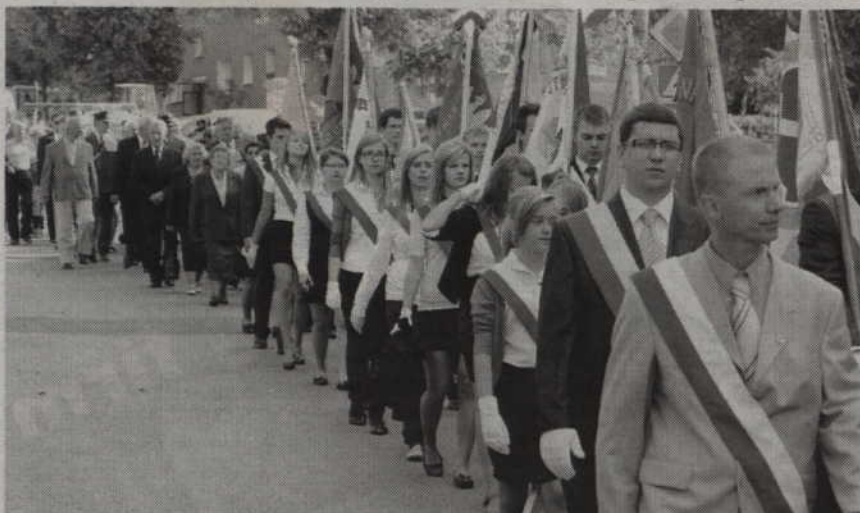
Orszak przemarszerował ulicą Warszawską i Braterstwa Narodów.

ka”. Tak właśnie nazywano młode kobiety i dziewczyny, które pod Monte Cassino woziły broń i amunicję pod okupowane wzgórze. Jest to