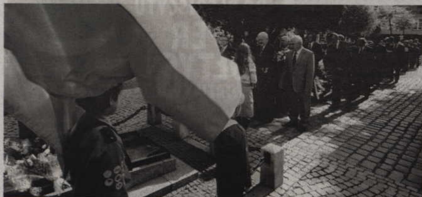
Delegacje złożyły kwiaty na Grobie Nieznanego Żołnierza.

Kwidzynianie uczcili 73. rocznicę agresji ZSRR na Polskę. Podczas spotkania zorganizowanego na Skwerze Kombatanta odczytano Apel Poległych, a delegacje złożyły wiązanki kwiatów na Grobie Nieznanego Żołnierza. Uroczystości zakończyła msza święta odprawiona w kościele pw. św. Jana Ewangelisty w Kwidzynie.