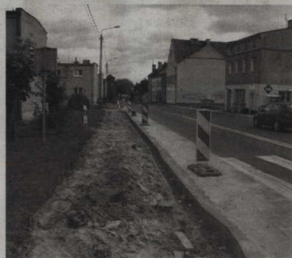
Remont chodnika przy ul. Kwidzyńskiej w Gardeji będzie kosztował 62 tys. zł.

Radości z wymiany chodnika nie kryje wójt