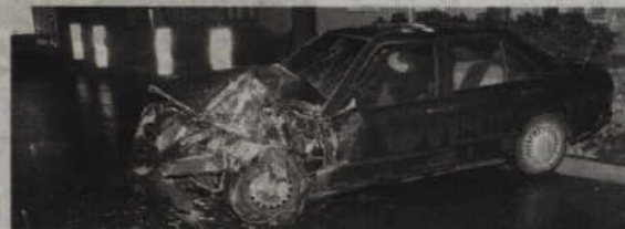
W Gardei doszło do poważnego wypadku, mercedes zderzył się czołowo z ciężarówką.

-Przybyli na miejsce funkcjonariusze wstępnie ustalili, że kierujący mercedesem 38-latek prawdopodobnie nie dostosował prędkości do panujących warunków na drodze - wyjaśnia Bożena Schab, rzecznik prasowy Komendy