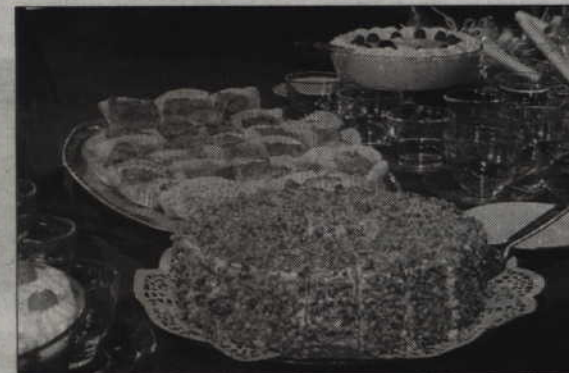
Podczas promocji można było spróbować potraw przygotowanych zgodnie z przepisami zawartymi w książce.

podczas pracy nad książką okazało się przetłumaczenie przepisów pisanych gotykiem. Autorka śmieje się, że w jej kregu zaczęło nawet funkcjonować nowe powie-