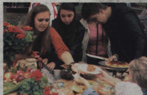
Na stoiskach przygotowanych przez kwidzyńskie szkoły można było kupić wiele produktów domowej roboty.