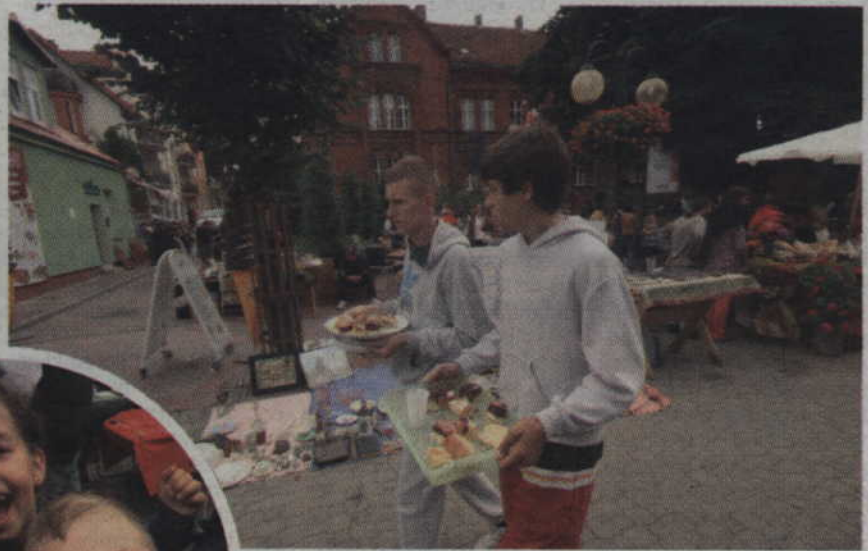
Na deptaku można było także spotkać uczniów zachęcających do spróbowania przygotowanych wyrobów.