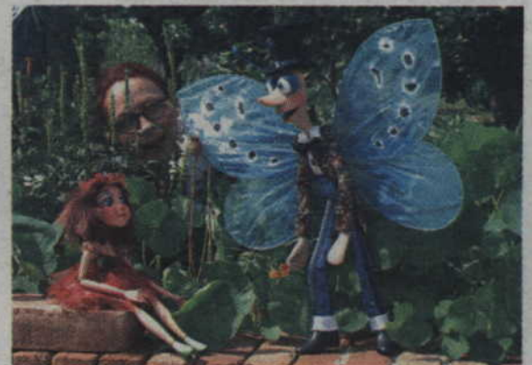
Słowacki Teatr Neline zaprasza na bajkę „O łące, motyli i kwiatowej wróżce”.