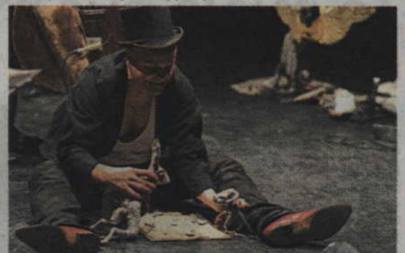
„Piosenki dla Alicji” to kolejna tegoroczna propozycja niemieckiej grupy teatralnej Figurentheater Wilde & Vogel.