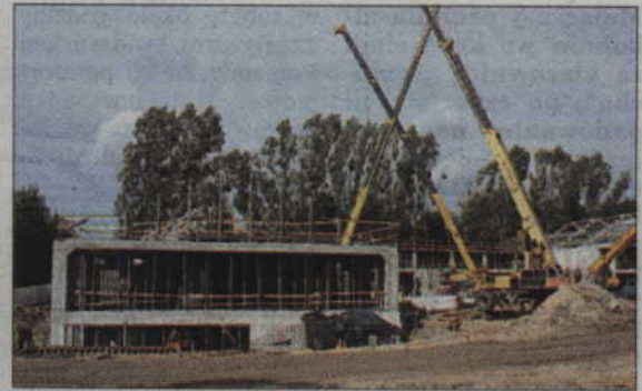
W tej chwili prace przy budowie parku przebiegają zgodnie z harmonogramem.