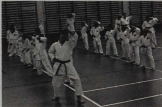
Podczas wakacji zawodnicy trenowali w hali.

Od początku września dla karateków rozpoczął się natomiast nowy sezon treningowy. Nadal w SP 4 przyjmowane są zapisy