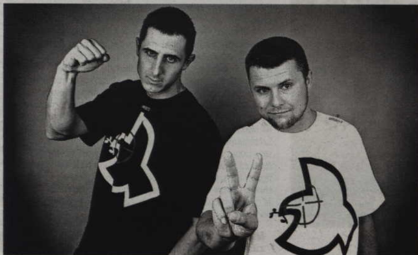
Podczas gali wystąpi zespół hip-hopowy Pokój Z Widokiem Na Wojnę.