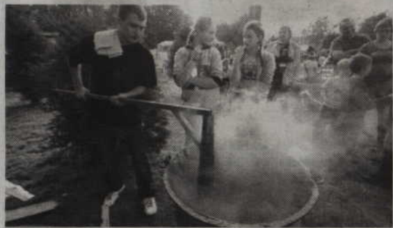
Koło Gospodyń zaprasza do wspólnego smażenia powideł w Nebrowie.

Urząd Gminy Sadlinki oraz Koło Gospodyń Wiejskich w Nebrowie Wielkim zapraszają na „Święto Powideł Nebrowskich w gminie Sadlinki”. Wspólne smażenie powideł odbędzie się już w najbliższą sobotę, 22 września na placu przy Ochotniczej Straży Pożarnej w Nebrowie Wielkim. Wstęp wolny.