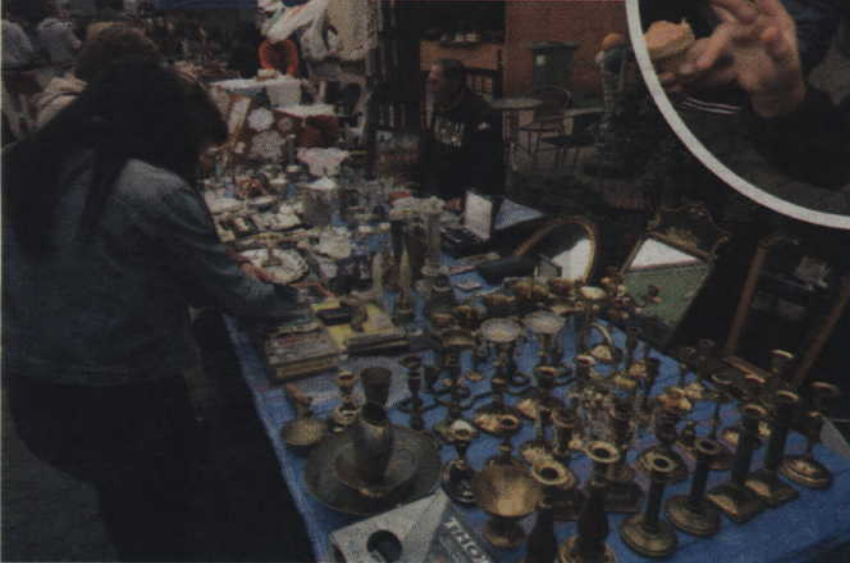
Jedno ze stoisk targów staroci.