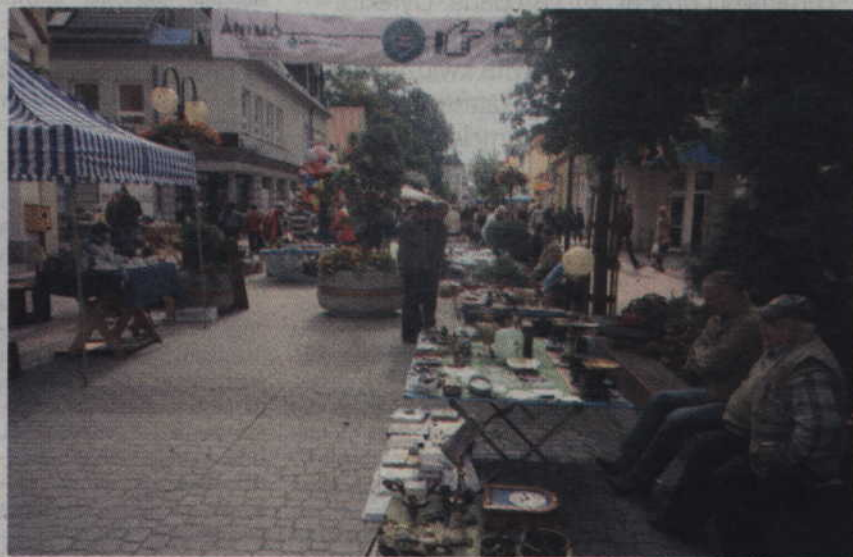
Festyn tradycyjnie odbył się na deptaku przy ul. Piłsudskiego.

- Wszystkie były piękne i kolorowe - mówi współorganizator imprezy. - Widać było, że zarówno dzieci jak i rodzice oraz nauczyciele napracowali się przy tworzeniu poszczególnych prezentacji. Na każdym ze stoisk znalazłem również wiele smaczkowych rzeczy.