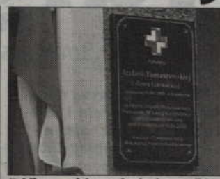
Tablica zawisła na budynku „Solidarności” przy ul. 11 Listopada.