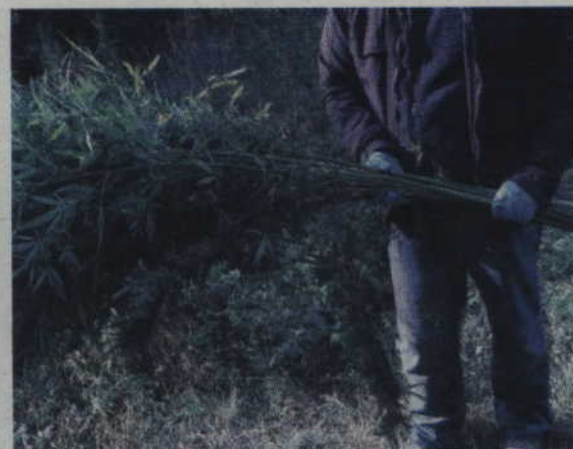
Kwidzyńscy policjanci zlikwidowali plantację konopi indyjskich.

Policjanci zatrzymali 29-latkę do wyjaśnienia. Podczas policyjnych czynności wyszło na jaw, że mężczyzna kilkanaście kilometrów od miasta, na polanie pod lasem, uprawia konopie indyjskie. Funkcjonariusze zlikwidowali hodowlę i zabezpieczyli 43 sadzonki tej rośliny. Krzaki mierzyły od 30 do 170 cm.