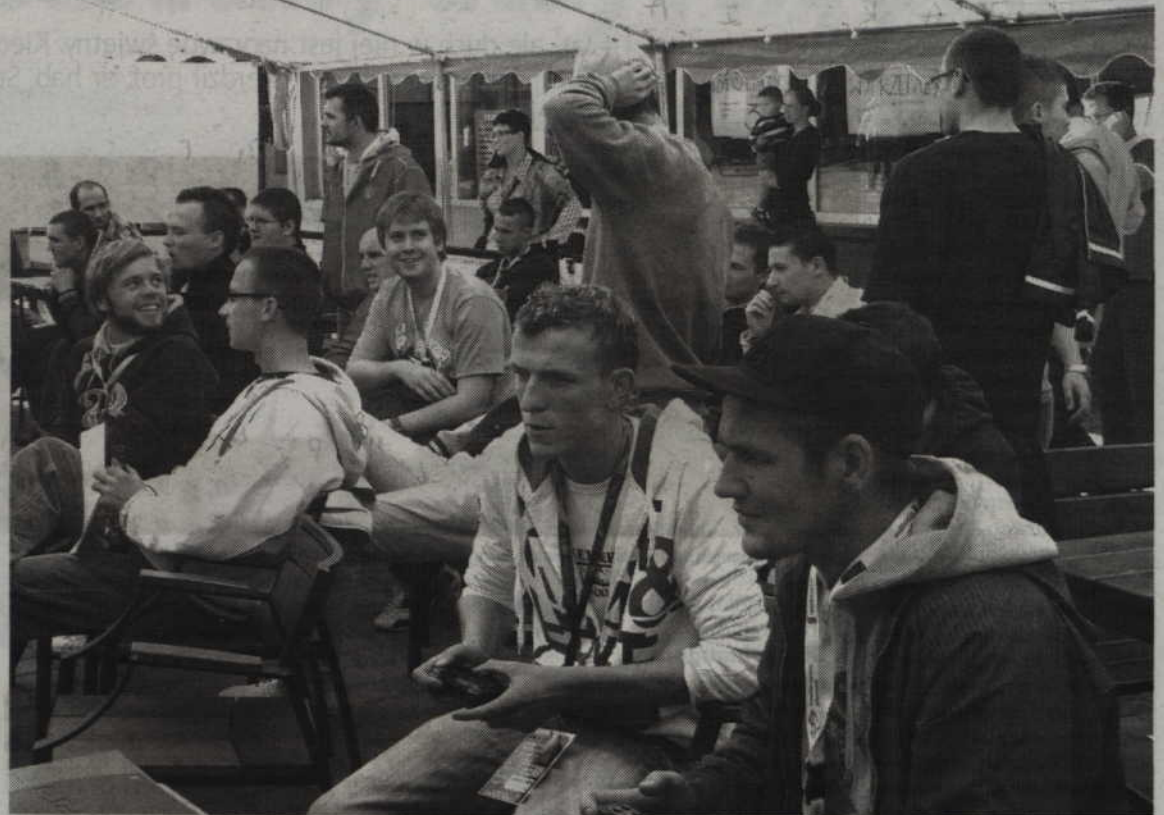
36 zawodników walczyło o główną nagrodę - 1000 zł.