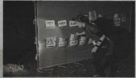
Nocne zawody zorganizowano w Sadlinkach.

- To był najtrudniejszy fragment kwidzyńskich mistrzostw, a to za sprawą terenu i długości poszczegól-