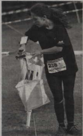
Zawodnicy musieli odnaleźć na trasie punkt zaznaczony na mapie.

rozpoczęto w Sadlinkach, gdzie w pobliżu leśniczówki zlokalizowano start do Mistrzostw Polski w nocnym biegu na orientację. Metę zorganizowano na boisku szkolnym Zespołu Szkół w Sadlinkach, a zawodnicy biegali w bardzo pagórkowatym terenie leśnym na wschód od Sadlinek.