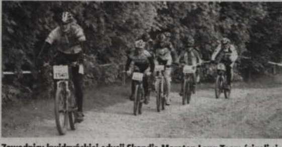
Zawodnicy kwidzińskiej edycji Skandia Maraton Lang Team ścigali się na czterech dystansach.