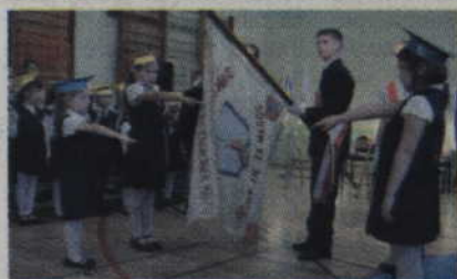
Jeden z ważniejszych momentów w życiu każdego ucznia – ślubowanie na sztandar szkoły.