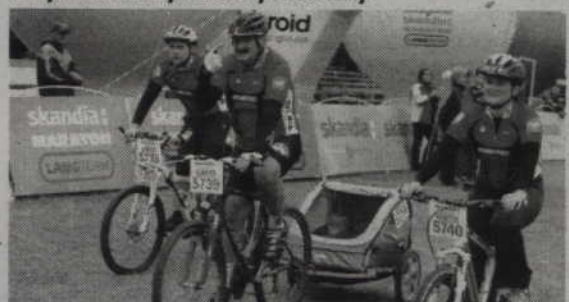
Najmłodsi zawodnicy jechali nawet w specjalnych przycepkach rowerowych.