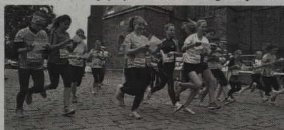
Start widowiskowych Mistrzostw Polski w Sprinterskim Sztafetowym biegu na orientację.