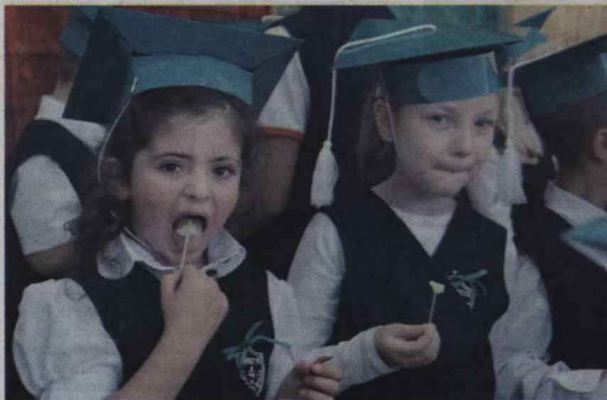
Test na uśmiech – pierwszaki musiały zjeść plaster cytryny.