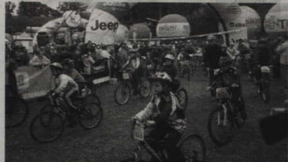
Na dystansie 6 km rywalizowały całe rodziny.