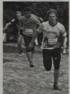
Uczestnicy biegu sztafetowego ścigali się wokół Zamku oraz Placu Jana Pawła II.