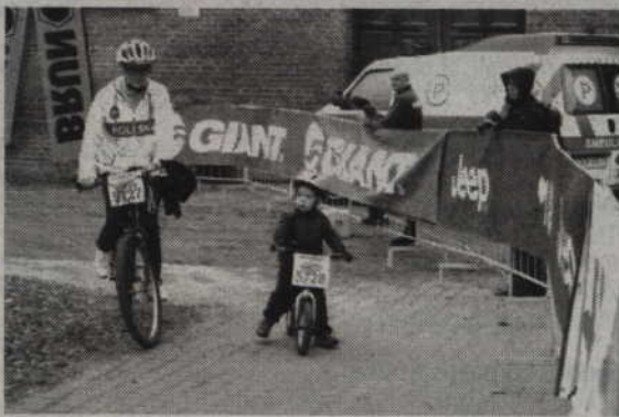
Największy podziw i uznanie wzbudził start młodego zawodnika jadącego rowerem bez pedałów. Okazało się, że odpychając się nogami również można pokonać trasę 6 km.