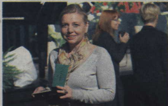
Podczas inauguracji roku akademickiego wręczono indeksy studentom pierwszego roku.