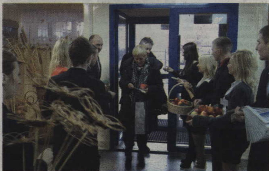
Uczniowie witali gości uroczystości jubileuszowych szkoły.

Po ubiegłorocznych przenosinach jubilatka jednak straciła kontakt ze