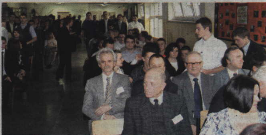
Wśród widzów byli i obecni pracownicy jubilatki, zaproszeni goście oraz uczniowie.