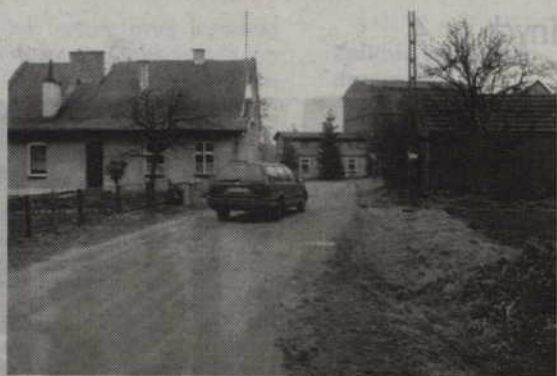
Przebudowa 620 m drogi gminnej wykonanej z tłuczni, gruzu budowlanego na drogę o nawierzchni asfaltowej będzie kosztować ponad 800 tys. zł.

Część inwestycji będzie finansowana z budżetu gminy. Zarezerwowano już na ten cel 574 tysiące złotych. Brakującą kwotę, czyli 246 tys. zł, samorząd chciałby otrzymać z budżetu marszałka. Z