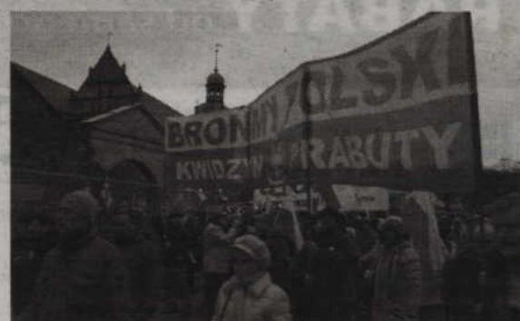
W marszu wzięli także udział mieszkańcy Kwidzyna i Prabut.