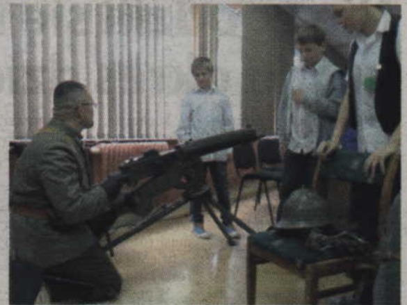
Ułani z 18. Pułku Ułanów Pomorskich spotkali się z uczniami Szkoły Podstawowej nr 6.

opiniom wychowanie w duchu patriotycznych wartości i miłości do ojczyzny nie odeszło do lamusa, a współczesna młodzież i ich rodzice słowa „patriotyzm” nie włożyli bynajmniej między bajki - dodaje nauczycielka. - Choć klimat tworzony w dużej mierze przez media i kulturę popularną dawno już przestał być dla nich sprzyjający, organiza-