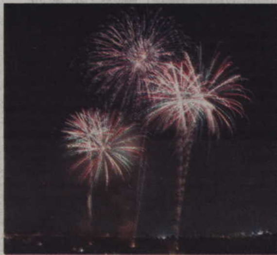
Kolorowe pióropusze fajerwerków cieszą nasze oczy, ale przy tej okazji do atmosfery przedostają się również tony pyłów i niebezpiecznych związków.

Nieprzyjemne dla środowiska jest również to, co zostaje po odpaleniu raey czy petardy, czyli opakowanie. Porzucone byle gdzie, będzie rozkładało się przez wiele lat.