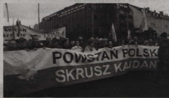
W Gdańsku odbyła się manifestacja pod hasłem "Powstań Polsko".