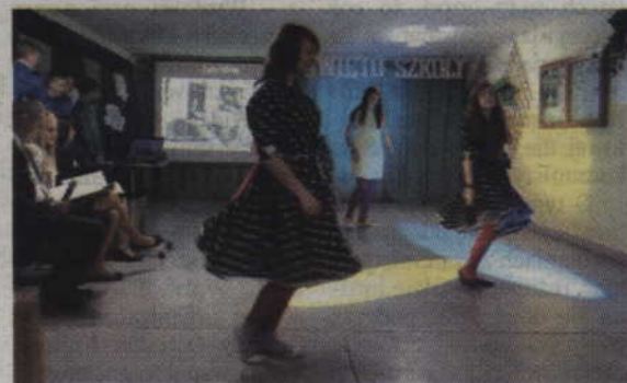
Sukienki w grochy i taniec z lat 50.

W budynku przy ul. Ogrodowej szkoła funkcjonowała przez 40 lat. Obok szkoły wybudowane zostały warsztaty szkolne, które znakomicie uzupełniały ofertę placówki. Teraz ośrodek nauczania teoretycznego i praktycznego zostały rozdzielone.