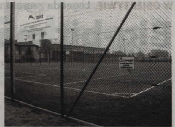
Orlik w Prabutach miał być oddany do użytku pod koniec września. Tymczasem wszystko wskazuje na to, że bardziej realny termin to wiosna przyszłego roku.

- Całe zamieszanie z budową Orlika nas również zaskoczyło. Firma, która wygrała przetarg nie jest przecież nowicjuszem