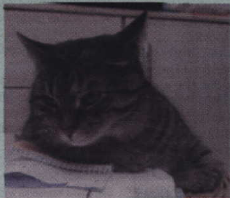
Koty reagują nerwowo, gdy słyszą wybuchające petardy.

Sylwestrowy huk wybuchających petard to prawdziwy koszmarny dla zwierząt. Opiekunowie psów i kotów doskonale wiedzą, o czym mowa. Niektóre czworonogi wpadają w panikę, gdy tylko usłyszą strzelające fajerwerki. To samo dotyczy także dzikich zwierząt – choćby ptaków mieszkających w miastach, które tak naprawdę nie wiedzą co się dzieje. O ile jednak domowego pupila można przygotować do powitania nowego roku, lekarze weterynarii tym najbardziej lękliwym przepisują środki łagodzące stres, o tyle trudno wyobrazić sobie wolno żyjące zwierzaki, które zostają nagle wybudzone ze snu.