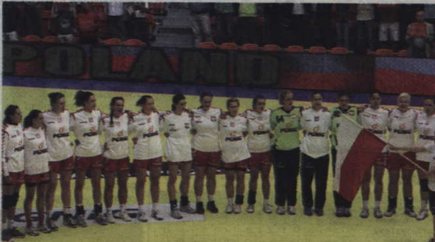
Reprezentacja Polski senierek po raz drugi zagra w kwidzyńskiej hali przy ul. Wiejskiej.

Pocztach spotkaniach Polska prowadzi w swojej