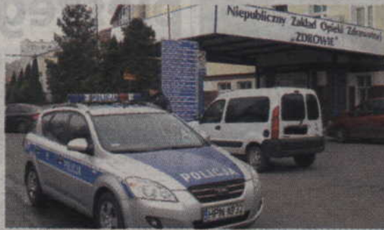
Scenariusz ćwiczeń zakładał ewakuację pacjentów kwidzyńskiego szpitala.

niczka policji w Kwidzynie. Podczas trwania działań funkcjonariusze kwidzyńskiej komendy zorganizowali płynny dojazd służbom ratowniczym i medycznym, udrażniali drogi ewakuacyjne. Zabezpieczali również teren budynku, w którym trwała akcja ratowniczo-gaśnicza, nie dopuszczając tam osób postronnych. - Policjanci wraz ze strażakami, sanitariuszami i ratowniczy