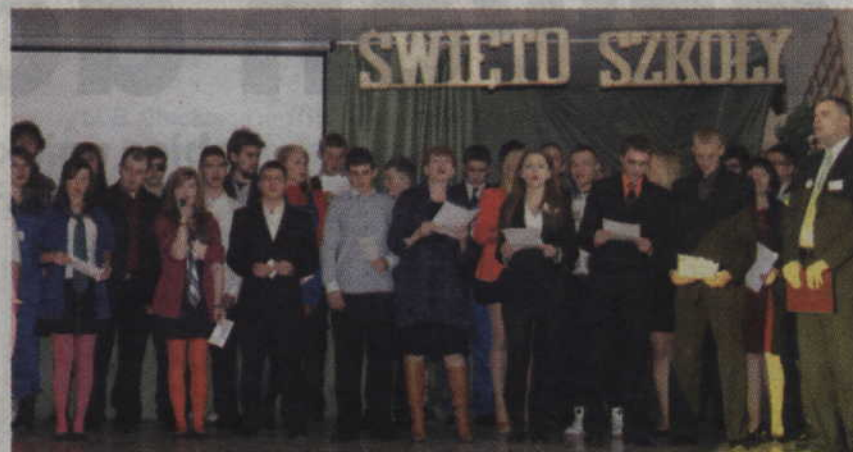
Na finał wszyscy uczestnicy uroczystego apelu odśpiewali piosenkę zespołu Myslovitz.

Decydując się na uruchomienie naboru na dany kierunek szkoła korzysta z badań rynku pracy wykonywanych przez kwidzyński Urząd Pracy. Wpływ na to mają również rozmowy z pracodawcami oraz ucznia-