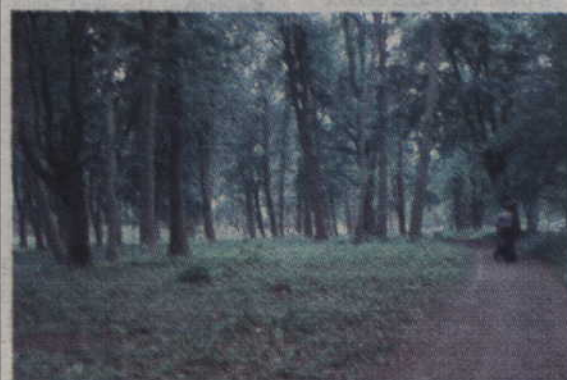
Wypalasz paczkę dziennie? Mniej więcej co dwa tygodnie z powodu twojego nałogu wycinane jest jedno drzewo.

ZAPAMIĘTAJ. Papierosy są prawdziwą fabryką trucizn. W dymie można zidentyfikować aż 4 tys. toksycznych związków chemicznych, więc rzucenie palenia to ulga nie tylko dla płuc i otoczenia palacza, ale i dla jego portfela. A przede wszystkim – dla środowiska.