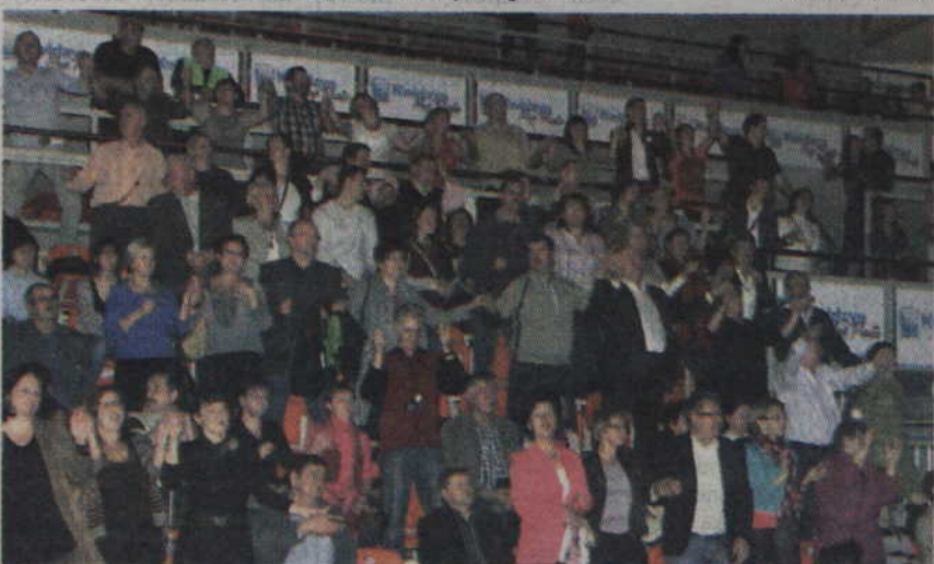
Publiczność znakomicie bawiła się na widowni.