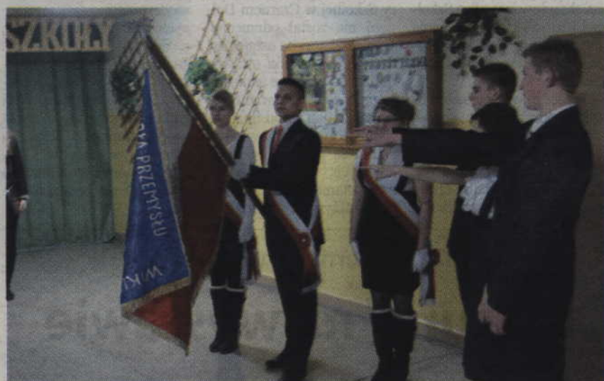
Ślubowanie przedstawicieli klas pierwszych.