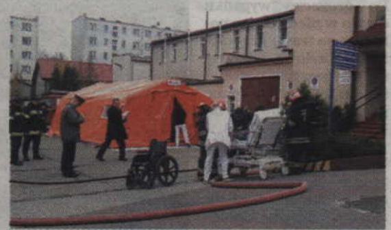
Ćwiczenia przebiegały sprawnie - ich celem było doskonalenie gotowości służb ratowniczych do działań w sytuacji zagrożenia.

gotowanej symulacji akcji ratunkowej, zaangażowanie każdego z uczestników działań było duże. Scenariusz ćwiczeń nie dopuszczał pomyłek. Realia szkolenia zostały tak dobrane, by odwzorować sy-