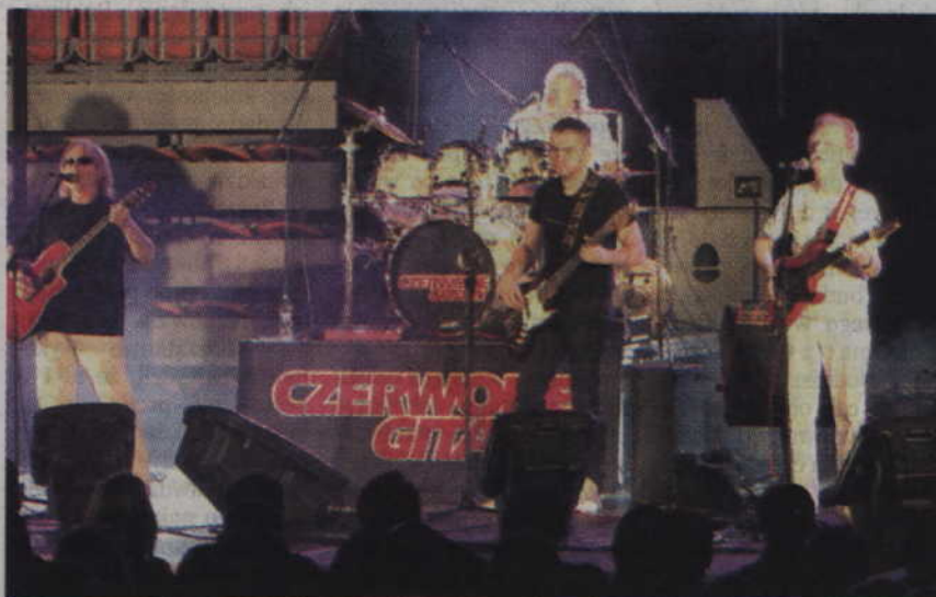
„Czerwone Gitary” grają na scenie od 1965 roku.

także utworów z ostatniej płyty zespołu zatytułowanej „OK”. Koncert legendarnej grupy był również testem dla kwidzyńskiej hali, w której to po raz pierwszy zorganizowano takie wydarzenie. Trzeba przyznać, że hala w nowej roli sprawdziła się znakomicie i miejmy nadzieję, że będzie to stałe miejsce koncertowych wydarzeń w Kwidzynie. (fox)