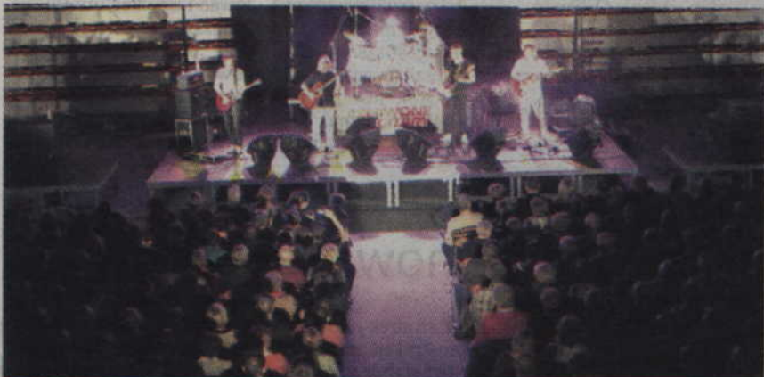
Występ legendarnej grupy był pierwszym koncertem zorganizowanym w kwidzyńskiej hali przy ul. Wiejskiej.