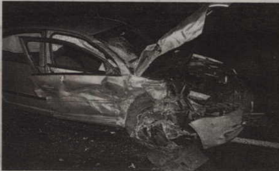
Na trasie Licze-Prabuty zderzyły się czołowo dwa auta. Dwie osoby trafiły do szpitala.

- Ze wstępnych ustaleń funkcjonariuszy wynika, że 20-letni kierowca passata, jadąc od strony Prabuty, zachował należytej ostrożności, rozpoczął manewr wyprzedzania, zjechał na pas ruchu przeciwnego i zderzył się czołowo z nadjeżdżającą z naprzeciwka skodą, którą kierował 31-letni mieszkaniec Kwidzyna - relacjonuje Bożena Schab, rzeczniczka prasowa Komendy Powiatowej Policji w Kwidzynie.