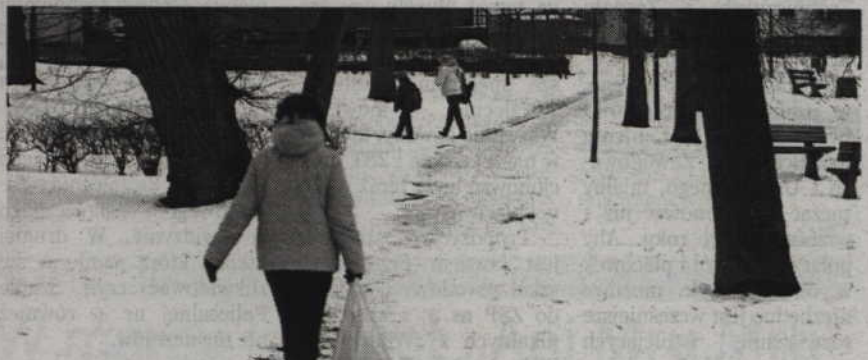
Mieszkańcy korzystający z parku przy Szkole Podstawowej nr 5 skarżą się, że właściciele psów nie sprzątaj po swoich pupilach.