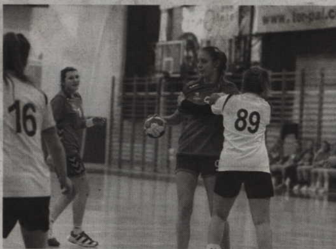
Juniorki MTS Kwidzyn pojedą na finał Mistrzostw Polski do Szczecina.