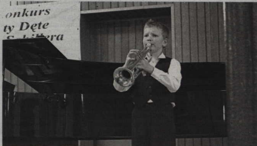
W piątek w kwidzyńskiej szkole muzycznej rozpoczną się dwudniowe warsztaty instrumentów dętych blaszanych.

- Takie warsztaty odbywają się u nas już po raz drugi, w dużej mierze dofinansowane są przez Centrum Edukacji Artystycznej w Warszawie. Biorą w nich udział przede wszystkim młodzi adepci sztuki instrumentalnej, którzy szkolą się w grze właśnie na instrumentach dętych – dodaje Jarosław Golder. - Oczywiście do