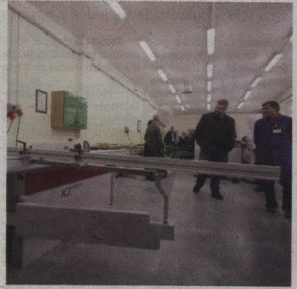
Planowane Centrum Kształcenia Zawodowego i Ustawicznego wchłonie m.in. obecne Centrum Kształcenia Praktycznego funkcjonujące w ramach Zespołu Szkół Ponadgimnazjalnych nr 4.

-Po spotkaniu z pracownikami ZST i ZSP nr 4 na temat zapowiadanych