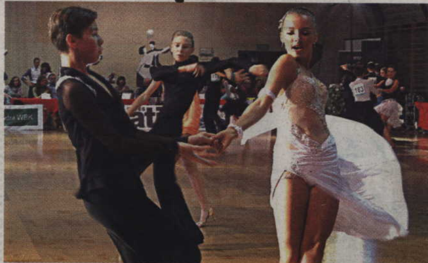
9 i 10 marca w Kwidzynie odbędą się Mistrzostwa Polski w dziesięciu tańcach.

Ponad 300 tancerzy weźmie udział w Mistrzostwach Polski w dziesięciu tańcach, które odbędą się w Kwidzynie. Na parkiet wyjdzie ok. 160 par, w sześciu kategoriach wiekowych. W wielkim, tanecznym święcie będzie można uczestniczyć 9 i 10 marca w hali widowiskowo-sportowej przy ul. Wiejskiej.