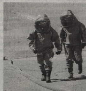
Normy stężenia dwutlenku węgla w powietrzu na hali produkcyjnej zostały przekroczone dziesięciokrotnie.