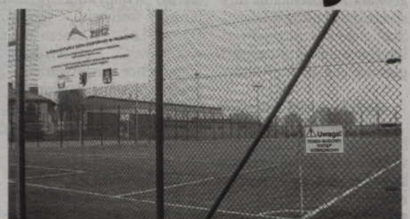
Orlik w Prabutach do użytku oddany zostanie prawdopodobnie dopiero w maju.

- Firma Panorama 2 wystawiła faktury na łączną sumę 799 tys. złotych - informuje burmistrz Bogdan Pawłowski. - W to wchodziły również środki należne podwykonawcom. Wszystkie należności za wykonaną część inwestycji, w tym faktury wystawione przez podwykonawców zostały uregulowane. W budżecie miasta na dokończenie inwestycji