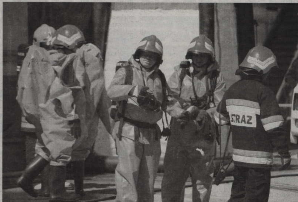
W związku z zatruciem tlenkiem węgla ewakuowano wszystkich pracowników "Warmińskich".

Oprócz pracowników hali ewakuowano także wszystkie