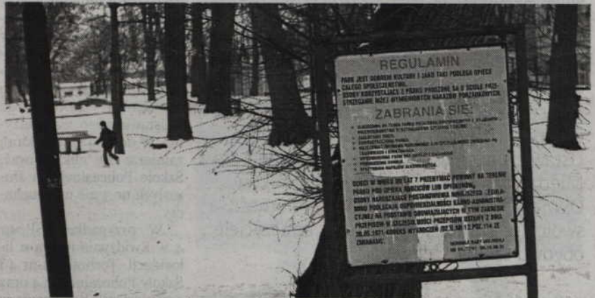
Zasady korzystania z parku są jasno sprecyzowane w regulaminie. Właściciele czworonogów on także obowiązują.

Czekamy na Wasze komentarze: kurier.kwidzynski@wpomorskie.pl