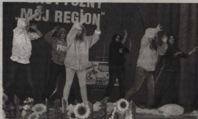
Występ zespołu tanecznego „Tęcza”.