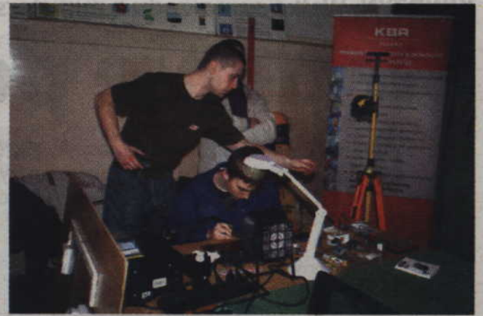
Szkoły prowadzące kształcenie zawodowe wzięły udział powiatowych targach edukacyjnych zorganizowanych w Zespole Szkół Ponadgimnazjalnych nr 1 w Kwidzynie.