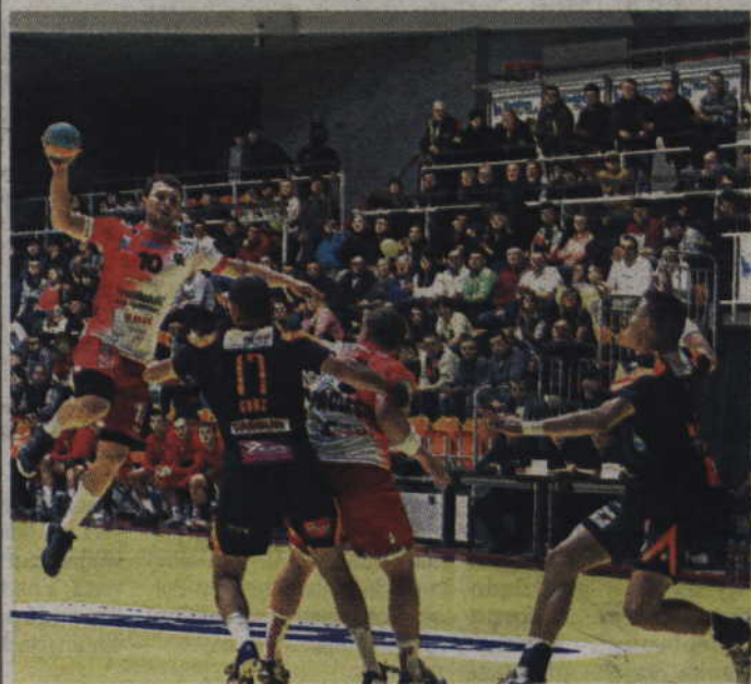
MMTS Kwidzyn w tym sezonie już dwukrotnie pokonał drużynę mieleckiej Stali.