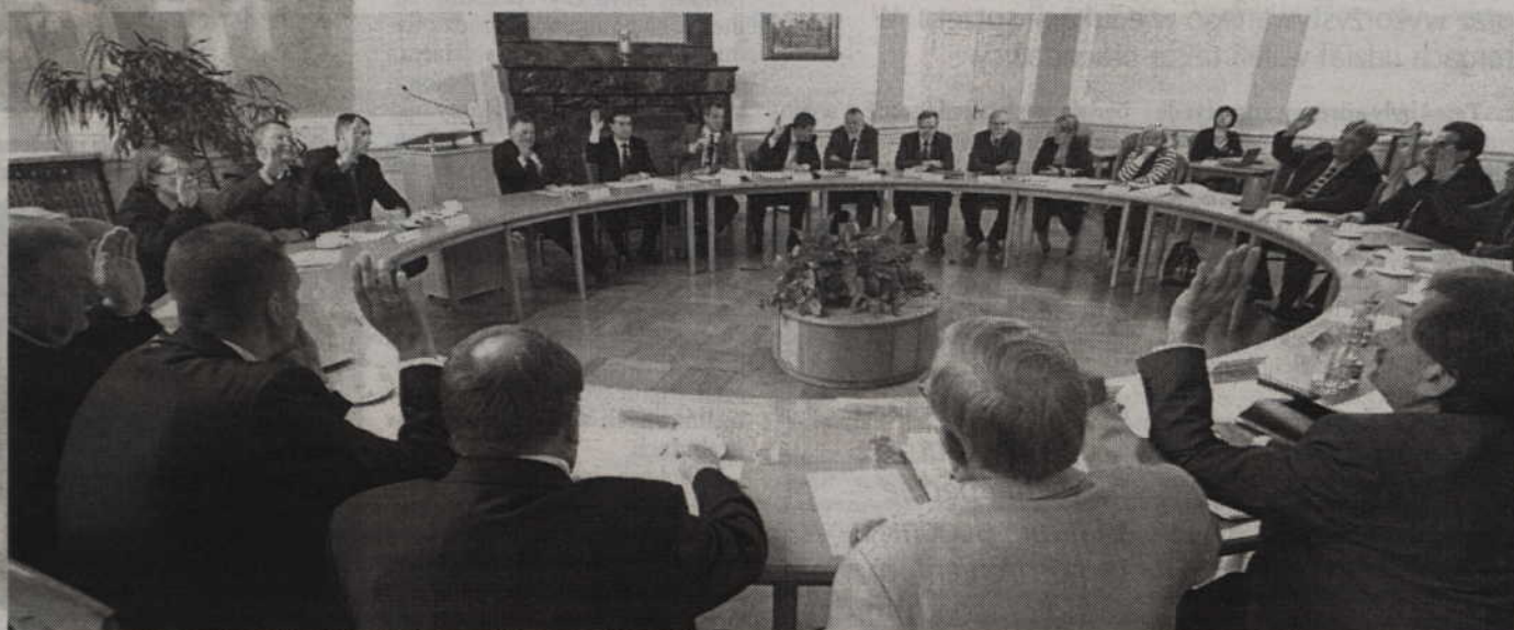
Przy czterech głosach wstrzymujących Rada Miasta przyjęła poprawki do budżetu na rok 2013.

- Rozliczona inwestycja, w świetle obowiązujących przepisów dotyczących rozliczenia dotacji przyznanych z pieniędzy europejskich, nie przewiduje takiej sytu-