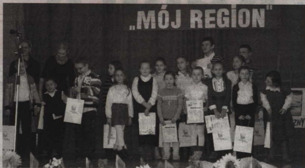
Najmłodszy laureaci oraz wyróżnieni w kategorii rysunku.