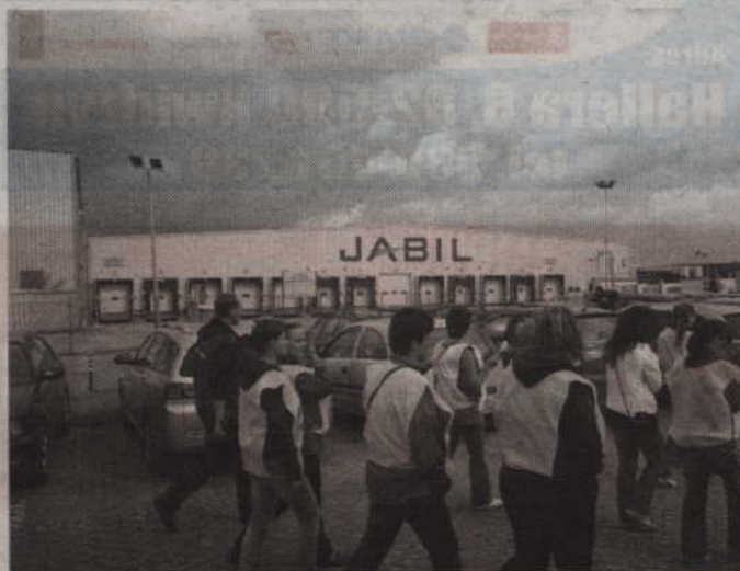
Jeszcze do końca ubiegłego roku kwidzyński Jabil grupowo zwalniał pracowników.

- Rzeczywiście, otrzymałam telefon z propozycją powrotu pracy do Jabila. Niestety, zaoferowano mi pracę tylko na trzy najbliższe miesiące. Gdybym nie miała rodziny, mogłabym się na to zdecydować, ale jak człowiek ma zobowiązania, to praca na miesiąc czy na dwa nie rozwiązuje jego problemów - powiedziała nam nasza Czytelniczka. (r)