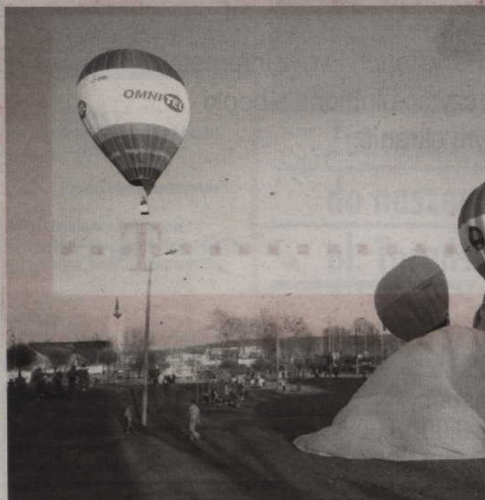
W piątek nad Kwidzynem latać będą balony.