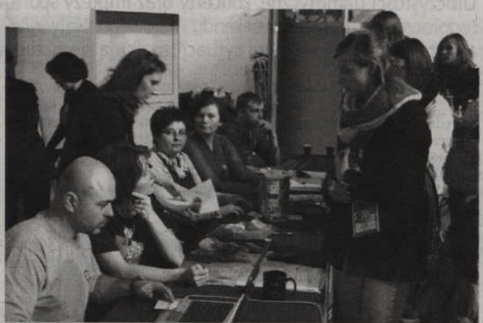
Podczas tegorocznej zbiórki wolontariusze zebrali do puszek 47 476,69 zł. Na zdjęciu nauczyciele SP 2 podczas liczenia zbieranych pieniędzy.

W tegorocznym finale WOŚP w powiecie kwidzyńskim uczestniczyło 418 wolontariuszy, 35 tzw.