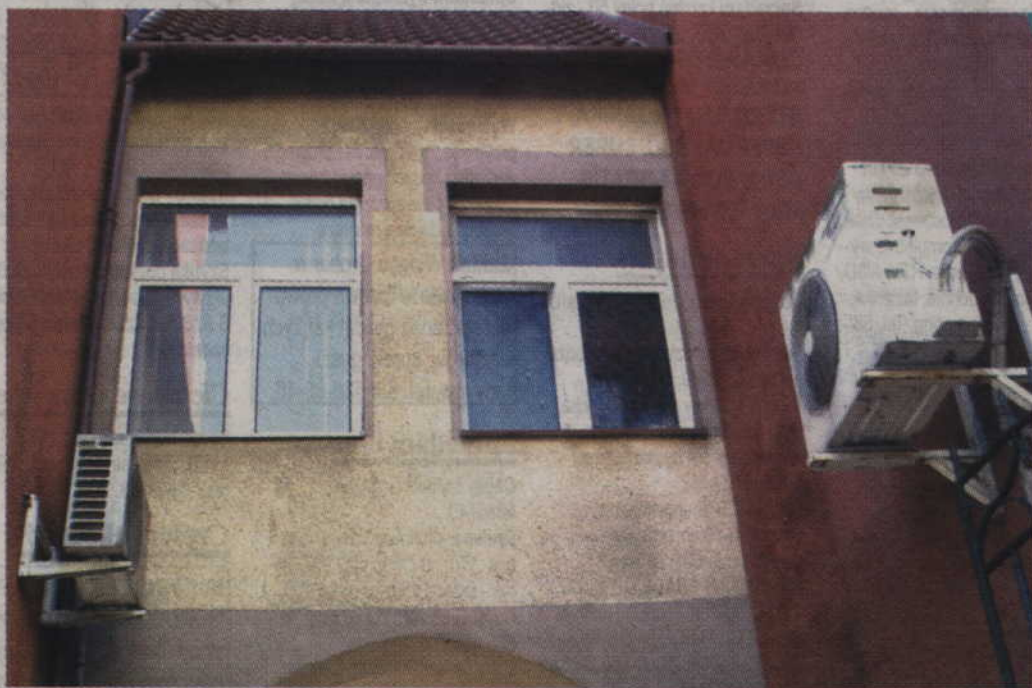
Jeśli korzystamy z klimatyzatora, wszystko ma wpływ na wysokość rachunków. Nawet to, na której ścianie powiesimy zewnętrzną część urządzenia.

Wraz z postępem technologicznym, zaczęto przyglądać się wszystkim urządzeniom, także klimatyzatorom. Nie pozostają one jednak neutralne dla natury. Po pierwsze dlatego, że stosowane w nich czynniki chłodnicze mają bezpośredni wpływ na warstwę ozonową. Fachowcy podkreślają, że obecnie powinny być stosowane czynniki R407C lub R410A. Warto pamiętać, że używanie freonu R22 jest zabronione ze względu na jego dużą szkodliwość. Od dawna nie powinno ich już być w sklepach, ale jeśli zdecydujemy się na zakup, lepiej dobrze czytać etykiety, zwłaszcza w przypadku chińskich produktów. Lepiej więc kupować markowy sprzęt, ze