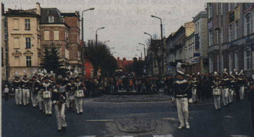
Świętowanie rozpoczęło paradą, która w ubiegły wtorek przeszła ulicami Kwidzyna.