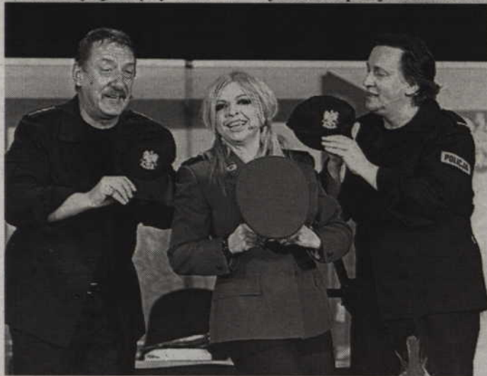
"Zwariowany komisariat" opowiada o kilku dniach z życia policjantów z małego komisariatu.

Bilety w cenie 70 zł do nabycia w kasie Kwidzyńskiego Centrum Kultury. (red.)