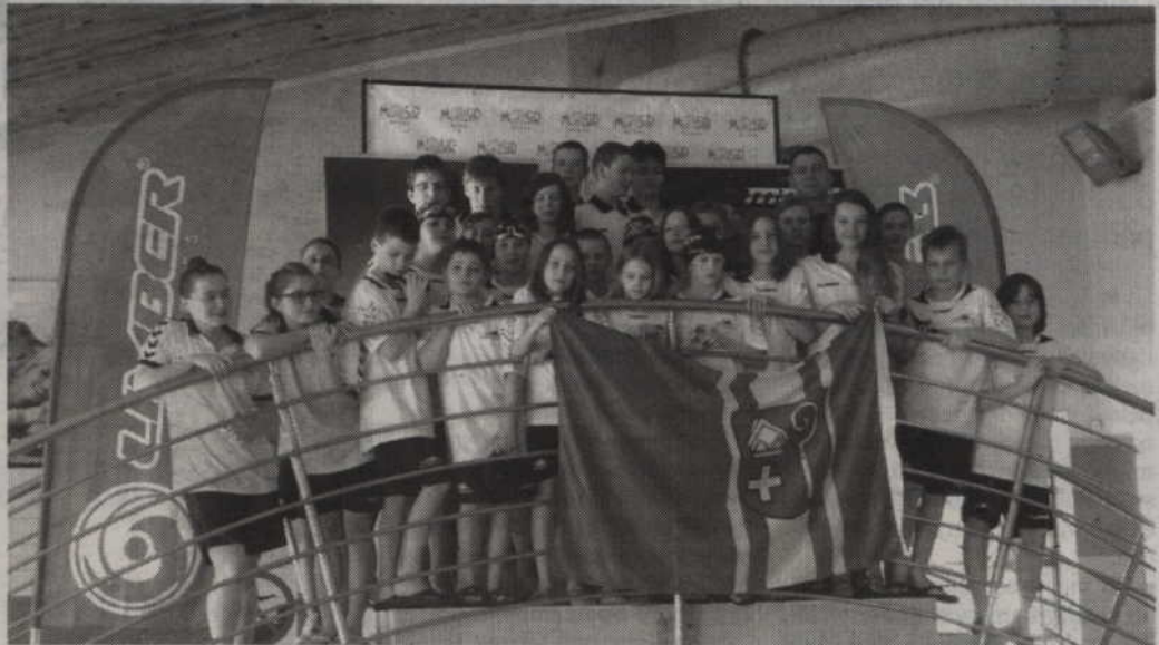
Wspólne zdjęcie zawodników MTS Kwidzyn podczas zawodów w Mławie.