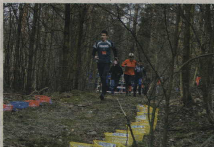
Mistrzostwa Województwa Pomorskiego odbyły się w lasach Miłosnej.

Początek sezonu jest dla UMKS Kwidzyn wyjątkowo udany. W Grudniu kwidzianom udało się