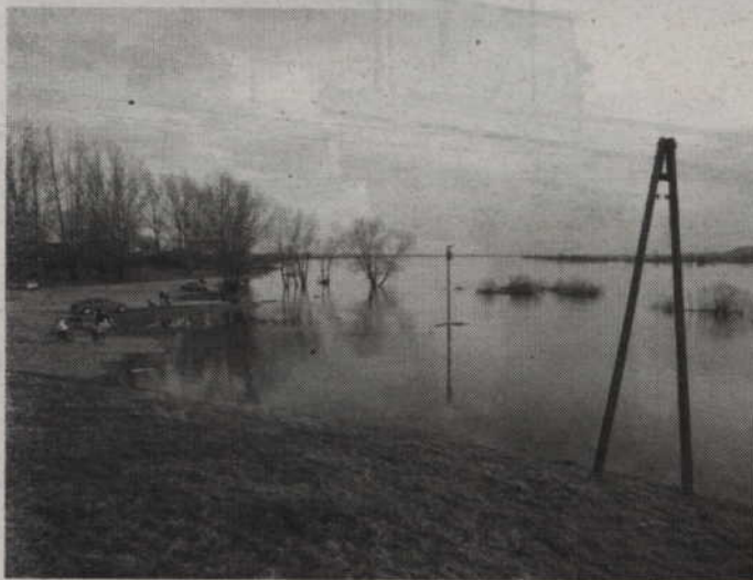
Taki był stan Wisły tydzień temu, 17 kwietnia....