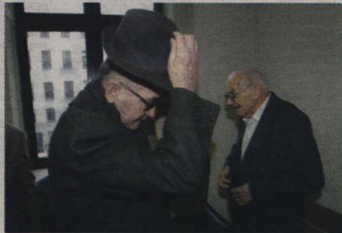
Wojciech Jaruzelski i Stanisław Kociołek - dygnitarze PRL - uniknęli kary za zamordowanie robotników na Wybrzeżu w Grudniu 1970 r.