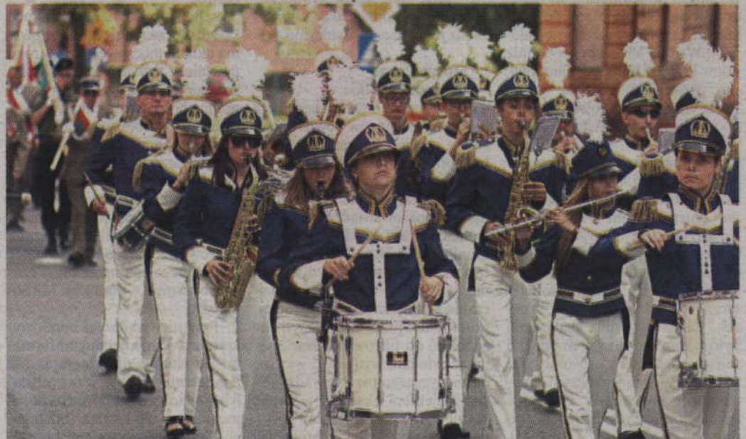
Kwidzyńskim i gardejskim uroczystościom towarzyszyć będzie Orkiestra Dęta „Helikon”. W tej drugiej miejscowości muzycy dadzą również pokaz musztry parady.