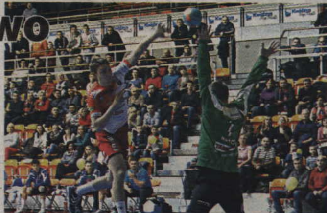
Mecz MMTS Kwidzyn - TAURON Stal Mielec odbędzie się w hali przy ul. Wiejskiej.