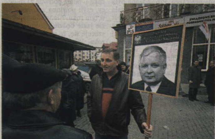
Niezwykłą wystawę poświęconą Lechowi Kaczyńskiemu będzie można oglądać od poniedziałku, 29 kwietnia, na kwidzyńskim deptaku.

Już w najbliższy poniedziałek, 29 kwietnia, o godz. 13 na deptaku przy ul. Tęczowej otwarta zostanie wystawa „Lech Kaczyński w służbie Najjaśniejszej Rzeczypospolitej”. Wystawę uroczysto otworzy poseł Maciej Łopiński, a mieszkańcy będą mogli ją oglądać przez około 2 tygodnie.