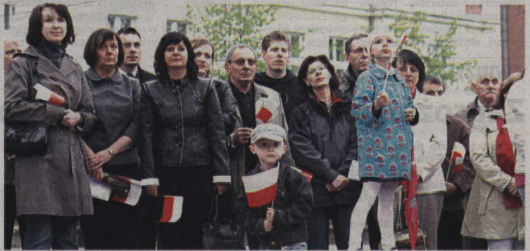
Uroczystości w Kwidzynie, Prabutach i Gardeli będą miały również patriotyczny wydźwięk.