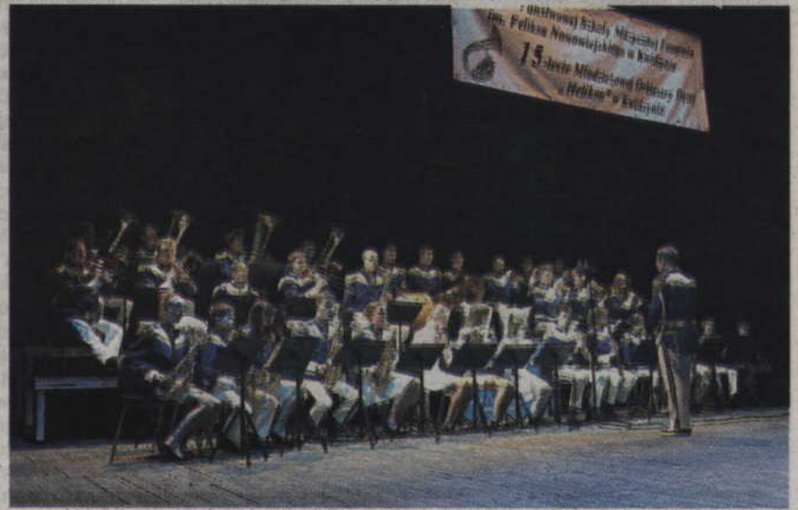
Na scenie zaprezentowała się także Młodzieżowa Orkiestra Dęta „Helikon”, która świętowała 15-lecie istnienia.