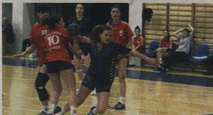
Zawodniczki MTS Kwidzyn odniosły komplet zwycięstw w turnieju ćwierćfinałowym.

Juniorki MTS Kwidzyn awansowały do półfinałów Mistrzostw Polski juniorek młodszych. W turnieju ćwierćfinałowym zorganizowanym w Kwidzynie gospodynie nie dały żadnych szans rywalkom i wygrały wszystkie swoje mecze. Drugim zespołem który awansował do kolejnej fazy rozgrywek jest sklasyfikowany na drugiej pozycji GUKS Dwójka Łomża.