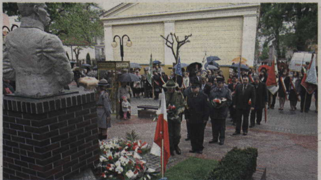
Zarówno 1, jak i 3 maja delegacje złożą kwiaty pod kwidzyńskim pomnikiem Marszałka Józefa Piłsudskiego.

Kolejne wydarzenia odbędą się w piątek, w 222. rocznicę