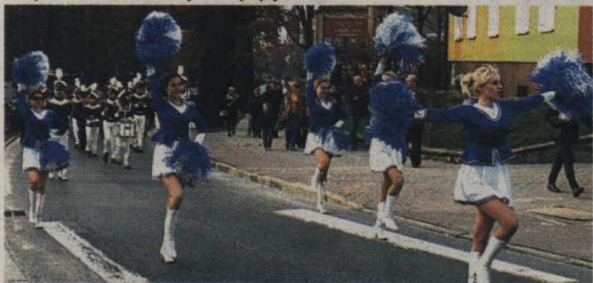
Orkiestra "Helikon" tradycyjnie maszerowała w asyście mazurek.