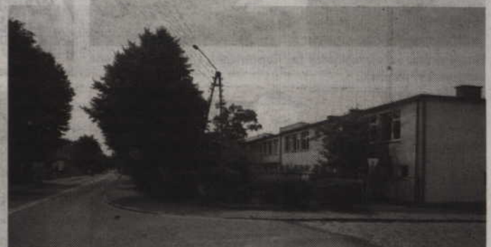
Chęć przyłączenia do sieci gazowej wyraziły 103 osoby z gminy Ryjewo. Jedną z zainteresowanych instytucji jest również ryjewska szkoła.

Obecnie na terenie gminy nie ma gazu. Jeśli Ryjewo miało być podłączone do rurociągu, to musiałby on zostać pociągnięty z miejscowości Gurcz (gm.