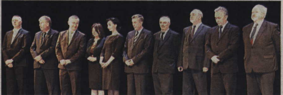
Oto osoby, które od lat wspierają i współpracują z kwizyńską szkołą muzyczną. Z okazji jubileuszu wręczono im statuetki okolicznościowe.