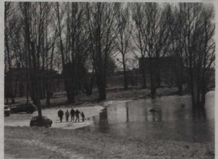
...a w niedzielę woda zabrała już niemal całe betonowe nadbrzeże.

Przypomnijmy, że stan ostrzegawczy jest ogłaszany gdy wodowskaz w Korzeniewie wskaże 610 cm. Stan alarmowy ogłasza się, gdy poziom wody w Wiśle przekroczy 700 cm. Żeby woda sięgała