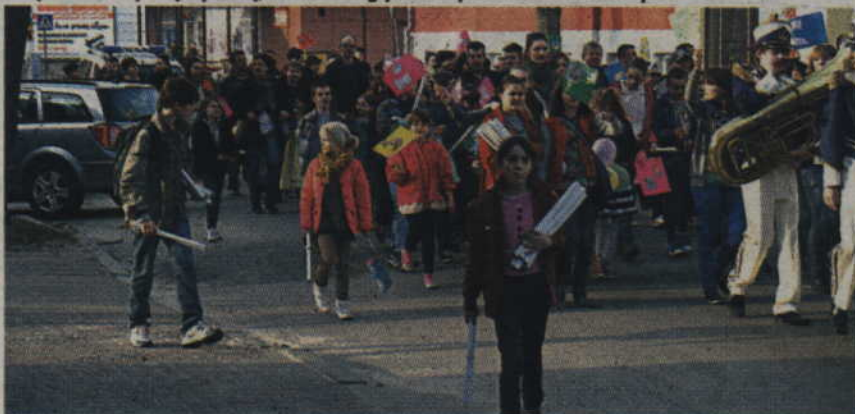
W paradzie wzięli udział uczniowie, nauczyciele i sympatycy kwidzińskiej szkoły muzycznej.