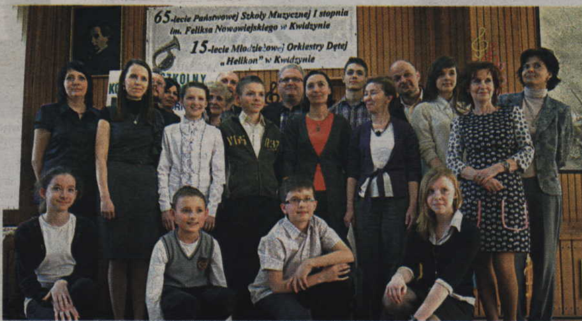
Wspólne zdjęcie uczestników i gości Międzyszkolnego Konkursu im. Korneliusza Ejsmonta.