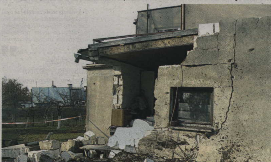
Tak wyglądał garaż po tym jak uderzył w niego samochód.

Okoliczności wypadku badała kwidzyńska Prokuratura Rejonowa.