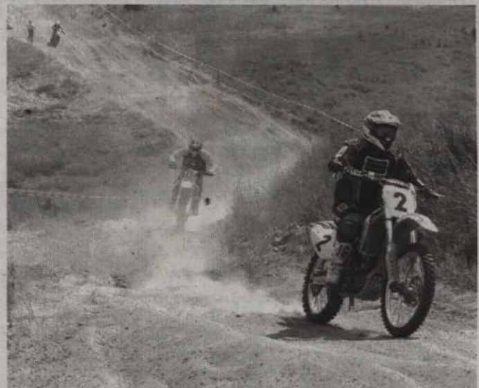
Pierwsze w tym sezonie zawody cross country odbędą się na torze w Bądkach.

Sobota, 27 kwietnia 10.30 - 12.00 wyścig quadów 12.45 - 14.45 wyścig motocykli - Mistrzostwa Polski 15.30 - 17.00 wyścig motocykli - Puchar Polski Niedziela, 28 kwietnia 10.00 - 11.30 wyścig klas quadów 12.00 - 13.30 wyścig motocykli - Mistrzostwa Polski 14.00 - 15.30 wyścig motocykli Puchar 16.30 Zakończenie zawodów