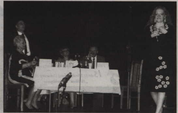
„Zjazd Absolwentów” w wykonaniu Grupy Teatralnej Jerzego Majdy można było zobaczyć na scenie gardejskiego ośrodka kultury.

- Staralem się zagrać tak samo jak podczas innych przedstawień chociaż zdawałem sobie sprawę, że występuję przed sąsiadami i znajomymi. Tremy nie miałem ale gdzieś tam z tyłu głowy świeża mi myśl aby wypaść jak najlepiej. Granie przed kameralną publicznością, to kolejne pozytywne doświadczenie. Cieszymy się, że publiczność żywo