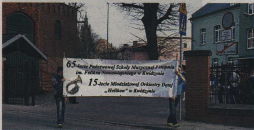
Kwidzińska szkoła muzyczna obchodziła w ubiegłym tygodniu podwójny jubileusz: 65-lecie działalności szkoły oraz 15-lecie Młodzieżowej Orkiestry Dętej "Helikon".