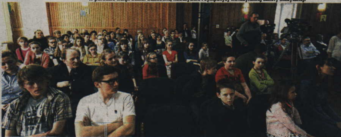
Spotkanie i recital Jana Nowowiejskiego odbyły się w auli szkoły muzycznej.