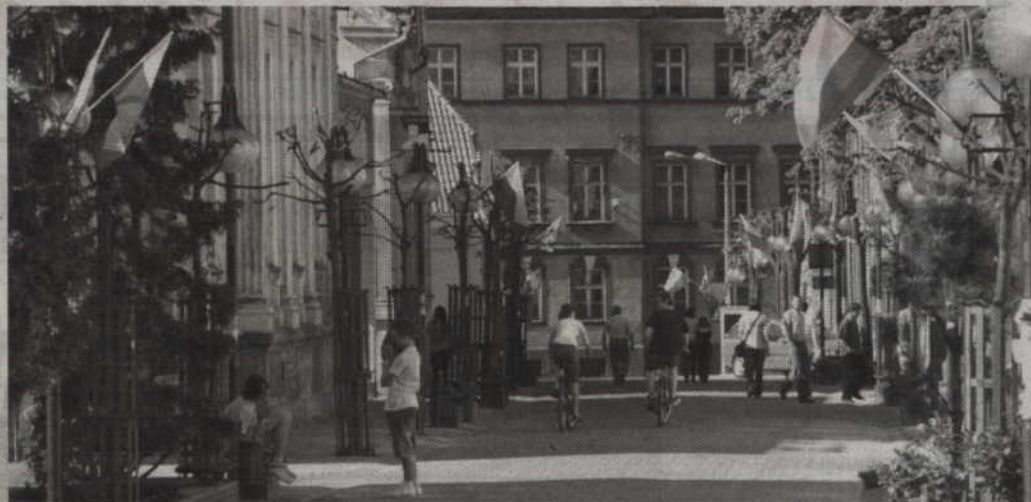
Święto flagi obchodzone jest w Polsce od 2004 roku.