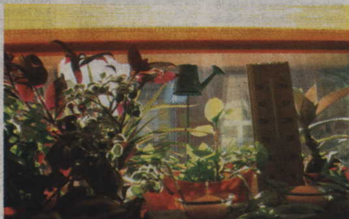
Pamiętaj, by latem opuszczać rolety. Termometry nie będą wariować, bo promienie słońca nie dostaną się do środka i podgrzeją powietrze w pokoju.

Dom powinien być w jasnych kolorach. Biała farba odbija światło i budynek się tak szybko nie nagrzewa. Sporo ciepła pochłania też dach. Warto przyrzec się, czy jest odpowiednio zaizolowany. To będzie działać nie tylko latem, ale również zimą, bo ocieplina, choćby wełna mineralna, wpłynie pozytywnie również na koszty ogrzewania domu zimą.