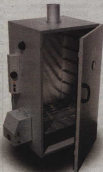
Wędzarnia UW-150 ponad 20kg wsadu