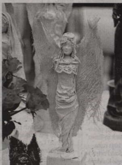
Jedna z perełek, którą znaleźliśmy na tegorocznych targach.