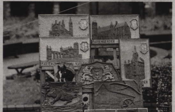
Jedną z ofert były ciekawe kwidzyńskie płaskorzeźby.