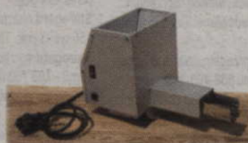
Generator Dymu GD-01 do 200L pojemności komory