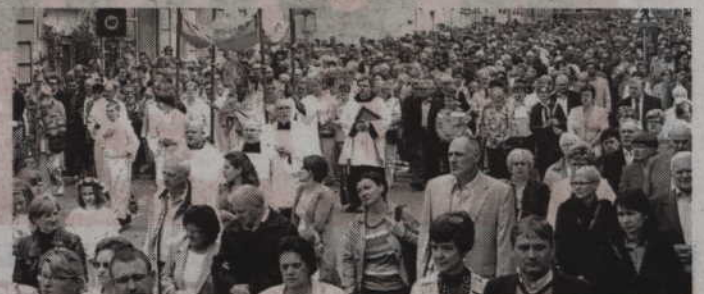
Jak co roku wierni parafii pw. Św. Jana Ewangelisty oraz parafii pw. Św. Trójcy przejdą ulicami miasta we wspólnej procesji.

Inicjatorką ustanowienia tego święta była św. Julianna z Cornillon (1193-1258). Kiedy była przeoryszą klasztoru augustianek w Mont Cornillon w pobliżu Liege, w roku 1245 została zaszczycona objawieniami, w których Chrystus żądał ustanowienia osobnego święta ku czci Najświętszej Eucharystii. Pan Jezus wyznaczył sobie nawet dzień uroczystości Bożego