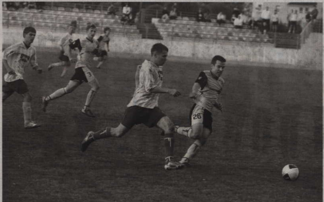
W meczu z Bytovią II kwidzynianie stracili punkty dopiero w ostatnich minutach spotkania.

Niestety gdy wydawało się, że mecz zakończy się bezbramkowym remisem, w 80 minucie defensywa Rodła popełniła błąd i