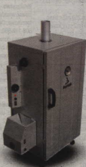
Wędzarnia UW-70 do 10kg wsadu