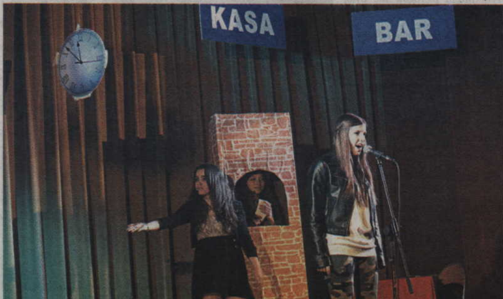
Ciekawe rzeczy działy się również za plecami występujących.