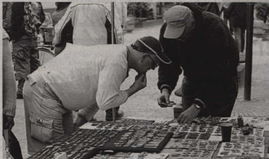
Drobnym rzeczom zawsze warto przyjrzeć się z bliska.