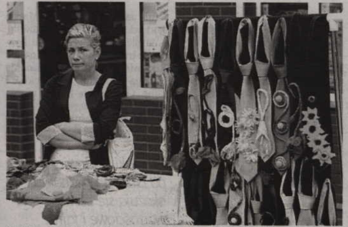
Na jednym ze stoisk kupić można było m.in. efektownie zdobione krawaty.