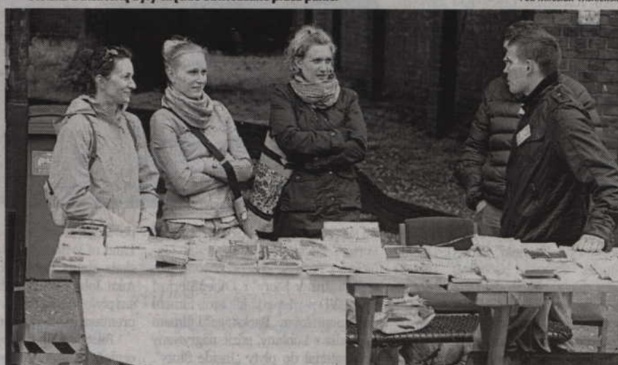
Swoje stoisko na targach miała Gminna Biblioteka Publiczna z Ryjewa, która oferowała książki za złotówkę.