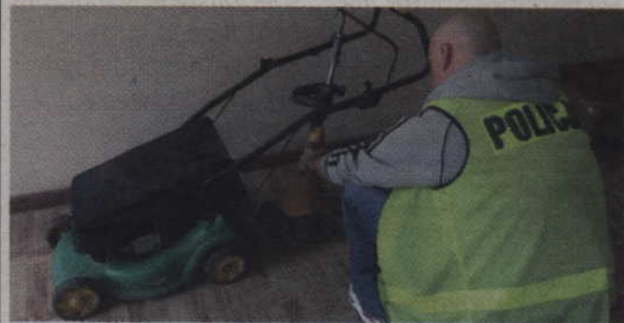
Policjantom udało się odzyskać skradzione kosiarki.

Zarzut kradzieży z włamaniem usłyszało dwóch młodych mieszkańców gminy Kwidzyn, którzy włamali się do pomieszczenia gospodarczego w Rakowcu. Mężczyźni ukradli cztery kosiarki spalinowe warte około 1 tys. złotych. Teraz 19- i 21-latkowi grozi nawet do 10 lat więzienia.