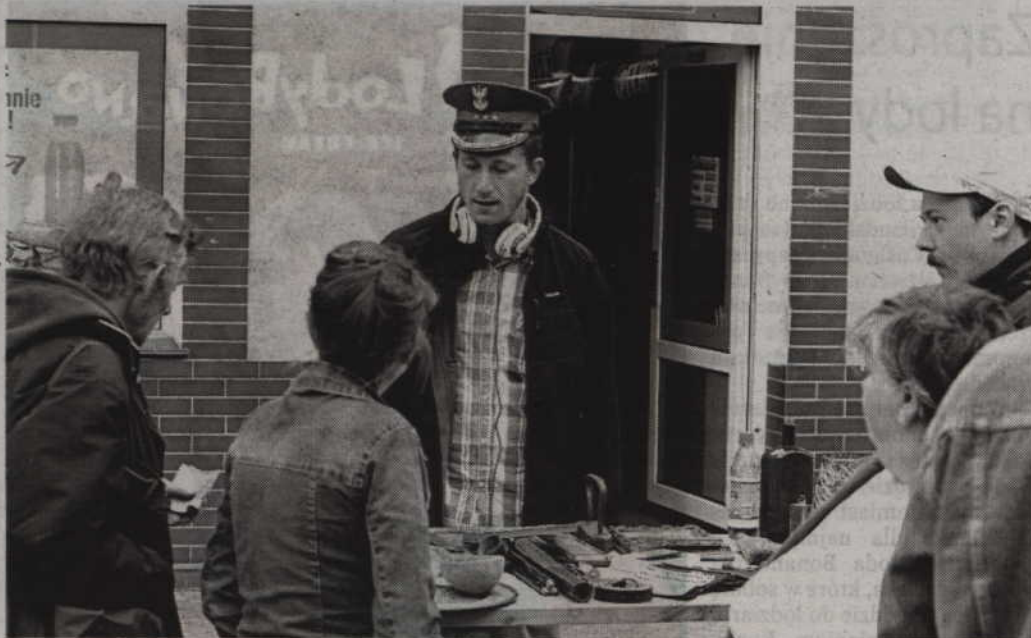
Wśród sprzedających pojawił się również nietypowy porucznik.