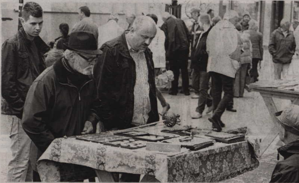
Targi Staroci odbyły się w Kwidzynie już po raz czternasty.

Pomimo nienajlepszej pogody kwidzyński deptak ponownie wypełnił się stoiskami kolekcjonerów, handlarzy oraz twórców. Wszystko za sprawą Targów Staroci, które zorganizowane zostały w Kwidzynie już po raz czternasty. Atrakcją imprezy był bez wątpienia koncert estońskiego zespołu „Rondo”, grającego muzykę dawną.