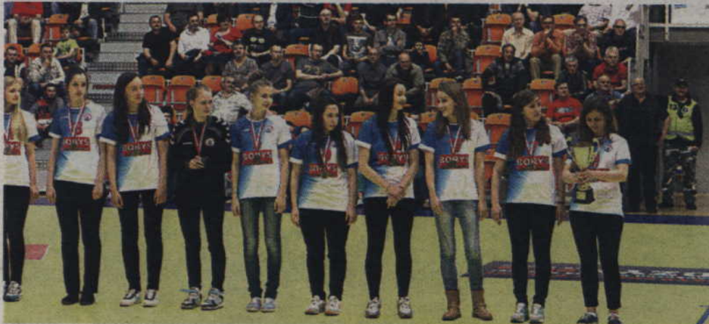
Juniorki młodsze MTS Kwidzyn zostały najlepszą drużyną w Polsce.

Zawodniczki MTS Kwidzyn zostały Mistrzami Polski w piłce ręcznej junierek młodszych. Kwidzynianki w finałowym spotkaniu zwyciężyły niepokonaną Varsovię Warszawa 20:19 i stanęły na najwyższym stopniu podium. Brąz trafił do zawodniczek Jutrzenki Płock, które w meczu o brąz ograły Sośnicę Gliwice 32:25.