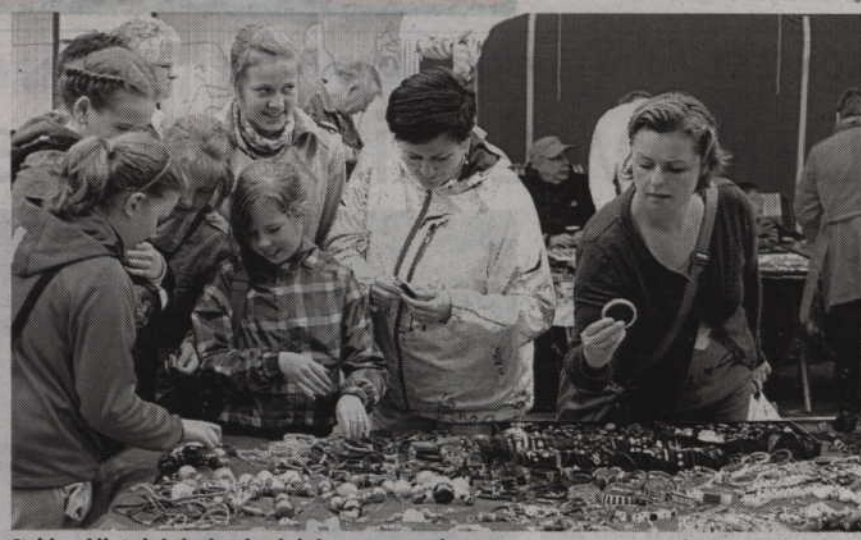
Stoiska z biżuterią były chętnie odwiedzane przez panie.