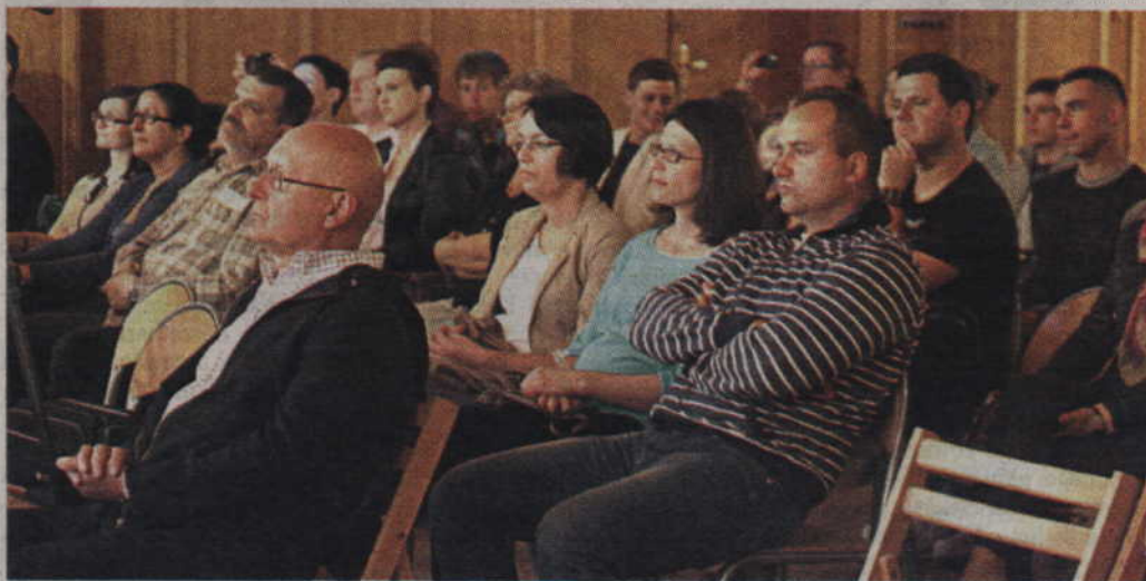
Zasłuchana publiczność podczas koncertu w auli I LO.