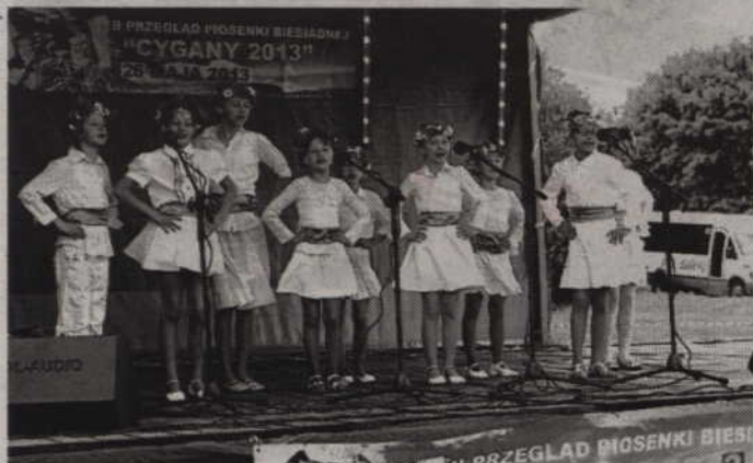
II Przegląd Piosenki Biesiadnej w Cyganach rozpoczął się od występu miejscowego zespołu Nutki.

Na kilka godzin w minioną niedzielę niewielka miejscowość w gminie Gardeja, czyli Cygany, stała się stolicą piosenki biesiadnej. Kilkanaście zespołów oraz solistów z różnych części Polski prezentowało swoje biesiadne repertuary.