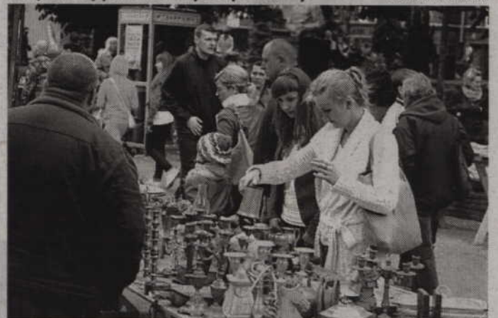
Kufle, kubki, świeczniki, lampy - każdy mógł znaleźć dla siebie coś ciekawego.