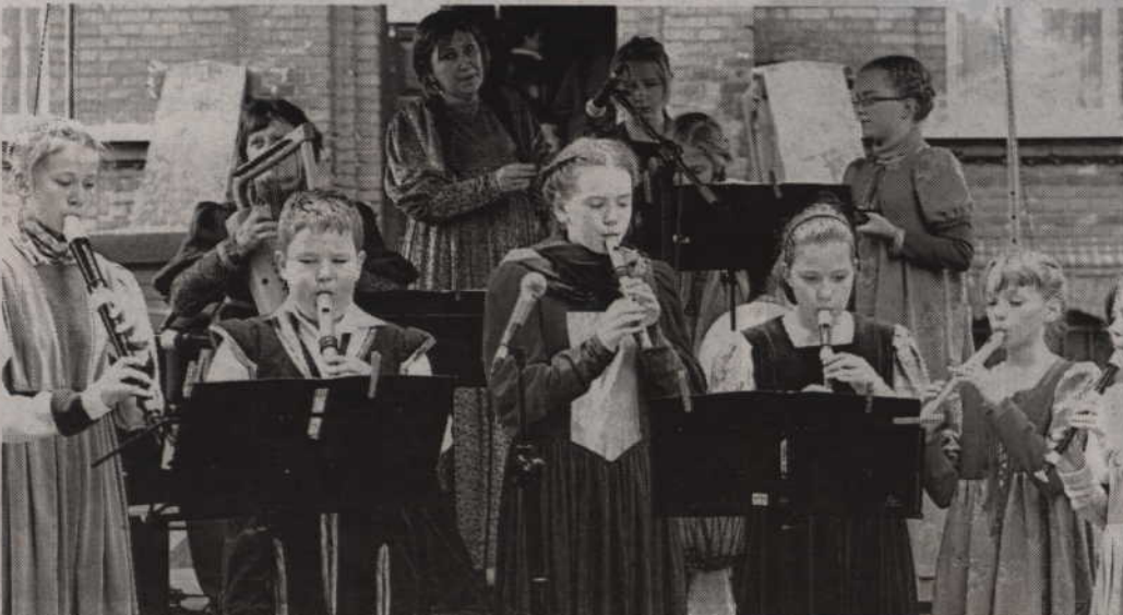
Estoński zespół „Rondo” wystąpił przed budynkiem Biblioteki Miejsko-Powiatowej.