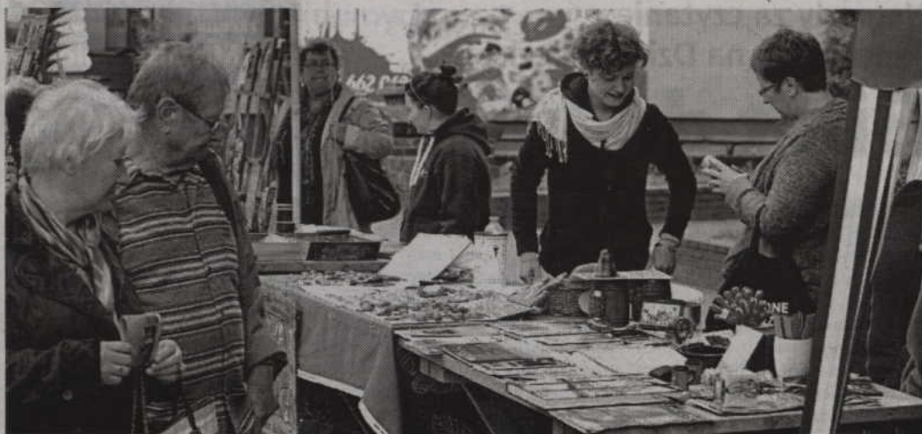
Mieszkańców zaintrygowało stoisko prezentujące publikacje dotyczące Kwidzyna.