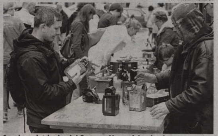
Sprzedawcy chętnie odpowiadali na wszystkie pytania kupujących.