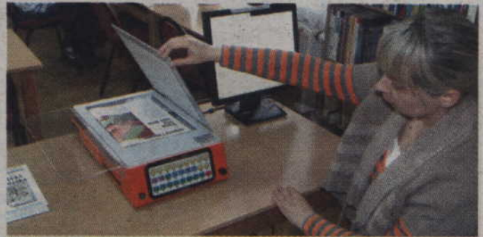
W kwidzyńskiej bibliotece osoby niewidome i słabowidzące mogą korzystać z autolektora - urządzenia czytającego teksty drukowane.

Jak się okazuje zasada działania tego urządzenia jest bardzo prosta i w dużej mierze przypomina skaner. Z tą jednak różnicą, że wyposażony w specjalne oprogramowanie, dzięki klawiaturze braille'owskiej może być łatwo obsługiwany przez niedowidzących lub niewidomych. Lektura książki polega na zeskanowaniu danej strony, którą następnie autolektor buforuje w swojej pamięci, po czym odczytuje podany fragment tekstu.