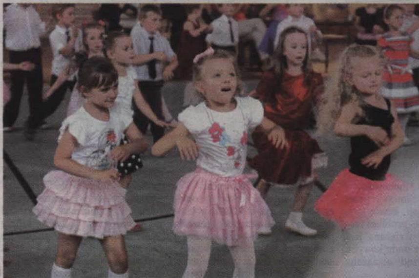
Przedsiębiorcy tańczyli m.in. do popularnej piosenki Las Ketchup „Asereje”.

Przedsiębiorcy, uczniowie zerówek oraz szkół podstawowych wzięli udział w Kwidzyńskim Festiwalu Tańca. Najmłodsi mogli zaprezentować swoje umiejętności przed swoimi bliskimi podczas specjalnego pokazu zorganizowanego przez Kwidzyński Klub Tańca „Progress”. Zanim jednak na sali gimnastycznej II Liceum Ogólnokształcącego pojawili się początkujący tancerze, w specjalnym pokazie tańców standardowych i latynoamerykańskich zaprezentowały się pary trenujące pod okiem kwidzyńskich trenerów. (fox)