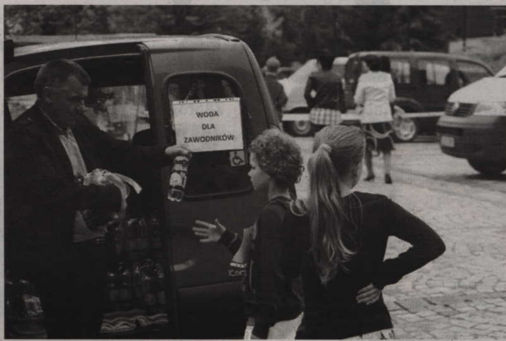
Po przebiegnięciu swojego dystansu uczestnicy otrzymywali butelkę wody.

- W takich zawodach po prostu biegam swoje na tyle na ile wystarcza mi siła. Jeśli mogę pobiec szybciej to biegnę szybciej, jeśli