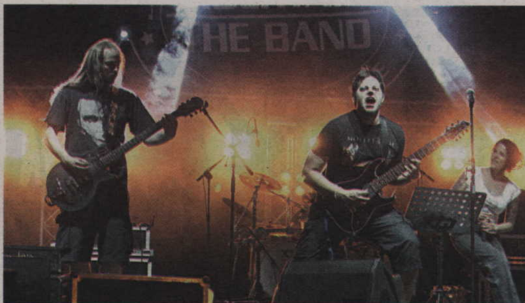
Jedną z atrakcji Dni Kwidzyna będzie występ coverowej grupy Rocktail The Band z Celle.

Pezet oraz Lombard to główne gwiazdy Dni Kwidzyna 2013. Występ obu artystów zakończy tegoroczne święto miasta i odbędzie się w niedzielę, 16 czerwca.