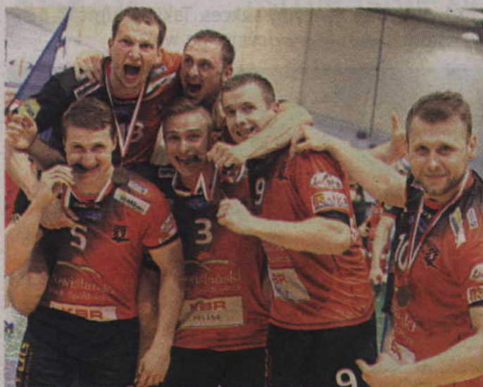
Tak smakuje brąz - mówią kwidzyńscy piłkarze po zdobyciu upragnionego medalu.