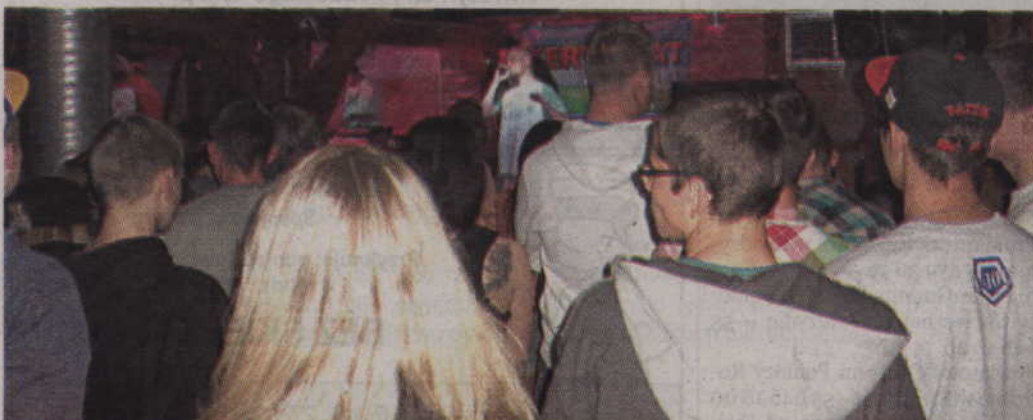
Publiczność podczas koncertu FPS.