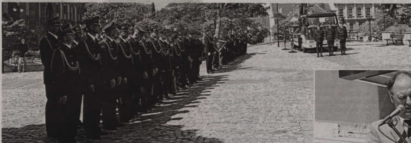
Społeczeństwo obdarza strażaków, najwyższym szacunkiem i zaufaniem. Podczas uroczystości, które miały miejsce na kwidzyńskim placu Jana Pawła II, była okazją do podziękowania strażakom za ich trud i poświęcenie.

Strażacy z powiatu kwidzyńskiego świętowali na placu Jana Pawła II w Kwidzynie. Strażacka akademicka była okazją do wręczenia odznaczeń, wyróżnień i awansów na wyższe stopnie służbowe oraz przypomnienia zdarzeń, podczas których strażacy ratowali ludzi oraz ich dobytek.