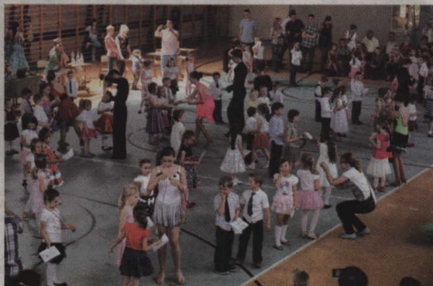
Po występie każdy młody adept tańca otrzymał specjalny medal oraz dyplom wręczany przez nieco bardziej doświadczonych tancerzy.