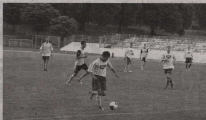
Kwidzyńskie Rodło czekają w najbliższym czasie pojedynki z drużynami: GKS Przdokowo oraz GKS Kolbudy.

chodzili jeszcze do groźnych sytuacji strzeleckich, to nie potrafili po raz kolejny pokonać bramkarza Rodła. Tuż przed przerwą szczęście uśmiechnęło się natomiast do gospodarzy i Przemysław Le-