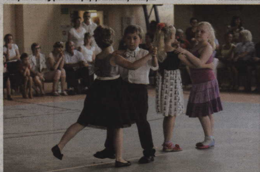
Na parkiecie zaprezentowali się również początkujący tancerze.