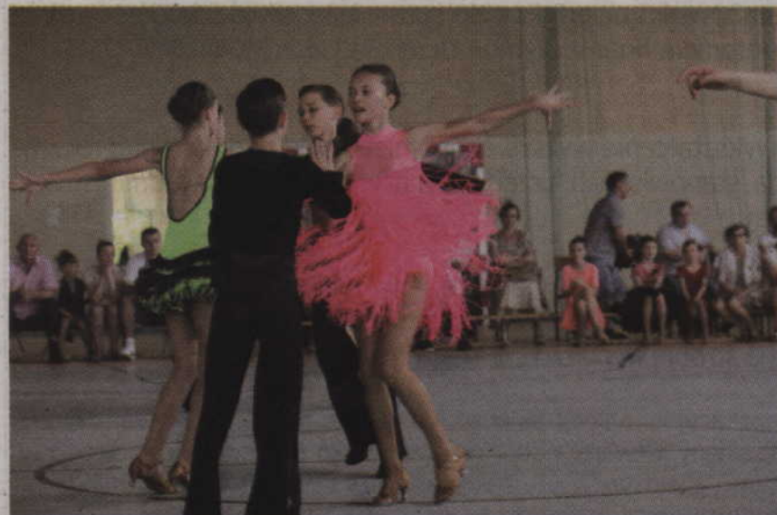
Tancerze KTT „Progress” w pokazie tańców latynoamerykańskich.