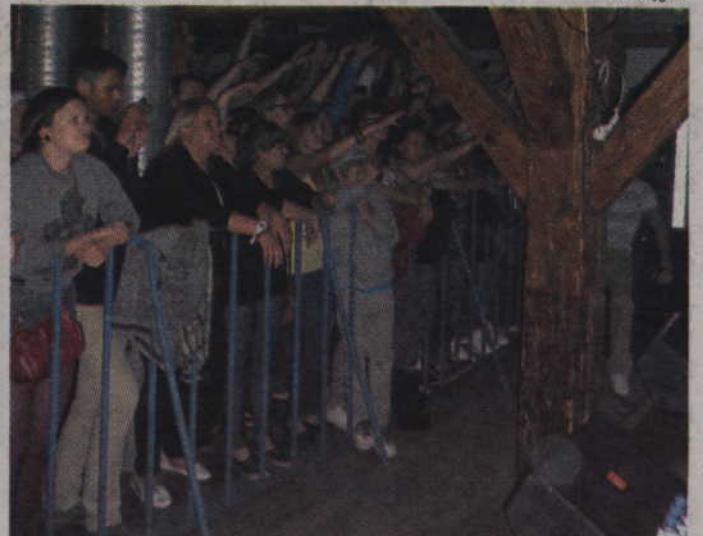
Publiczność dopisała i wypełniła kwidzyński „Spichlerz”.