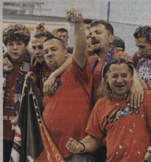
Kwidziński kibice cieszą się ze zdobycia brązowego medalu.