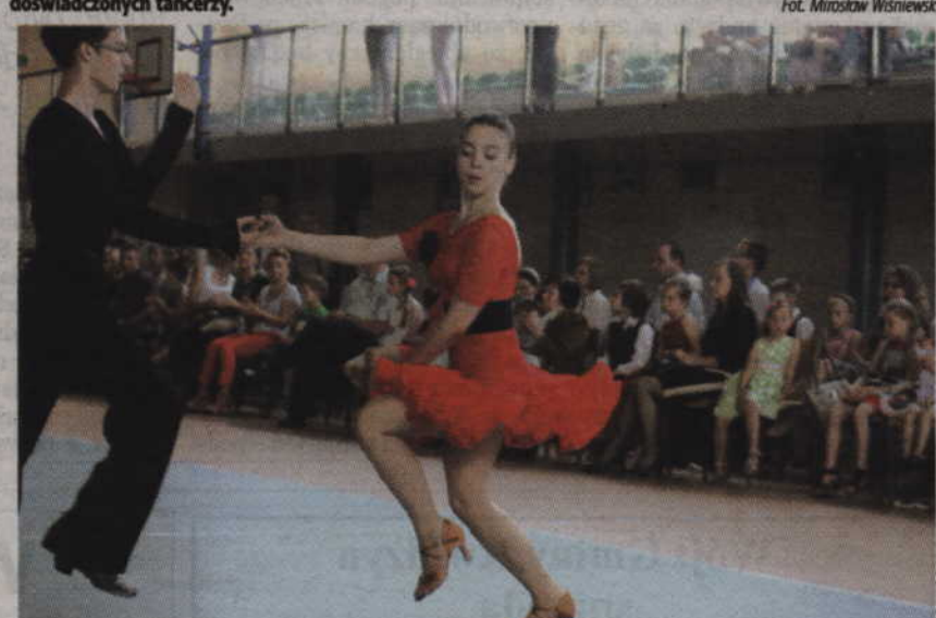
Pokazy taneczne oglądali licznie przybyli mieszkańcy Kwidzyna.