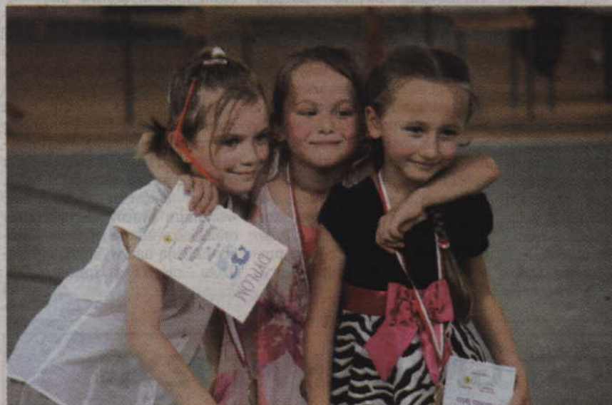
Po wyczerpującym występie warto było zrobić sobie pamiątkowe zdjęcie.