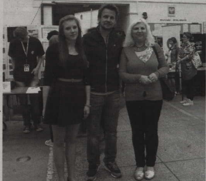
Projekt z Kwizdynia oceniał znany aktor Bartłomiej Topa.

Uczniowie I LO w Kwizdynie laureatami Festiwalu Poetyckiego w Pelplinie