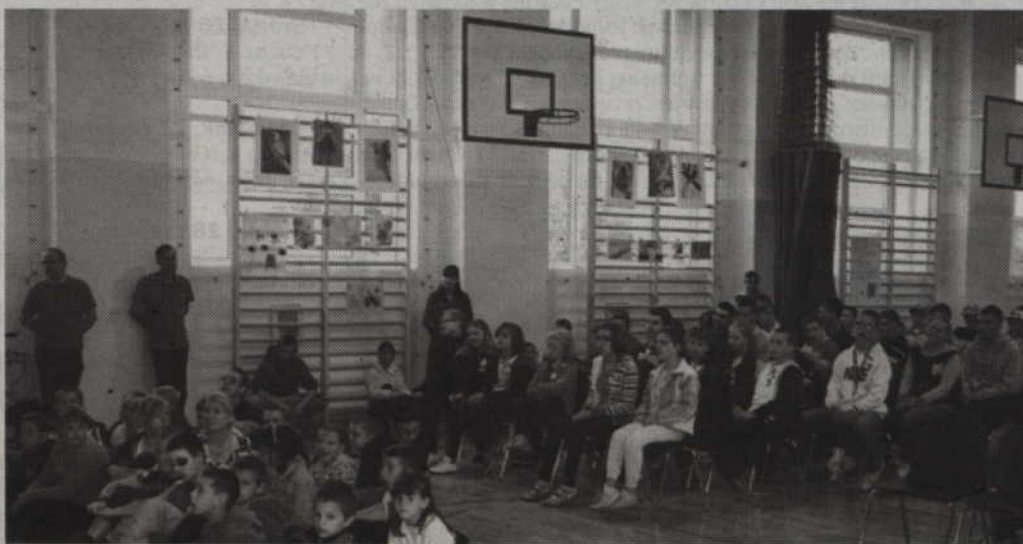
Inauguracja tegorocznego Festynu Integracyjnego odbyła się w sali gimnastycznej Specjalnego Ośrodka Szkolno-Wychowawczego.