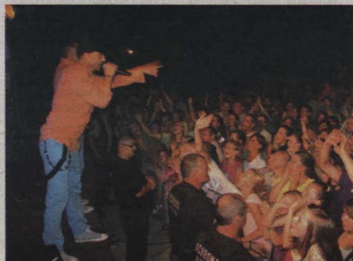
Gardejska publiczność bawiła się na całego.