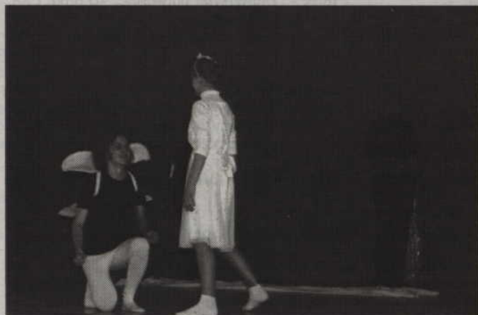
Uczestnicy i zaproszeni goście obejrżeli m.in. występy szkolnych grup artystycznych.

Już po raz trzynasty Specjalny Ośrodek Szkolno-Wychowawczy w Kwidzynie był gospodarzem Festynu Integracyjnego połączonego z Powiatowymi Integracyjnymi Zawodami Sprawnościowymi. W festynie wzięły udział głównie placówki zajmujące się kształceniem i wychowaniem osób niepełnosprawnych, choć nie brakowało również reprezentacji kwidzińskich szkół podstawowych i gimnazjalnych.