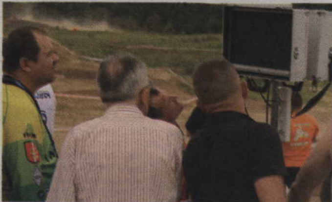
Działacze na bieżąco sprawdzali wyniki swoich podopiecznych.