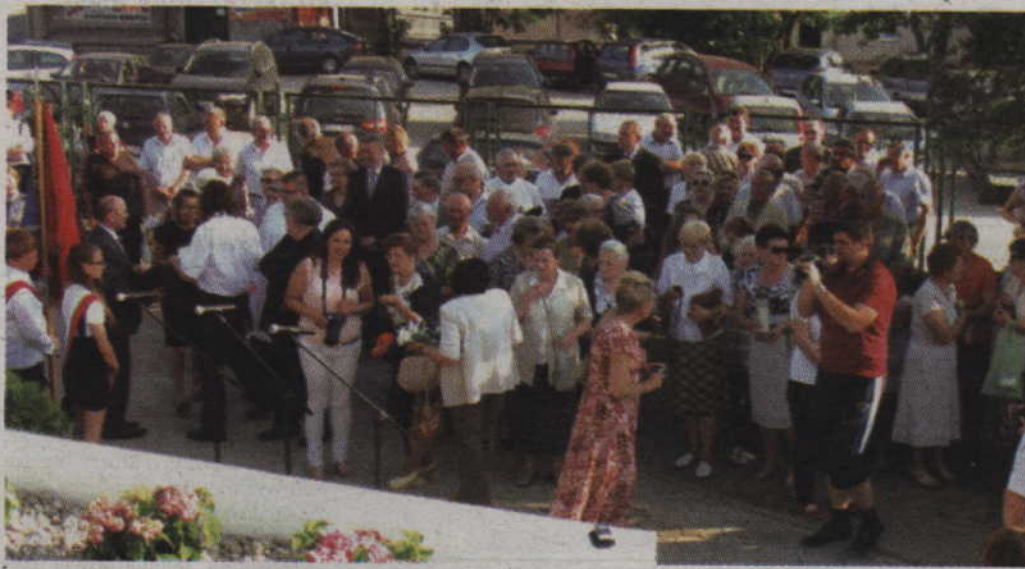
W Prabutach odślonięto krzyż upamiętniający ofiary ludobójstwa na Kresach.

Odślonięcie tablicy pamiątkowej oraz poświęcenie krzyża miało także swoją rocznicową symbolikę. W tym roku bowiem mija 70. rocznica ludobójstwa, której sprawcami byli ukraińscy nacjonaliści. Wielu nieżyjących już mieszkańców Prabut, którzy w poszukiwaniu swojego nowego miejsca na ziemi dotarli aż