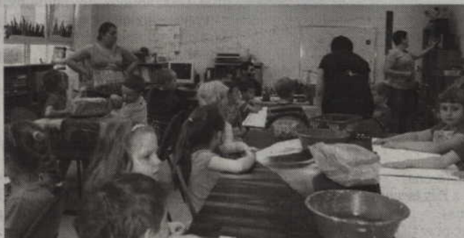
Nie brakowało chętnych do uczestniczenia w zajęciach plastycznych.

Wychowawczych z Kwidzyna i Malborka. Organizatorzy przygotowali pięć konkurencji: bocce, bulle, tor przeszkód, przeciąganie liny oraz ćwiczenia na ergometrze. Po zakończonych startach na pierwszym miejscu ex aequo znalazły się: Gimnazjum nr 2 w Kwidzynie oraz Specjalny Ośrodek Szkolno-Wychowawczy w Barcicach. Drugie miejsce przypadło Specjalnemu Ośrodkowi Szkolno-Wychowawczemu w Kwidzynie, a trzecią lokatę zajął Specjalny Ośrodek Szkolno-Wychowawczy w Kołozębniu.