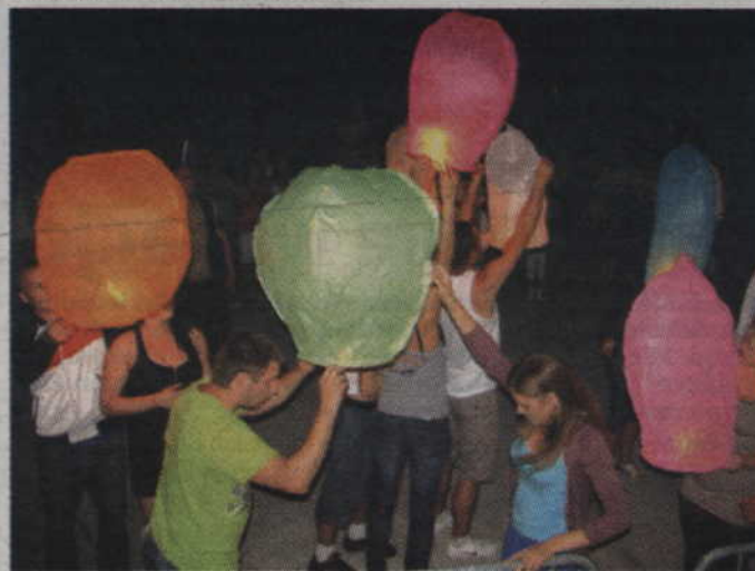
Na zakończenie imprezy zorganizowano konkurs puszczania lampionów.