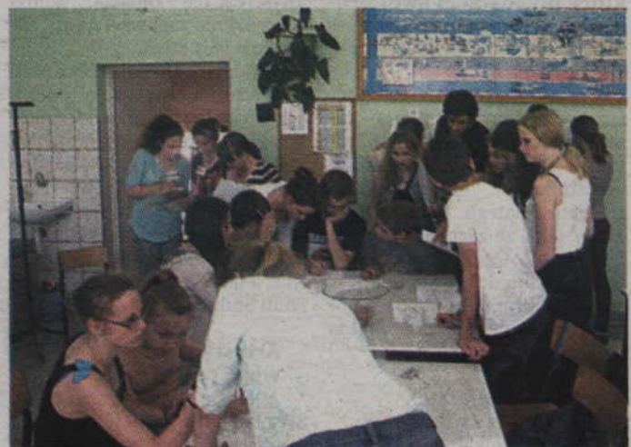
Pierwszego dnia wymiany uczestnicy wzięli udział w licznych grach integracyjnych.