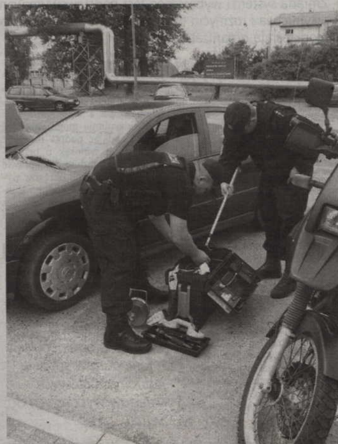
Pod bramą kwidzińskiego Zakładu Karnego znaleziono paczkę, w której może znajdować się ładunek wybuchowy.