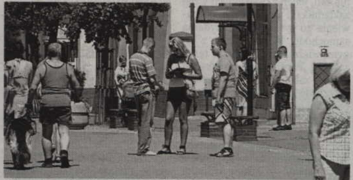
Wolontariusze zbierali podpisy na kwidzińskim deptaku.