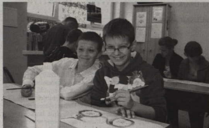
Wszystkim dopisywały humory.