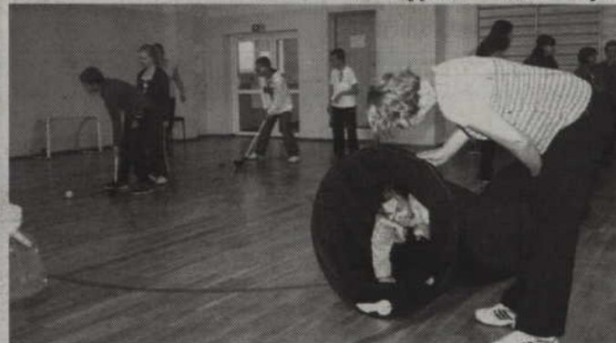
Zabawy sportowo-rekreacyjne odbywały się w sali gimnastycznej.