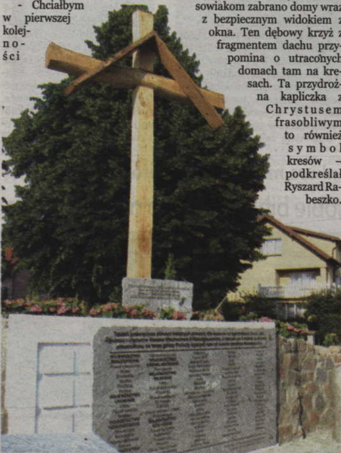
Pod krzyżem znalazła się tablica na której umieszczono nazwy kresowych miejscowości z których pochodzą byli i obecni mieszkańcy Prabut.

podziękować prabuckim kresowiakom za to, że zgodzili się abym mógł zrealizować własny pomysł na uczczenie pamięci o Kresach Wschodnich. To okno przysłonięte tablicą ma swoją wymowę. Mojej rodzinie i wszystkim kresowiakom zabrano domy wraz z bezpiecznym widokiem z okna. Ten dębowy krzyż z fragmentem dachu przypomina o utraconych domach tam na kresach. Ta przydrożna kapliczka z Chrystusem frasobliwym to również symbol kresów - podkreślał Ryszard Rabeszko.