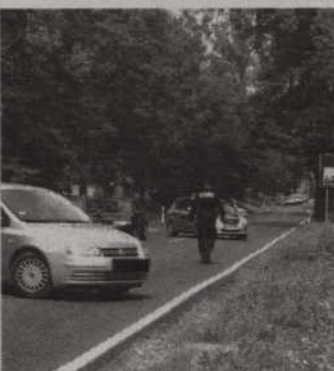
W trakcie pościgu za uciekinierami zamknięto drogę wyjazdową z Kwidzyna w kierunku Grudziądza.