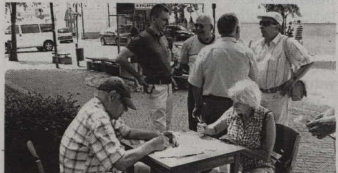
Kwidzynie chętnie składali swoje podpisy pod wnioskiem o referendum w sprawie jednomandatowych okręgów wyborczych w wyborach do Sejmu.

Więcej na temat samej akcji znaleźć można na stronie www.zmieleni.pl (fox)