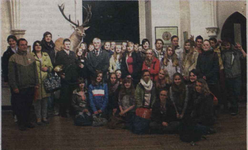
Uczestnicy polsko-niemieckiej wymiany młodzieży podczas spotkania z Kolem Łowieckim „Knieja” w kwizdyńskim muzeum.

..... ” I choć niemiecka placówka miała do wyboru aż 9 szkół, ostatecznie zdecydowano się na przyjazd do Sadlinek. Przeważała szybka i zdecydowana reakcja z naszej strony.”