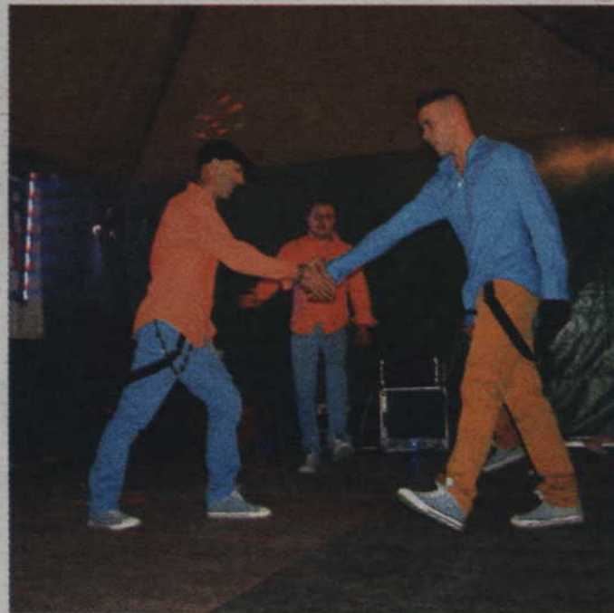
Gwiazdą wieczoru był zespół Maxel.

Słowa jego lidera nie były pustymi obietnicami. Na scenie i na widowni był prawdziwy muzyczny szal. Po występie gwiazdy disco polo odbył się konkurs puszczania lampionów i szukania kwiatu paproci. Nagrodami w tych konkursach były m.in. dwa dwuosobowe zaproszenia do kina Helios w Grudziądzu. Fundatorami nagród był „Kurier kwidziński”, który objął patronat medialny nad tegoroczną gardejską nocą świętojańską. Część nagród ufundowały sklepy BMS i MediaExpert Kwidzyn.