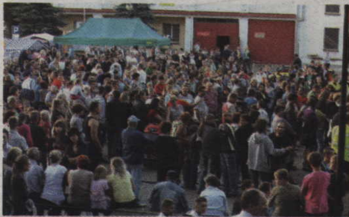
Dni Ryjewa odbędą się na placu przed Gminnym Ośrodkiem Kultury w Ryjewie.