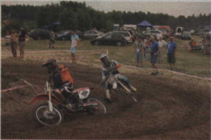
Na trasie zawodników wspierała kwidzyńska publiczność.

Zawody motocrossowe w Kwidzynie odbyły się po długiej, 17 letniej przerwie. Trener KKM Kwidzyn podkreśla jednak, że w kwidzyńskim klubie od lat nie ma zawodników specjalizujących się w tej dyscyplinie sportu. Do tej pory kwidzyński klub rywalizował bowiem w rajdach enduro, a w ostatnich sezonach w zawodach cross-country. Starty w motocrossie traktowane były natomiast jako forma treningu.