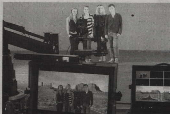
Kwizdyńska grupa podczas wizyty w studiu telewizyjnym.

Ostatnim akcentem festiwalowym były natomiast pokazy filmowe w kinie Muranów wspierane przez Stowarzyszenie Nowe Horyzonty Edukacji Filmowej. Kwizdynianie obejrzeli film Wesa Andersona „Kochankowie z księżycą”.