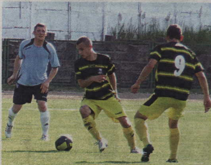
Rodło pokonało Czarnych Czarne i zdobyło ligowe punkty po fatalnej serii 16 porażek z rzędu.

Wydawało się, że to już nie nastąpi nigdy, a jednak w końcu się udało. Po szesnastu porażkach z rzędu Rodło Kwidzyn odniosło swoje pierwsze zwycięstwo podczas piłkarskiej wiosny. Kwidzynianie pokonali Czarnych Czarne 2:0, jednak zdobyte punkty nie uchroniły niebiesko-żółto-czarnych przed spadkiem do V ligi.