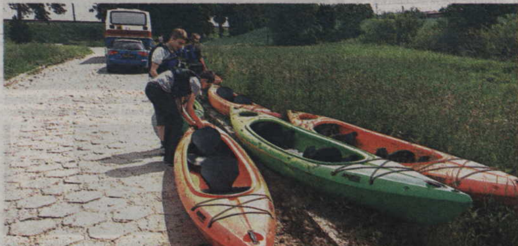
Przygotowania do spływu Liwą.

zytywnie nastawieni do innych ludzi – mówi nauczyciel niemieckiego. - Wymiana na pewno wpłynie jednak nie tylko na umiejętności językowe naszych podopiecznych, ale na ogólny rozwój osobowości uczniów. Trzeba bowiem być naprawdę odważnym dzieckiem, żeby zaprosić do siebie rówieśnika z innego kraju i rozmawiać z nim w obcym dla siebie języku. (fox)