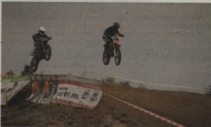
Efektowne skoki to cecha charakterystyczna zawodów motocrossowych.