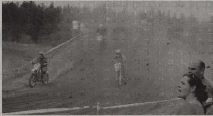
Zawodnicy i kibice musieli zmagać się m.in. z tumanami kurzu.

-Jeśli tylko zawody nie pokrywają się ze sobą, to staram się uczestniczyć we wszystkich