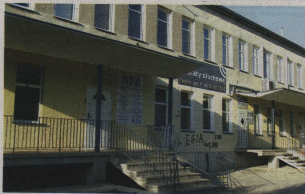
Zgodnie z decyzją pomorskiego oddziału NFZ od 1 lipca poradnia „Femina” nie będzie mogła leczyć pacjentek wykorzystując środki funduszu.