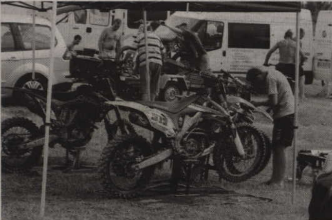
Po zawodach motocykli należało doprowadzić do porządku.

startach - mówi. -Motocross jednak traktuję bardziej treningowo, a większy nacisk kładę na cross-country i enduro. Zawody w Kwidzynie były bardzo udane, choć jeździliśmy po dość trudnym torze. Było trochę kurzu i niestety