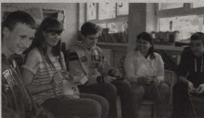
Fragment warsztatów muzycznych.

Po części oficjalnej rozpoczęły się zajęcia otwarte dla zaproszonych uczniów z zaprzyjaźnionych