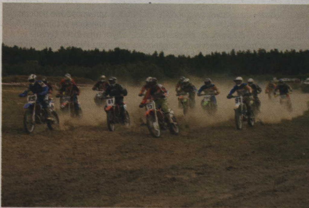
Niezwykle efektowny start zawodników rywalizujących w klasie MX Masters.