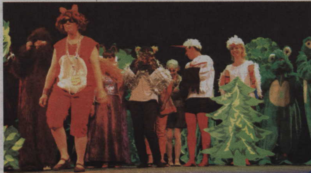
Czy ktoś powiedział, że rodzice nie potrafią rapować?