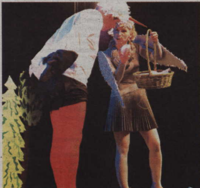
Jedną z żon Bociana miała szansę zostać Kukułka. Nie chciała.

naszego teatru. Ponieważ nasze dzieci należały kiedyś to teatryku "Cykadło", my postanowiliśmy się nazwać "Stare Cykadło".