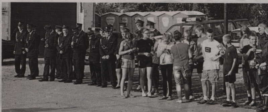
Festyn rozpoczął się od wręczenia nagród dla uczestników gminnych zawodów sportowo-pożarniczych jednostek OSP.

Tegorocznym Dniom Ryjewa towarzyszyły również obchody 95. rocznicy utworzenia Ochotniczej Straży Pożarnej w Ryjewie. Z tej okazji zorganizowane zostały zawody sportowo-pożarnicze jednostek OSP Ryjewa, a przy wejściu do Gminnego Ośrodka Kultury prezentowana była wystawa prac plastycznych uczestniczących w konkursie „Strażak w akcji”. Po wręczeniu nagród dla najlepszych drużyn rywalizujących w zmaganiach pożarniczych, rozpoczęła się część festynowa Dni Ryjewa. Na scenie usłyszeliśmy m.in. chór „Lira” z Ryjewa, a także zespoły: „Zibi”, „Hals”, „Trzy Gitary”, „Verdis”, „Skalar's” oraz „Aplauz”. (fox)