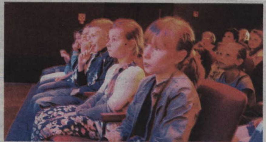
Reakcja dzieci na widok rodziców na scenie była bezcenna.