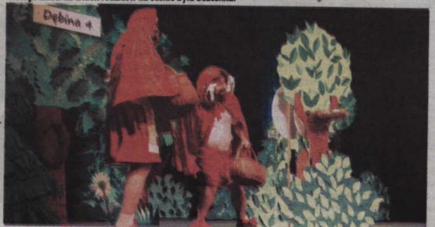
Czerwone Kapturki ukradły całe przedstawienie i rozśmieszyły publiczność do łez.