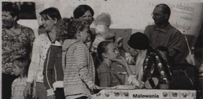
Do stoiska z malowaniem twarzy ustawiła się długa kolejka.