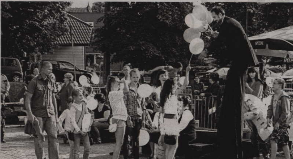
Zaproszeni szcudlarze wzbudzali takie samo zainteresowanie wśród najmłodszych, jak i tych nieco starszych.