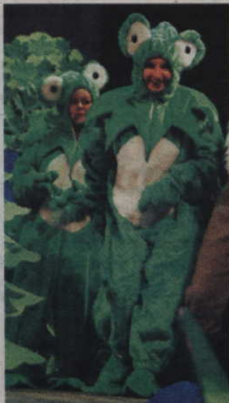
Rodzice bawili się nie gorzej niż ich pociechy.

- Nam też emocje się udzieliły. Ale jak już wyśpiewaliśmy ostat-