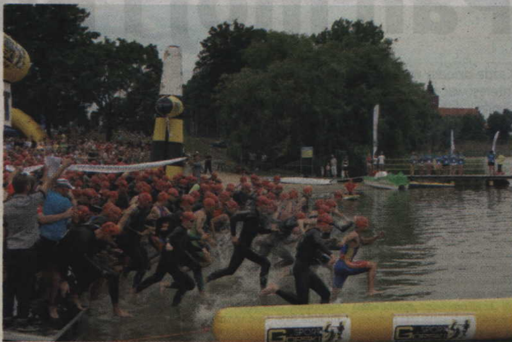
Efektowny start zawodów Susz Triathlon 2013.

Dzień później odbyła się rywalizacja w triathlonie sprinterskim, na który składa się: pływanie - 750 m, jazda na rowerze - 20 km oraz bieg - 5 km. Sprint w Suszu również rozgrywany był w formule bez draftingu. Bardzo dobrze