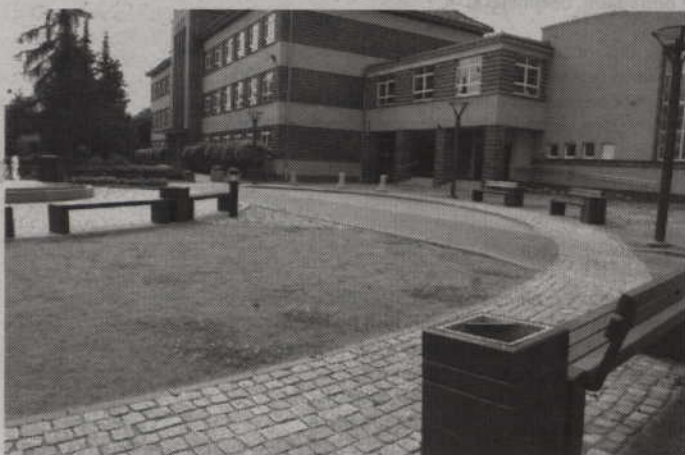
Podobne rondo wybudowano przy Szkole Podstawowej nr 4.