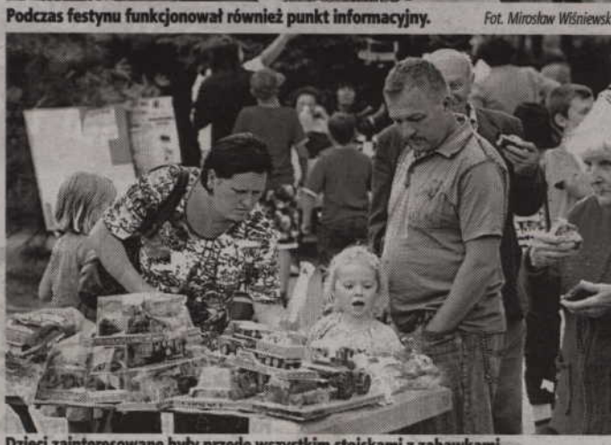
Dzieci zainteresowane były przede wszystkim stoiskami z zabawkami.