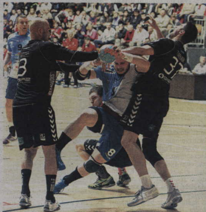
Sezon 2013/2014 kwidzynianie rozpoczną od wyjazdowego spotkania z Gaz-System Pogoń Szczecin.

7 kolejka - 19/20 października MMTS Kwidzyn - POWEN Zabrze 8 kolejka - 9/10 listopada Piotrkowianin Piotrków Trybunalski - MMTS Kwidzyn 9 kolejka - 16/17 listopada MMTS Kwidzyn - VIVE Targi Kielce 10 kolejka - 23/24 listopada Zagłębie Lubin - MMTS Kwidzyn 11 kolejka - 30 listopada/1 grudnia MMTS Kwidzyn - Orlen Wisła Płock