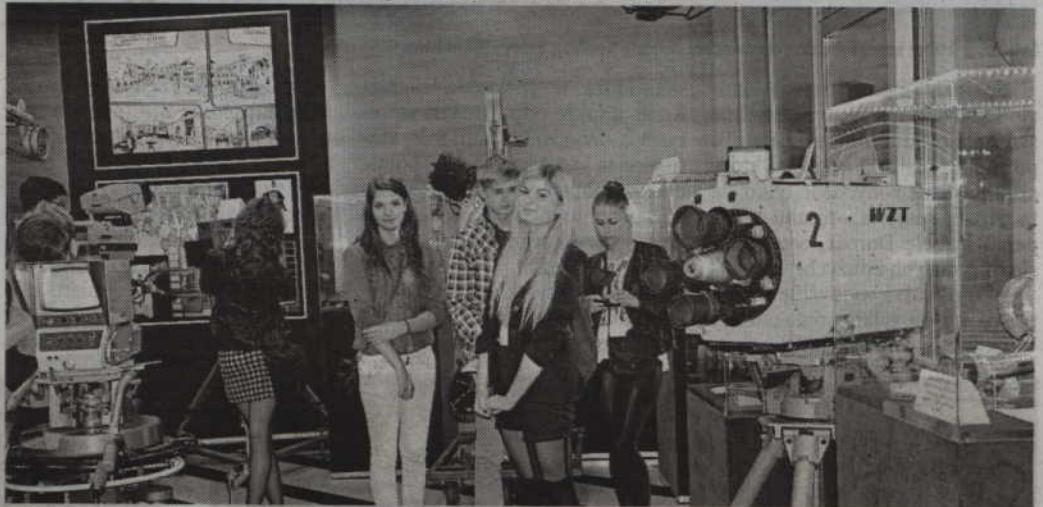
Młodzież z I LO w sali muzealnej TVP.

nie obyło się także bez atrakcji politycznych i kulturalnych. Natomiast dziennikarski materiał, który powstał w wyniku wyjazdu, obejmował sprawozdania z Belwederu zwiedzanego w towarzystwie miłośniczki marszałka Pił-