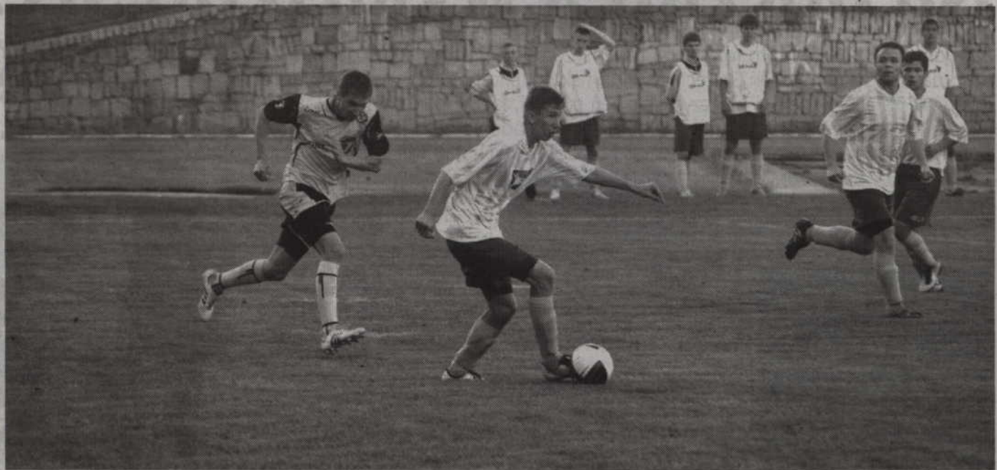
Rodło Kwidzyn w najbliższym sezonie rywalizować będzie na boiskach V ligi czyli ligi okręgowej.