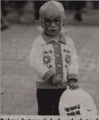
Podczas festynu nie brakowało chętnych do pozowania....