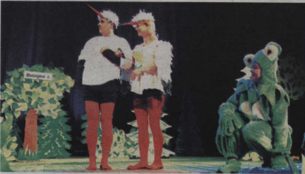
Sztuka, w której zagrali rodzice, opowiadała historię Bociana, który szukał żony.

Spotykali się wieczorami i po kryjomu. Rezygnowali ze swojego wolnego czasu, aby szyć kostiumy i uczyć się ról. I choć czasem ciężko było pogodzić wszystko z domowymi obowiązkami, a co najważniejsze, utrzymać w tajemnicy przed wścibskimi dziećmi, to nie poddali się. O kim mowa? O rodzicach uczniów z III c ze Szkoły Podstawowej nr 4, którzy dla odmiany postanowili posadzić swoje dzieci na widowni, a sami wdrapali się na scenę.