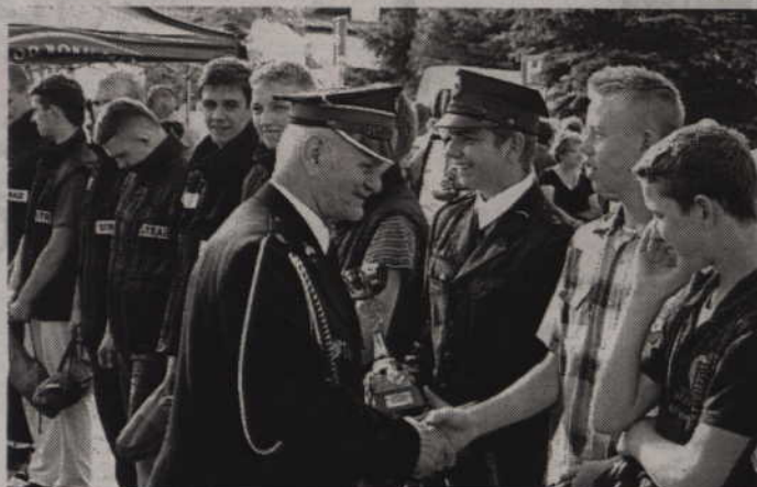
Nagrody strażakom wręczano w pięciu kategoriach.