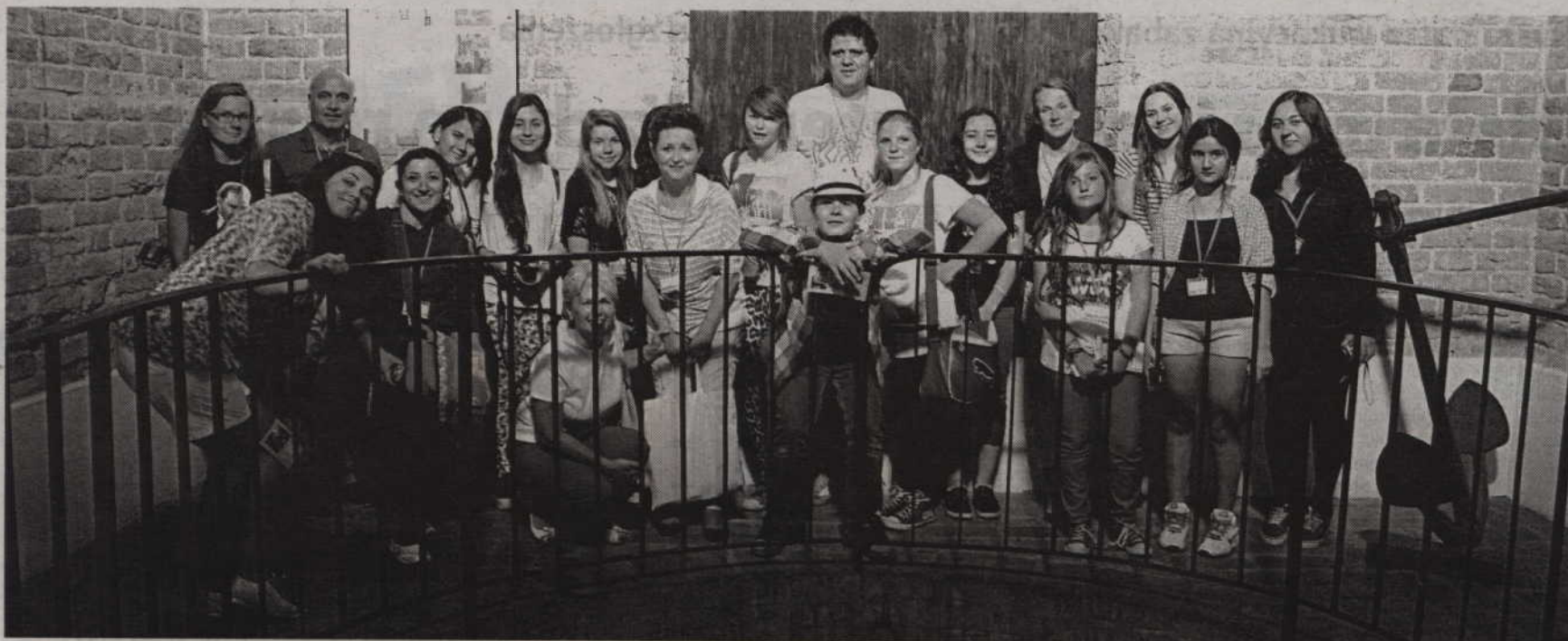
Młodzież z Turcji zwiedziła m.in. zamki w Malborku oraz Kwidzynie.