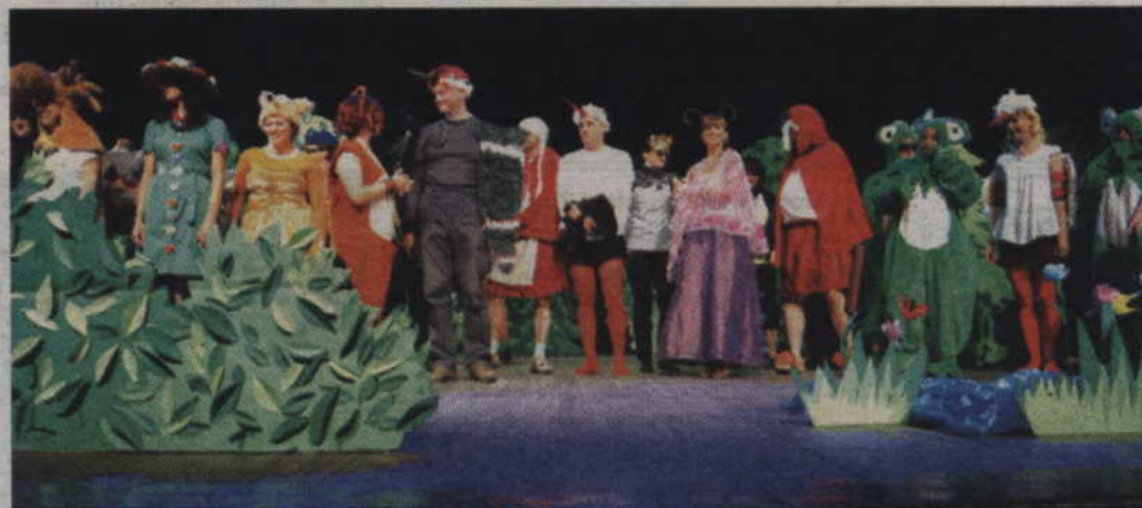
Finałowe wyjście na scenę.

Więcej zdjęć z przedstawienia na naszej stronie www.kwidzyn1.pl