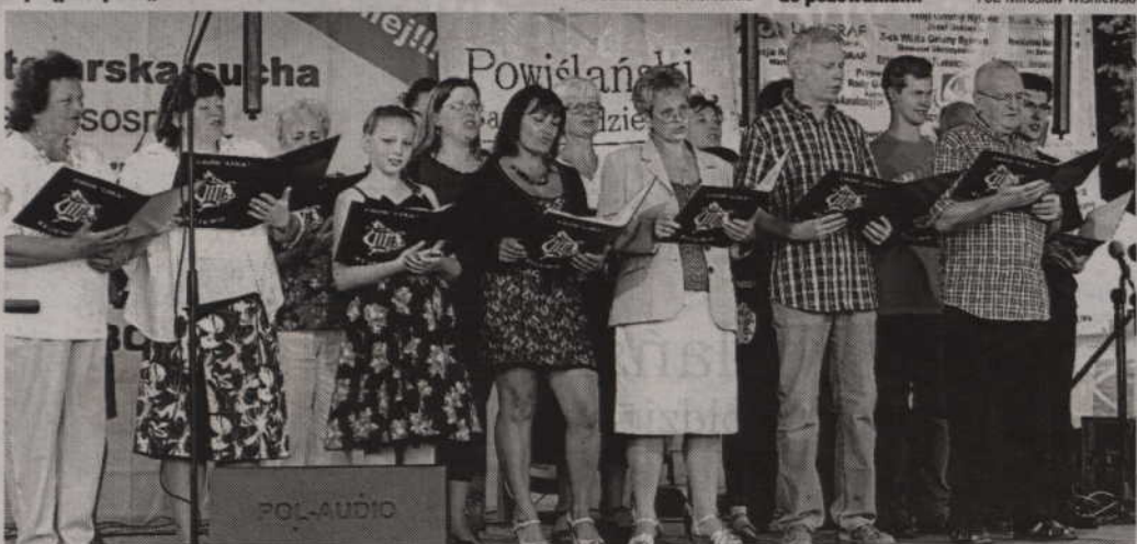
Na scenie wystąpił ryjewski chór „Lira”.