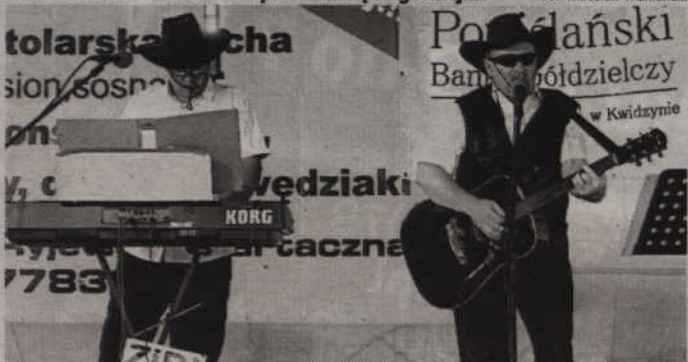
Występ zespołu „Zibi”.