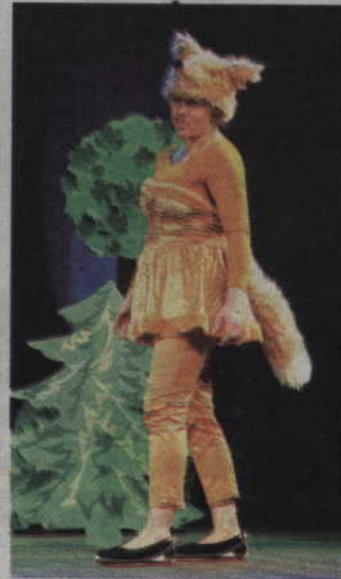
Kostiumy zapierały dech w piersiach.