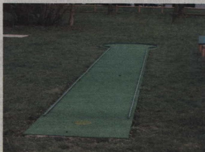
Indywidualne Mistrzostwa Kwidzyna w minigolfie po raz pierwszy zostaną rozegrane na nowej, sztucznej nawierzchni.