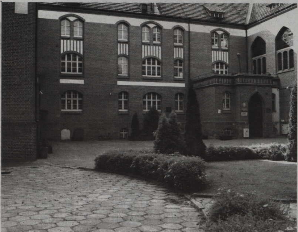
Przy Szkole Podstawowej nr 5 w Kwidzynie powstanie rondo, które pozwoli na bezpieczny dowóz dzieci.