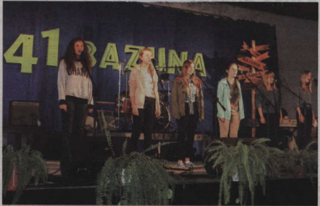
Dziewczyny z Kwidzyna na scenie.