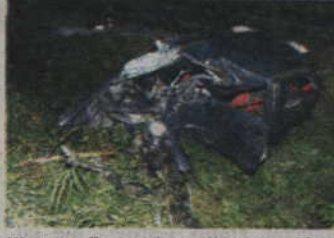
W wypadku pod Stańkowem zginął 23-letni mężczyzna.

- Działania Straży Pożarnej polegały na zabezpieczeniu wraz z funkcjonariuszami policji z komisariatu w Prabutach miejsca zdarzenia do czasu przybycia prokuratora, oświetlenia miejsca wypadku, odnalezienia porzucanych części pojazdu, które leżały w promieniu 50 m od wra-ku oraz uprzątnięciu miejsca wypadku po załadowaniu rozbitego pojazdu na lawetę - relacjonuje jeden ze strażaków z OSP Prabuty. W działaniach wzięły udział: zastęp OSP Prabuty, zastęp JRG PSP Kwidzyn oraz strażacy z Prabuty i Susza którzy przybyli na miejsce wypadku swoimi prywatnymi samochodami. Akcją kierował dowódca Jednostki Ratowniczo - Gaśniczej w Kwidzynie mł. kpt. Tomasz Szczęsny. Droga