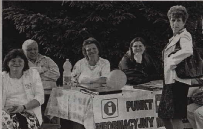
Podczas festynu funkcjonował również punkt informacyjny.