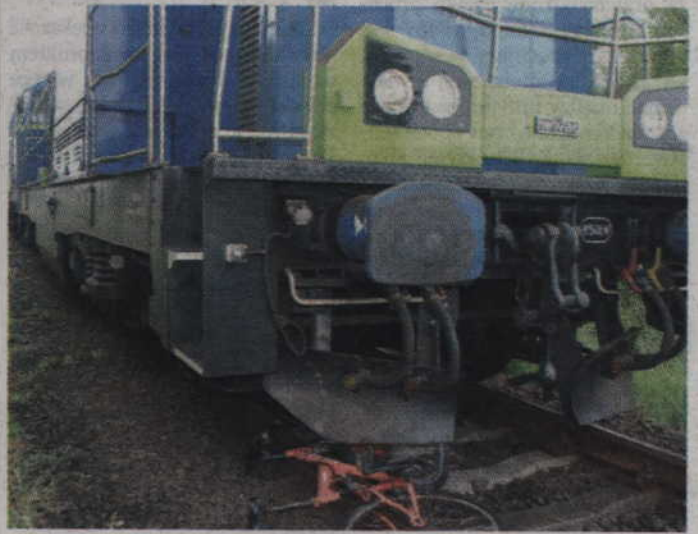
Na szlaku kolejowym w Kalmuzach pociąg potrącił pijanego rowerzystę.