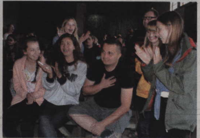
Radość po ogłoszeniu wyników.