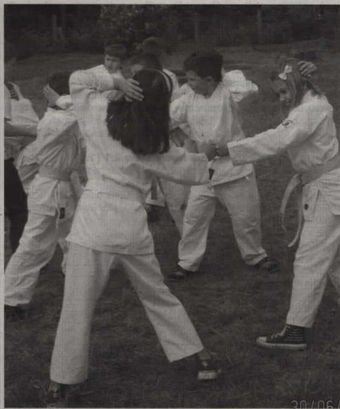
Pokazy walk wśród najmłodszych zawodników kwidzyńskiego klubu.

Biwak karate odbył się w tym roku nad jeziorem Deczno i adresowany był przede wszystkim do dzieci. Pobyt najmłodszych oprócz treningów sztuk walki uatrakcyjniony był natomiast wycieczką oraz wizytą funkcjonariuszy Straży Pożarnej i Straży Rybackiej. (fox)