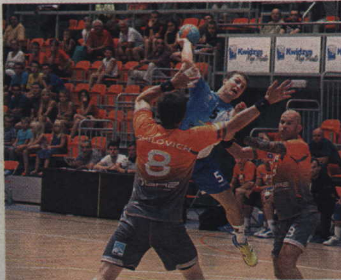
MMTS Kwidzyn już w najbliższą sobotę zmierzy się z piłkarzami Gaz-System Pogoni Szczecin.

W okresie przygotowawczym kwidzynianie trzykrotnie spotkali się z drużyną szczecińskiej Pogoni. Najpierw w turnieju zorganizowanym w Kwidzynie triumfowali podopieczni trenera Krzysztofa Kotwickiego wygrywając 22:33. Ponownie zespoły spotkały się na tegorocznym X Międzynarodowym Memoriale Jerzego Klempela w Dzierżonowie, jednak tym razem górą byli zawodnicy Pogoni. Szczecińnianie pokonali kwidzyński zespół 22:21, jednak okazja do rewanżu ze strony MMTS przyszła w kolejnym turnieju towarzyskim. Gaz-System Pogoń Szczecin i MMTS Kwidzyn zmierzyli się bowiem w finale I międzynarodowego turnieju piłki ręcznej w Malborku. Czerwono-czarni pewnie ograli rywali wygrywając 23:30.