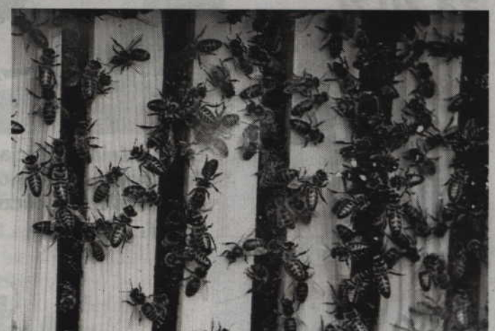
Zgnilec amerykański to choroba, która zagraża wyłącznie pszczełim rodzinom.