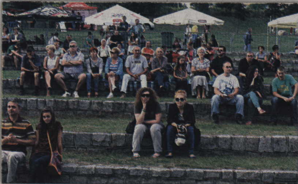
Publiczność wypełniła amfiteatr znajdujący się nad Liwą.