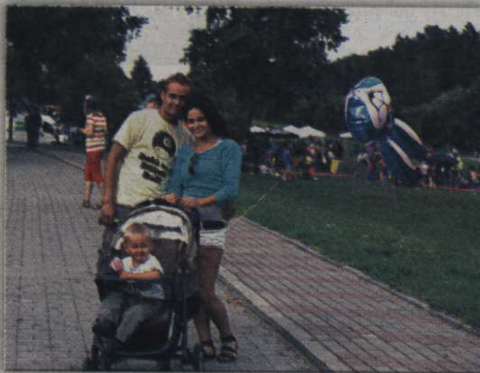
Tegoroczny festyn upłynął pod znakiem rodzinnego piknikowania.

„Pożegnanie lata” rozpoczęło się od spotkania z Bobem Bu-