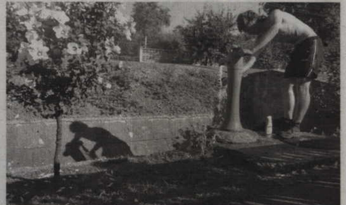
Węgry i poranna toaleta przy ręcznej pompie

grzech była nie do pokonania. Nie rozumiałem prawie nic z tego co do mnie mówili. Już w Serbii poczułem się zupełnie odprężony. Przynajmniej rozumiałem większość wypowiedzianych do mnie słów. Często spotykałem się z przejawami niezwykle serdeczności. Większość tras pokonywałem jadąc drogami, które należały