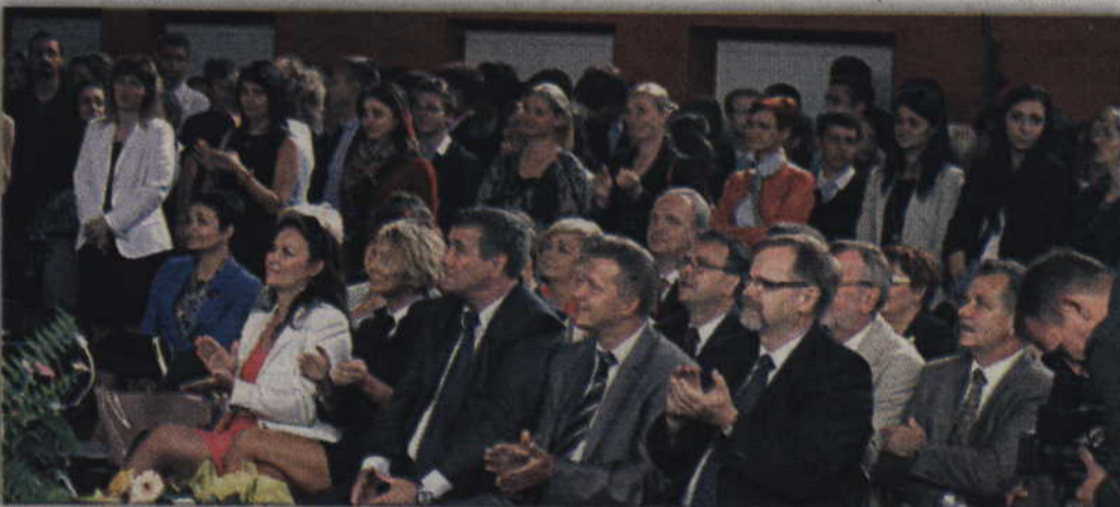
Wysitek śpiewających nagrodzono oklaskami.