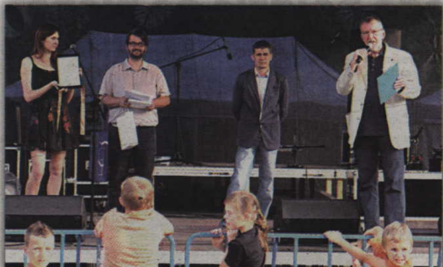
Podczas aukcji charytatywnej udało się zebrać około 4 tysięcy złotych.