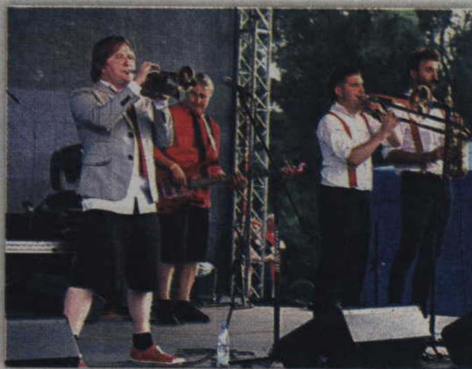
Koncertowe granie rozpoczął zespół „Majestic”.