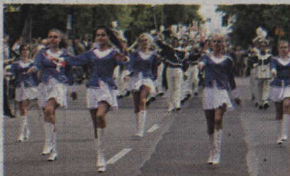
Uroczysty orszak prowadziły mażoretki Orkiestry Dętej „Helikon”.