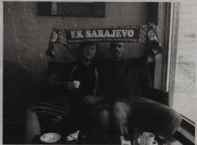
Udane spotkanie z kibicem FK Sarajewo