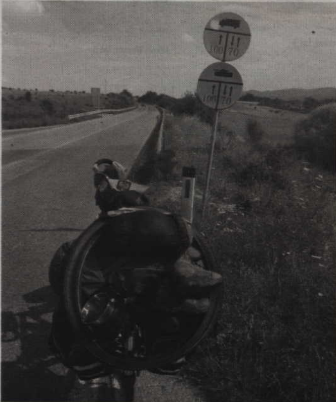
I ciekawostka z Kosowa: czolgi mogą jechać tylko do 100 km na godzinę

milej wspomina pobyt w Prisztinie, stolicy Kosowa.