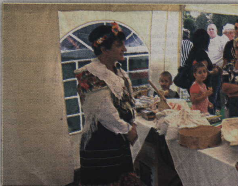
W specjalnym namiocie można było sprawdzić jak piecze się chleb.