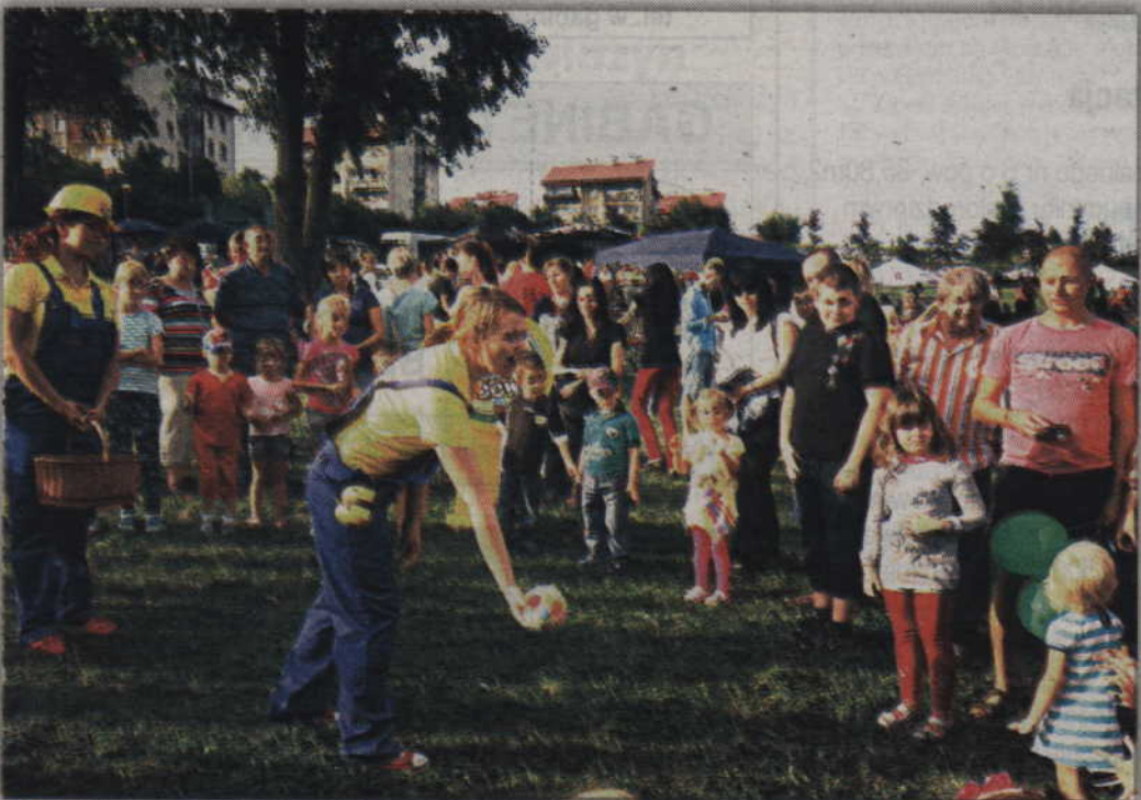
Nie zabrakło oczywiście zabaw dla najmłodszych mieszkańców. red. tech. BR