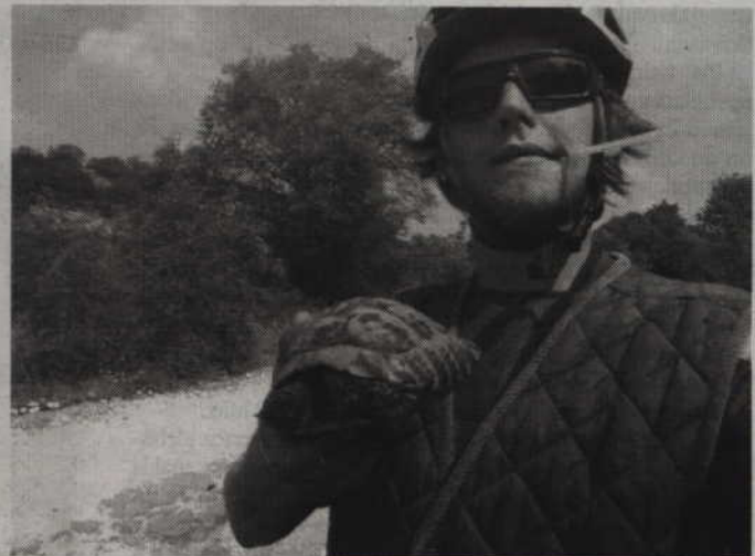
Macedonia i żółw, który w nocy mnie obudził.