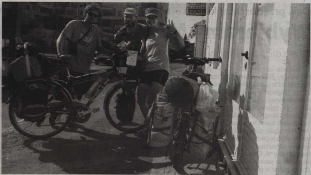
Kanadyjczy, których spotkałem na trasie, jechali na składakach z Uzbekistanu