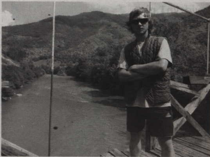
To już Serbia.