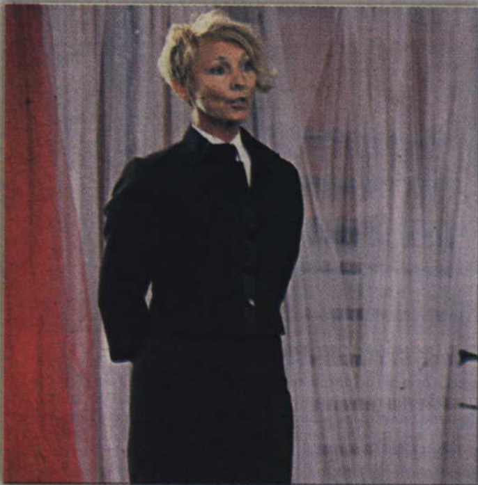
- Od dzisiaj to miejsce jest waszą szkołą – stwierdziła dyrektor Społecznego Liceum.