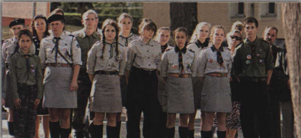
Na Skwer Kombatanta jak zwykle licznie przybyli harcerze.