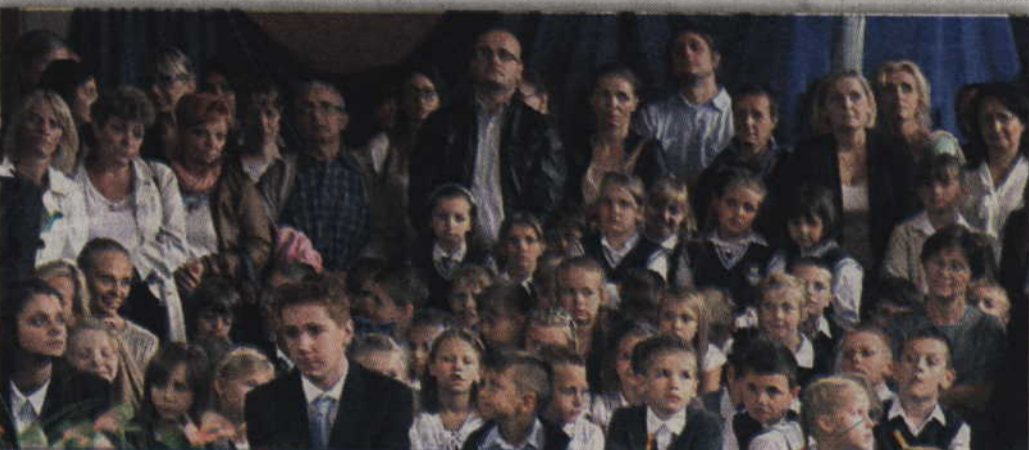
Pierwszoklasiści Społecznej Szkoły Podstawowej.