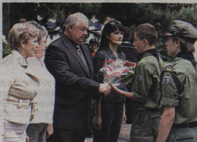
Hołd oddaje delegacja PSL-u.