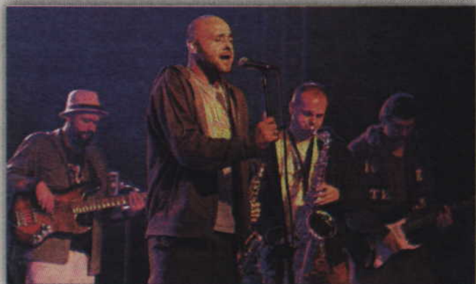
Grupa „Paraliż Band” zgromadziła przed sceną swoich wiernych sympatyków.