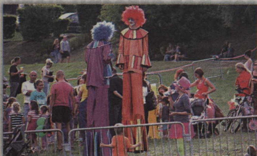
Festynowej zabawie najmłodszych towarzyszyli m.in. szczudlarze.