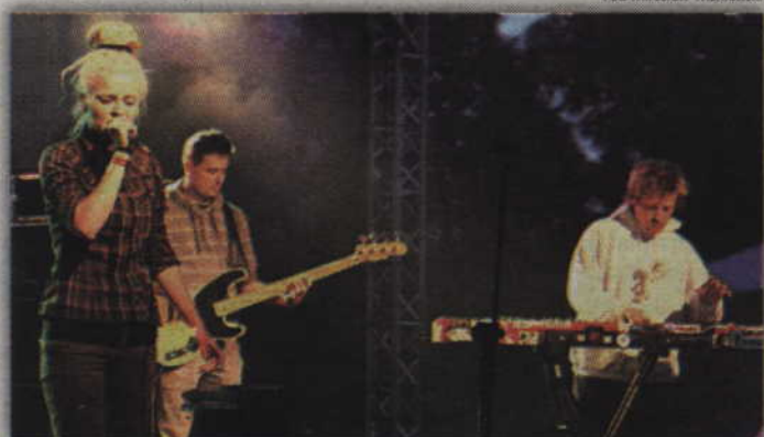
„Root Wise” rozgrzał kwidzyńską publiczność przed występem głównej gwiazdy festynu.