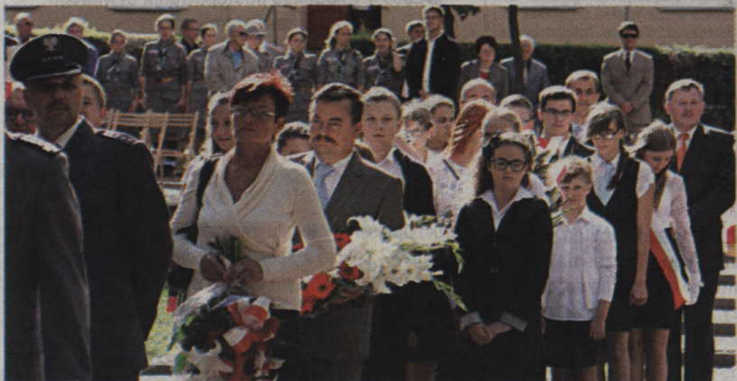
Delegacje złożyły kwiaty na Grobie Nieznanego Żołnierza.