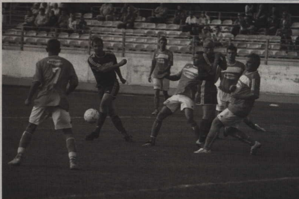
Po słabym meczu kwidzyńskie zremisowało z Wdą Lipusz 1:1.

Piłkarze Rodła rozegrali jedno ze słabszych spotkań, jednak zdołali wywalczyć cenny punkt. Nic jednak nie tłumaczy działaczy kwidzyńskiego klubu, którzy nie potrafią właściwie zadbać o bezpieczeństwo podczas ligowych spotkań. W pierwszej połowie mecz został bowiem na chwilę przerwany, po tym jak na murawę wbiegła grupa kibiców kwidzyńskiej drużyny. Zawodnicy przebiegli przez murawę tylko po to, aby skrócić sobie drogę do ataku na inną grupę kibiców. Do konfrontacji na szczęście nie doszło, bowiem przeciwnicy w porę opuścili trybuny. Zastanawia jednak brak reakcji ze strony organizatorów, którzy chyba nie widzieli w takim zajściu nic dziwnego. Wydaje się jednak, że nawet na poziomie V ligi do takich zdarzeń dochodzić nie powinno.