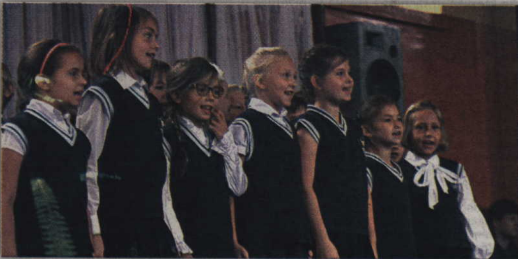
Występ najmłodszych uczniów Społecznego.