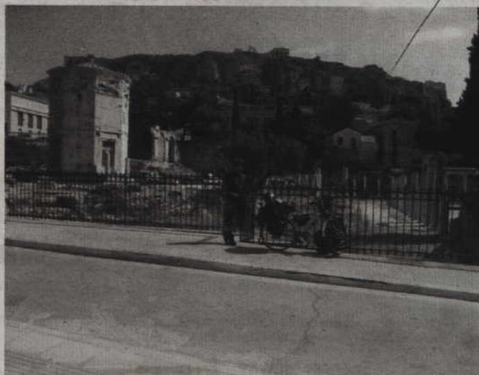
Celem podróży była Grecja. Krzysztof na tie wyroczni w Delfach.