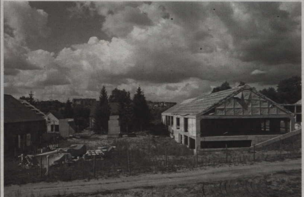
Nowy wykonawca, którego zadaniem będzie dokończenie budowy KPPT w Górkach, ma wejść na teren parku już w listopadzie.