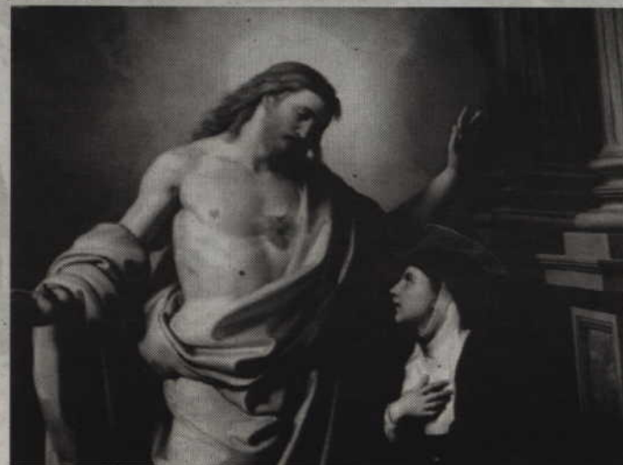
27 grudnia w roku 1673 we Francji Pan Jezus objawił się św. Małgorzacie Alacoque. To jeden z obrazów ilustrujących tamto zdarzenie.

..... ” „Moje Boskie Serce płonie tak silną miłością ku ludziom, że nie można dłużej utrzymać tych gorejących płomieni, zamkniętych w łonie moim. W ten czas ukazało się Boże Serce oplecione cierniami ze stygmatami pięciu ran. Oto Serce, które tak bardzo umiłowało ludzi, a w zamian za to otrzymuje wzgardę i zapomnienie. Ty przynajmniej staraj się mi zadośćuczynić za ich niewdzięczność”.