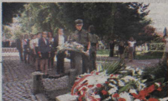
Uroczystości patriotyczne jak co roku obsługiwane są przez kwidzyńskich harcerzy.