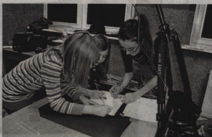
Uczestniczki Koła Młodych Dziennikarzy z Pawlic podczas pracy nad filmem.

- Najbardziej zaskoczyło nas to, że aby nagrać 30 sekund filmu, trzeba było na to poświęcić od dwóch