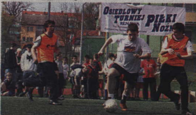
Osiedlowy turniej piłki nożnej o puchar prezesa PSM „Renawa” organizowany jest dwa razy do roku.

Powszechna Spółdzielnia Mieszkaniowa „Renawa” zaprasza na XVII Osiedlowy Turniej Piłki Nożnej. Jesienne rozgrywki piłkarskie odbędą się w dniach 20-21 września na Orliku przy ul. Kazimierza Wielkiego. Zapisy zainteresowanych drużyn przyjmowane są jednak tylko do 16 września włącznie. Jest to termin ostateczny, po którym nie będą przyjmowane dalsze zgłoszenia.