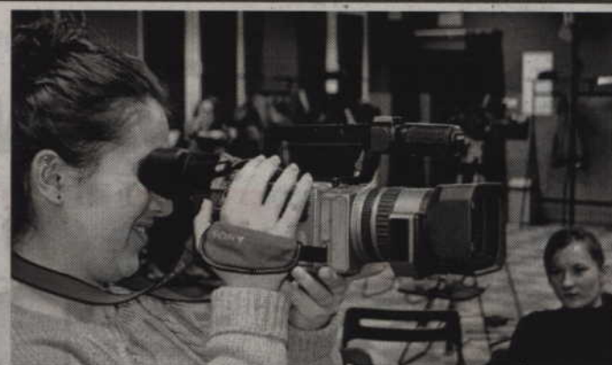
Młodzi filmowcy pracowali nad ośmiominutowym filmem blisko cztery tygodnie.