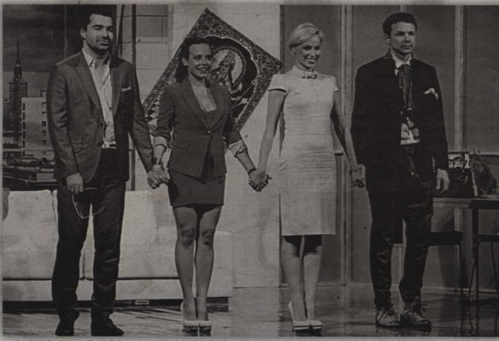
Spektakl "Single i remiksy" już we wrześniu w kwidzyńskim teatrze.

Gdy korporacja zostaje wchłonięta przez inną, większą, a nowe szefostwo postanawia zmienić charakter firmy na rodzinny, Magda wpada w panikę. Tym większą, że do Polski zostaje wysłany nowy przełożony, którego zadaniem ma być