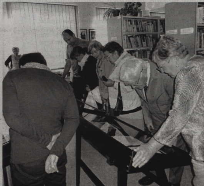
Mieszkańcy licznie przybyli na wernisaż uświetniający 65-lecie ryjewskiej biblioteki.