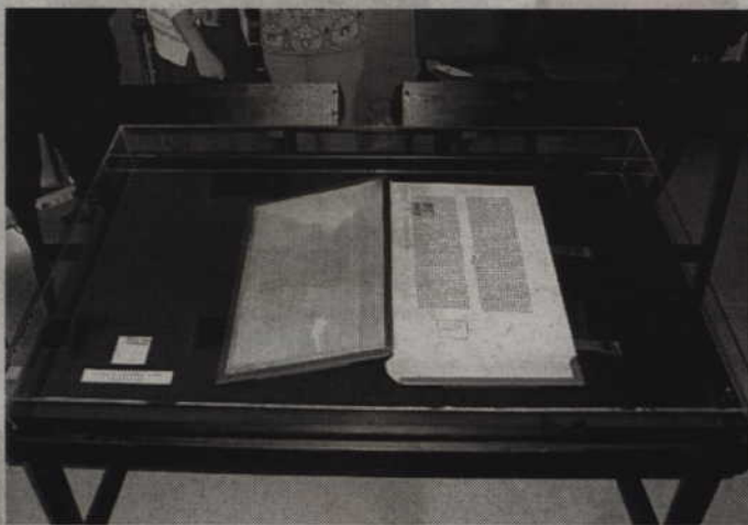
Faksymile Biblii Gutenberga do końca września oglądać można w Gminnej Bibliotece Publicznej w Ryjewie.

Na początku września 2000 roku, podczas obchodów 600-lecia urodzin Jana Gutenberga, Wydawnictwo Bernardinum z Pelplina, wspólnie z księgarzami, wydawcami, poligrafami, intrologatorami, podpisało list intencyjny w sprawie wydania faksymile pelplińskiego