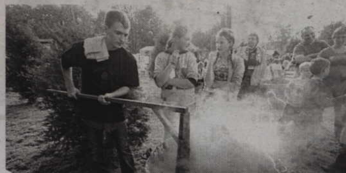
Święto Powideł Nebrowskich nie może się odbyć bez wspólnego smażenia owoców.