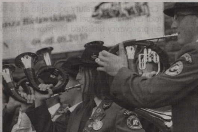
Najlepsi sygnaliści po raz kolejny powalczą o Wiklinowy Róg Kwidzyna.