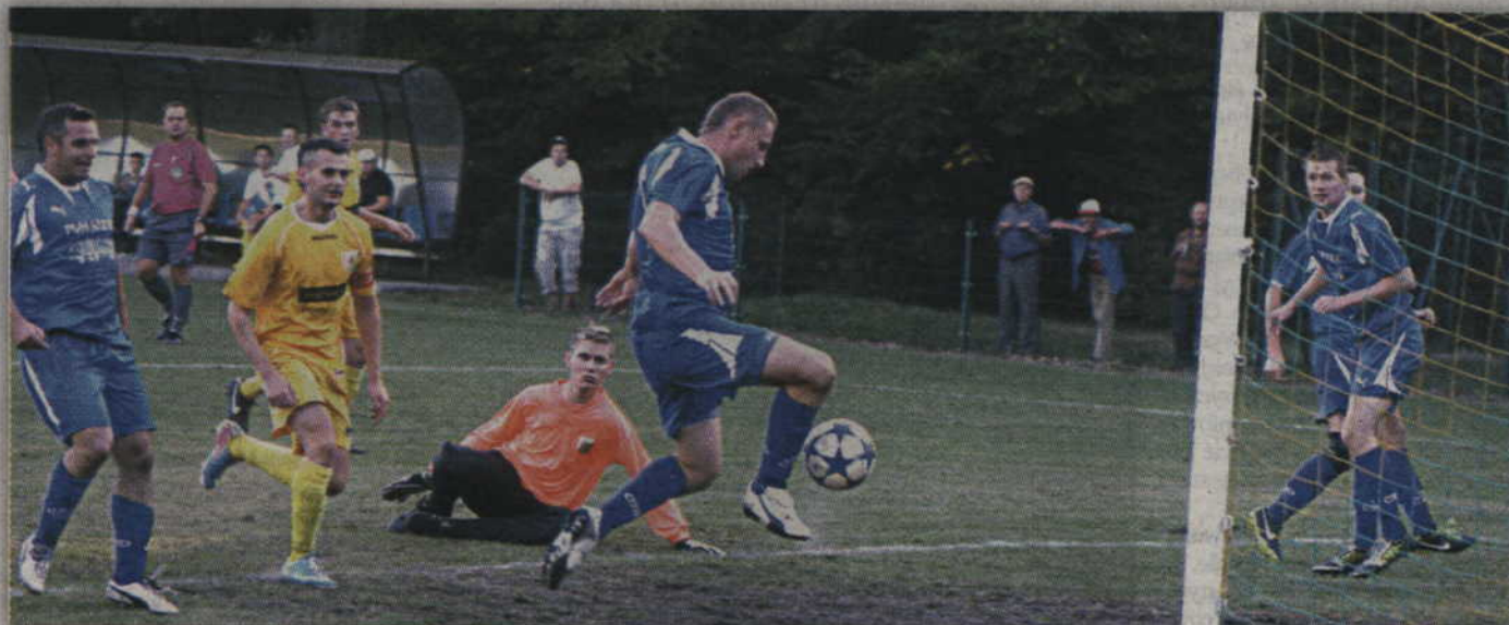
W tej sytuacji ryjewianie zdołali umieścić piłkę w siatce, jednak sędzia liniowy dopatrzył się pozycji spalonej gospodarzy.

Strata bramki spowodowała, że ryjewianie ruszyli do ataku. Niestety próby stworzenia zagrożenia pod bramką rywala nie przynosiły oczekiwanych rezultatów. Co innego natomiast piłkarze gości, którzy jeszcze przed przerwą zdołali podwyższyć prowadzenie w tym spotkaniu do stanu 1:3.