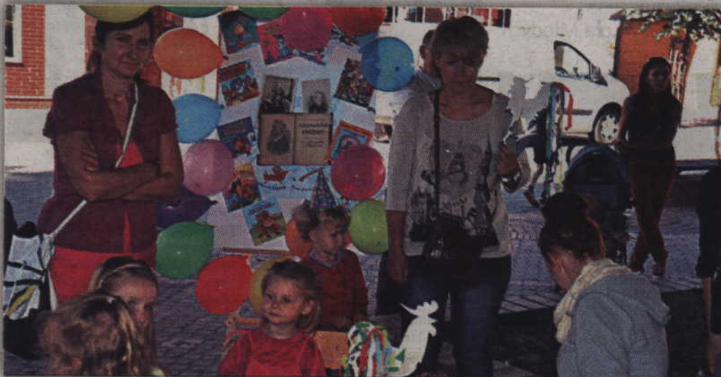
Był czas na czytanie i był czas na zabawę.

którego do udziału w Narodowym Czytaniu zachęciła nauczycielka twierdzi, że utwory Fredry należą do jego ulubionych: