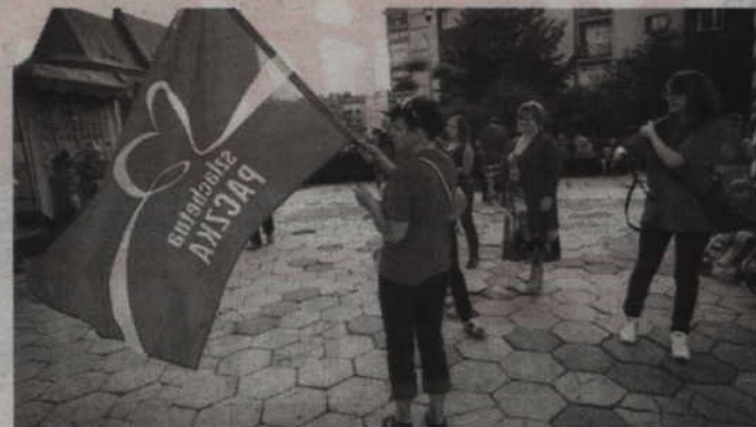
W Kwidzynie potrzebnych jest 20 wolontariuszy projektu "Szlachetna Paczka".

Ważne jest, żeby informacje zostały wpisane w taki sposób, aby osoby chcące pomóc zainteresowały się losem potrzebujących. Później, podczas finału wolontariusz razem z kierowcą zawozi paczkę do rodziny, a następnie przygotowuje informację zwrotną