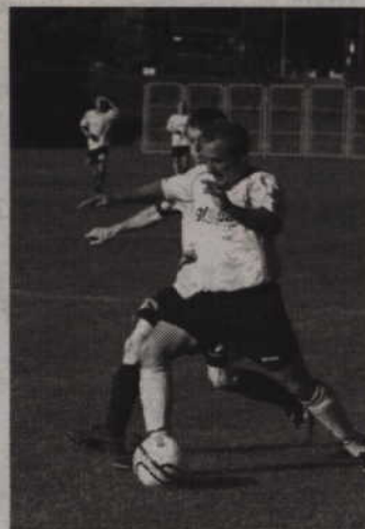
Zwycięstwo w Malborku było trzecim zwycięstwem Rodła II Global Kwidzyn.

nad Rodłem Kwidzyn - 2:1 i Relaksem Ryjewo - 6:1, tym razem sprawdzi się w konfrontacji ze sztumską drużyną. Mecz odbędzie się w środę - 18 września o godz. 16.30 na boisku w Sadlinkach. (fox)