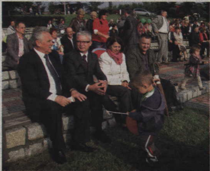
Na dożynki do Gardei przyjechał również senator Leszek Czarnobaj.