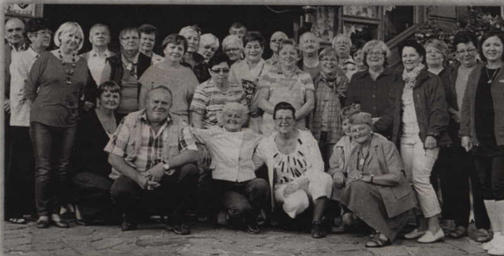
Pamiątkowe zdjęcie uczestników wrześniowej pielgrzymki.