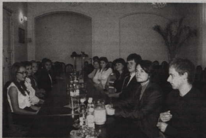
Dziewięciu uczniów oraz tegorocznych absolwentów szkół ponadgimnazjalnych otrzymało stypendia naukowe, sportowe i artystyczne.

Stypendium przyznawane jest w kwocie od 150 do 250 zł miesięcznie, w okresie dziewięciu miesięcy, od września do czerwca. Stypendium za wybitne wyniki w nauce przysługuje uczniom i absolwentom, którzy między innymi są laureatami wojewódzkich konkursów, olimpiad lub finalistami ogólnopolskich konkursów, olimpiad i posiadają co najmniej dobrą ocenę ze sprawowania i średnią ocenę co najmniej 4,75. Stypendium za wybitne osiągnięcia sportowe przyznawane jest między innymi za zajęcie miejsca od pierwszego do szóstego w ogólnopolskich zawodach mistrzowskich lub wygranych eliminacjach wojewódzkich. Osoba starająca się o przyznanie tego stypendium musi posiadać co najmniej dobrą ocenę z zachowania i średnią ocen co najmniej 3,5. (jk)