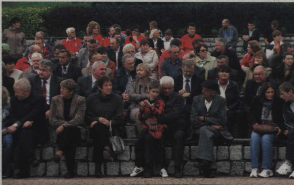
Tegoroczne dożynki powiatowe odbyły się w Gardei, w amfiteatrze nad Jeziorem Kamień.