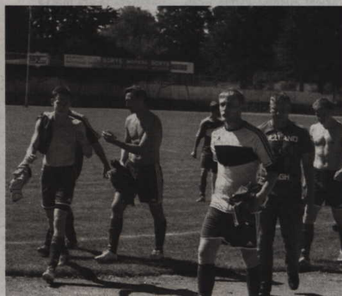
Piłkarze Rodła Kwidzyn rozbili Pogoń Prabuty wygrywając 6:1.