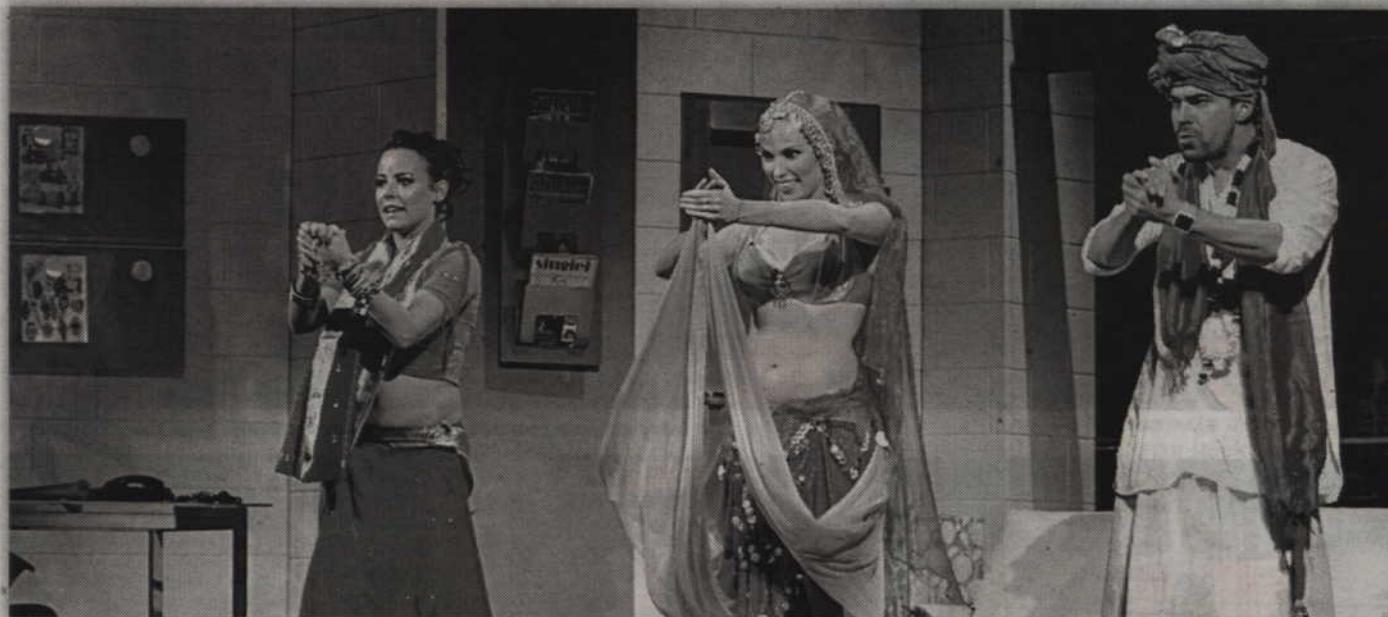
Spektakl "Single i remiksy" już w najbliższą niedzielę w kwidzyńskim teatrze.