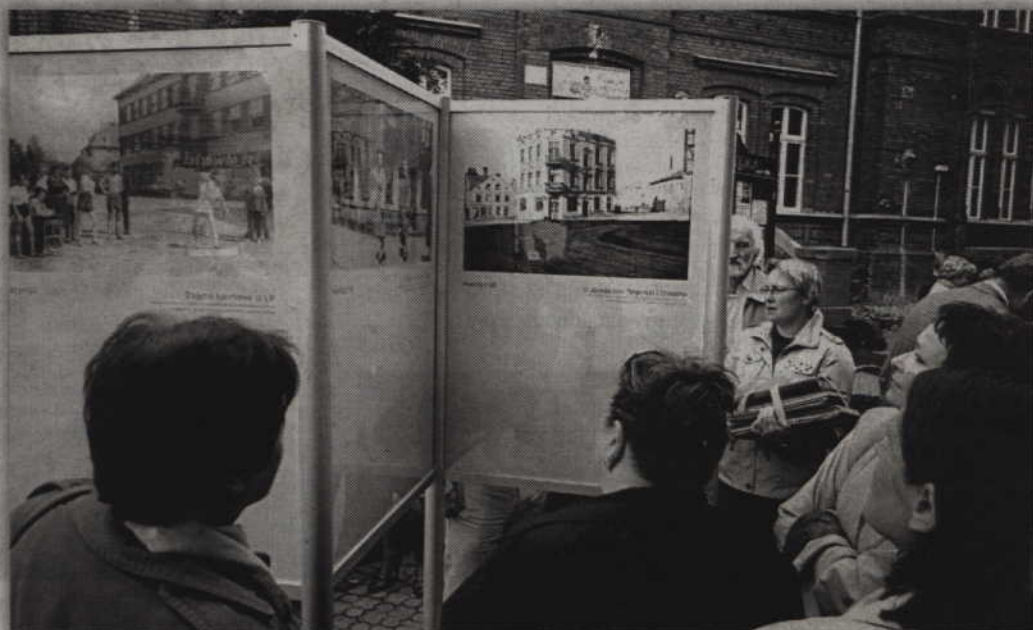
Na wystawie oglądać można zdjęcia przedstawiające Kwidzyn z lat 50.