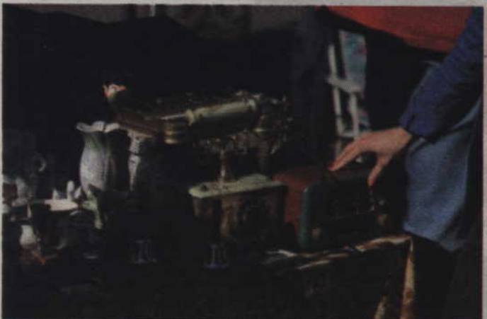
Inni skupili swoją uwagę na nietypowych sprzętach...