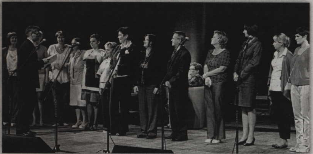
Podczas uroczystości na scenie pojawili się wszyscy pracownicy jubilatki.