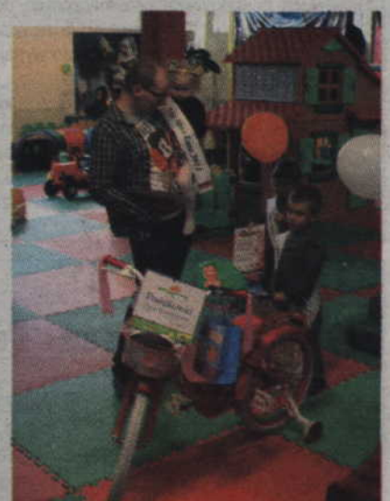
Rower, który wygrała nasza Mała Miss, będzie jeszcze musiał trochę na nią poczekać.