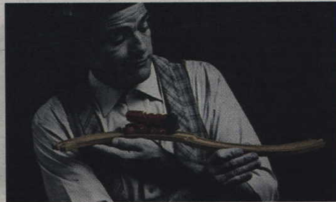
Festiwal rozpocznie spektakl Teatru Oskar „Proszę wsiadać, drzwi zamykać”.

Jak podkreślają organizatorzy Animo to pionierski festiwal walczący o równość w dostępie do dóbr kultury dla niewielkich ośrodków miejskich, który nie chce dopuścić do wyludnienia kulturalnego, izolacji, a przede wszystkim braku tożsamości kulturowej. Przeciwdziała zapóźnieniu kulturowemu oraz podziału na kulturę małych miast i dużych metropolii. Jak podkreślają jego organizatorzy jest to nieprovincjonalne wydarzenie na prowincji, organizowane na wysokim poziomie artystycznym.