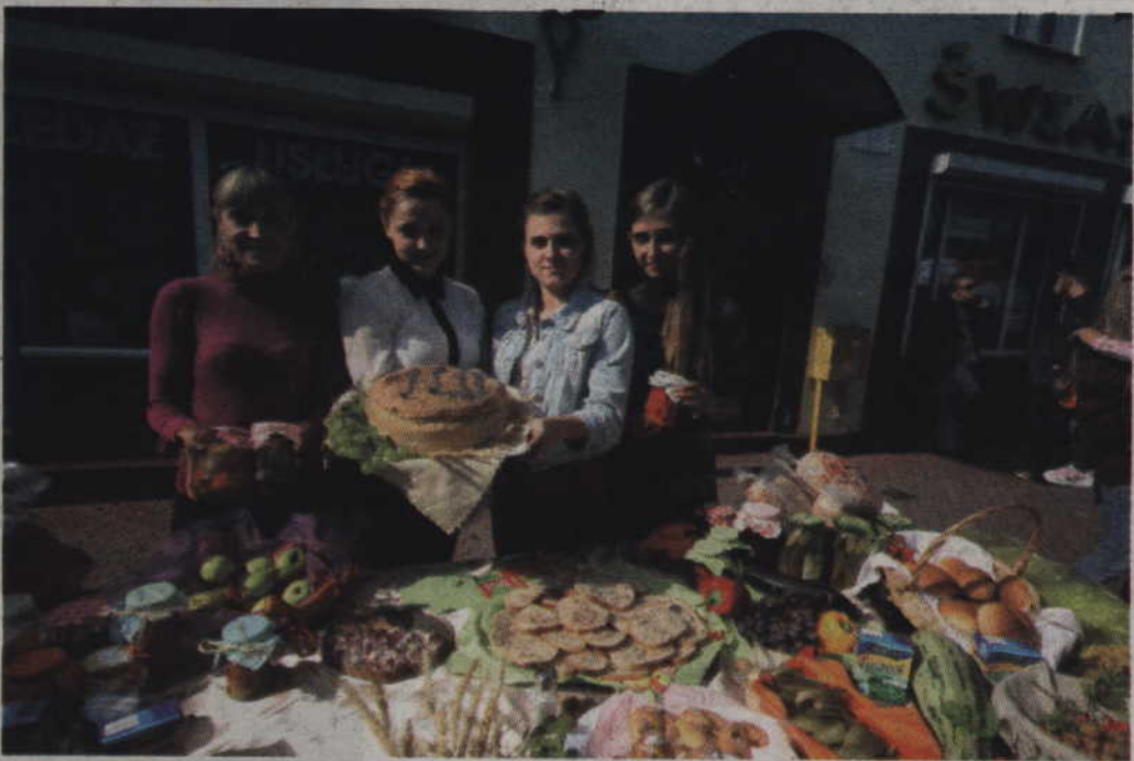
Szkolne Koło Wolontariatu z I LO w Kwidzynie prezentuje wyroby oferowane na swoim stoisku.