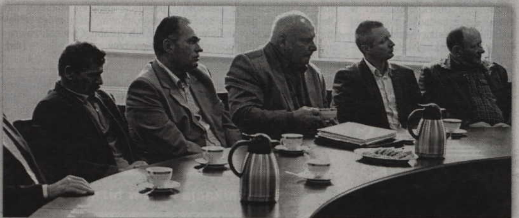
Rolnicy z powiatu kwidzyńskiego podczas spotkania z Leszkiem Millerem.