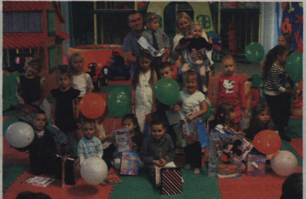
Nasz plebiscyt na Małą Miss i Mistera Lata 2013 podsumowaliśmy w Centrum Twórczej Zabawy „Gama”.

Tradycyjnie dziękujemy naszym Czytelnikom za ogromne zaangażowanie, tysiące wysłanych sms-ów i kuponów i do zobaczenia za rok.