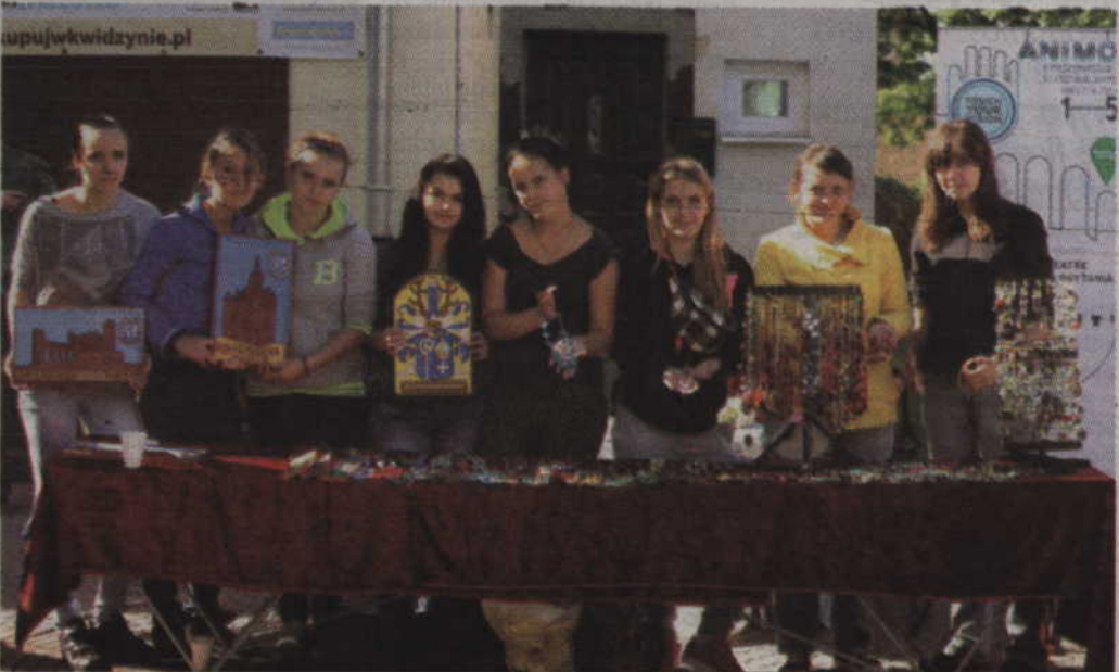
Na festynie nie mogło zabraknąć również wolontariuszy z Młodzieżowego Ośrodka Wychowawczego.