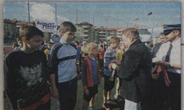
W grupie młodszej zwyciężył zespół FC Korczaka.