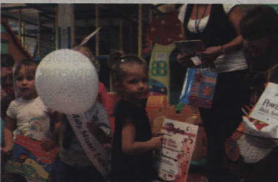
Która kamera mnie bierze...