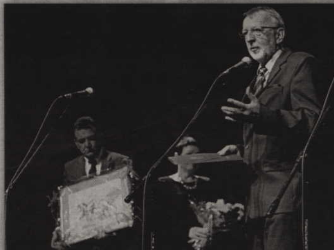
- Nowy budynek biblioteki będzie prawdziwą perełką – obiecywał burmistrz Andrzej Krzysztofiak.