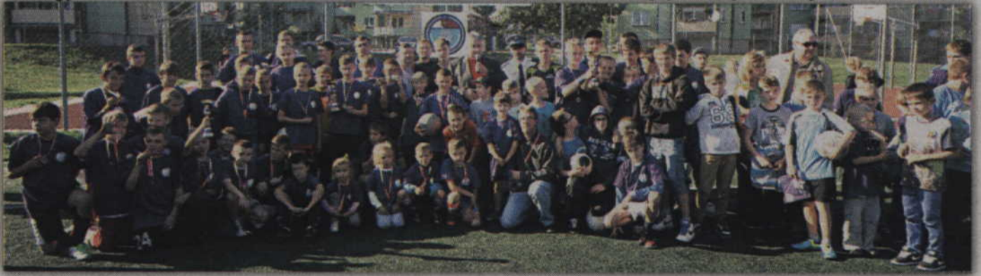
Wspólna fotografia uczestników tegorocznego turnieju.