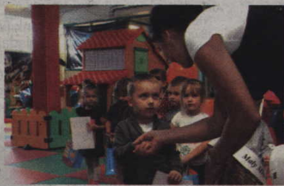
Panowie byli bardzo poważni podczas odbierania dyplomów.