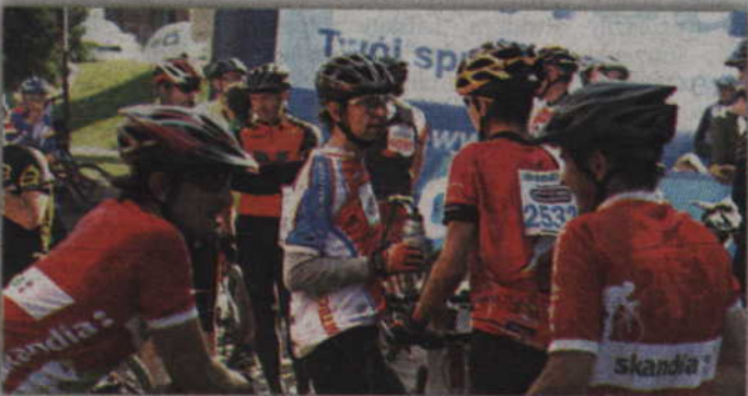
Zawody Skandia Maraton Lang Team odbędą się w Kwizdynie po raz czwarty.

-Już tradycją stało się to, że finał Skandia Maraton Lang Team odbywa się właśnie w Kwizdynie. Każdego roku pojawia się tu coraz więcej kolarzy - to z pewnością zasługa doskonałej atmosfery, panującej w stolicy Powiśla - mówi Czesław Lang, Dyrektor Generalny Skandia Maraton Lang Team. Jak zawsze na uczestników za-