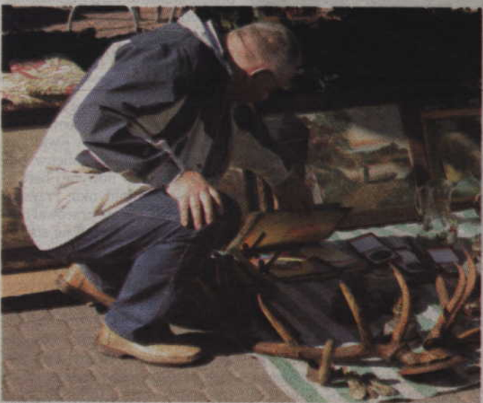
...lub też płytach analogowych.