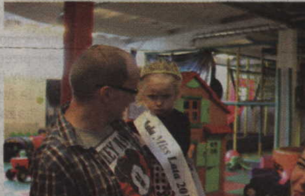
Ola najlepiej czuła się w ramionach taty.