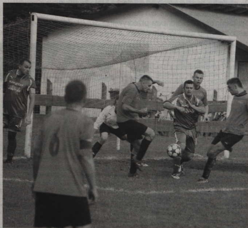
Piłkarze Wisły wybijają piłkę po zamieszaniu w swoim polu karnym.