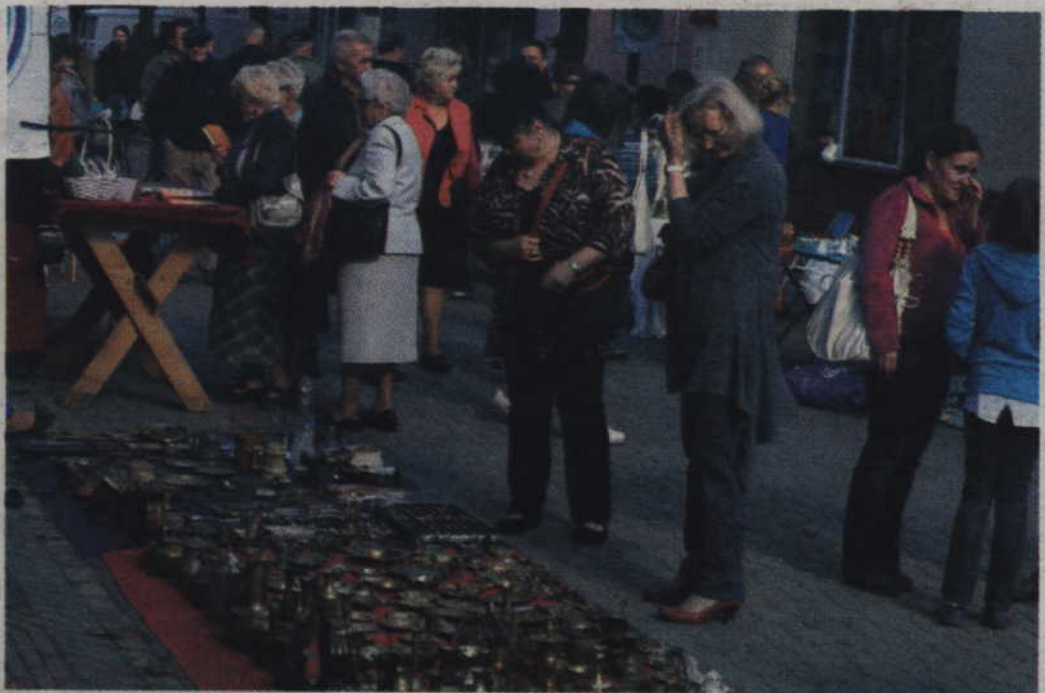
Na stoiskach targów staroci można było kupić dosłownie wszystko.