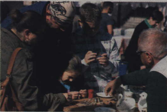
Niektórych zaintrygowała wystawiona biżuteria oraz porcelana.